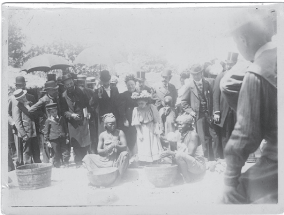
Abb. 8 Szene auf der Exposition nationale et coloniale de Rouen , [1896], fond 1V/255-e, ark. 32.