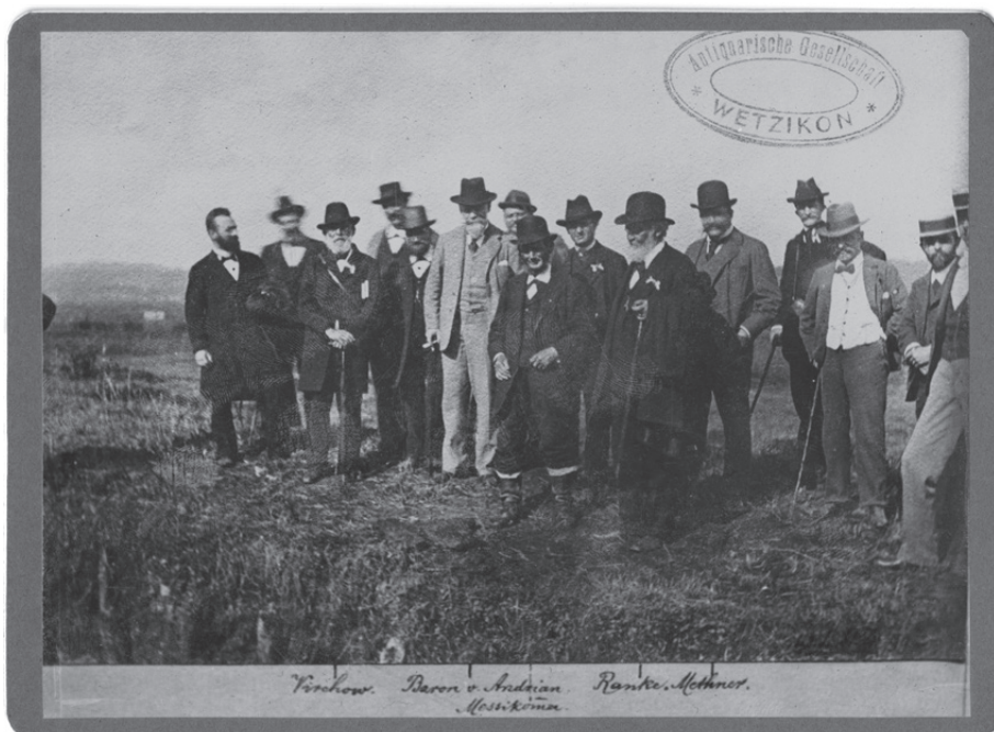
Abb. 2 Gruppenfoto bei einer Fundstelle von Pfahlbauten in Robenhausen (Kanton Zürich, Schweiz), u. a. mit Rudolf Virchow (3. v. l.) und Fedir Vovk (6. v. l.), gestempelt „Antiquarische Gesellschaft Wetzikon“, 8. September 1899 13 , fond 1V/396, ark. 29, © NA IA NANU.