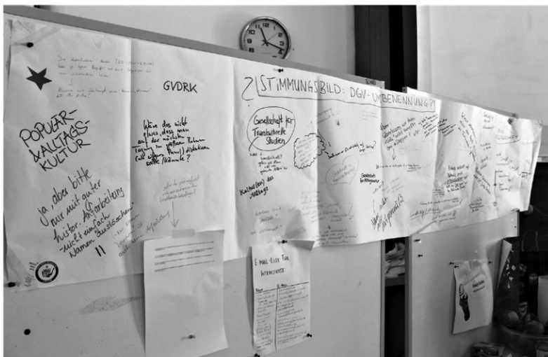
Abb. 1: Forderungen des Resolutionspapiers, Aufnahme: Maren Sacherer.