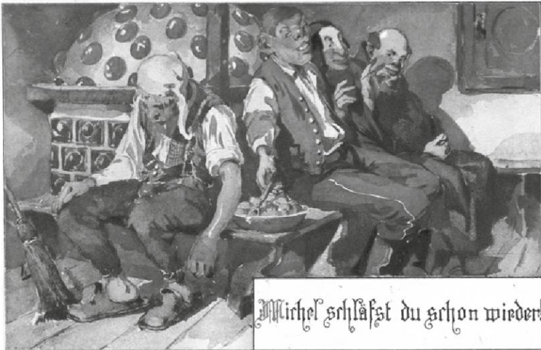
Abb. 1:

Arbeit völlig erschöpft auf der Ofenbank eingeschlafen ist. Neben ihm haben ein Tscheche, ein Jude und ein Mönch Platz genommen, sie sind dabei, ihm heimlich seine wohlverdiente Mahlzeit zu stehlen. Antislawismus, Antisemitismus und Antiklerikalismus sind damit in einer einzigen Bildbotschaft zusammengefasst. Fremdenfeindlichkeit war im Übrigen auch in dem zuletzt genannten Feindbild enthalten, denn der Kampf gegen den vorgeblich von Rom ferngesteuerten katholischen Klerus mischte sich mit einer Abwehrhaltung gegenüber dem italienischen Bevölkerungsteil in Südtirol und im Trentino. 11 Die älteste und auf das gesamte Territorium des Habsburgerreiches bezogen zugleich wichtigste Konfliktkonstellation dieser Art betraf zweifellos das Königreich Ungarn und die Magyaren, die nach den Deutschen die zweitgrößte Sprachgruppe des Reiches ausmachten, im Karpatenraum über eine knappe Mehrheit verfügten und nach der Niederschlagung ihres Freiheitskampfes von 1848/49 die Hoffnung auf ein größeres Maß an Selbständigkeit niemals aufgegeben