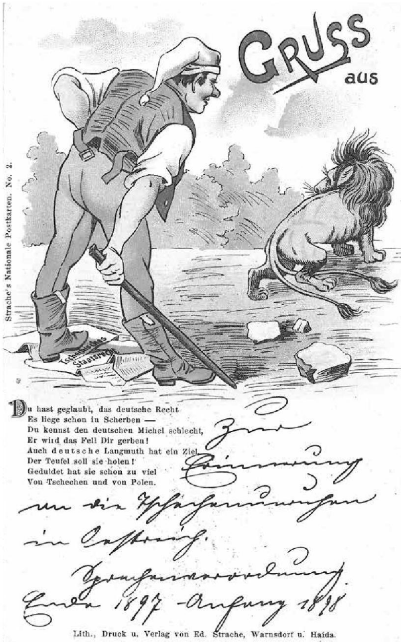
Abb. 5: