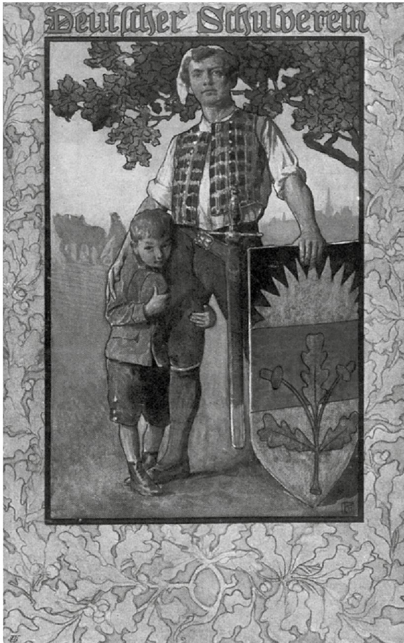
Abb. 4: