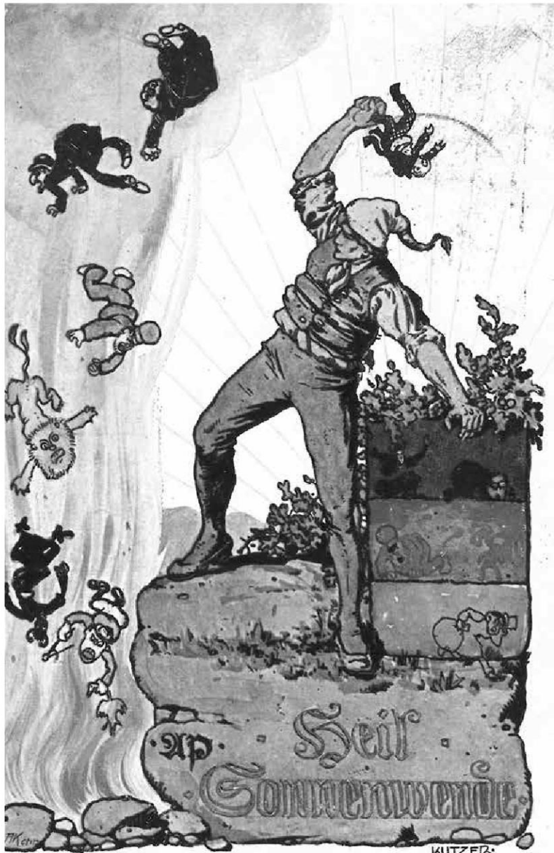
Abb. 6: