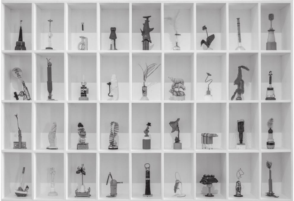
Abb. 2: Sascha Mikel, Skulpturen aus dem Werkzyklus Détournement , seit 2016 Collagen aus gefundenen Objekten