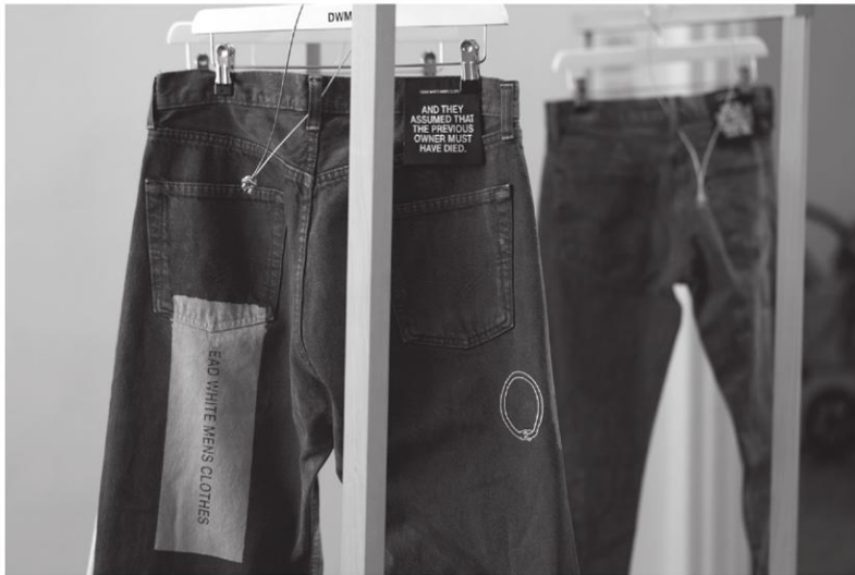
Abb. 4: Jojo Gronostay, DWMC , seit 2017 Installation