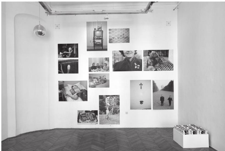
Abb. 5: Orthochrome – Archiv für analoge Alltagsfotografie, Dinge/Things , 2021 Poster und Booklet