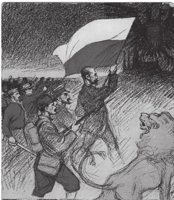
Čestmír Svoboda: PROF. MASARYK V ČELE ČESKÝCH ŠIKŮ.

L ET' vzhůru, prapore náš rudě svěží! jak Spartané v svém rudém bitev kroji pod tebou Cechové ať s mečem v ruce stojí — ty veď nás, k předu let' a vrahy osln, sežžij! Let' vzhůru, prapore náš mléčně bílý, Přemyslův orle plný vzdušné síly — pod tebou květ se rozloží krásou tklivý: jak bílý bůh to národ spravedlivý!