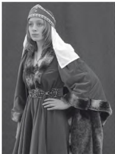
Abb. 5 Gewandung »Edelfrau«, Preis: 399 €. Anbieter: www.drachenhort.com (letzter Aufruf: 9.3.2009)