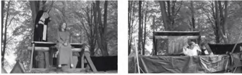
Abb. 3 und 4 »Hexen« vor und nach dem Tauchgang ( http://www.das-hexenbad.ccx.de , Fotos: Mai 2007)

Diese Form der populären Geschichtsklitterung verweist exemplarisch auf den Eventcharakter vieler der heutigen Mittelalterveranstaltungen: Hier geht es primär um Unterhaltung durch Spektakuläres in historischer Gewandung, um »historical entertainment« oder neudeutsch »histotainment«. Das Gros der Besucher, die die angeblichen Hexen eigenhändig zur Wasserprobe schicken, hat vermutlich wenig Kenntnisse über die realhistorischen Hexenverfolgungen und stört sich daher nicht an diesen Diskrepanzen. So gehören »Hexen« im Rheinland mit seinen zahlreichen Burgen und Schlössern schon lange zum mittelalterlichen Frühjahrsfreizeitangebot: Auf Burg Satzvey bei Mechernich z.B. finden seit Jahren der traditionelle Hexenmarkt mit Walpurgisnacht und mehrtägige Ritterspiele im Frühjahr und im Herbst 6 , auf Schloss Burg bei Solingen um den 1. Mai ein Walpurgismarkt (früher Hexentanz am 1. Mai) sowie an zwei langen Mai-Wochenenden Ritterspiele statt. 7