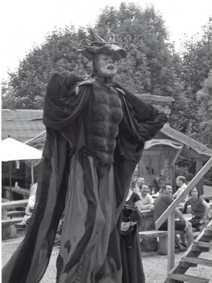
Abb. 8 Gaukler auf dem Mittelaltermarkt Burg Hexenagger 2006