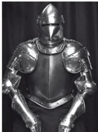
Abb. 6 Ritterrüstung, Nachbildung. Anbieter: Die Ritterschmiede, Kunst- und Schmiedehandwerk ( www.wikingerschmiede.de )