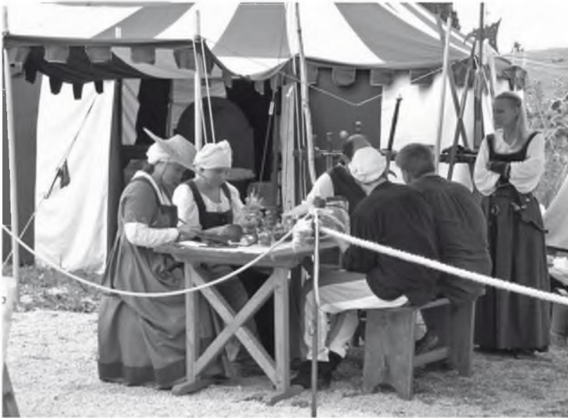
Abb. 11 Lagerleben. Darstellergruppe auf dem Mittelaltermarkt Burg Hexenagger 2006