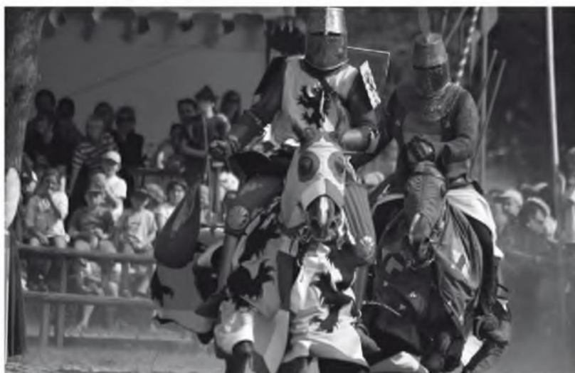
Abb. 10 Ritterturnier ( http://www.aventure-medieval.de/Images/Vorlagen/Ritter.jpg , letzter Aufruf: 9.3.2009).