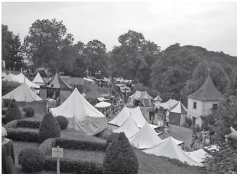
Abb. 1 Mittelaltermarkt auf Burg Hexenagger/Bayern, 21.–23. Juli 2006