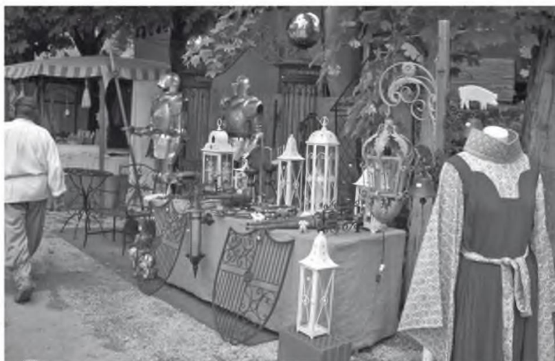
Abb. 7 Stand auf dem Mittelaltermarkt Burg Hexenagger 2006