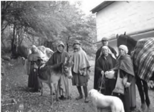
Abb. 12 Ein hoher Anspruch auf Authentizität: Die Darstellergruppe Diu Minnezit