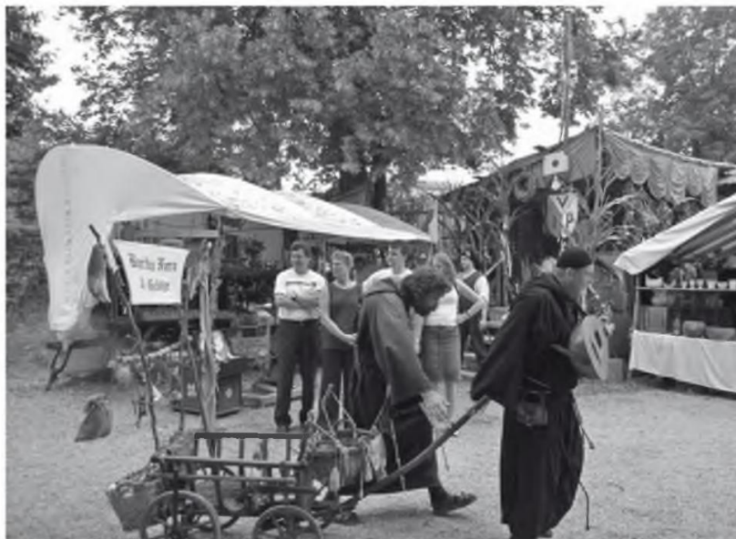
Abb. 9 Darsteller auf dem Mittelaltermarkt Burg Hexenagger 2006