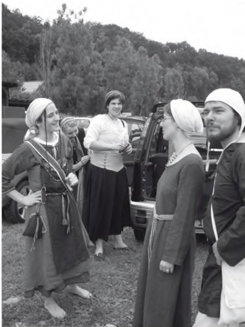
Abb. 13 Bamberger Studenten der Europäischen Ethnologie auf Exkursion: Mittelaltermarkt Burg Hexenagger 2006