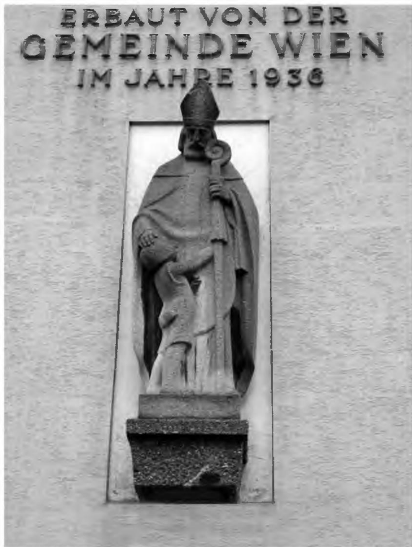
Abb. 1 Statue des Hl. Engelbert an einer Wohnhausanlage, Wien 15