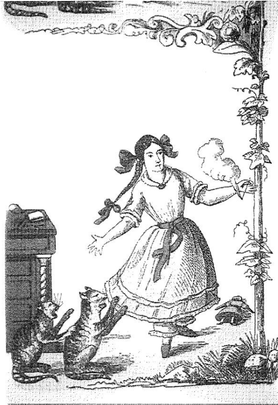
Abb. 2: Aus: Heinrich Hoffmann: Der Struwwelpeter oder lustige Geschichten und drollige Bilder. Berlin, Rütten & Loehning, 1998, 543. Aufl.

Ob der bitterböse Friederich zerstörerisch um sich haut und tritt; ob der Zappel-Philipp heftig auf dem Stuhl schaukelt (Abb. 1); ob das Paulinchen zündelnd umherspringt (Abb. 2); ob Hans Guck-in-die-Luft hochgereckten Kopfs durch die Straßen stürmt: jedesmal muß schrecklich büßen, wer mit seinen Kräften nicht haushält, wer seinem Bewegungsdrang nutzlos und zwanglos freien Lauf läßt.