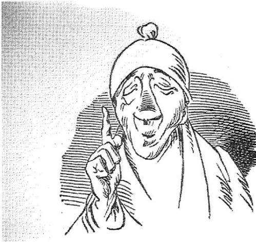
Abb. 3: Aus: Wilhelm Busch: Sämtliche Bildergeschichten. Hrsg. von Rolf Hochhuth, Gütersloh, Prisma Verlag, o.J., Die Fromme Helene: Onkel Nolte.

beim Spaziergehn auf der Gassen von Mama sich führen lassen.