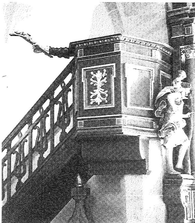
Abb. 1: Kanzel in der Pfarrkirche Assach, Bez. Liezen, mit „Petrinerkreuz“, spätes 18. Jahrhundert