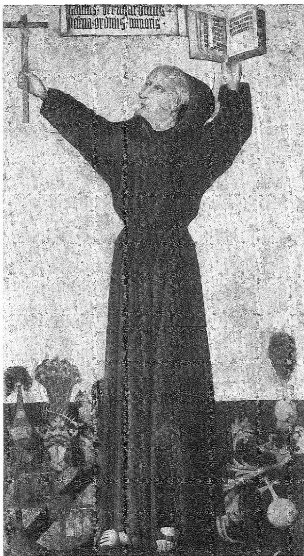
Abb. 3: Bernhardin von Siena. Öl auf Holz, Dekanatskirche Köflach, um 1470