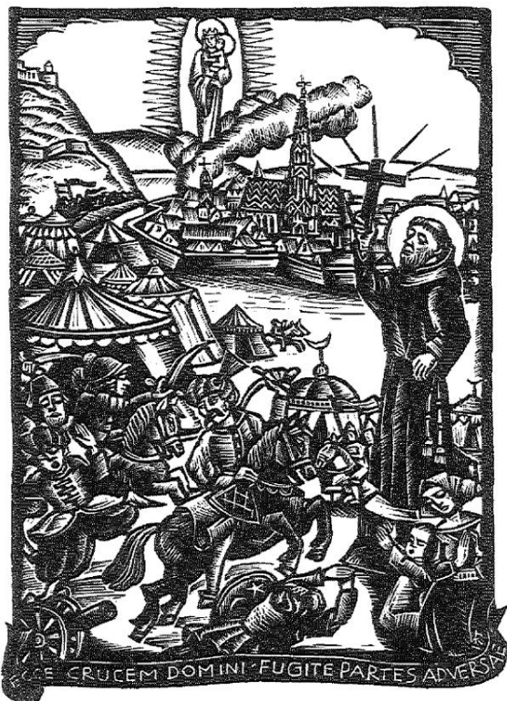
Abb. 4: Markus von Aviano als Prediger in der Türkenschlacht um Wien 1683 Holzschnitt von Rose Reinhold, Wien, um 1935

Das Kreuz in der Hand des Predigers hat also sicher zur Ausbildung der Kanzelkreuze beigetragen und Vorbildwirkung für die erst im Barock an den katholischen Kanzeln sich ausbildenden Kruzifixe gehabt. Aber, und das darf nicht übersehen werden, es sind diese Kanzelkruzifixe, allerdings ohne Predigerarm, durchaus nicht nur auf den Ostalpenraum beschränkt. Wir finden sie in gar nicht so geringer Zahl auch in Westfalen, etwa in der ehemaligen Franziskanerkirche zu Geseke, in der ehemaligen Kapuzinerkirche zu Brakel, in der Alten Kirche zu Warstein und in der Pfarrkirche zu Fürstenberg – um nur