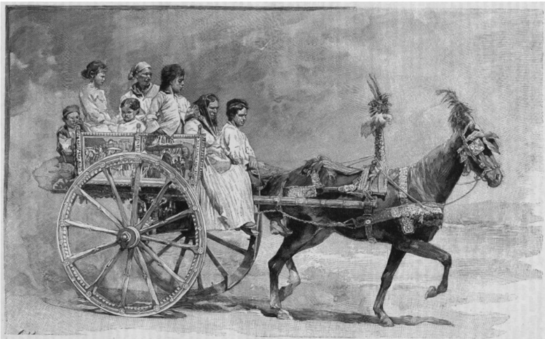
Abb. 1: Gaston Vuillier, Le traitement de l'érysipèle . In: Le Tour du monde. Journal des voyages et des voyageurs. Nouvelle série 43 (5), 1899, S. 507.