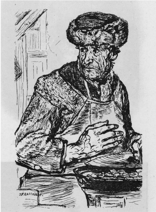
Abb. 3: Jean-François Raffaëlli, Le marchand de marrons. In: Joris-Karl Huysmans: Croquis parisiens. Paris 1880, o. S. Bibliothèque nationale de France, département Réserve des livres rares, RES 8-LI3-751 (B)

Sébillots Wertung des literarisch-journalistischen Bildmaterials als relevante Quelle für ikonografische Betrachtungen ist mit dieser zeitgleichen Verankerung in Publizistik, Folklore-Forschung und Anthropologie zu erklären.