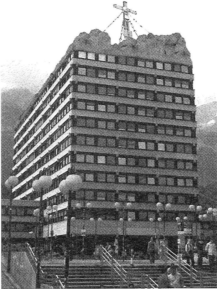
Abb. 2: „Vermessung und Vermessenheit“. Plakatmotiv zu einem Gastvortrag von Martin Scharfe am 19. Oktober 2005. Auf der von Andreas Blaickner gestalteten Fotomontage ist das Dachgeschoß des Innsbrucker ‚Geiwi-Turmes‘, wo sich das ehemalige Institut für Europäische Ethnologie/Volkskunde befindet, durch ein Bergmassiv mit Gipfelkreuz ersetzt. – Der darunter stehende Ankündigungstext lautete: „Messen ist ein zentraler Modus der Moderne – und zugleich, wenn vom Messen Heil erwartet wird, ihr vielleicht bedeutendster Wahn. An Beispielen aus der Frühgeschichte des Alpinismus wird untersucht, wie das Vermessen in die neuere Fortschrittsgeschichte der Menschheit eingebunden ist und zur zweiten Natur wird – möglicherweise (nämlich als Bestandteil der Gewissensstruktur) sogar Zwang, sodaß der kulturelle Gewinn, der ohne Zweifel aus dem Messen entspringt, in Leiden umschlägt, dem nur mehr mit Ironie begegnet werden kann.“