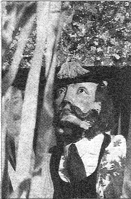
Fasnachtsbräuche sind (ein kleiner) Teil der Forschungen des Institutes für Volkskunde