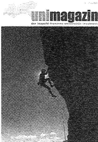
Abb. 1: Unimagazin der LFU Innsbruck, Nr. 1., August 2005. Die seither monatlich erscheinende Publikation wird vom ‚Büro für Öffentlichkeitsarbeit und Kulturservice‘ der LFU Innsbruck herausgegeben und redaktionell betreut.

tet. 23 Eine Fortführung der eigenständigen Studienrichtung Europäische Ethnologie sah er weder auf Bakkalaureats- noch auf Magisterebene vor; 24 und zur Zukunft des Instituts enthielt er nur die (missverständliche und zugleich verständliche) Forderung nach der Errichtung eines „Instituts für Geschichte und Ethnologie“. 25