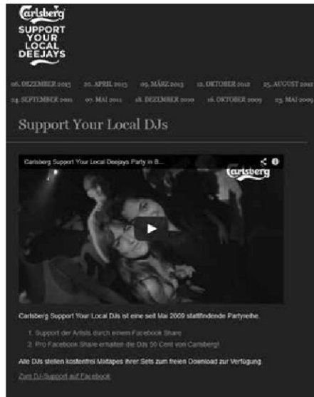
Abb. 3: Carlsberg-Kampagne ( http://supportyourlocaldjs.de/ , Zugriff: 10.3.2015)

Es ist bemerkenswert, wie konkret und einfach das Supporten in dieser Kampagne definiert wird: Als BesucherIn bzw. Fan teilt man die Veranstaltungsankündigung bei Facebook; dafür bekommen die »local Deejays« dann unmittelbar Geld von der Brauerei überwiesen, »Supporter« wiederum erhalten Zugang zu »freien Downloads«. Hier wird Support also von einem komplexen sozialen Prozess, in dem man sich in einer Szene und auf ihren Bühnen verortet, auf das Anklicken von Werbung heruntergebrochen. Indem sie das Ethos des Supports bemühen und ihrer PR-Logik gemäß nutzen, nehmen Akteure wie Carlsberg damit eine sehr starke Vereinfachung und Formalisierung eines vielschichtigen sozialen Zusammenhangs, hier des Supporter-Supportee-Verhältnisses innerhalb subkultureller Szenen, vor. Der Support wird dabei als eine Folge von klar definierten (Waren-)Tauschhandlungen repräsentiert, in der alle Beteiligten »ihren Teil« leisten: Die Fans geben den DJs (und unter der Hand auch Carlsberg) ihre Aufmerksamkeit und machen dadurch Werbung, sie erhalten dafür Zugang zur Party und zur Musik. Die DJs geben die Nutzungsrechte ihrer Musik und erhalten Aufmerksamkeit (von Fans) und Geld (von Carlsberg, gewissermaßen im Auftrag