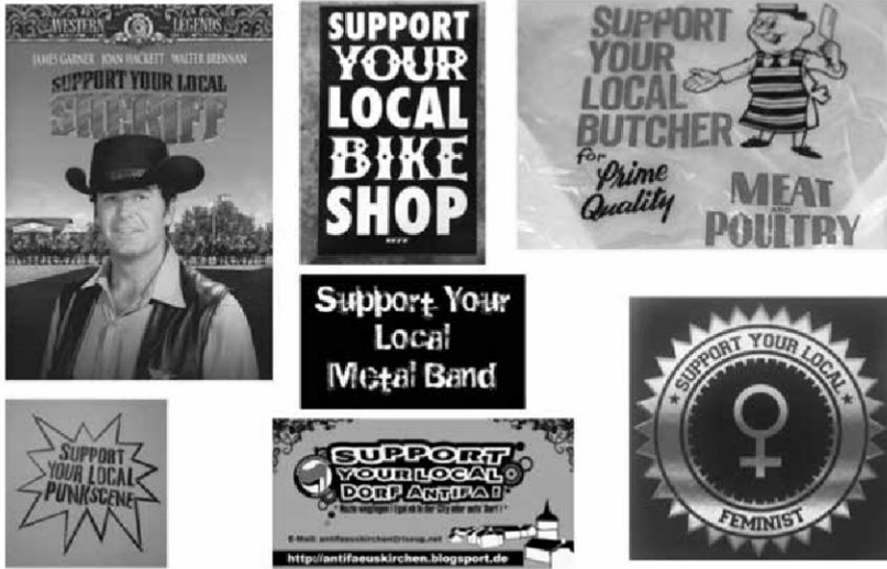
Abb. 1: »Support your local ...« – Einige Fundstücke (von links oben: http://www.imdb.com/title/tt0065051/ ; http://letourneau41.ecrater.com/p/19309896/support-your-local-bike-shop ; https://www.flickr.com/photos/wurz/5393656247/ ; http://www.zazzle.com/support_your_local_metal_band_rectangle_sticker-217394236688296203 ; http://handamsack.soup.io/post/137405530/Support-your-local-Punk-Scene ; http://antifaefel.blogspot.de/images/machmitantifa.jpg ; https://pbs.twimg.com/profile_images/455296146312015872/csSrQuQf.jpeg , Zugriff: 10.3.2015)

Szenen herstellen zu wollen, weil die Implikationen an dieser Stelle eher vage bleiben. Der Support-Begriff kann an dieser Stelle auch eine ideologische Funktion erfüllen, nämlich das Verdecken von Hierarchien und ökonomischem Kalkül, die zumindest den egalitären Idealen einiger Szenen, wie der Punk/Hardcore und DIY-Welt, widersprechen können.