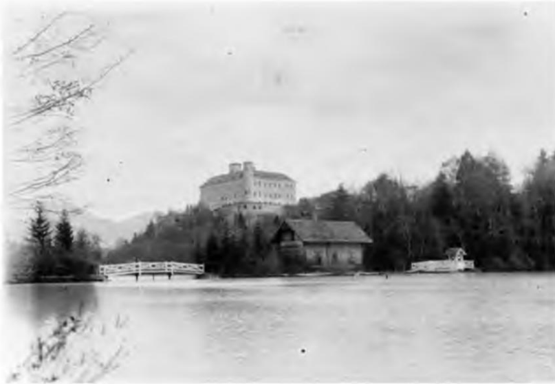
Abb. 1 Schloss Trautenfels mit Fischeichen und Hütte, 1. Viertel des 20. Jahrhunderts

Verwaltung der Liegenschaft. 2 Er spielte bei den Verhandlungen zum Verkauf des Schlosses eine wesentliche Rolle.