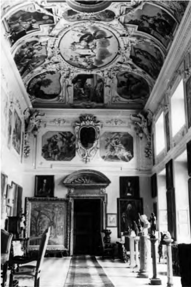
Abb. 2 Schloss Trautenfels, Marmorsaal mit dem Bild von Franz Courtens, um 1940