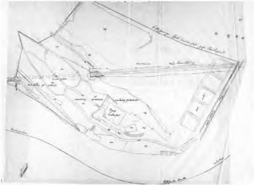
Abb. 3 Plan der Deutschen Reichsbahn zu einer Streckenführung nördlich des Schlosses, Bundesarchiv R 4701/14215

trag bereits unterschrieben war. Die Reichsbahndirektion Linz teilte dem Reichspostministerium in einem Schreiben am 26. März 1941 mit, dass sie »für die Errichtung des neuen Bahndammes und Umlegung der Strasse, Teilflächen im Gesamtausmaß von ungefähr 10.000 m 2 « benötige. 37 Der Quadratmeter Fläche werde mit dem ortsüblichen Preis von 40 Pfennigen bezahlt (also insgesamt 4.000 RM).