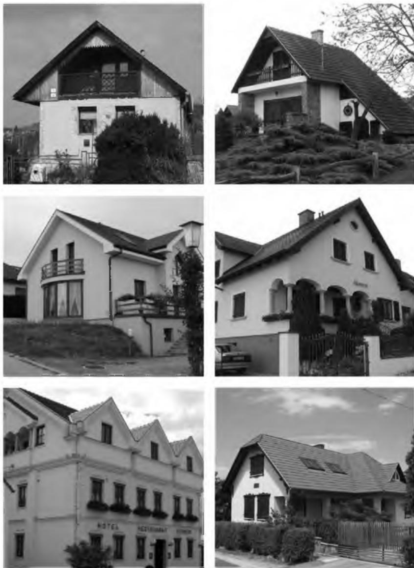
Abb. 14–19 (oben 14 und 15, Mitte 16 und 17, unten 18 und 19)