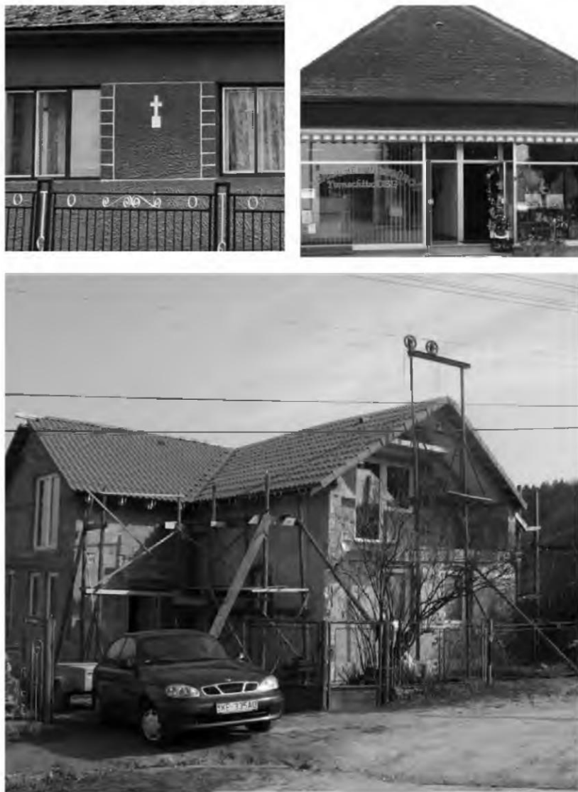
Abb. 20–22 (oben 20 und 21, unten 22)