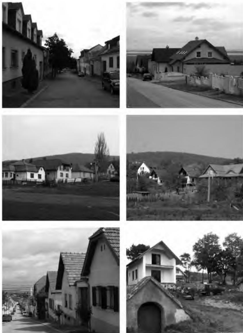
Abb. 8–13 (oben 8 und 9, Mitte 10 und 11, unten 12 und 13)