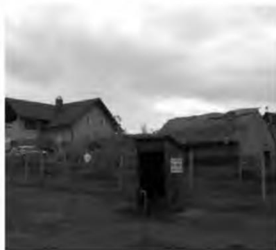
Abb. 4–7 (oben 4 und 6, unten 5 und 7)