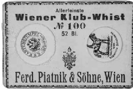
Abb.15: Whistkarten in Originalverpackung, ÖMV/85.533