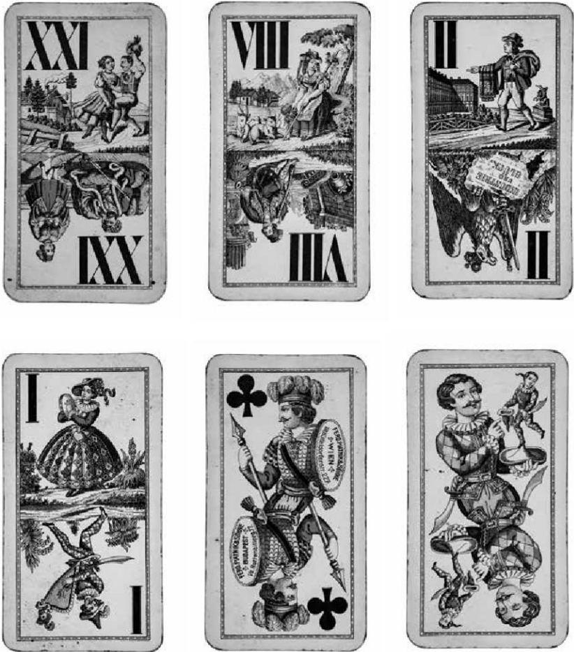
Abb. 1-6: Industrie-und-Glück-Tarock ÖMV/87,529