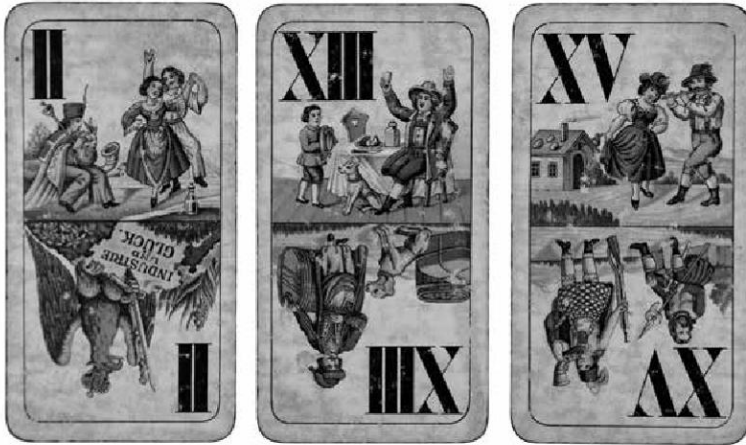
Abb.12: Ladies Tarock, ÖMV/75.849