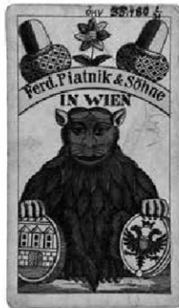
Abb. 13: Prager Bild, ÖMV/35.480