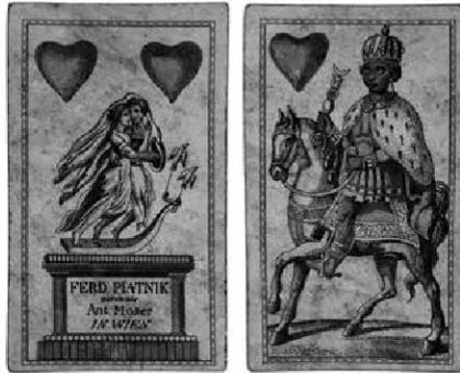
Abb.12: Lemberger Bild, ÖMV/50.558