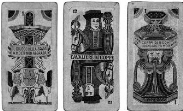
Abb. 10: Triester Bild, ÖMV/27.187