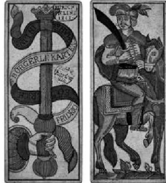
Abb. 8: Trappola, ÖMV/46.194