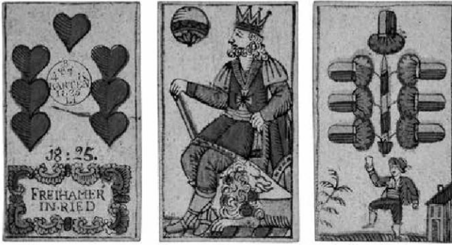
Abb.14: Spiel mit deutschen Farben, ÖMV/40.174