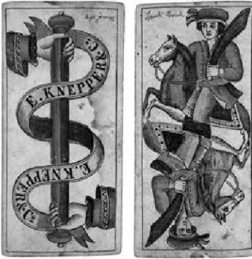
Abb. 7: Trappola, ÖMV/25