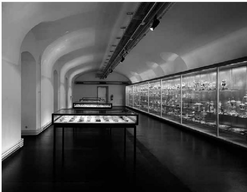
Abb. 1: Studiensammlung Metall im MAK, 1993–2013.