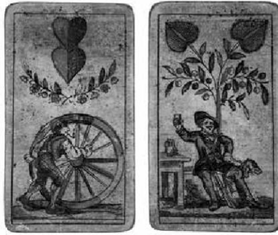
Abb. 11: Linzer Bild, ÖMV/316