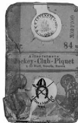
Abb. 16: Piquetkarten, ÖMV/74.430