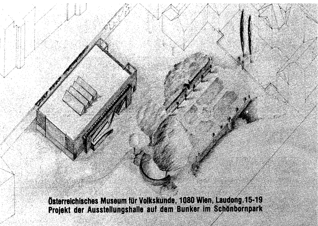
Österreichisches Museum für Volkskunde, 1080 Wien, Laudong. 15-19 Projekt der Ausstellungshalle auf dem Bunker im Schönbornpark

Ich bin an der Arbeit des Vereins und des Österreichischen Museums für Volkskunde in Wien interessiert und bitte um Zusendung von Informationsmaterial (bitte ankreuzen): ja