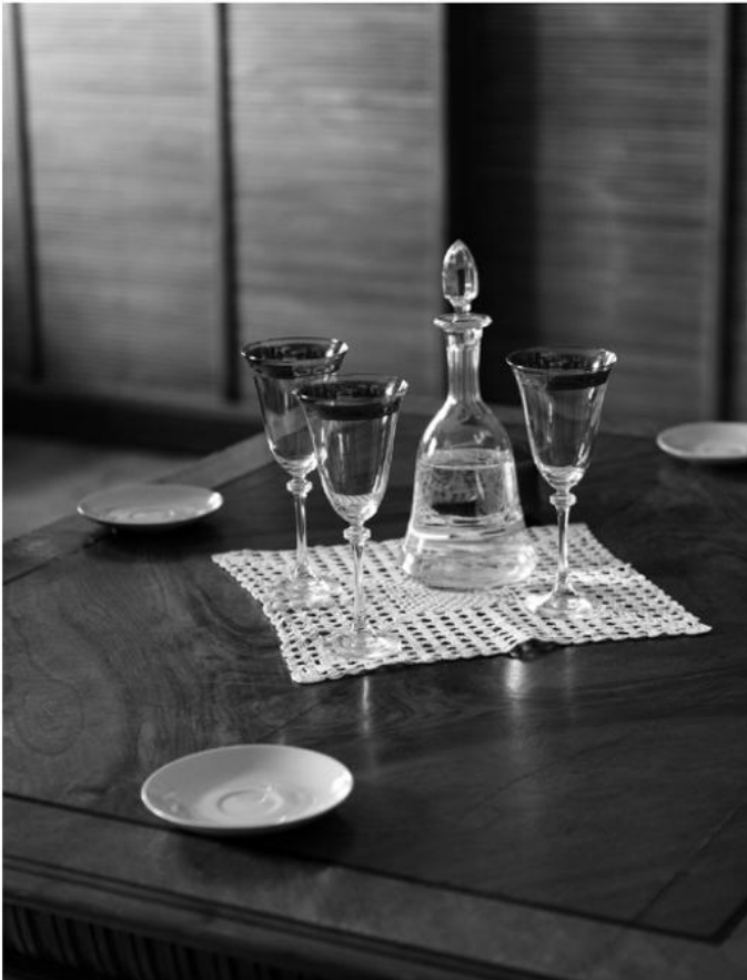
Sharing Water, Králíky (CZ), 2019