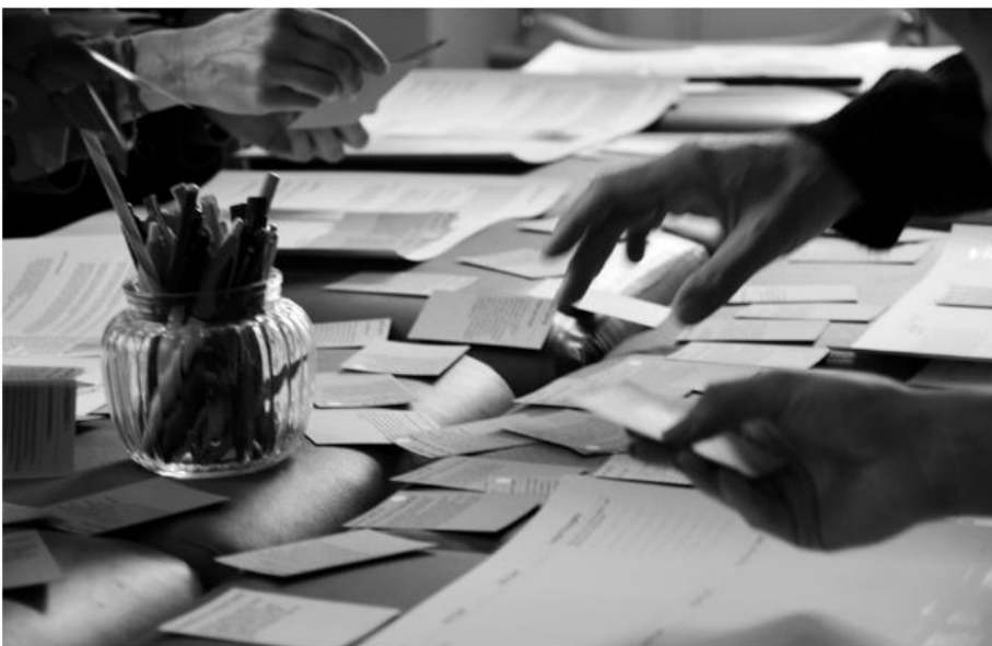
Workshop Wasser Teilen, Foto: Luke Kopf

Projektteam Volkskundemuseum Wien: Magdalena Puchberger, Katrin Prankl, Lena Nothdurfter, Gesine Stern www.volkskundemuseum.at/wasserteilen www.sharing-water.net/workshops www.onebodyofwater.net