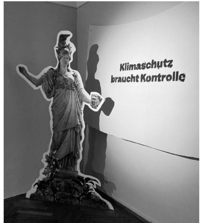
Klimaschutz braucht Kontrolle. Kampagne Klimarechnungshof Jetzt!

Versuchten wir zunächst, innerhalb der Kampagne das Forschungsdesign nicht anzusprechen, da wir fürchteten, andere ‚reale‘ politische Kampagnen zu unterminieren und das geschlossene Bild zu brechen, wurde