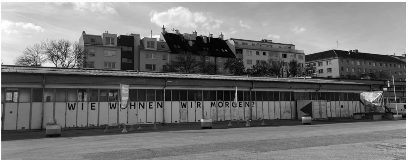
Die benachbarte Halle wartet auf eine weitere Bespielung, nachdem hier 2022 die IBA_Wien stattfand.