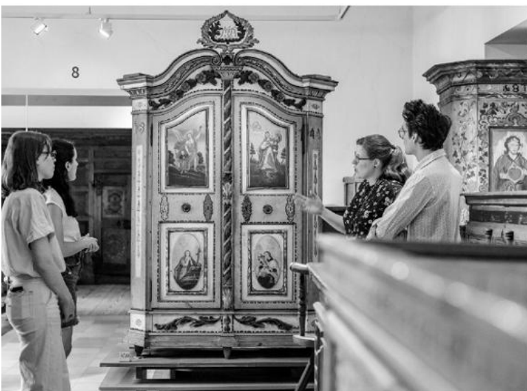
Kurzführungen durch die Schausammlung.