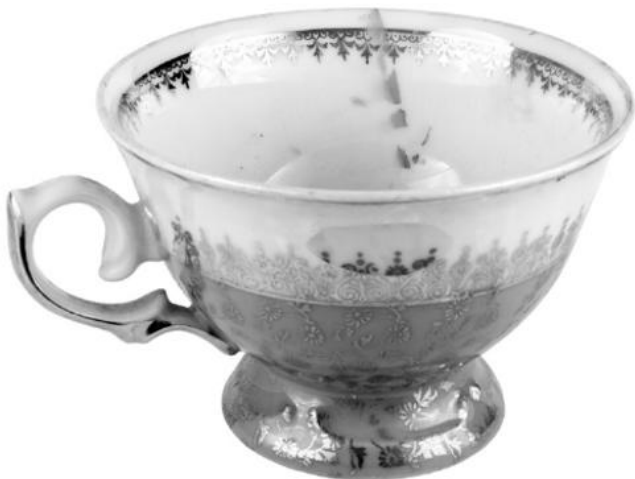
Tasse und Sturmlampe, die während der Besetzung der Hainburger Au 1984 verwendet wurden. Leihgeberin: Annemarie Höferle, Fotos: Christa Knott

Fotos, Filme und kurze Texte ergänzen die Hörstationen und vermitteln so historischen Kontext. Die inhaltlichen Stationen umfassen prägende Ereignisse wie die Kraftwerksverhinderungen von Zwentendorf und Hainburg, Aktionen von Umweltschützer*innen gegen