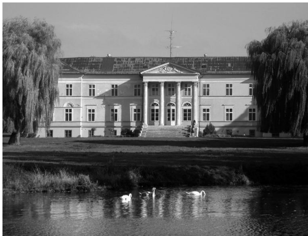
Schloss Dolná Krupá Innenraum vor dem Umbau und Außenansicht.

— Internationale Konferenz am 15. und 16.11.2022 im Kongresszentrum der Slowakischen Akademie der Wissenschaften, Schloss Smolenice, Bezirk Trnava, Slowakei. Im Rahmen von TREASURES. Schätze aus Zentraleuropa. Kultur, Natur, Musik im EU-Förderprogramm INTERREG V-A Slowakei-Österreich 2014–2020.