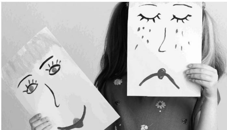
Wegschauen – Hinschauen – Reinschauen.