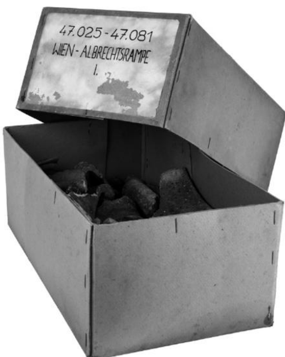
Konvolut Scherben, Frühe Neuzeit ÖMV/47.025-47.081