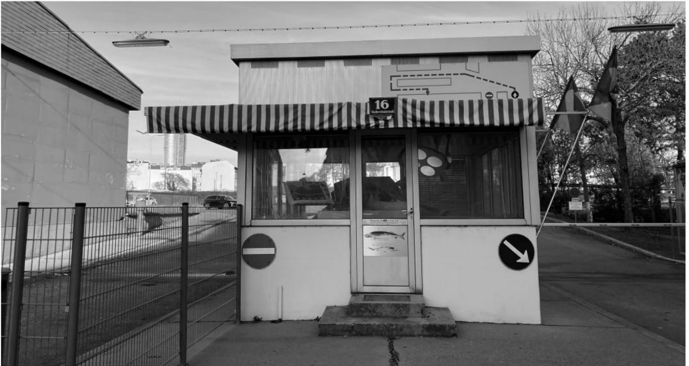
Der Kiosk und Eingang zum noch bestehenden Areal des Nordwestbahnhofs. Im Inneren des Kiosks befindet sich ein mögliches Maskottchen des Areals, gestaltet von Tracing Spacecs.

Autowerkstätten, Bastler, eine Fahrschule. 2024 wird abgerissen, voraussichtlich bis zu „unserer“ Halle. Diese soll erst einmal stehen bleiben.