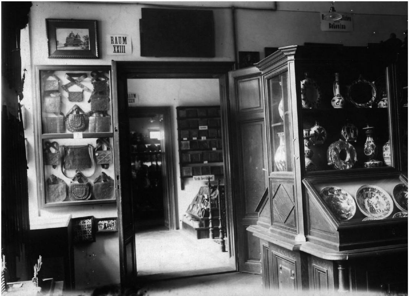
Schausammlung in den 1920er Jahren: Raum XXIII – „Huzulen-Raum“. Pos/5469

Schausammlung 1994/95 – 100 Jahre Verein und Österreichisches Museum für Volkskunde gaben den Anlass.