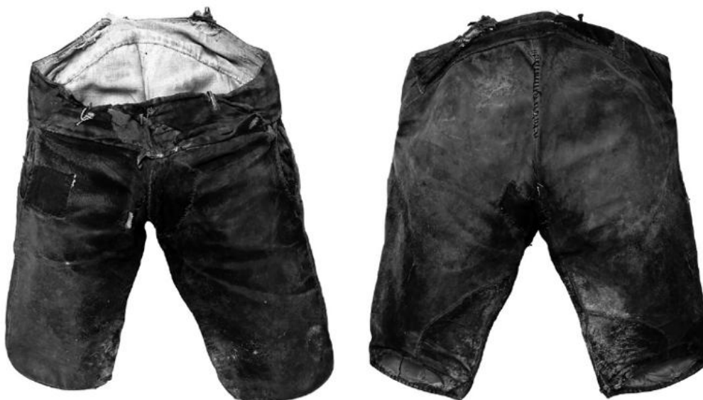
Lederhose eines Ziegenhirten, 19. Jh., ÖMV/2288

Das Volkskundemuseum Wien ist mit sieben Objektbiographien und drei audiovisuellen Geschichten, umgesetzt von dem Wiener Filmemacher Mike Kren, an der Online Plattform sowie mit einer Leihgabe an der Ausstellung in Brüssel vertreten. Die Objekte, die im Zeitraum zwischen 1896 und 2022 in die Sammlungen eingegangen sind, zeigen