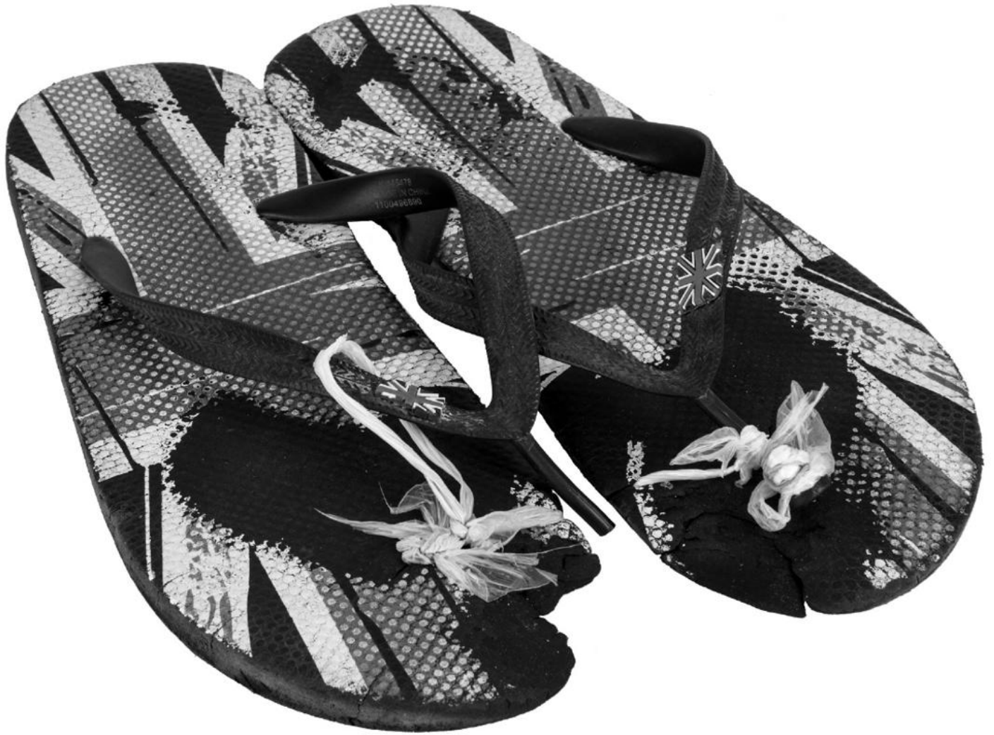
Notdürftig reparierte Sandalen. Verschiedene Kunststoffe. Wien 2018. Courtesy: Ramin Siawash. Foto: Christa Knott