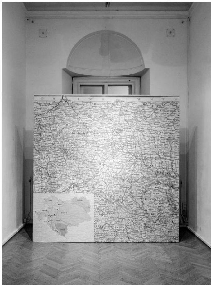
Ausstellungsansicht Ölrausch und Huzulenkult . Foto: Kollektiv Fischka / Kramar