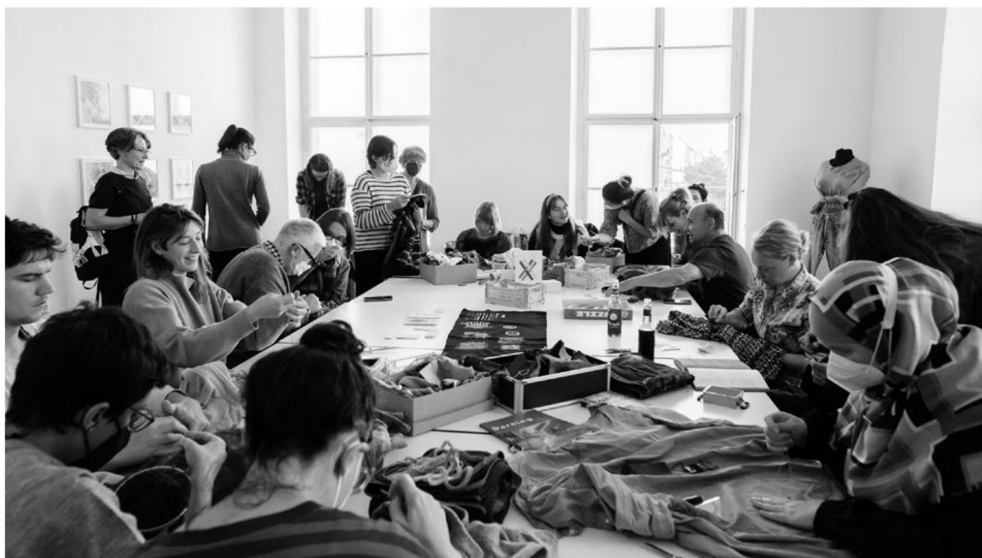
Workshop Visible Mending . Foto: Kollektiv Fischka / Kramar

Im Rahmen der Ausstellung Gesammelt um jeden Preis!