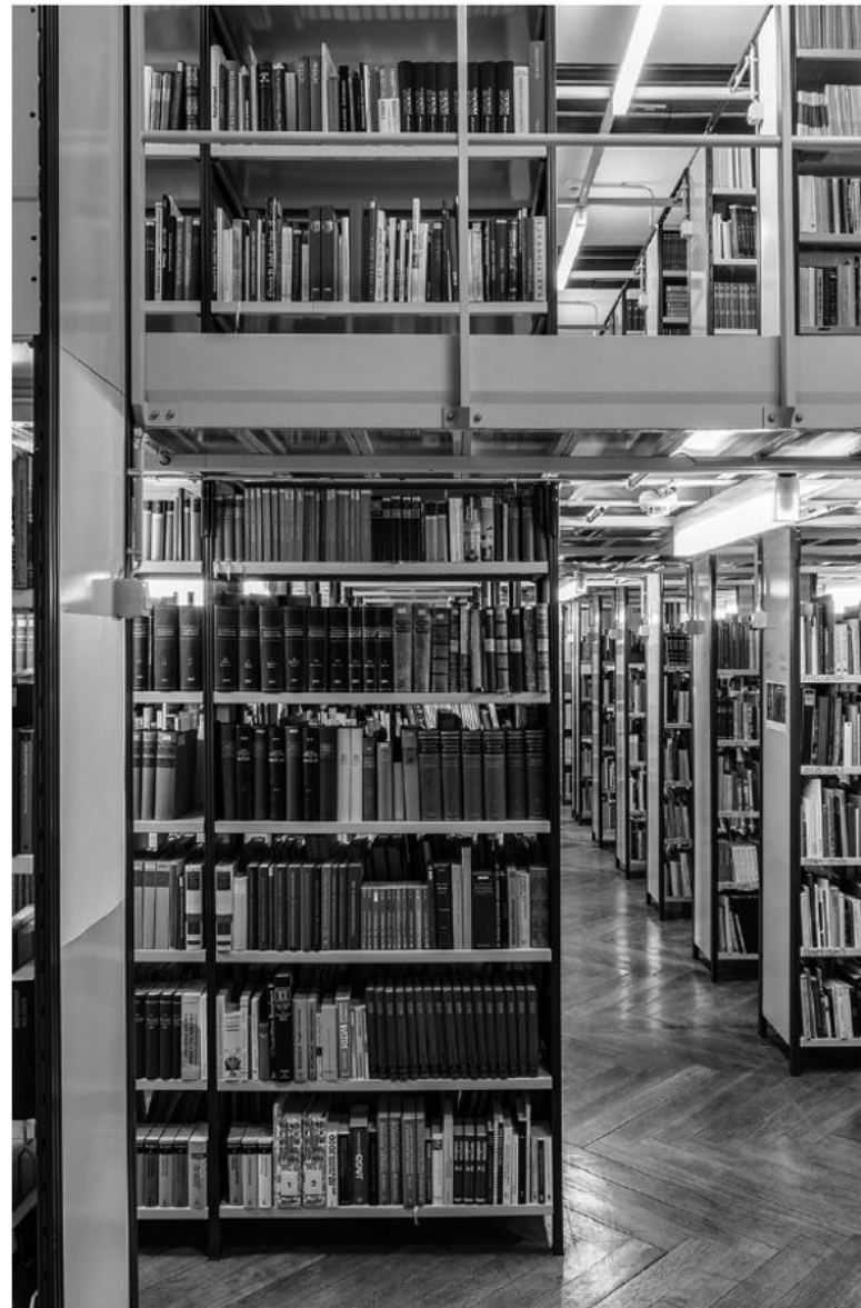
Bibliothek, Foto: Matthias Klos

Weitere Informationen zum Projekt: www.volkskundemuseum.at/vkmw21digital . www.volkskundemuseum.at/onlinepublikationen