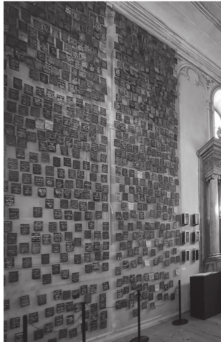
Vereinsausflug nach Eisenstadt.

Ein Rundgang durch das jüdische Museum bot einen übersichtlichen Einblick in die