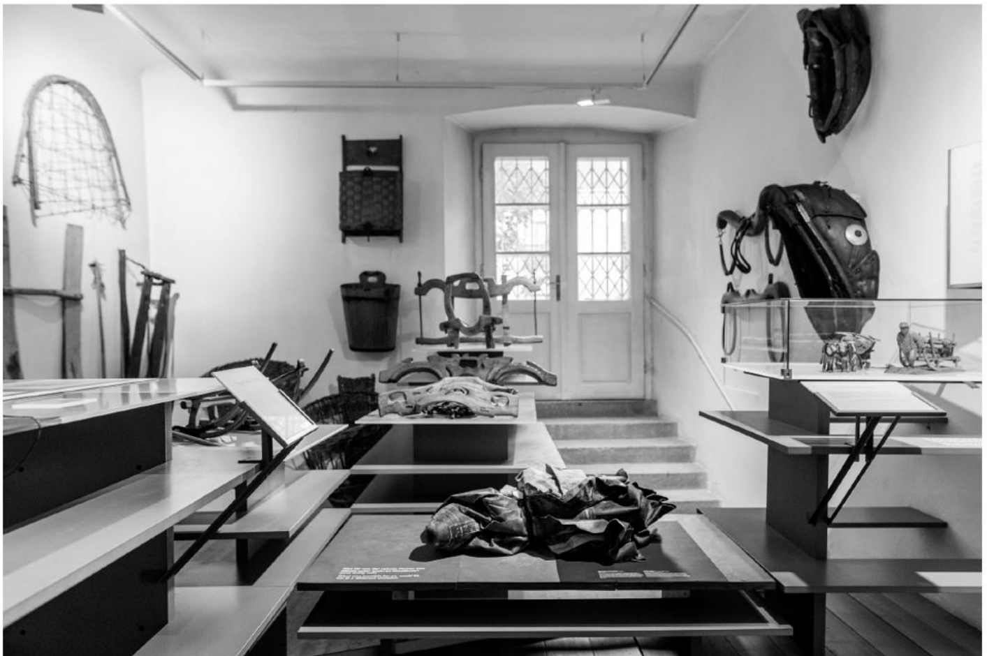
Schausammlung von 1994 bis 2023 und Die Küsten Österreichs (ab 2018).