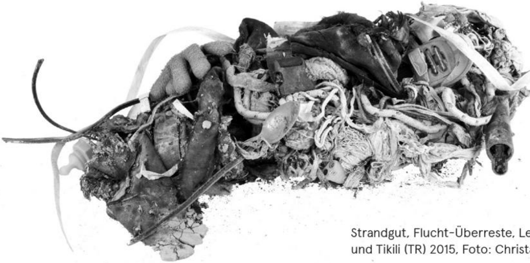
Strandgut, Flucht-Überreste, Lesvos (GR) und Tikili (TR) 2015, Foto: Christa Knott

vergangene wie aktuelle Sammlungs- und Themenschwerpunkte: Von den historischen Dimensionen rund um Sammlungen, Sammler*innen und volkskundlichem Kanon, bis hin zu aktuellen Themen wie Migration und Flucht oder europäische Terrorerfahrungen. Zwei Objekte widmen sich allgemeinen musealen Themen, die rund um die Frage „Müll oder Museum“ kreisen.