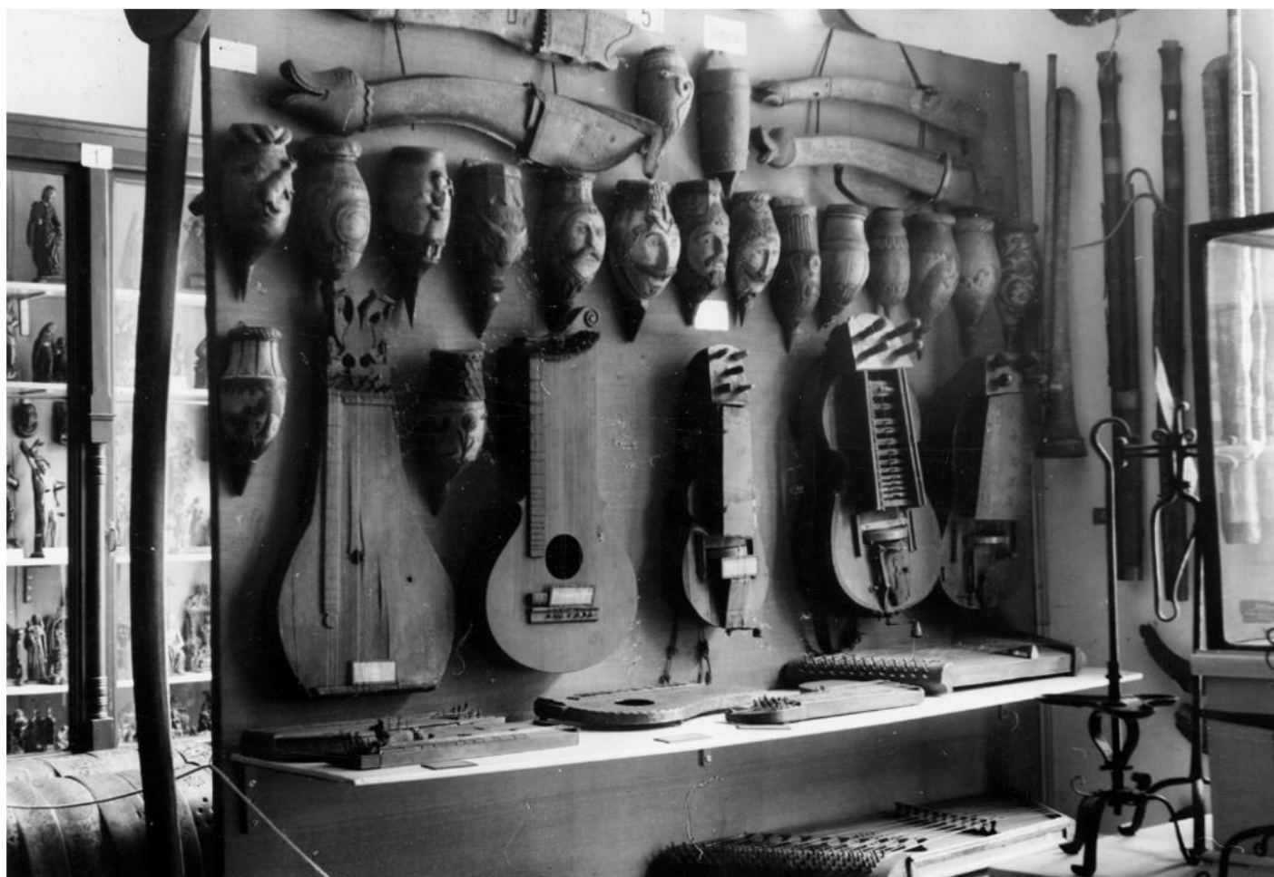
Musikinstrumente, Wetzsteinkumpfe und Sensenscheiden in der Schausammlung 1938. Pos/13.155

Margot Schindler: In der Fachwelt ist die Neue Schausammlung interessiert und positiv aufgenommen worden. Für die restlichen Besucher*innen war es anfangs eher schwierig sie so anzunehmen. Auch ältere Kolleg*innen und Vereinsmitglieder waren teilweise über die Aufbereitung und Präsentation empört, da sie sich nicht ganz