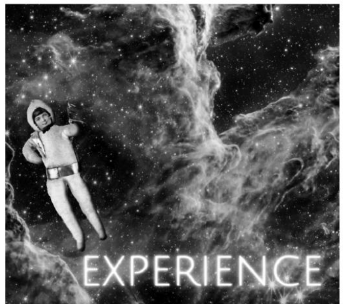
Astro-Watte in Aktion, Filmstill: Mike Kren

Museum: Das Volkskundemuseum Wien wird vom Verein für Volkskunde getragen. Als Mitglied unterstützen Sie nachhaltig die Arbeit des Museums, haben an der Mitgestaltung des Museums teil und erhalten Vorteile bei Veranstaltungen und anderen Formaten.