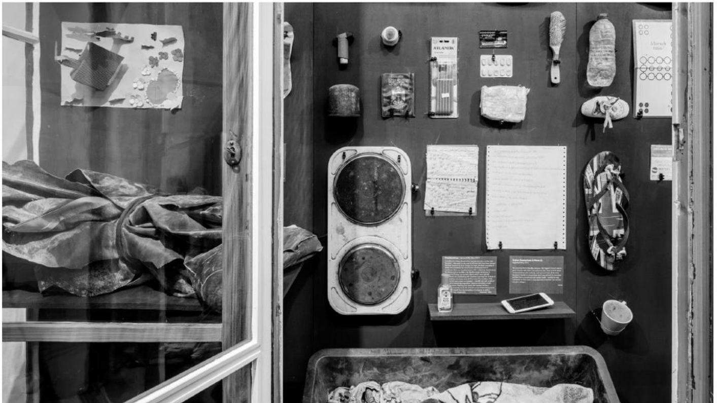
Vitrine mit Objekten zu Die Küsten Österreichs .