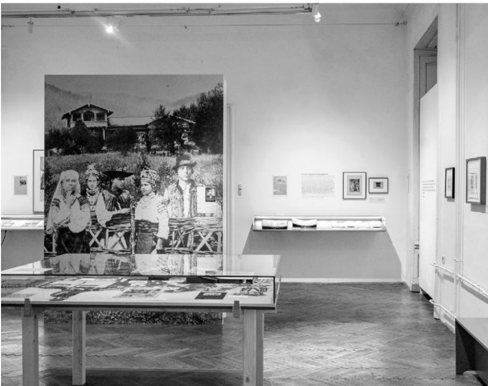
Ausstellungsansicht Ölrausch und Huzulenkult .

In der Ausstellung sind die Stimmen von Aktivist*innen hörbar, die sich damals und heute für die Umwelt einsetzten und auf unterschiedliche Art und Weise versuchen, diese zu schützen. Was sind ihre Beweggründe und wie hängen die Themen Umweltschutz und Demokratie zusammen? Die Schüler*innen lernen auf Basis kulturwissenschaftlicher Interviewanalyse, genau hinzuhören und zu verstehen, wie Prozesse rund um die Protestkultur funktionieren. Warum finden die Aktivist*innen es wichtig, sich für den