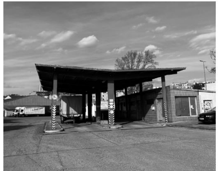
Die ehemalige Tankstelle am Areal des Nordwestbahnhofs ist bereits im Fokus von Tracing Spaces für eine neue Nutzung.