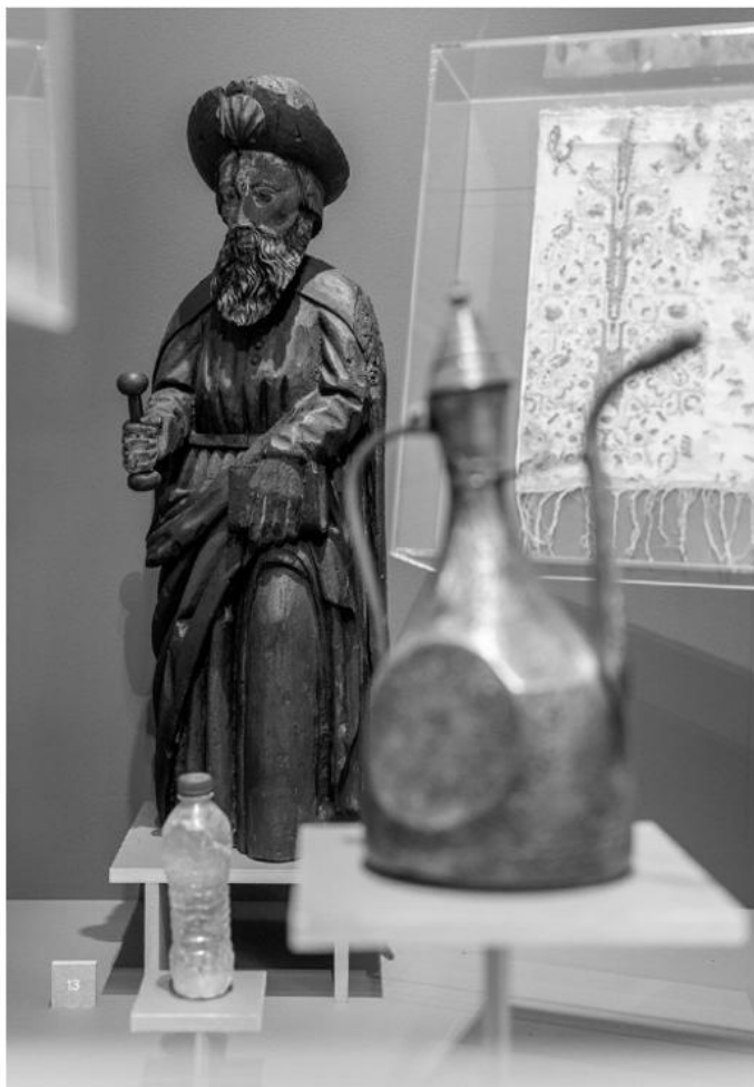
Einstieg in die Ausstellung Gesammelt um jeden Preis! . Foto: Kollektiv Fischka / Kramar

Provenienzforschung und Restitution kann man nicht ausstellen?! Wir tun es trotzdem! Die Ausstellung handelt von NS-Raub, Recht und Rückgabe. Sie stellt die Erforschung des Erwerbs und der Herkunft von Dingen im Museum vor und geht deren Verbleibsgeschichten bis heute nach. Erstmals werden die komplexen Abläufe der NS-Provenienzforschung und Restitution in Österreich einer breiten Öffentlichkeit in einer Ausstellung gezeigt.