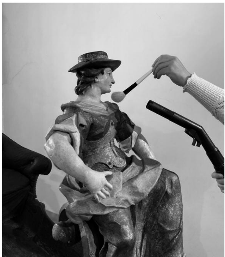
Präventive Konservierung im Museum.

Workshop mit Astrid Hammer, Spezialistin für Präventive Konservierung und Kustodin der Fotosammlung des Volkskundemuseum Wien Anmeldung erbeten