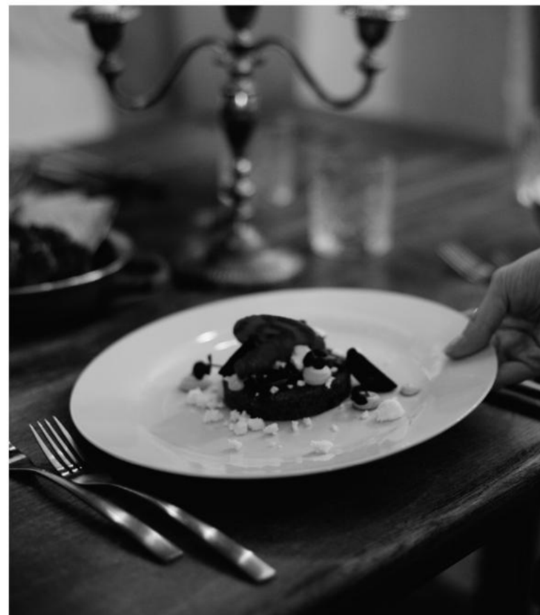
Dinner im Palais, Foto: socials.wien

— Kosten pro Person, exkl. Getränke, inkl. Eintritt und Führungstarif: Menü ohne Fleisch: € 59,- / € 49,- erm. für Mitglieder im Verein für Volkskunde Menü mit Fleisch: € 65,- / € 55,- erm. für Mitglieder im Verein für Volkskunde Anmeldung: www.volkskundemuseum.at/termine Gutscheine sind im Museumsshop erhältlich.