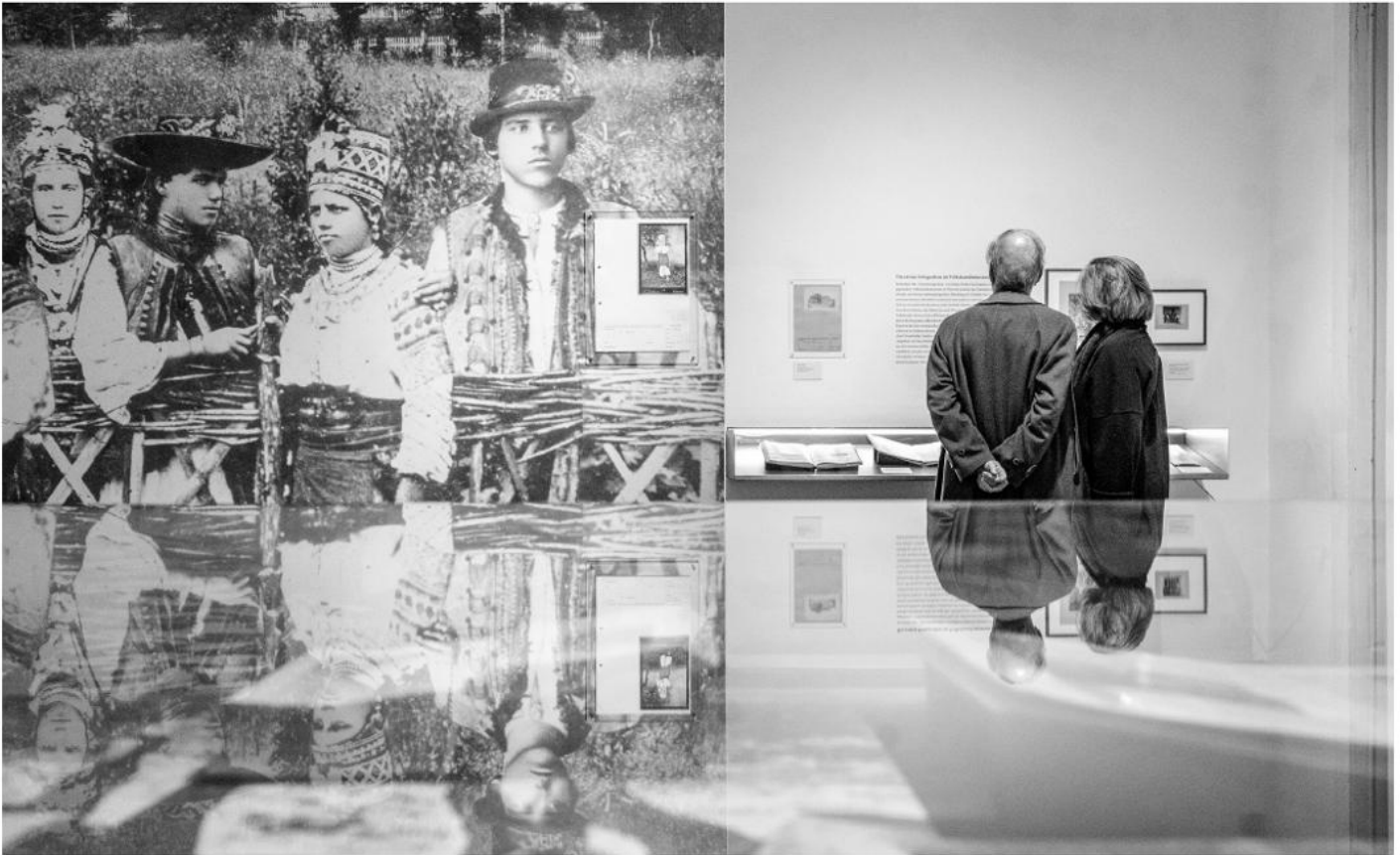
Ausstellungsansicht Örausch und Huzulen kult.