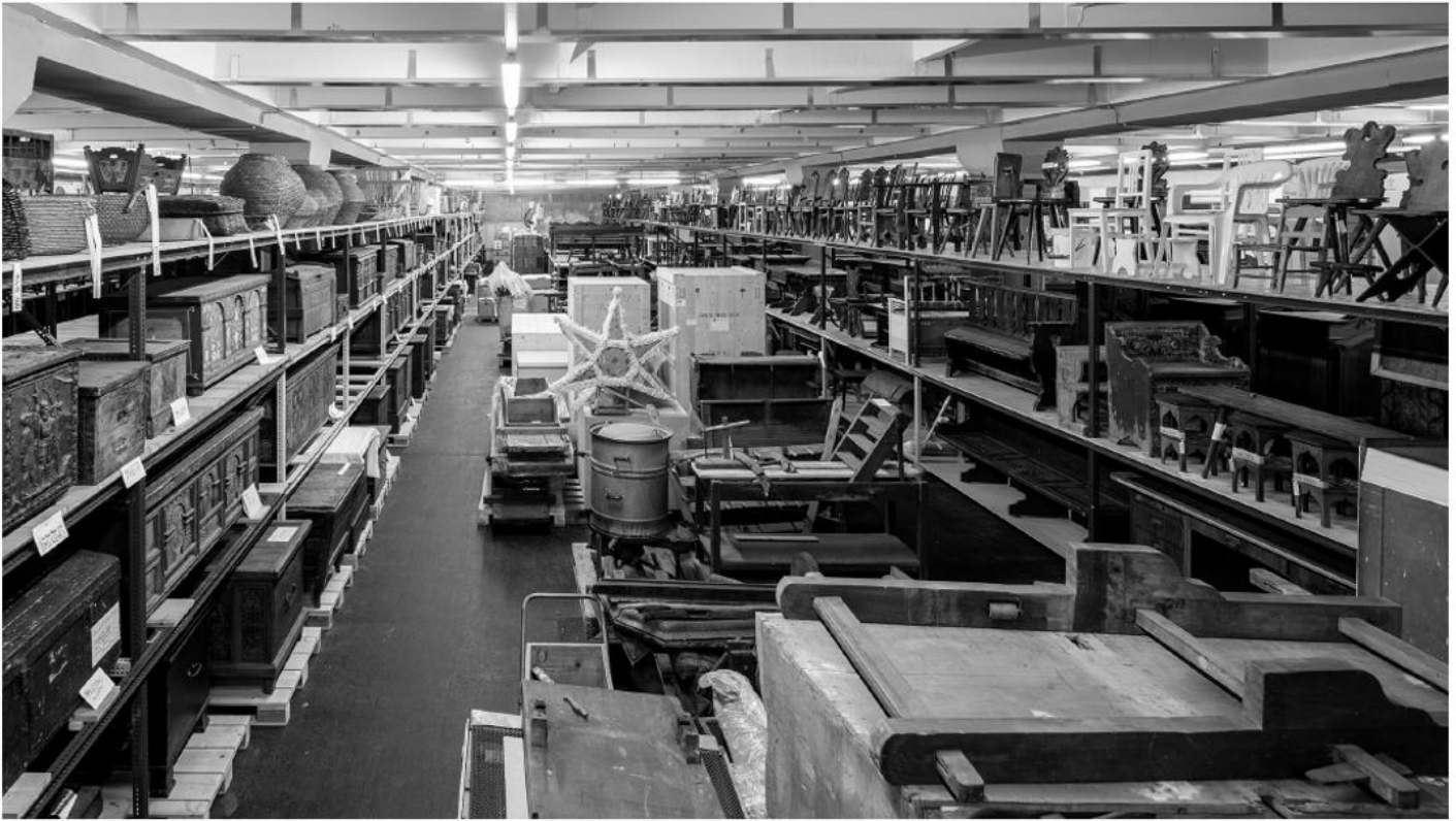
Einblick in das Museumsdepot im Hafen Freudenau.