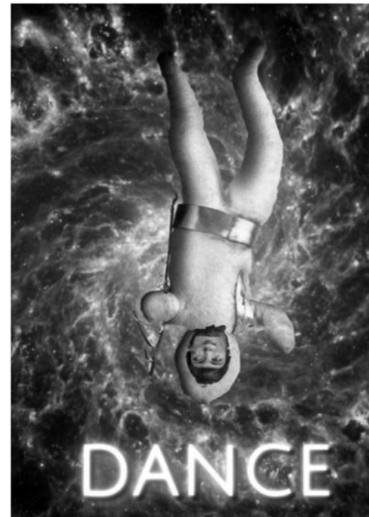
Astro-Watte in Aktion

Sa, 7.10.2023, 18.00 bis 1.00 Uhr Lange Nacht der Museen