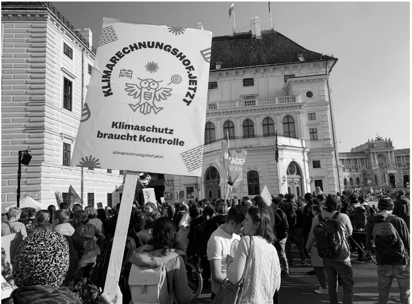
Klimastreik Anfang März 2023.