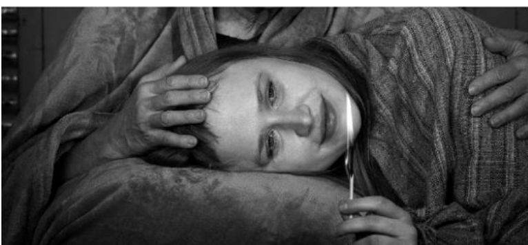
Sommertheater „Der Stoff, aus dem man Träume macht“, Foto: Michaela Krauss-Boneau