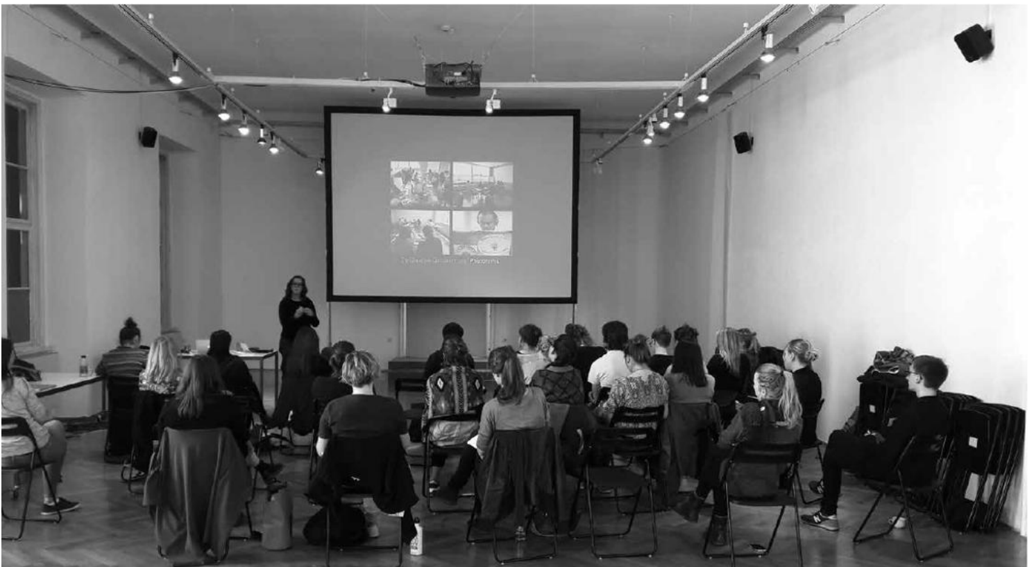
Ethnocineca Projektwerkstatt

Zudem haben wir in den letzten Jahren Masterclasses eingeführt, damit für die FilmemacherInnen Zeit bleibt, dass sie von ihrem Schaffen erzählen können. Das soll vor allem jungen FilmemacherInnen eine Plattform bieten, sich mit den Inhalten der eingeladenen FilmemacherInnen auseinanderzusetzen – beispielsweise in Form von Podiumsdiskussionen, die die letzten Jahre im Volkskundemuseum stattgefunden haben und auch weiterhin dort stattfinden werden.