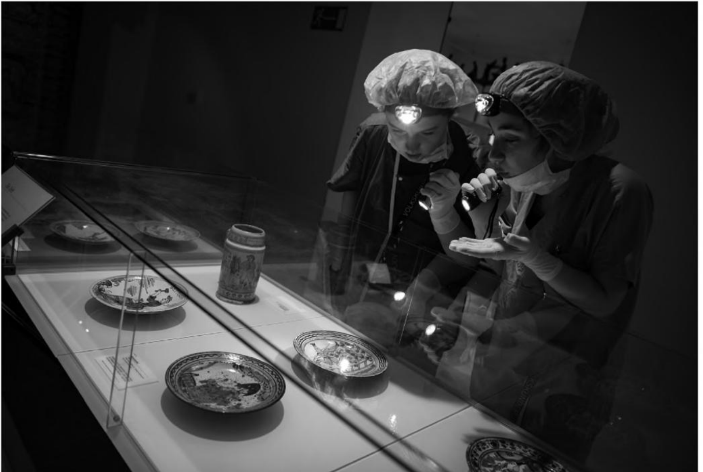
Objekte im Koma. Das Theaterprojekt Fake Reports