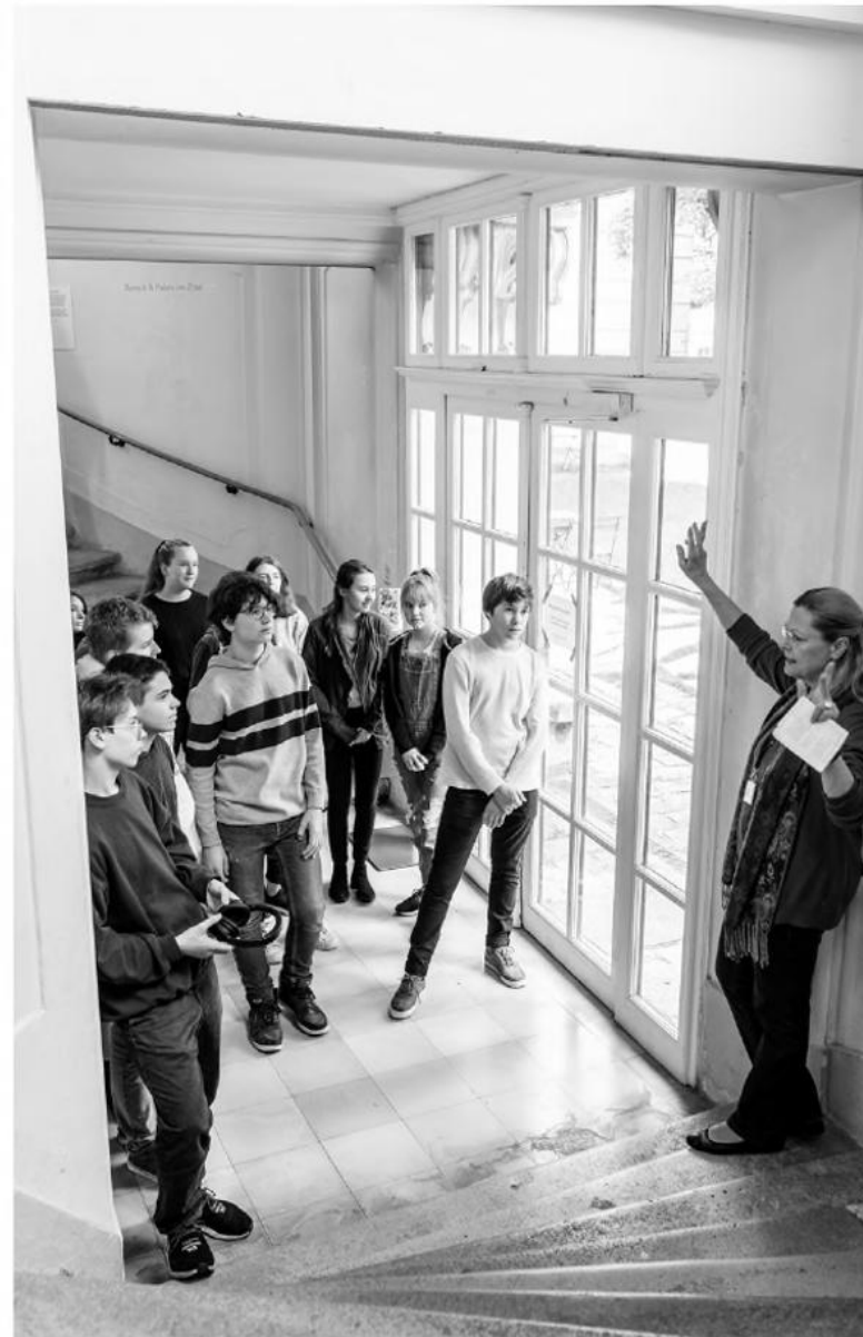
Kulturvermittlung im Museum.