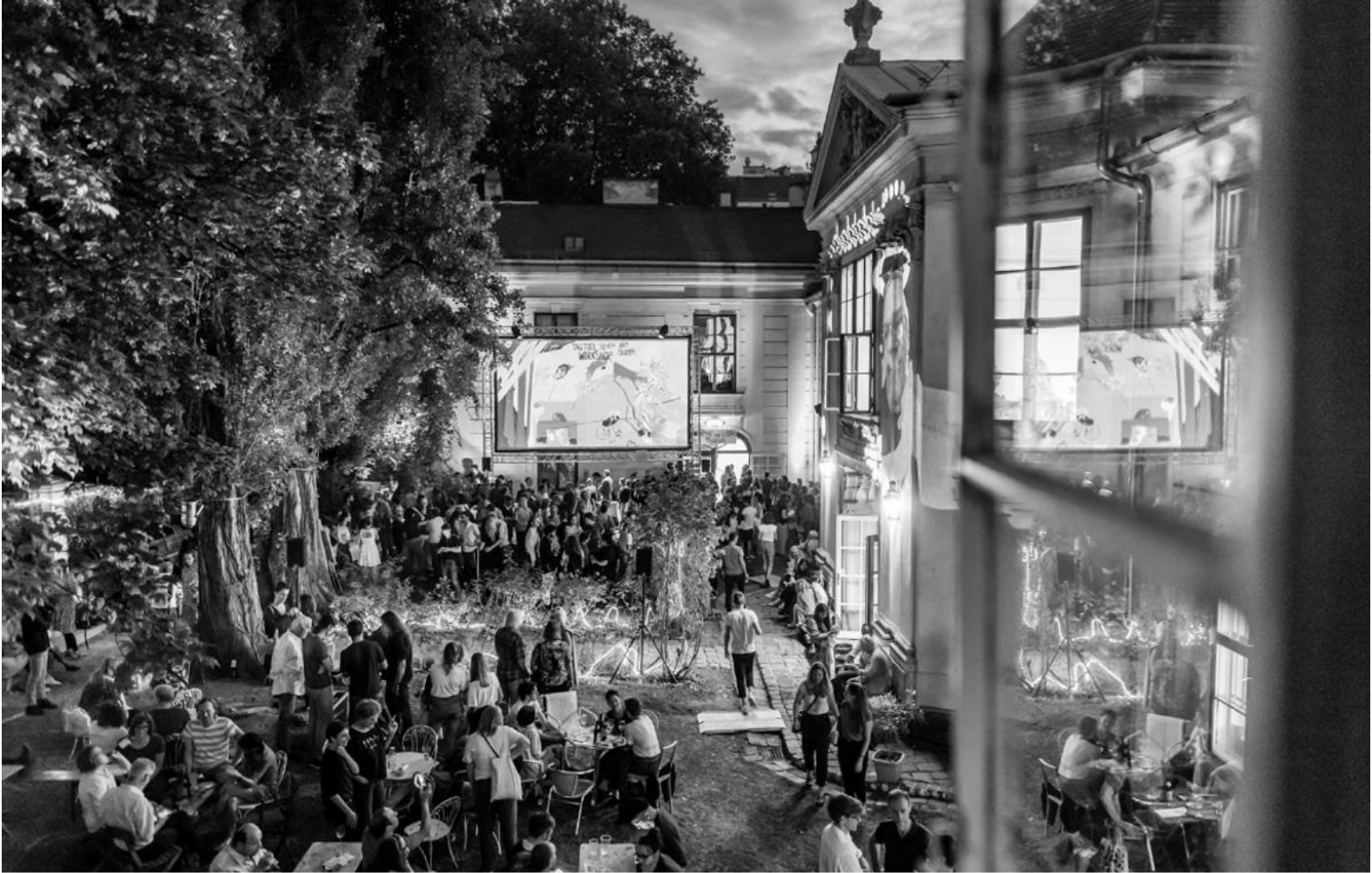
Sommerfest im Museumsgarten.