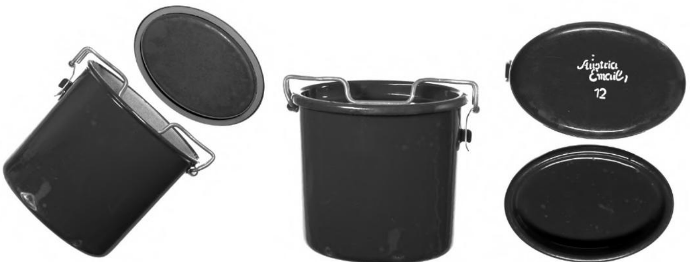
Essensbehälter (Menage-Reindl) aus Emaille

Die kostenlos zu besichtigende Präsentation in der öffentlich zugänglichen Passage des Museums zeigt historische Behältnisse, lässt über den Müllwahnsinn nachdenken und soll zum Experimentieren anregen.