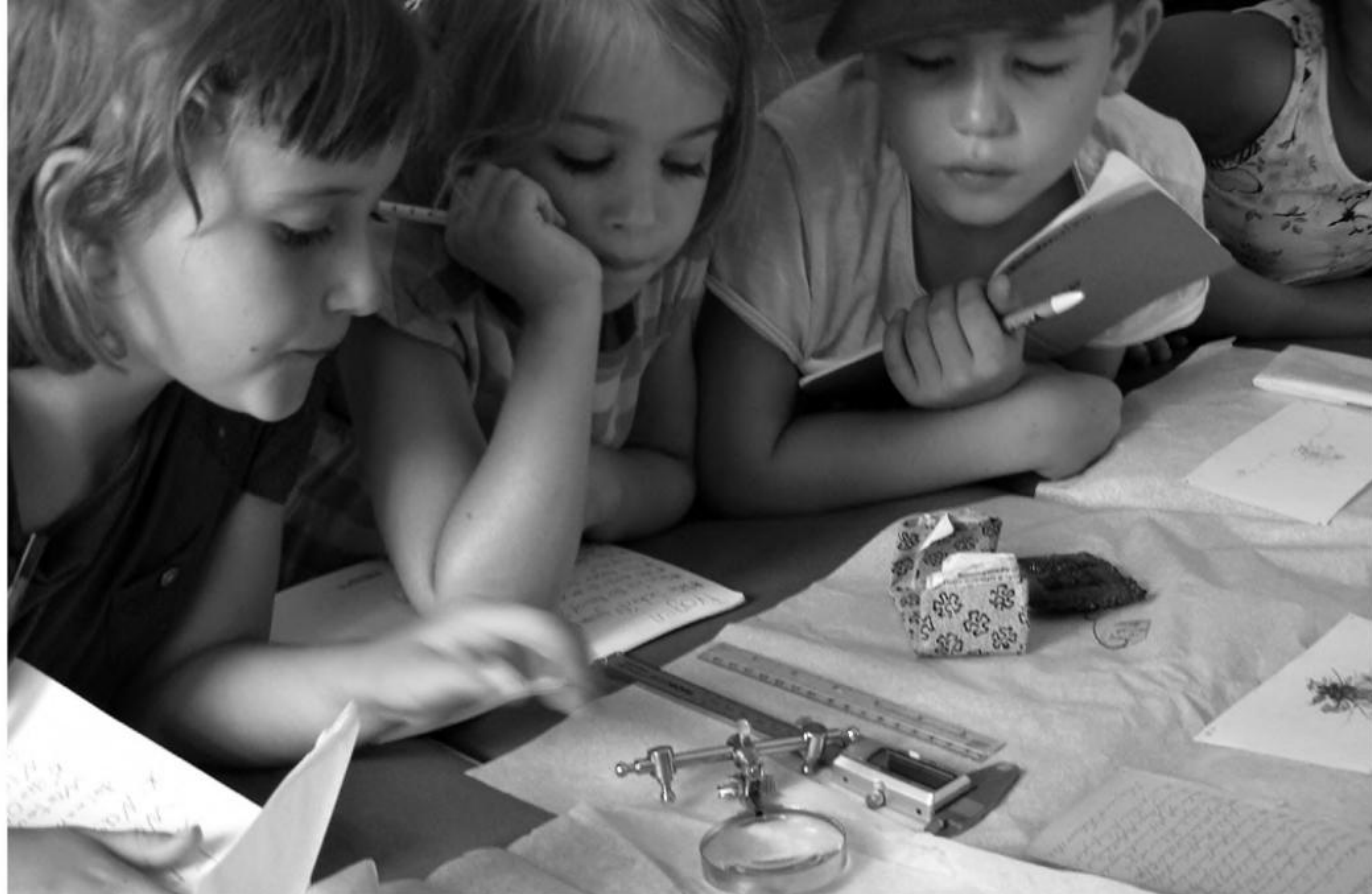
Sommerakademie im Museum