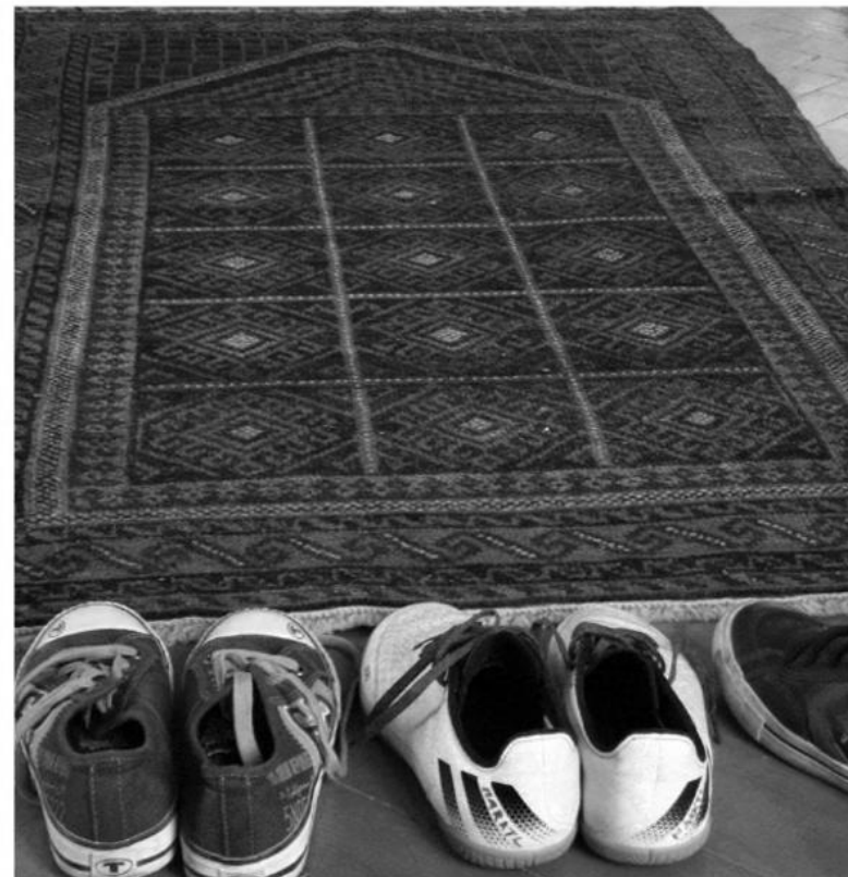
Wiener SchülerInnen interviewen sich gegenseitig zu ihren Lebenswelten

In Zusammenarbeit mit dem BRG/ORG 15, Henriettenplatz, dem Islamischen Realgymnasium in Wien 15, Rauchfangkehrergasse, dem GRG 10, Ettenreichgasse und dem Abendgymnasium 21, Brünnerstraße Projektleiter: Georg Traska Wissenschaftliche Mitarbeiterin: Valeria Heuberger