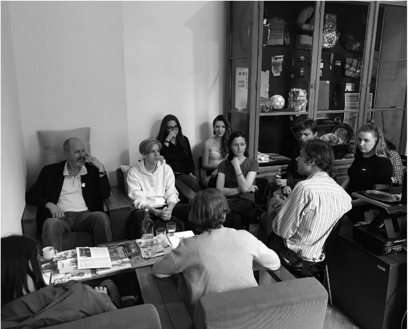
Ein Interview mit Vielen