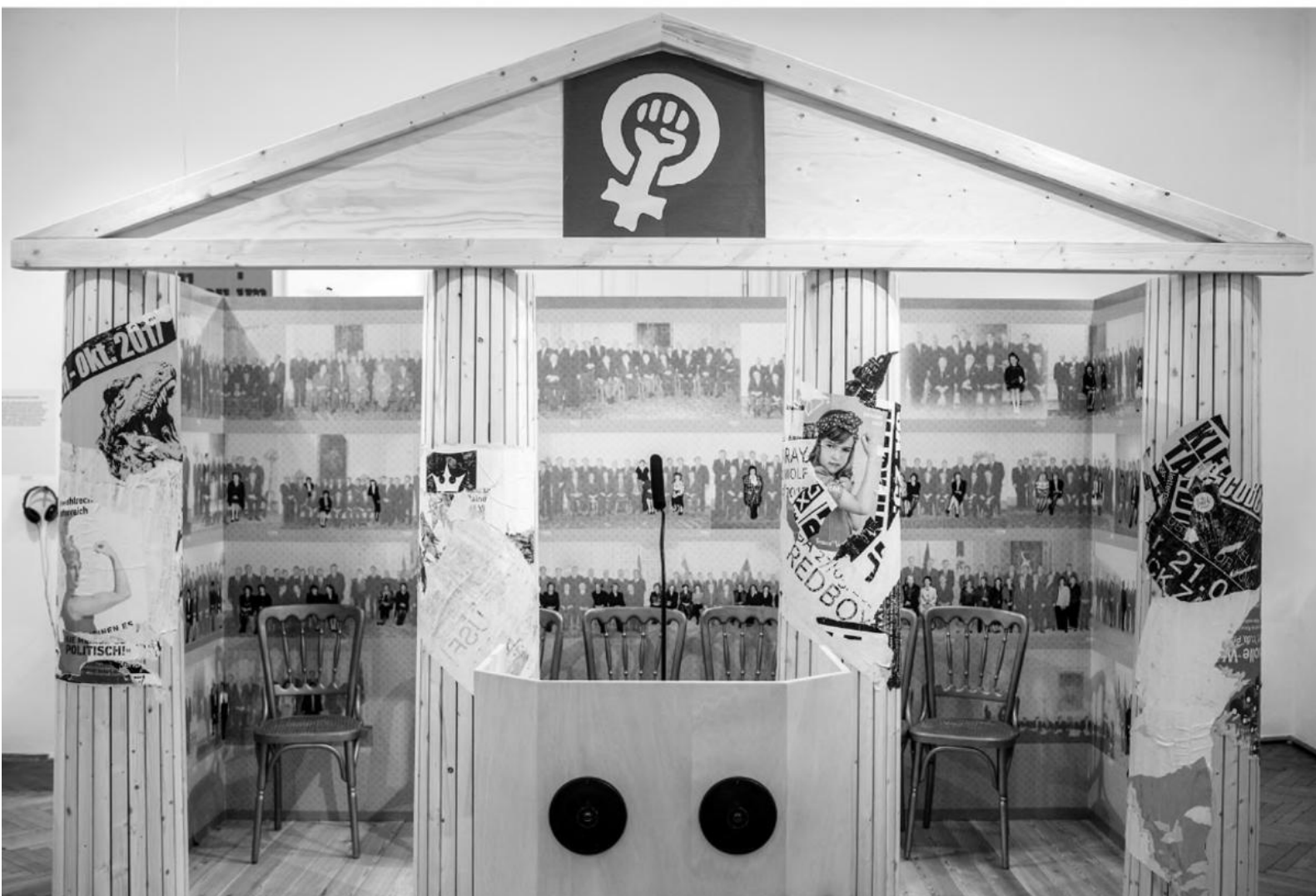
„Sie meinen es politisch!“ 100 Jahre Frauenwahlrecht in Österreich

„Behüte der Himmel! Sie meinen es politisch!“ schrieb Karl Kraus 1907 über die Frauenwahlrechtskämpferinnen und offenbart damit, welche Widerstände die