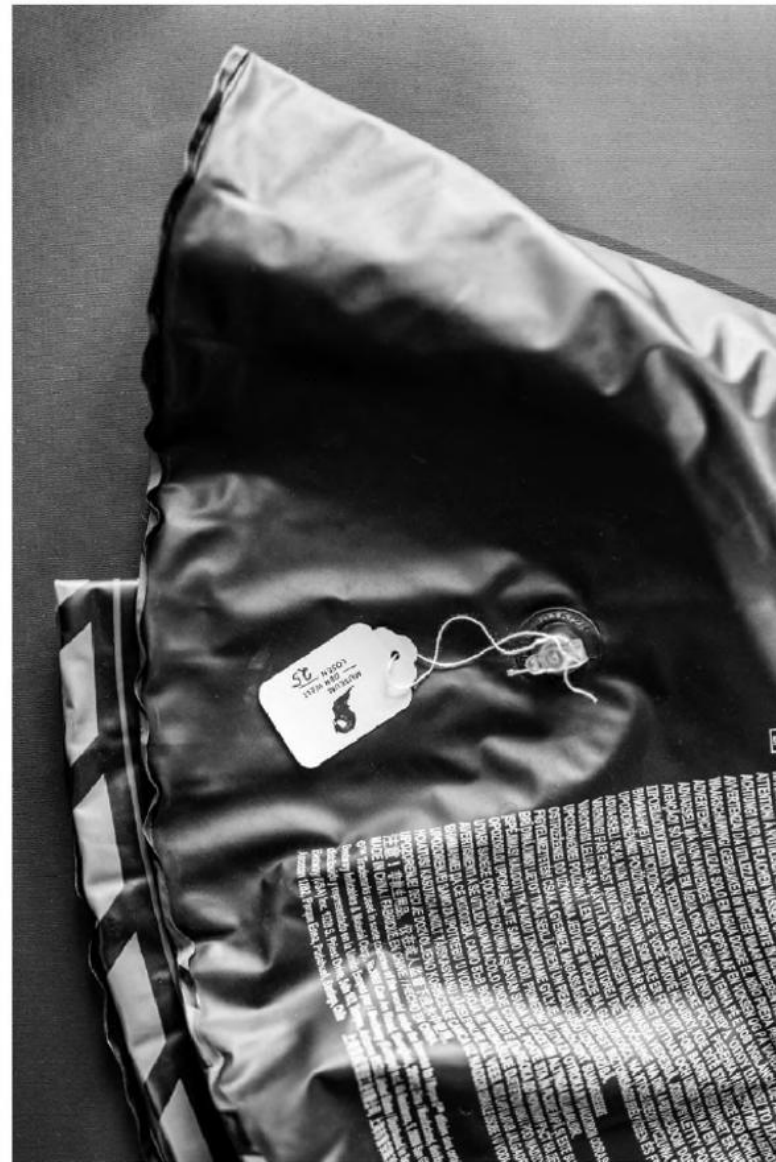
Die Küsten Österreichs.

Das Begleitbuch zur Ausstellung ist über das Museum zu beziehen: buchbestellung@volkskundemuseum.at