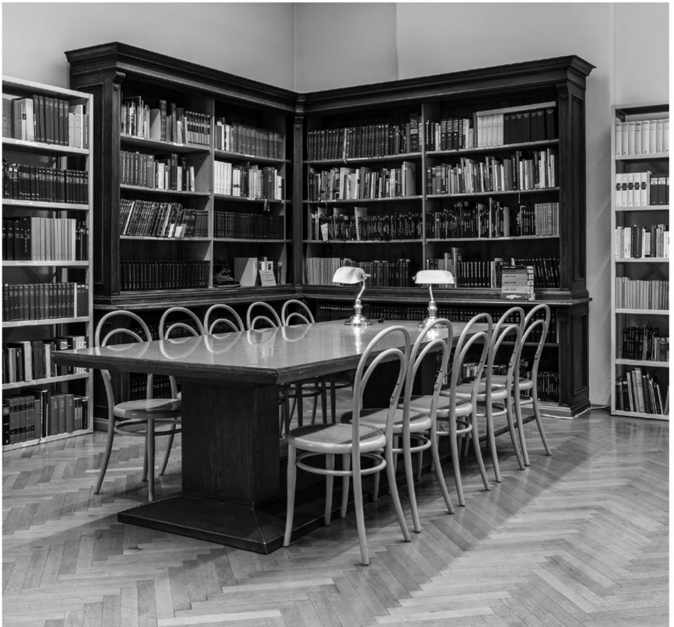
Lesesaal in der Bibliothek des Volkskundemuseum Wien.

Di bis Fr, 9.00 bis 12.00 Uhr. Weitere Benützungsmöglichkeiten nach Vereinbarung Juli und August geschlossen Kontakt: Hermann Hummer hermann.hummer@volkskundemuseum.at +43 1 406 89 05.25