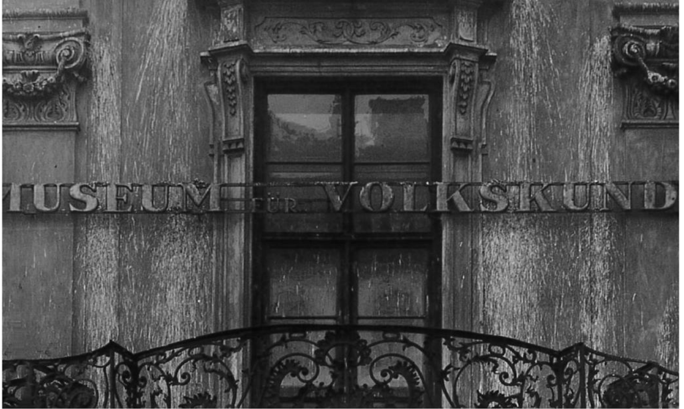
Objektbeschriftung: Außenaufnahme Museum für Volkskunde, 1930er-Jahre

Im Rahmen des Rundgangs „power of display“ diskutiert schnittpunkt gemeinsam mit den KuratorInnen und GestalterInnen inhaltliche und formale Herangehensweisen der Gestaltung, die die Sammlungs- und Ausstellungsgeschichte der Institution mit einschließt. Wie kann eine temporäre Ausstellung eine kritische Reflexion der Praxis des Zeigens im Haus erreichen? Wie kann der Prozess des Nachdenkens über die Geschichte des Museums sichtbar werden? In welchem Verhältnis stehen Räume, Exponate und Gestaltung zueinander und welche Rolle spielen dabei Originale und Reproduktionen? In welcher Weise unterstützt das Zusammenwirken von kuratorischem Konzept und Gestaltung die Neuperspektivierung von Exponaten? Wie können vielschichtige Ebenen der Betrachtung erzeugt und vermittelt werden? Wo liegen hier die Grenzen und Möglichkeiten?