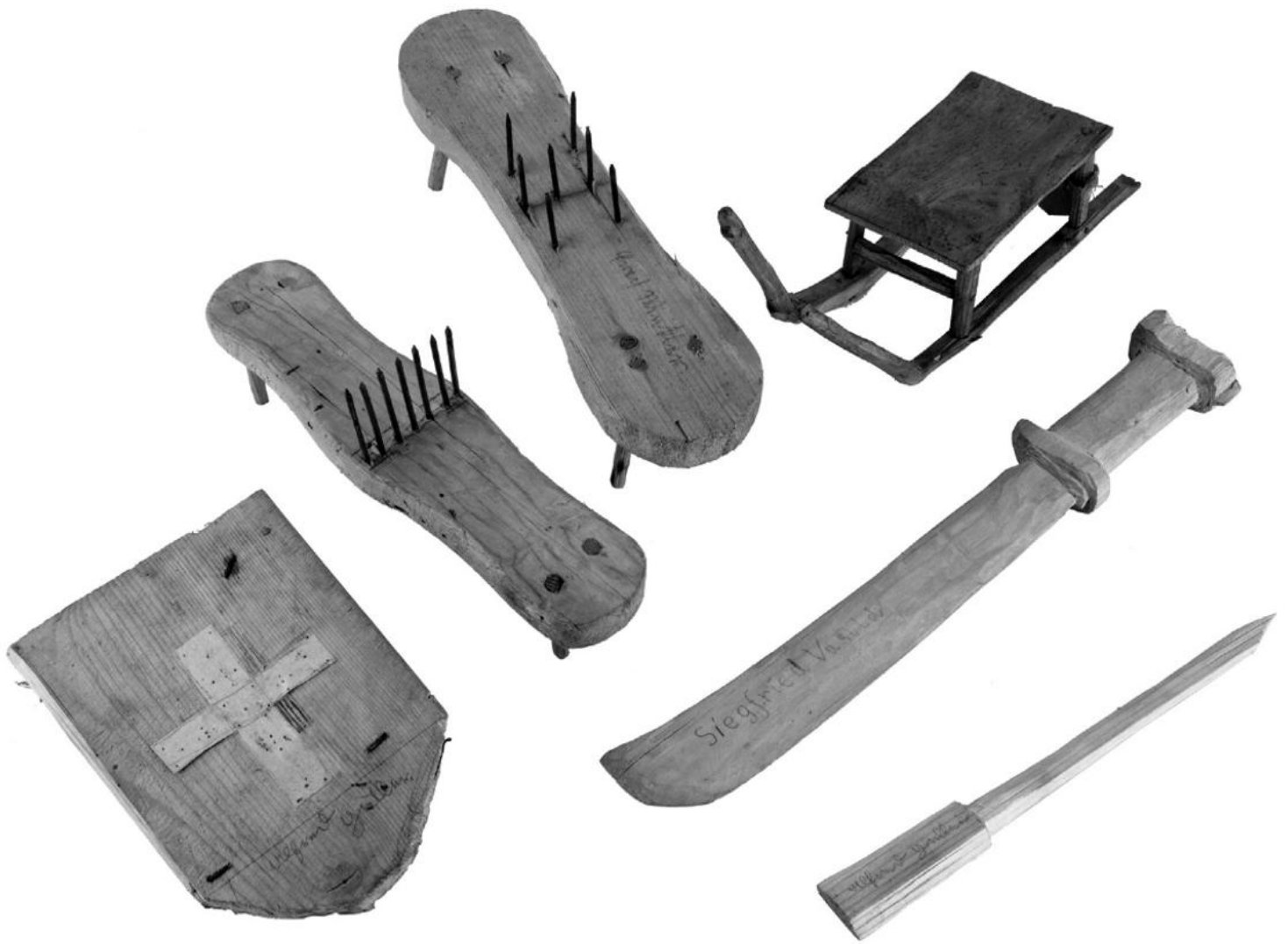
„Kinderspielzeug“ aus dem Werkunterricht, hergestellt unter der Leitung des Volkskundlers Romuald Pramberger OSB, St. Lambrecht/STMK, 1930er-Jahre, Foto: Christa Knott