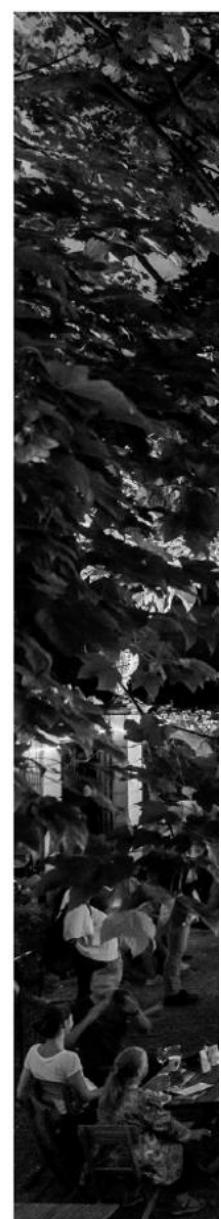
6 Eröffnung dotdotdot – Filmfestival 2017