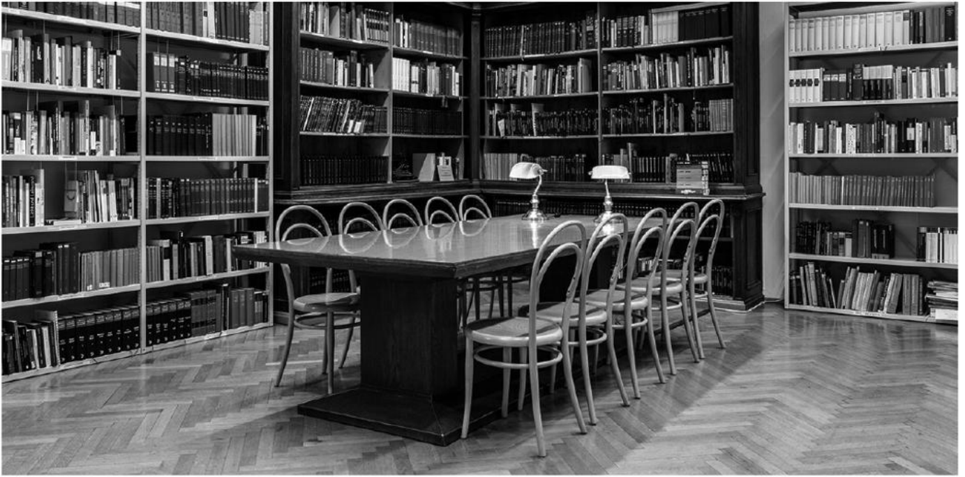
Lesesaal in der Bibliothek des Volkskundemuseum Wien.