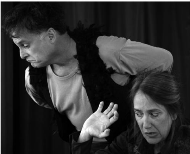
Die Wiener Stadtmusikanten im Museumsinnenhof

Eintritt: Freiwillige Spende (die Hälfte geht an eine gemeinnützige Kinderhilfsorganisation) Information und Anmeldung: +43 677 614 05 081 oder www.facebook.com/zenithproductionsvienna