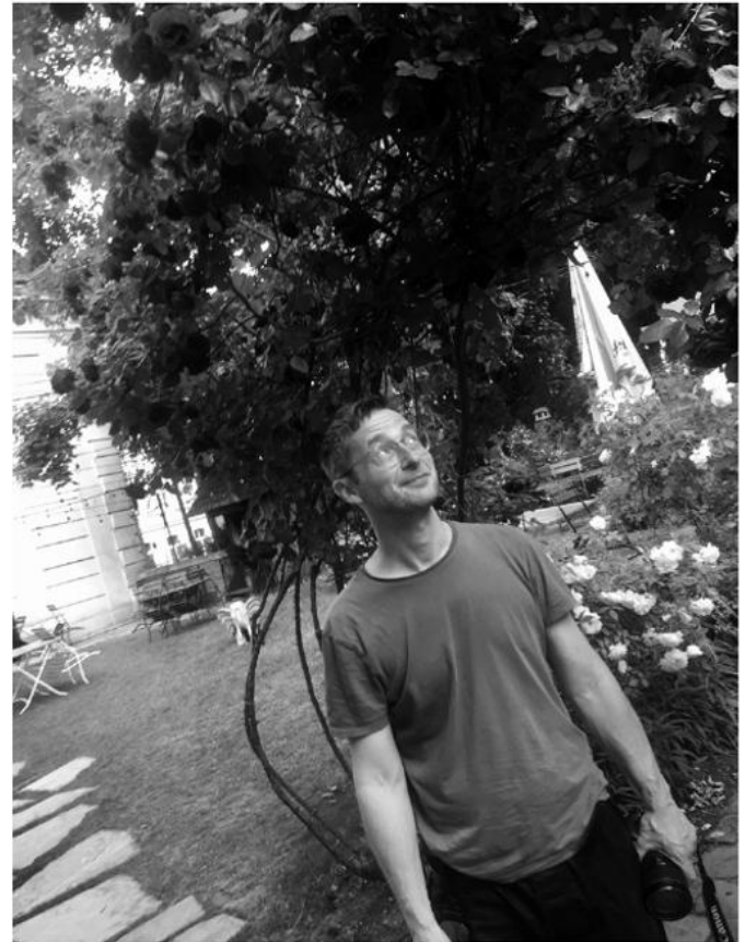
eSeL unter den Rosen

Die Radiosendung war irrsinnig schön. Aber ich bin glücklich, dass ich jetzt eine Mikro-Institution habe, die inzwischen ein Archiv ist, einerseits von dem absehbaren Ende des analogen Flyers – jede einzelne