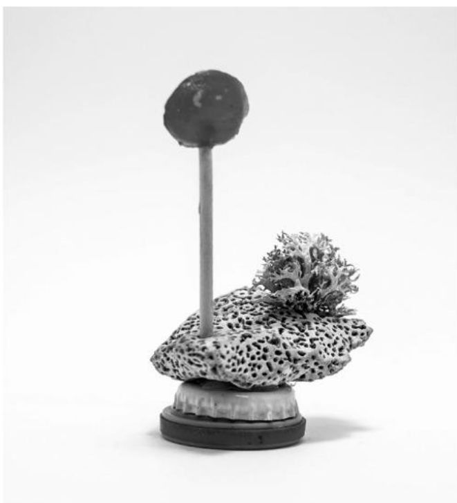
Sascha Mikel, Détournement Object Nr. 142 © Sascha Mikel, 2019

— Kuratierung: Edith Payer und Gudrun Ratzinger