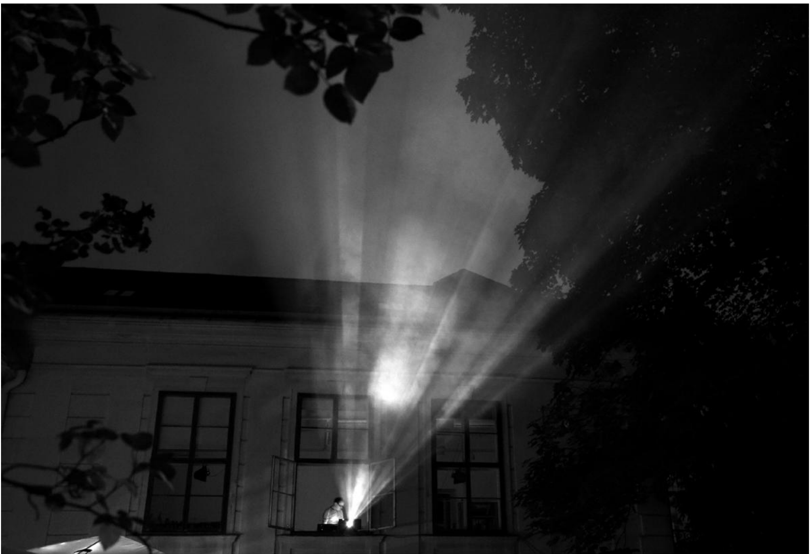
Projektionsfläche Museum beim Open Air Kurzfilmfestival im Garten.