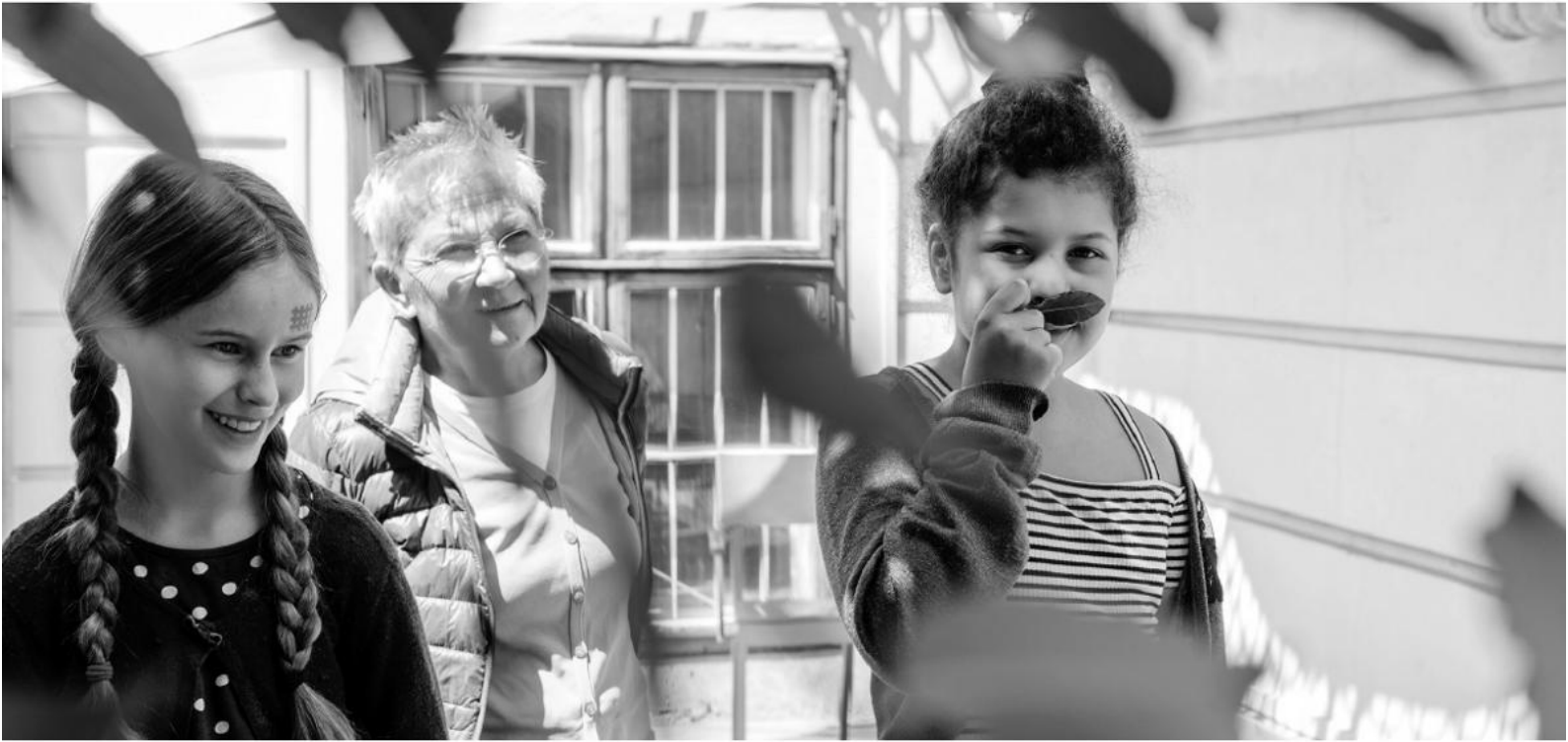
Kulturvermittlung im Grünen.