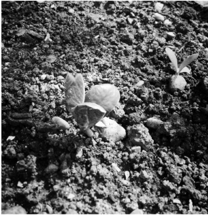
Junge Sojapflanze: Welthandelsprodukt und Cash Crop.