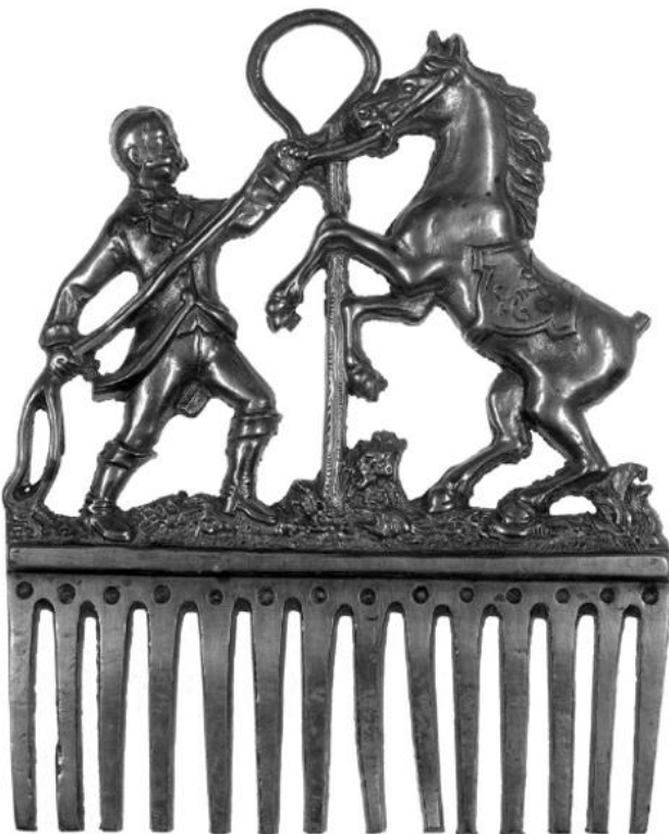
Pferde- oder Kummekamm aus Messing.