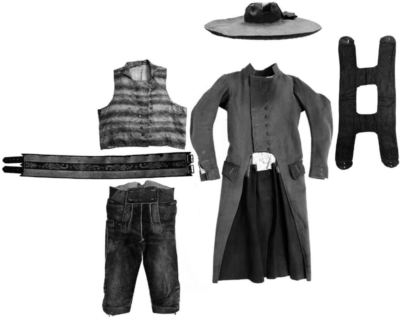
Männerbekleidung aus Gröden, Ende 18. Jh., Inventarnummern ÖMV/39.666-39.671