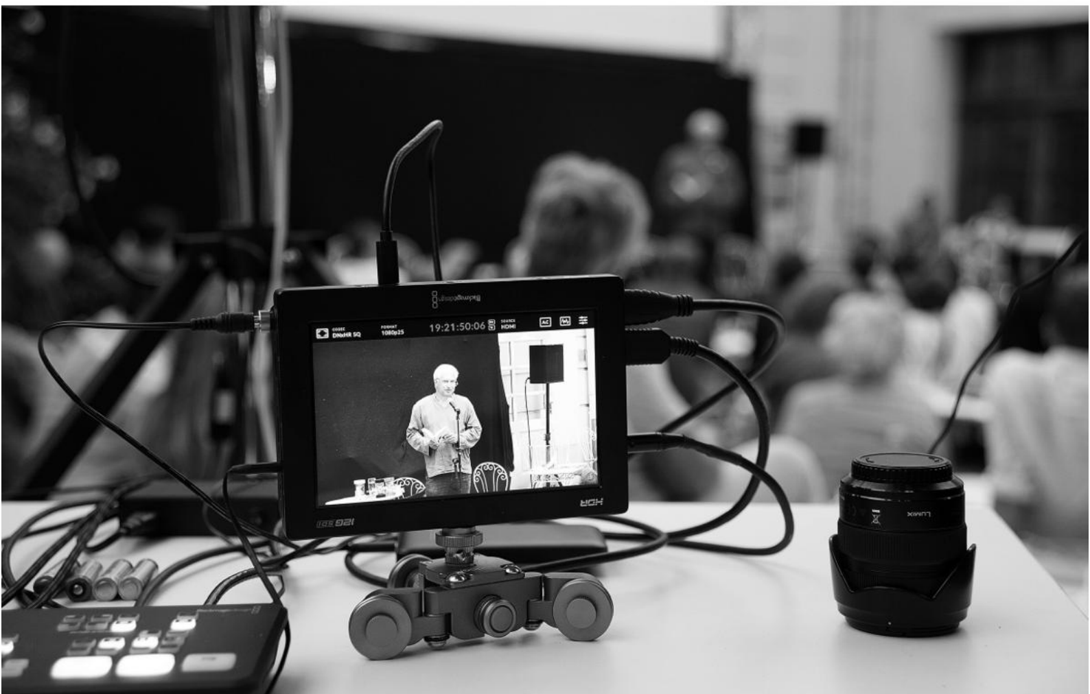
Wie verhalten sich Gewalt und Ästhetik zueinander? Symposium im Museumsgarten

Im Zuge der MeToo-Debatte und postkolonialer Diskurse wurden in den letzten