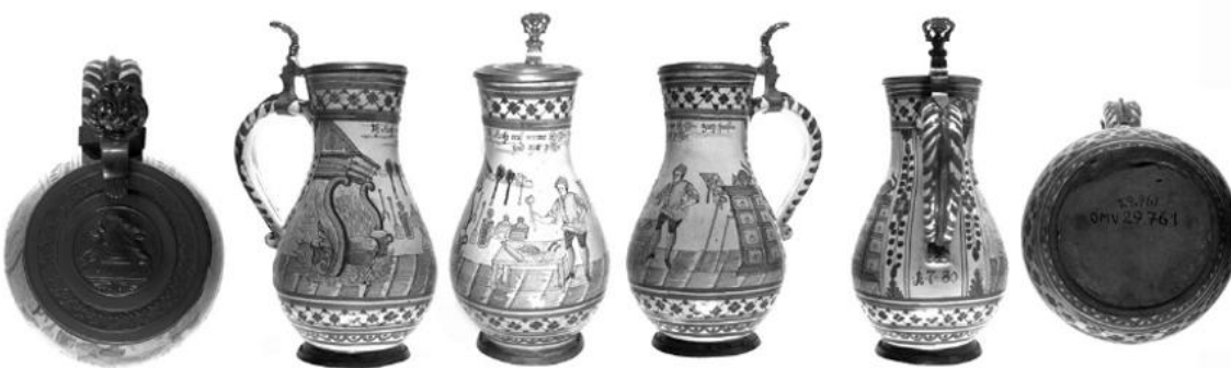
Gmundner Fayencekrug mit Zinnmontierung, ÖMV/29.761.