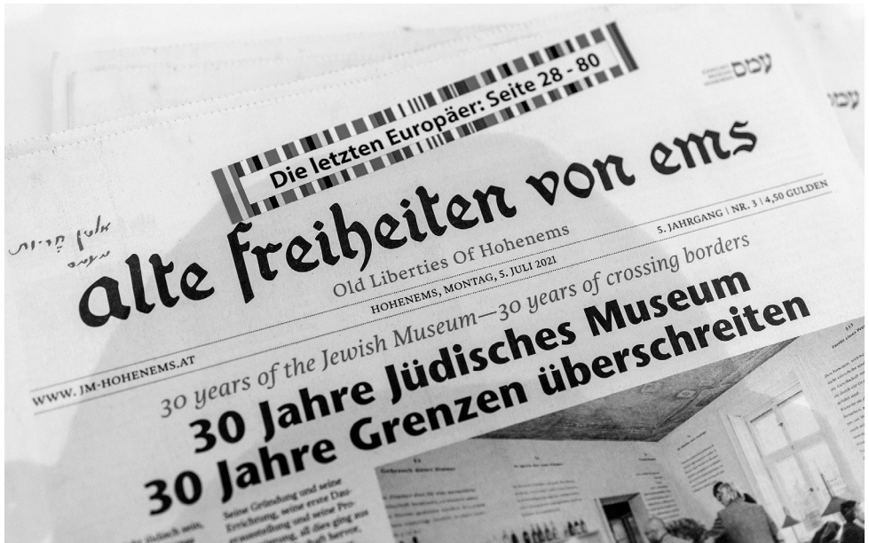
Alte Freiheiten von Ems III | Old Liberties of Hohenems III. Die Zeitung des Jüdischen Museum Hohenems.