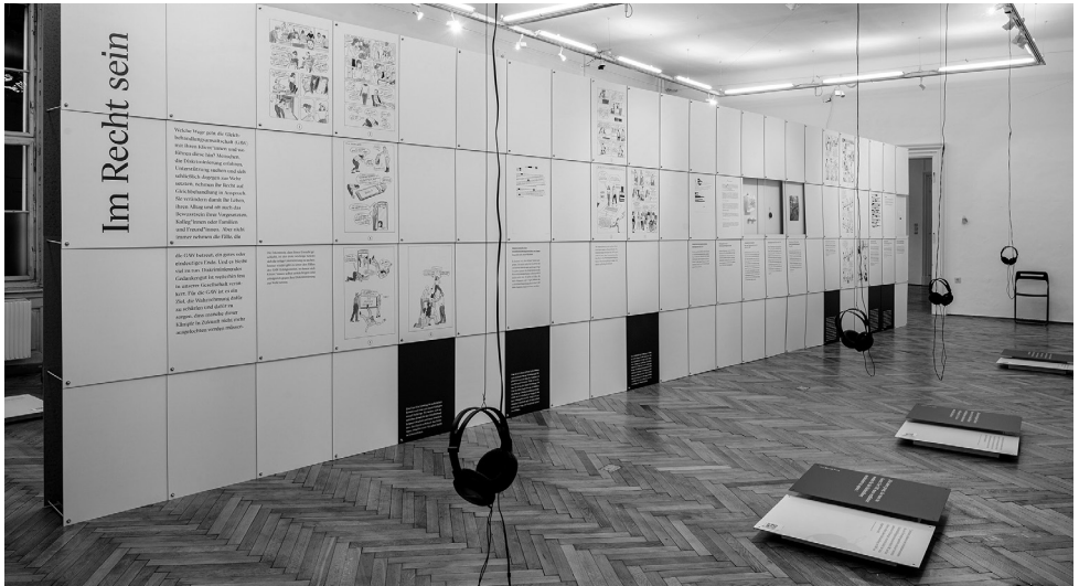
Ausstellung Jetzt im Recht! Wege zur Gleichbehandlung im Volkskundemuseum Wien