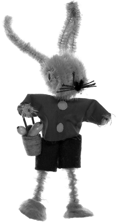
Hasenfigur aus Chenilledraht, 3. Viertel 20. Jh., Inventarnummer ÖMV/88.863

Im 19. Jahrhundert entwickelte sich das Osterfest – neben seiner besonderen Bedeutung im Rahmen der liturgischen Feierlichkeiten im christlichen Kirchenjahr – zunehmend zu einem Familien- und Geschenkefest. Es wurde üblich, Glück-