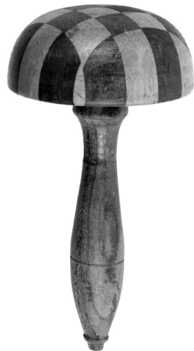
Stopfholz aus dem 20. Jh., Inventarnummer ÖMV/89.507/002