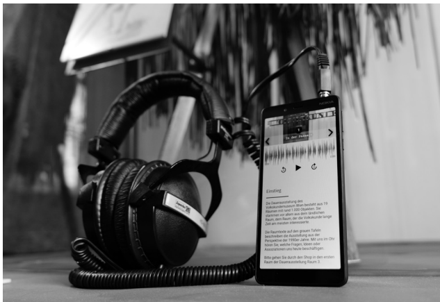
Hörgang im Volkskundemuseum Wien.