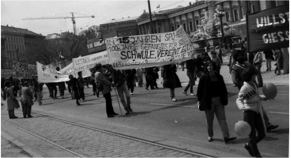
Erste Mai Demo 1985