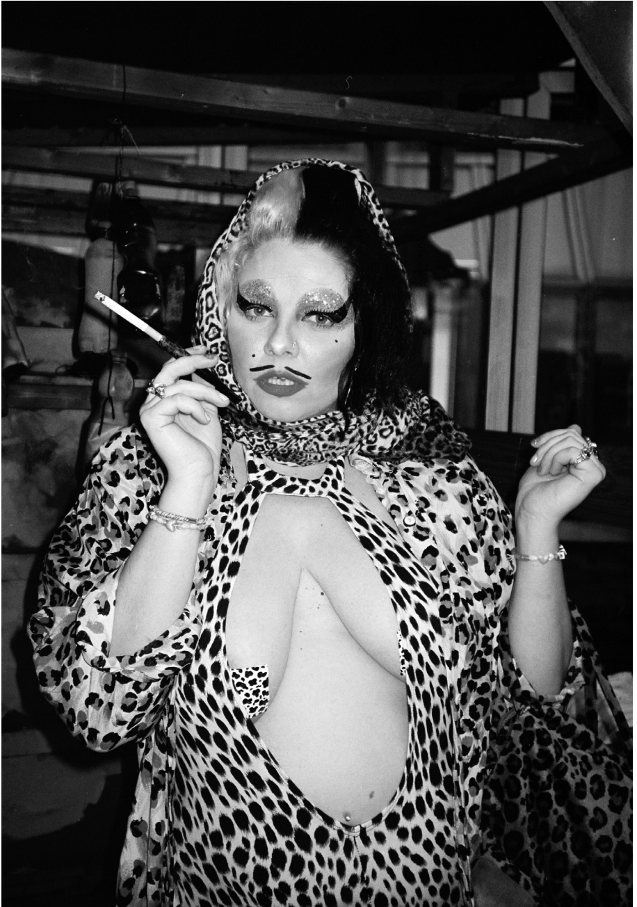
Honeymoon in Hennyland