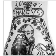
Zeitreise in das Jahr 1687

30 Farbdrucke aus der Zeit der wiedererlangten Unabhängigkeit Polens.