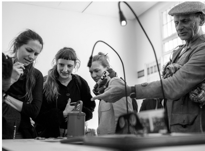
Minute Museum of Resistance: Über widerständige Dinge und propagandistische Zeugnisse aus den Sammlungen des DÖW und VKM.