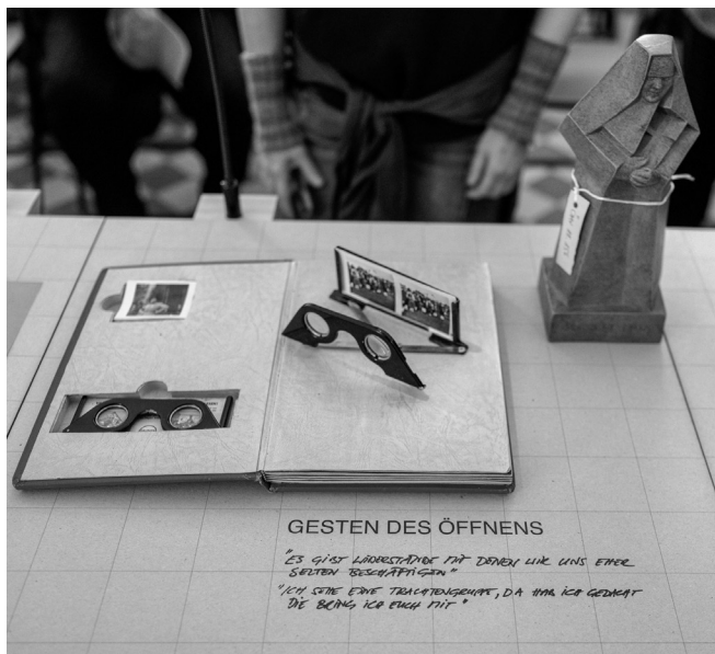
Ein Stereoskop, „Raumbild-Brille“, ist eine 3D-Brille aus den 1930er Jahren, Objekt aus den Sammlungen des DÖW sowie die Figur der Restituta (ÖMV/88.156) aus den Sammlungen des Volkskundemuseums.