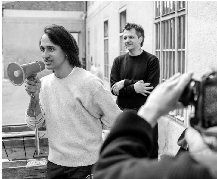
Installation W/ri/gh/ting Archives through Artistic Research von Rafat Morusiewicz und Guilherme Maggesi beim 2. Mikrofestival Widerstand: Aktiv leben gegen feindliche Regime .