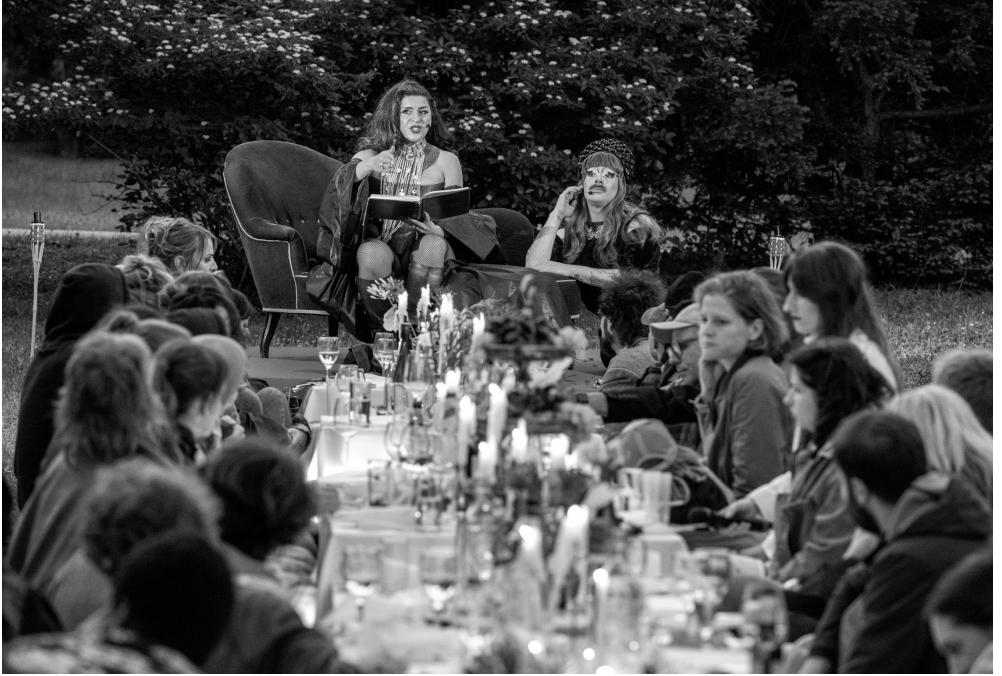
Epistemic Ruptures mit Königin der Macht: Wir. Das Volk – Banquet Républicain .