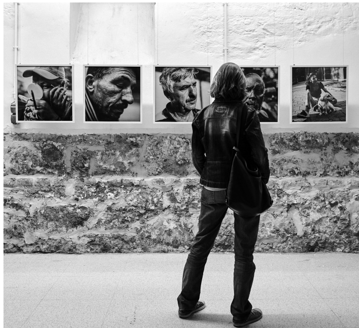
Das Symposium Disorganized Desire im Rahmen des ersten Mikrofestivals wurde von der Ausstellung des Projekts »neighbors« des Fotografen und Soziologen Florian Rainer begleitet und handelte von sozialen Klassen und Migration.