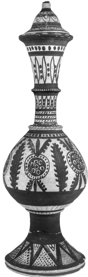
Gürtel (vor 1938), ÖMV/44598 (dig/9596) Türband (vor 1938), ÖMV/44552 (dig/4264) Tonvase (um 1900), ÖMV/44559 (dig/4232)