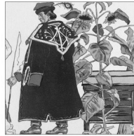
Farblithografien nach Vorlagen von Gustaw Pillati

30 Farbdrucke aus der Zeit der wiedererlangten Unabhängigkeit Polens.