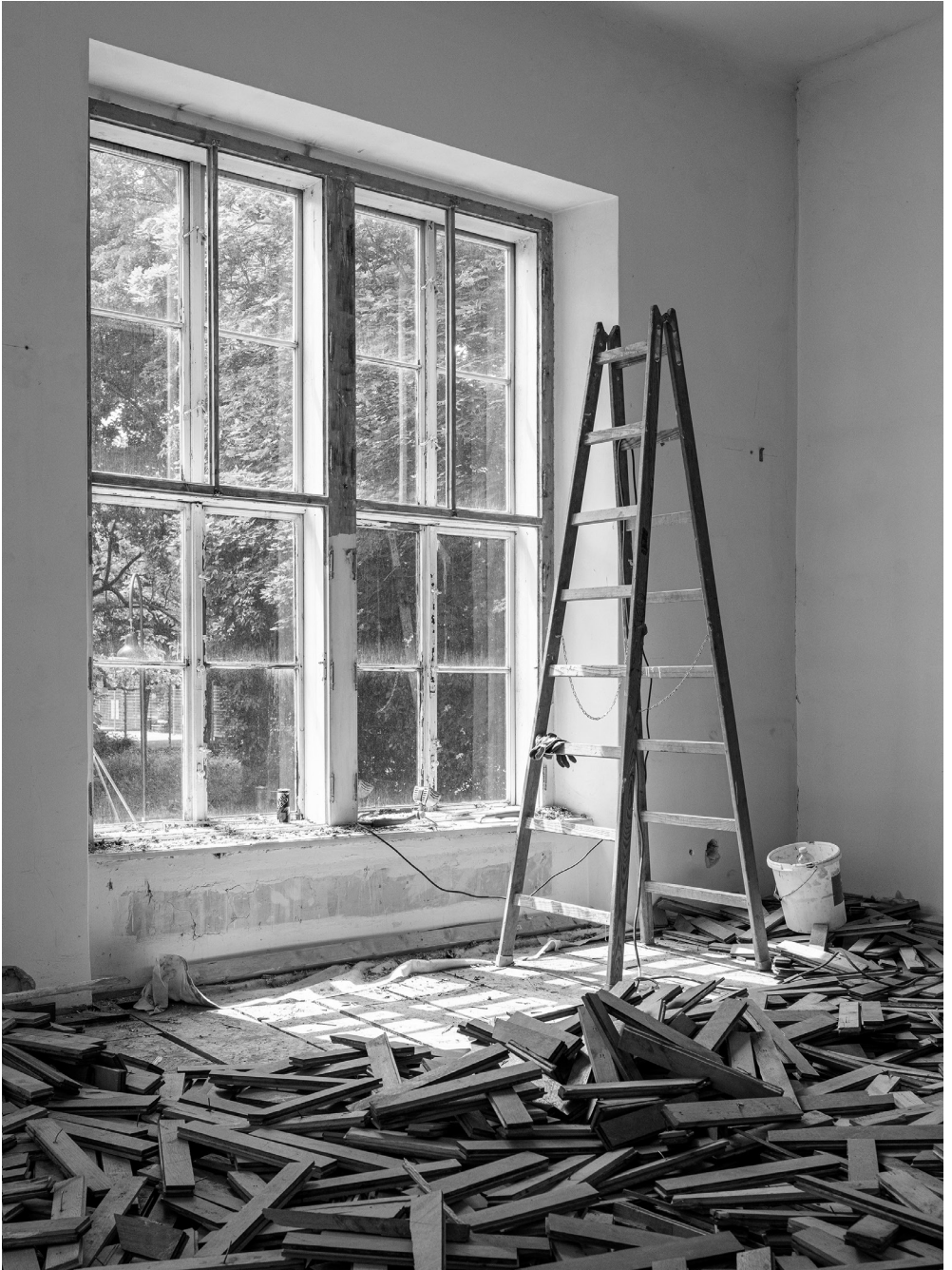
Aktueller Blick in den grünen Schönbornpark inklusive losem Fischgrätparkett.