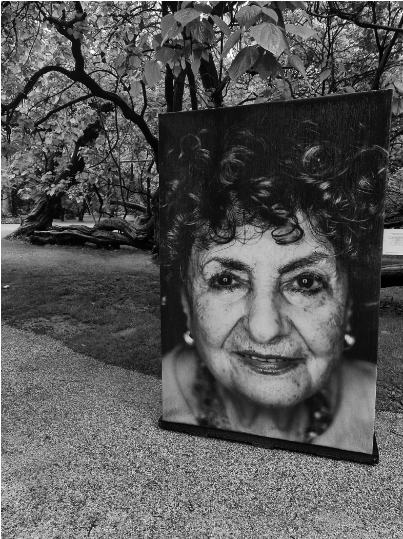
Abb. 7 Sonia Warshawski Kunstinstallation im Innsbrucker Hofgarten (Fotos: Christa Jäger, Mai 2024)