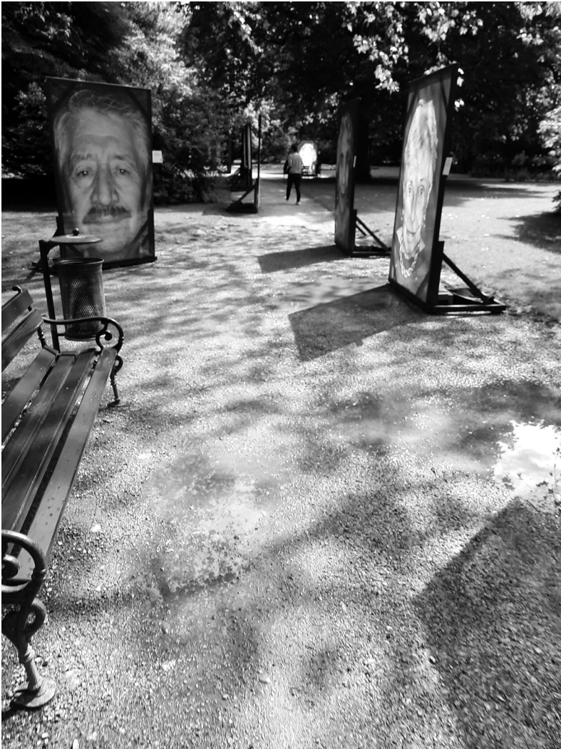
Abb. 1 Porträtgalerie Kunstinstallation im Innsbrucker Hofgarten (Mai 2024)