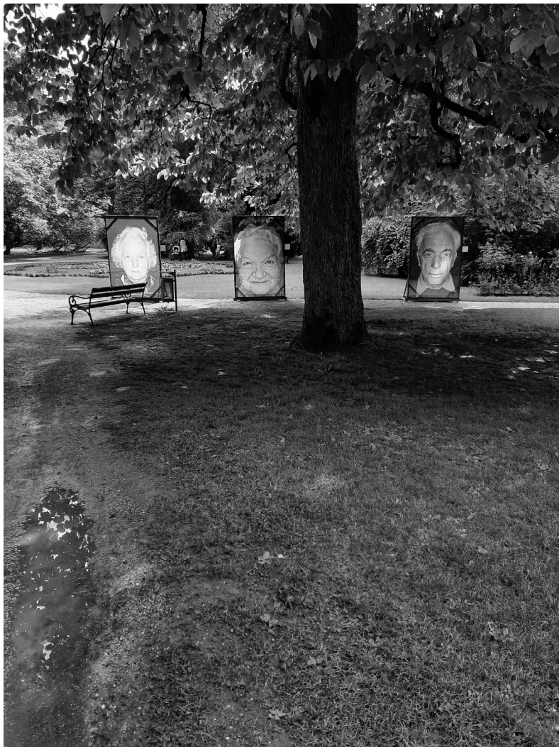
Abb. 4 Amira Gezow u. a. Kunstinstallation im Innsbrucker Hofgarten