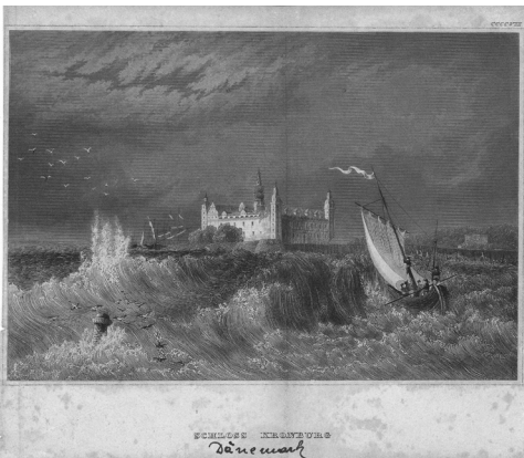
Stahlstich (um 1850) Schloss Kronborg in Dänemark, Scan von Z/1104 (dig/21552): Johannes Aichinger

2015 verpflichtete sich der Verein für Volkskunde als Rechtsträger des Volkskundemuseums schließlich freiwillig, systematische Provenienzforschung und Restitutionen im Sinne des KRGs durchzuführen. Zu diesem Zeitpunkt gab es bereits seit sechs Jahren eine Rückgabeempfehlung die 66 Grafiken betreffend und mit der freiwilligen Verpflichtung