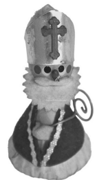
Krampusfigur, Wien, 1960er, ÖMV/90.165