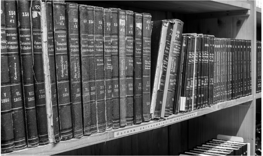
Alter Bestand aus der Bibliothek, der inzwischen eingepackt wurde für die sichere Zwischenlagerung während des Umbaus.

Moderne. Politik – Vergnügen – Technik. (Die Publikation erscheint anlässlich der Eröffnung des Pratermuseums im März 2024.) Basel, Birkhäuser, 2024. 447 Seiten