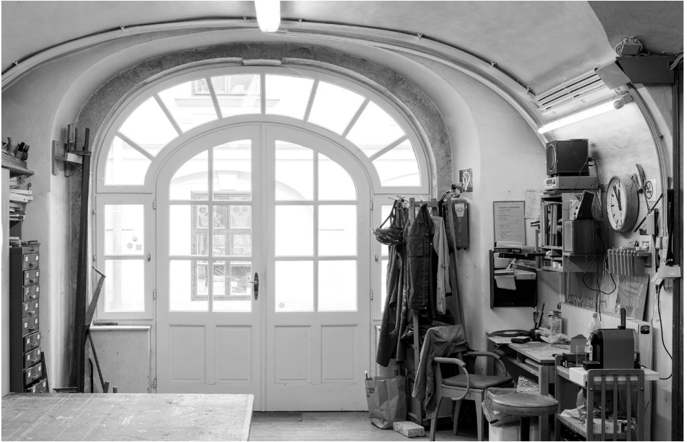
Der Innenhof als Veranstaltungsort.

Diaspora in Wien gemacht und im Museum gezeigt hat. Im Gespräch mit ihnen habe ich gelernt, dass es wichtig ist, aus der Community für die Community zu arbeiten. Denn es braucht viel Feingefühl, um im richtigen Moment die richtigen Fragen zu stellen. Für einen Ort wie das Museum, das sich durch eine hohe Programmdichte und viele Gleichzeitigkeiten auszeichnet, stellt das eine große Herausforderung dar.