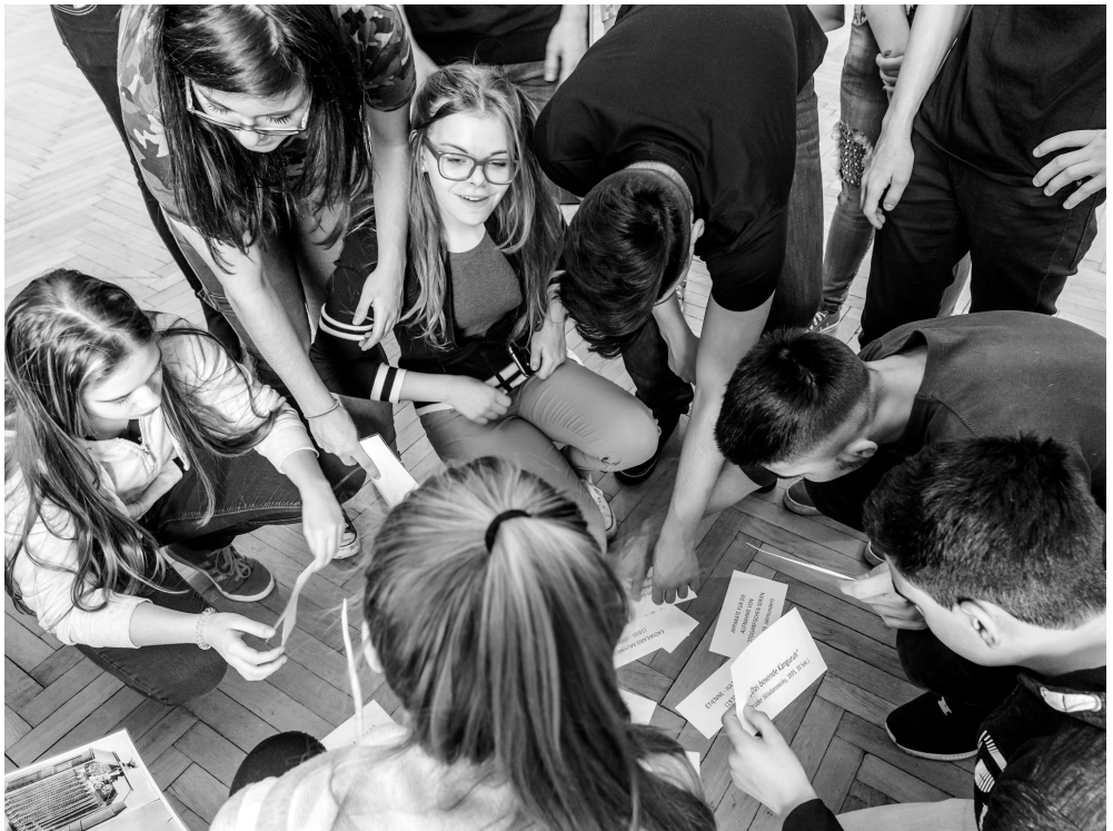
Die Kulturvermittlung kommt zu euch!

Alter: 1. und 2. Schulstufe, Dauer: 2 UE Max. 25 Kinder Kosten: € 150,-