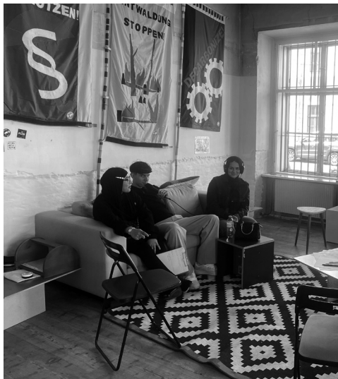
K3 Workshop Fragen-Hören-Lauschen-Senden!

Die beiden Ausstellungen Lobau Lauschen. Hörerlebnisse einer umkämpften Stadtwildnis und Wir protestieren. Von Demos, Hashtags und Gemüse (Online Ausstellung von Studierenden der Universität Wien, Institut für Europäischen Ethnologie, in Kooperation mit dem Volkskundemuseum Wien) gaben dabei einen inhaltlichen Einstieg für den Workshop: Welche Protestformen werden im zivilgesellschaftlichen Engagement für Umweltschutz angewendet? Mit welchen Methoden versuchen Gruppen innerhalb einer Demo-