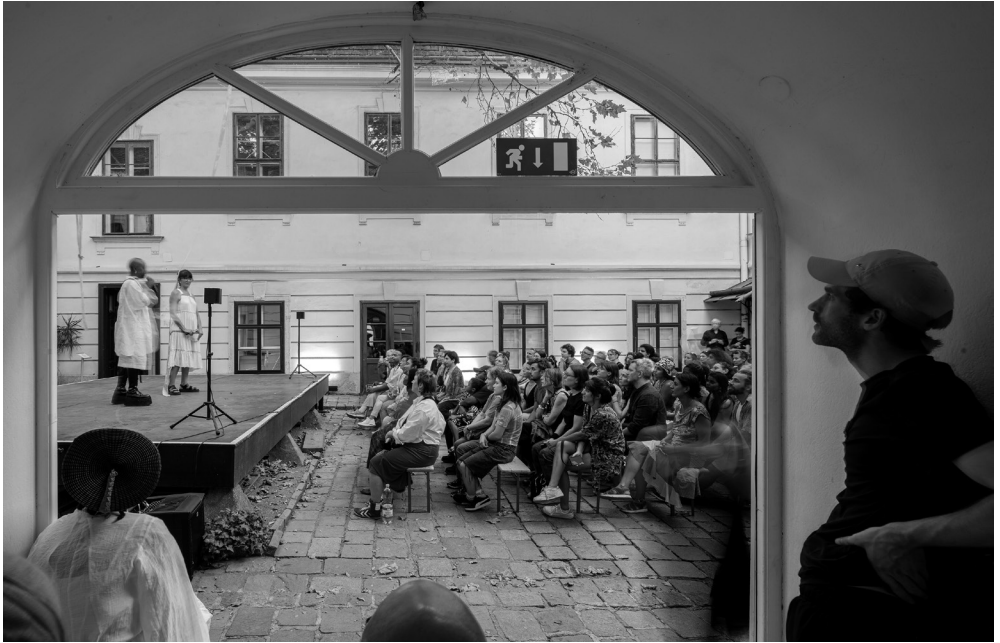
Die jetzige Werkstatt/Tischlerei mit Blick in den Innenhof.

Jedes Nachbarschafts-Projekt, jede offene Werkstatt hat ihr Umfeld, an das sie angepasst ist. Es gibt keine allgemeingültigen Lösungen oder Antworten. Die Bedürfnisse der Menschen und ihre Lebensrealitäten sind sehr divers, auch innerhalb von Gruppen, die wir von außen als einheitlich wahrnehmen.