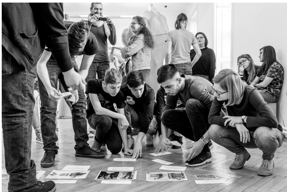
Gestaltungsraum Museum.