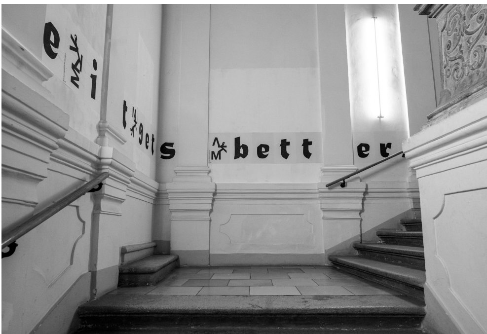
before it gets better ...

Informationen, Programm & alle Termine im gelben Programmheft und: volkskundemuseum.at/before_it_gets_better