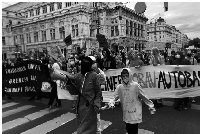
Aktivismus Camp.