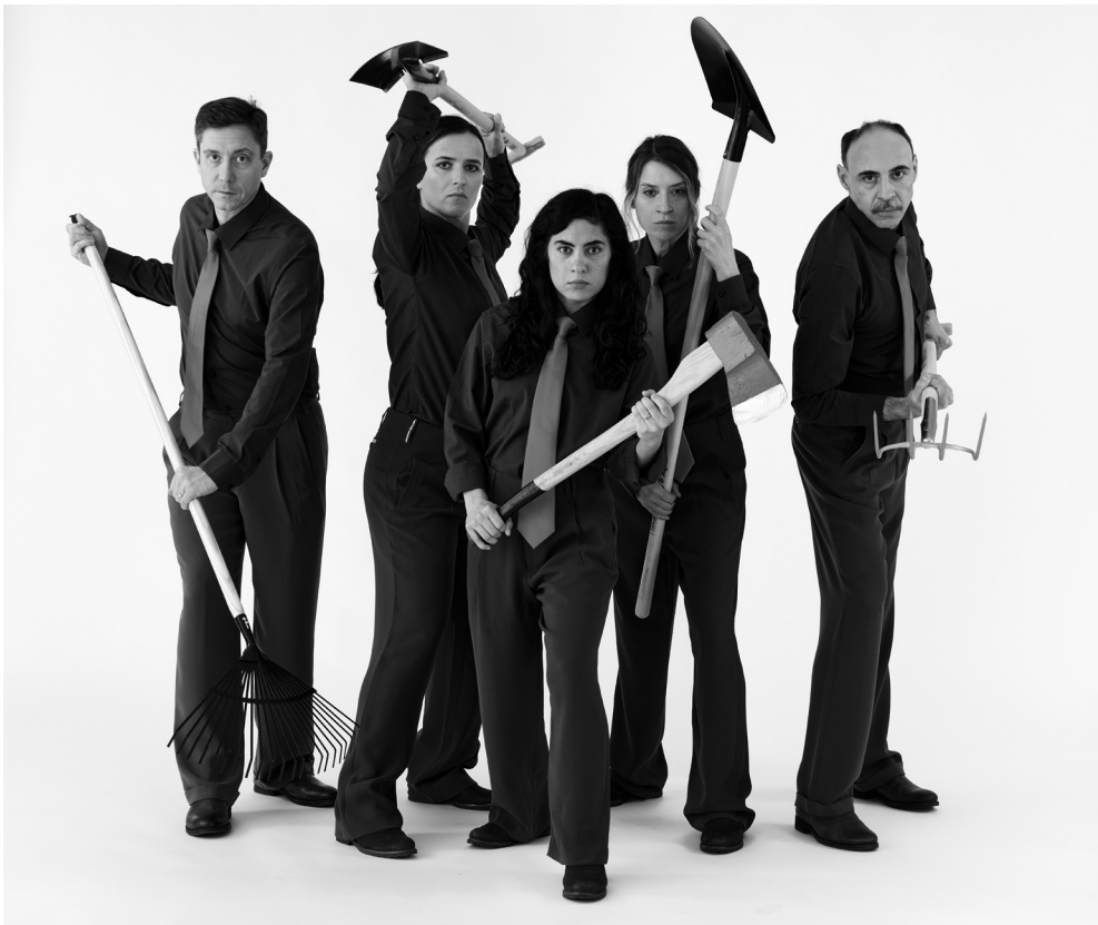
Kommt und wartet mit uns! Auf wen? Auf die Barbaren. Ab 29.4. bis 12.5. im Luftschutzbunker unter dem Schönbornpark aka Festung Österreich.

Die Performance-Installation Warten auf die Barbaren findet in einem echten Bunker statt. In der Tiefe, unter einem Spielplatz, wird das Publikum mit seiner eigenen Furcht konfrontiert – der Furcht vor dem Anderen. Es ist die ironische Ausformung eines „Kenne deinen Feind“-Trainingscamps in mehreren Stationen. Wer sind diese Barbaren? Weshalb ängstigt uns ihre Ankunft so sehr? Warum brauchen wir die imaginären Barbaren, um unsere eigene Güte, Kultur, Identität zu