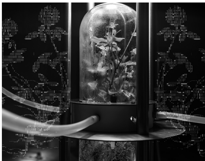
Anatomy of a Symbiosis.

Ein Projekt von Czirp Czirp Kuratorin: Lona Galkis, Künstler*innen: Saša Spačal (SI), Jiří Suchánek (CZ), Leslie Garcia vom Kollektiv Interspecifics (MX), Produktion: Enrique Guitart. Gefördert aus Mitteln des Bundesministeriums für Kunst, Kultur, öffentlichen Dienst und Sport (BMKÖS), der Stadt Wien MA 7 Kultur sowie der Bezirkskultur Josefstadt. In Koproduktion mit dem Volkskundemuseum Wien.