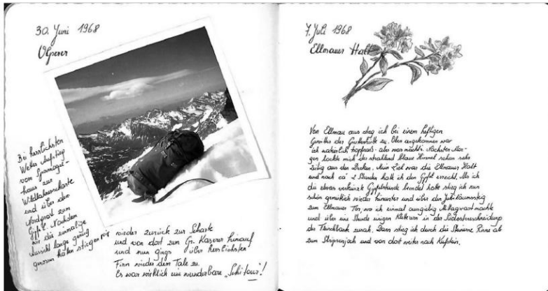
Abb. 3: Doppelseite aus dem Tourenbuch von Cilly Haider, 30. Juni 1968, Privatbesitz © Museum Wattens

müde – schnell einige Becher Suppe und dann nichts wie hinein in den Schlafsack. Nächsten Morgen erlebten wir einen wundervollen Sonnenaufgang, doch dafür herrschte auch grimmige Kälte und einigemale [sic] blieben wir auf dem Weg zum Gipfel stehen, um unsere starren Gliedmaßen zu massieren. Am frühen Nachmittag hatten wir es dann geschafft, es ist ein herrliches Gefühl so auf dem Gipfel zu stehen ringsherum Berge nichts als Berge mit riesigen [sic] Eisflanken und Hängegletschern. Eine halbe Stunde blieben wir so sitzen nur um zu schauen. Doch dann begann der Bibber an den Füßen zu knabbern und es wurde Zeit wieder an den Rückweg zu denken [...]“,