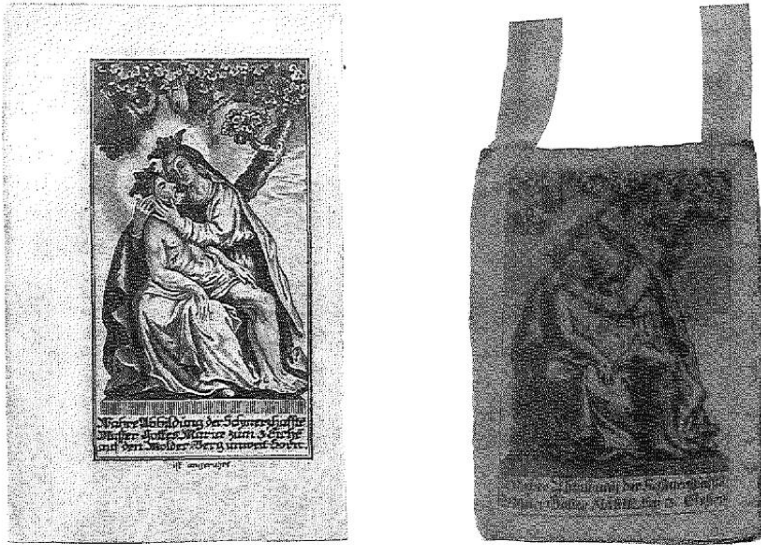
Abb. 3: Unbezeichnete Wallfahrtsbilder. Kupferstiche des 18. Jahrhunderts auf Papier (links) und roter Seide (rechts).

als Skapulier belegt sind, aus dem 18. Jahrhundert. Dargestellt ist durchwegs das Gnadensbild mit den drei Eichenstämmen (Abb. 3). Etwa fünfzehn verschiedene Bildtypen 25 im Kupferstichverfahren oder als Holzschnitt produziert wurden bisher festgestellt. Bedeutende Kupferstecher wie Martin Engelbrecht (1684–1756), Franz Leopold Schmitner (1703–1761) und Johann Martin Will (1765–1805) haben für Maria Dreieichen gearbeitet. 26 Ein Teil dieser Produkte weisen aber keine Angaben zu den Künstlern auf. Diesen wenigen Nachweisen des 18. Jahrhunderts steht eine unglaublich große Zahl an Wallfahrtsbildchen, Marienbriefen und Gebetszetteln des 19. Jahrhunderts gegenüber. Bereits in der Biedermeierzeit ist dieser Aufschwung deutlich bemerkbar. Die verbesserten Produktionsmethoden