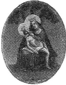
Abb. 2: Miniaturbild des 19. Jahrhunderts. Ölmalerei auf Blech eines unbekanntes Künstlers.

Liedern besonders stark vertreten. Als Besonderheit sind einigen Texten auch die Melodien beigegeben. Wallfahrtslieder wurden auch im 19. und 20. Jahrhundert verlegt, man kennt unter anderem Exemplare aus einer nicht näher bezeichneten Znaimer Druckerei 17 und einen unbezeichneten Druck, der aber von Ferdinand Berger 18 in Horn stammen dürfte.