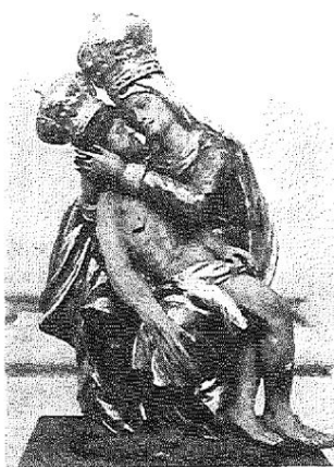
Empfang der heiligen Sakramente in der Basilika Maria - Dreieichen

O Schmerzensmutter, sieh uns hier In Reu' zu Deinen Füßen. Um Deine Hilfe flehen wir, Vertrauend wir Dich grüßen. Das angsterfüllte Menschenherz Hat Trost bei Dir gefunden. Nun wendet es sich himmelwärts - O laß es ganz gesunden! Unwiederbringlich ist die Zeit, Wohl uns, wenn wir sie nützen! Wenn mutig wir in Kampf und Streit Auf Deine Hand uns stützen! Und liegen wir in Todesnot, Wenn alle Freunde schwinden, Streh' bei, daß wir beim Abendrot zur ew'gen Heimat finden.