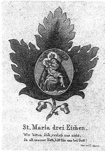
Abb. 6: Wallfahrtsbild (Stahlstich aus der Zeit knapp nach 1850) in Eichenblattform des Verlages F. Glaser, Linz.