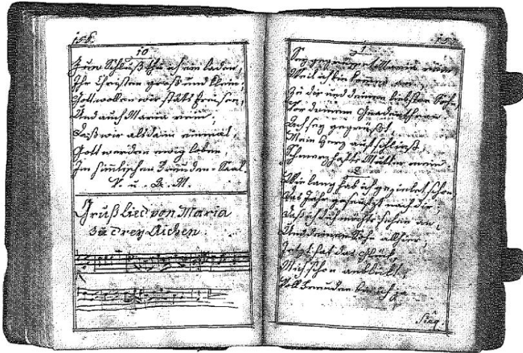
Abb. 1: Maria Dreieichen – Lied aus einem handschriftlichen Liederbuch des späten 18. Jahrhunderts.

Der Horner Buchdrucker Joseph Hengsberger 15 brachte im späten 18. Jahrhundert „Drei schöne neue Geistliche Lieder, von der schmerzhaften Mutter Gottes bei den drey Aichen, unweit von Horn, an dem Moldterberg von dessen Ursprung und Herkommen“ heraus. Das Titelblatt dieses Flugblattdruckes ziert ein Holzschnitt, darstellend die drei Eichen und davor das Gnadenbild unter einem Baldachin. Diese Dreieichenlieder wurden während der Wallfahrtsreise tatsächlich gesungen und haben ihren Niederschlag in den handschriftlichen Liederbüchern der Vorsänger/Vorbeter gefunden. Ein solches Buch 16 aus dem späten 18. Jahrhundert enthält neben allgemeinen geistlichen Liedern solche für Mariazell, Maria Taferl, Sonntagberg und Maria Dreieichen (Abb. 1). Letzterer Ort ist mit neun