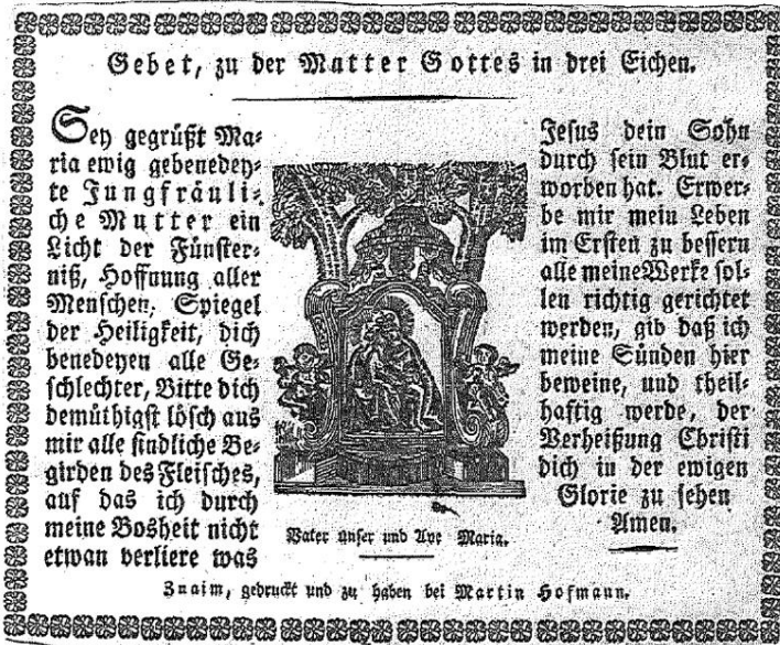
Abb. 4: Gebetszettel (Holzschnitt und Typendruck) aus der Mitte des 19. Jahrhunderts des Verlages und der Druckerei Martin Hofmann in Znaim.

ermöglichten eine weitere Steigerung der Andachtsbildproduktion, die für Maria Dreieichen anscheinend voll genützt wurde und wohl auch dem Bedarf entsprach. Ein Vergleich 27 mit Maria Taferl zeigt, dass in dieser Hinsicht im 19. Jahrhundert durchaus ein Gleichstand zwischen den beiden Konkurrenten anzunehmen ist. Die Andachtsbildproduktion, die jetzt großteils in der Hand spezialisierter Verleger war, wurde kommerziell abgewickelt. Verlage in Prag, Linz, St. Pölten und Wien, um nur einige Standorte zu nennen, beherrschten das Geschäft bis etwa 1870. Bildchen im Kupfer- oder Stahlstichverfahren, Holzschnitt oder als Steindruck hergestellt, sind für Maria Dreieichen keine Seltenheit (Abb. 4). In dieser Zeit sind als Neuheit Bildchen mit Darstellung der Ursprungslegende 28 aus den Verlagen