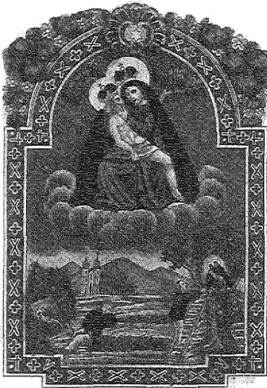
Ursprung von Maria drei Eichen.

Abb. 5: Wallfahrtsbild mit Darstellung der Ursprungslegende aus der Mitte des 19. Jahrhunderts. Kolorierter Stahlstich, bezeichnet Chrudim b. Patzak (Nr. 128).