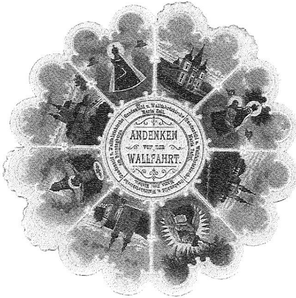
Abb. 8: Mehrortewallfahrtsbild (Rundbild), hergestellt als Chromolithographie, aus dem letzten Jahrzehnt des 19. Jahrhunderts. Dargestellt sind in acht Bildern die Kirchen und Gnadenbilder von Mariazell; Maria Taferl, Sonntagberg und Maria Dreieichen. Keine Verlagsangaben vorhanden.

Hofmanns Witwe, Znaim) hergestellt. Diese mehr oder weniger gleich aussehenden Beichtzettel werden dann im 20. Jahrhundert abgelöst durch im Buchdruck hergestellte Bildchen, welche das normale hochschmale Andachtsbildformat haben. Es gibt einige Typen, meist ist aber die Gnadenstatue auf der Forderseite abgebildet. Ein Typus trägt auf der Rückseite ein bemerkenswertes Gedicht des Lokalhistorikers P. Friedrich Endl. 39