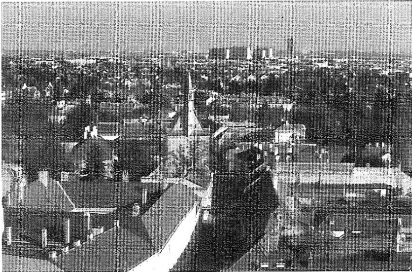
Abb. 1: Perchtoldsdorf. Blick vom Kirchenturm Richtung Wienergasse und Wien. Stadt und Umland sind bereits zusammengewachsen