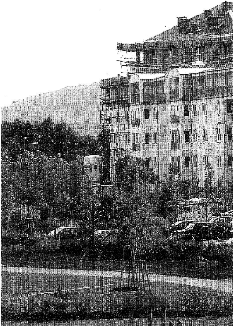
Abb. 5: Wiener Neudorf. Städtische Wohnformen breiten sich im Umland aus