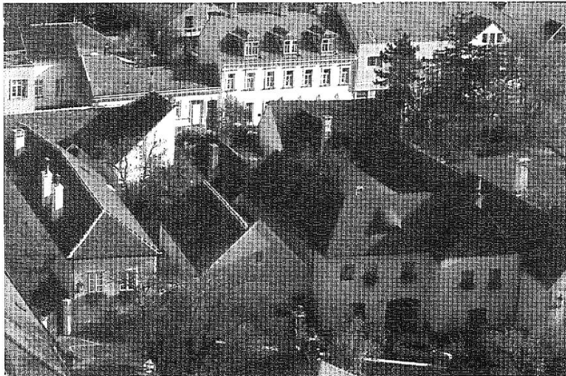
Abb. 2: Perchtoldsdorf. Traditionelle Weinhauerhäuser im Ortskern