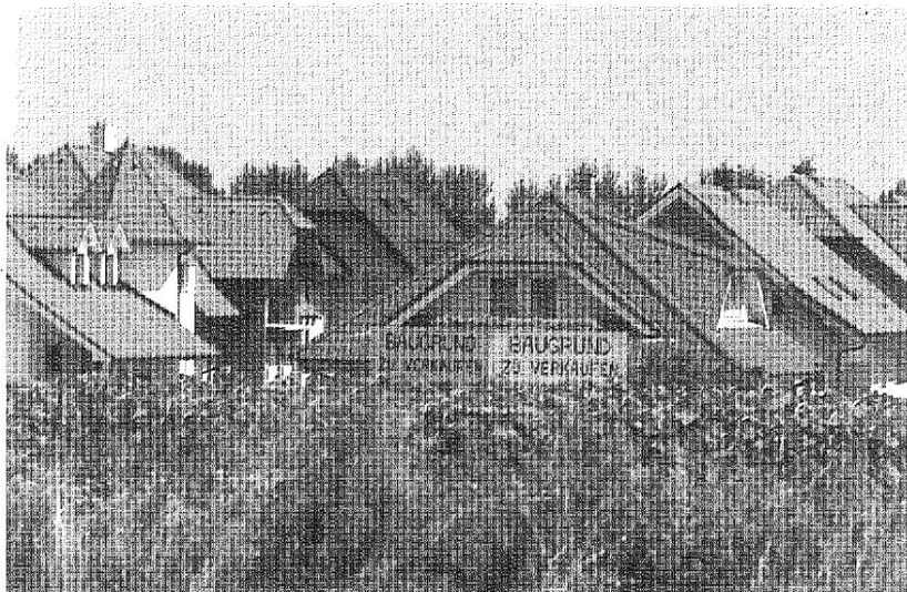
Abb. 4: Guntramsdorf. Ein typisches Bild am Ortsrand vieler Umlandgemeinden