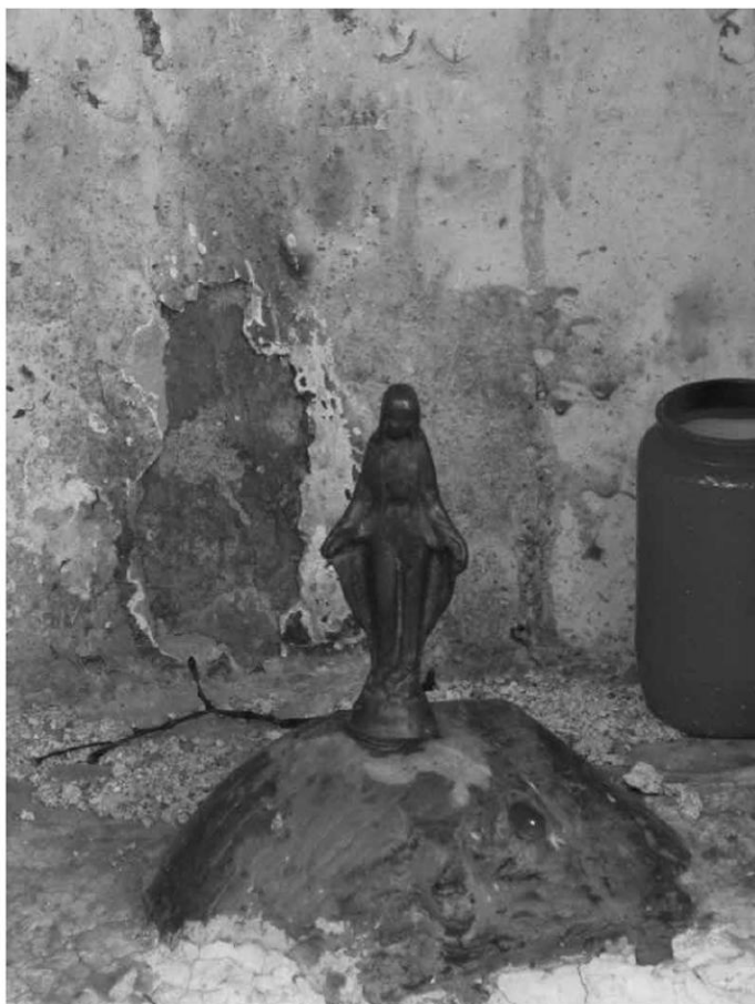
Abb. 4 (Aufnahme 13.6.2010)