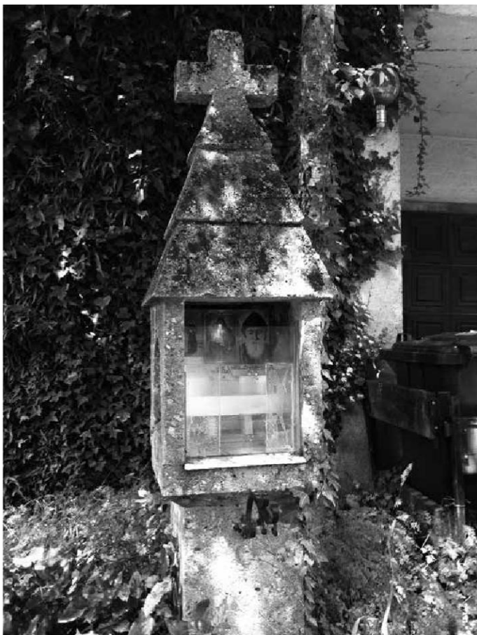
Abb. 6 (Aufnahme 18.6.2013)