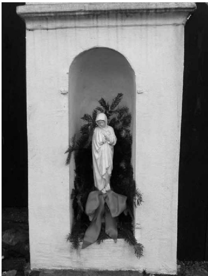
Abb. 9 (Aufnahme 3.12.2014)