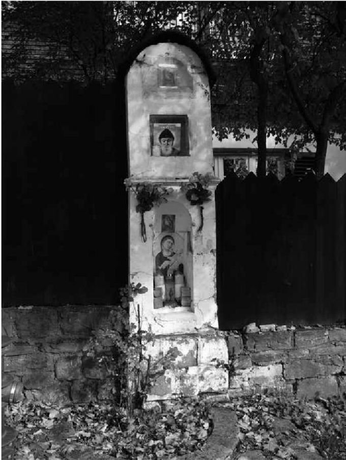
Abb. 3 (Aufnahme 1.10.2007)