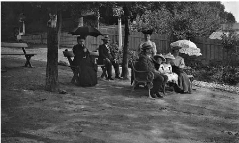
Abb. 2 (Aufnahme um 1910)