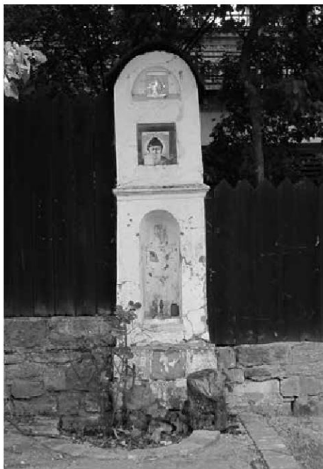
Abb. 7 (Aufnahme 13.6.2010)