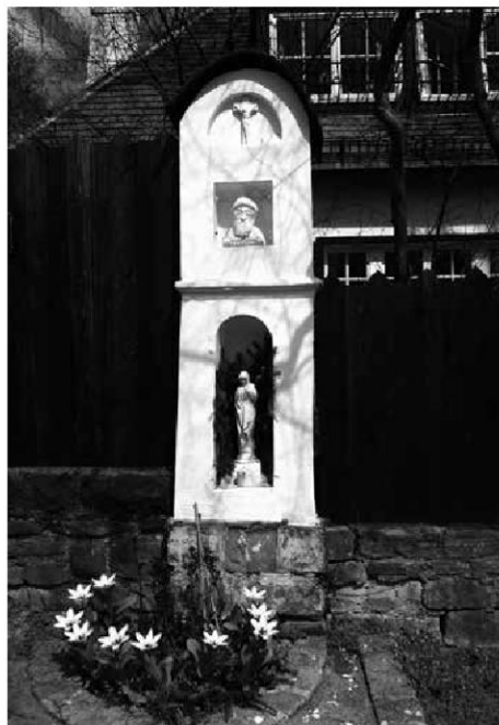
Abb. 8 (Aufnahme 14.4.2013)