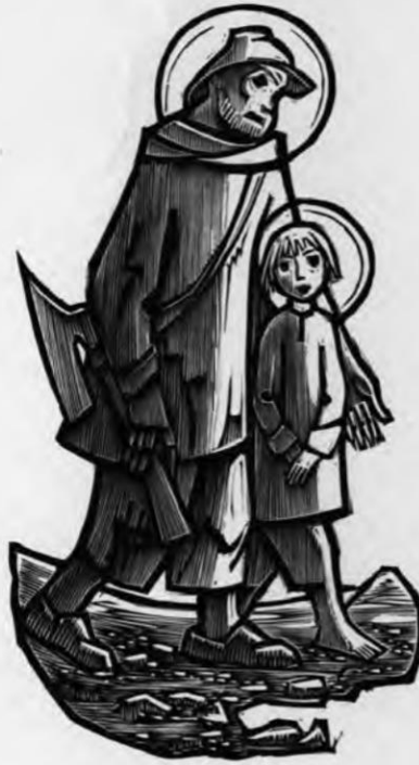
Hl. Joseph mit dem Jesuskind, am unteren Rand beschnittenes Kalenderblatt (März, Festtag des Hl. Josef am 19. März), nach einem Holzschnitt, 20. Jh.