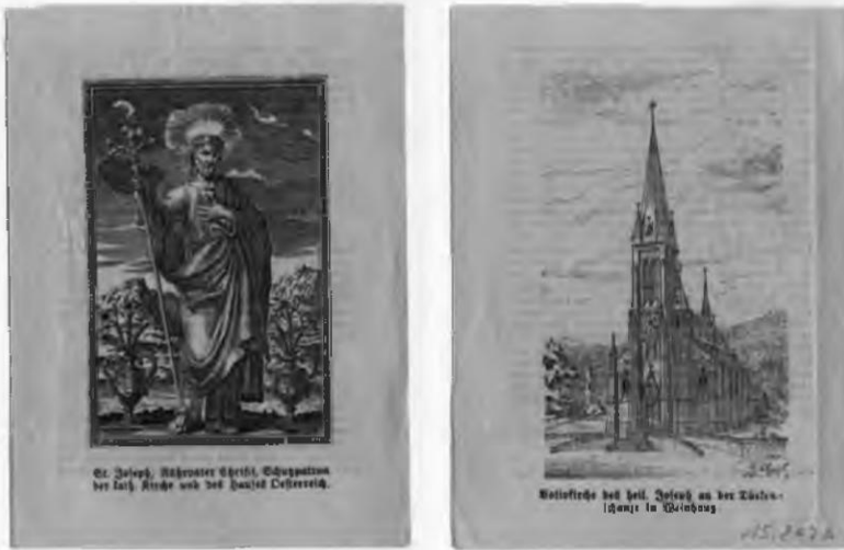
Gedruckter, doppelseitiger Gebetszettel des St. Joseph-Kirchenbau-Vereins mit Darstellungen des Hl. Joseph und der Weinhauser Pfarrkirche Hl. Josef, Wien, um 1880

ebenfalls wieder auf einen »traditionellen« Tag zurückgegriffen hatten. Der 1. Mai galt als Moving Day , ein Tag, an dem alte Arbeitsverhältnisse gelöst und neue geknüpft wurden. Dies jedenfalls war keine zufällige Setzung.