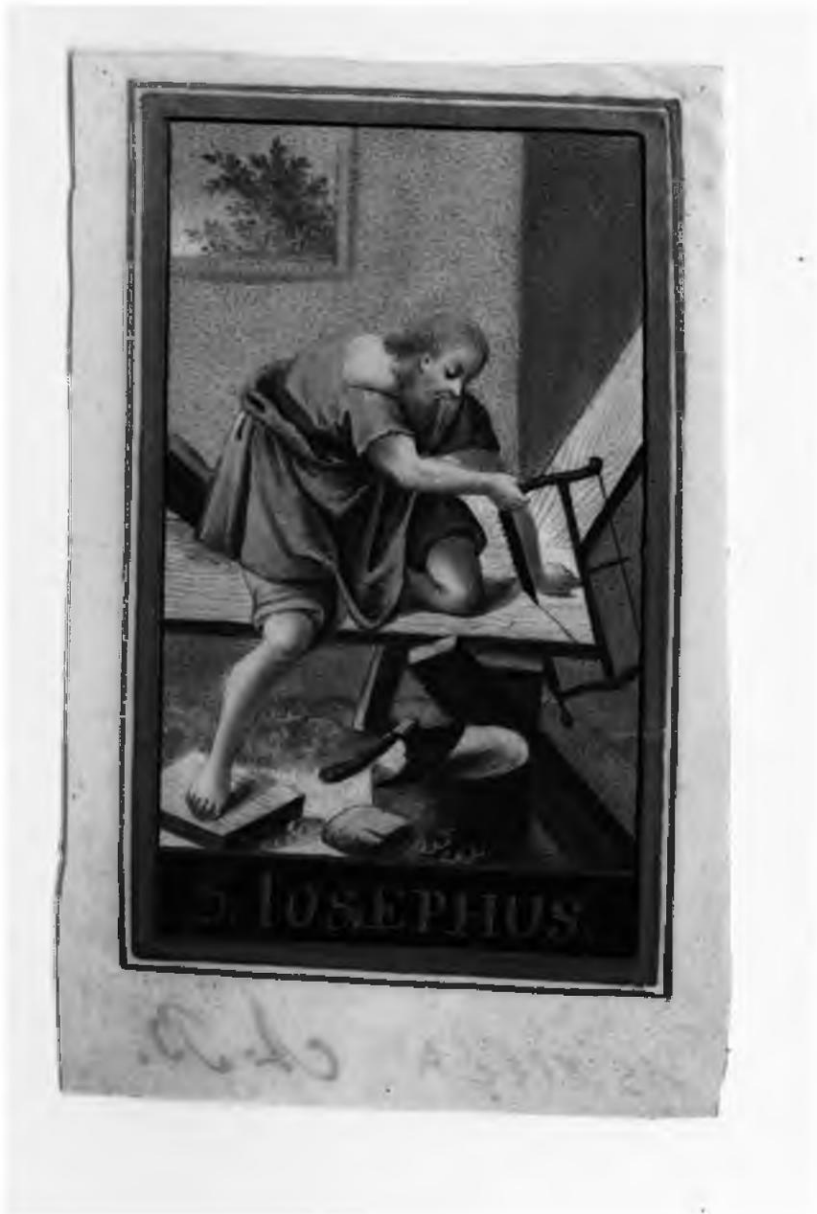
Kleines Andachtsbild: Hl. Joseph als Zimmermann, mehrfarbige Gouache auf Pergament, 18. Jh., Slg. Gugitz