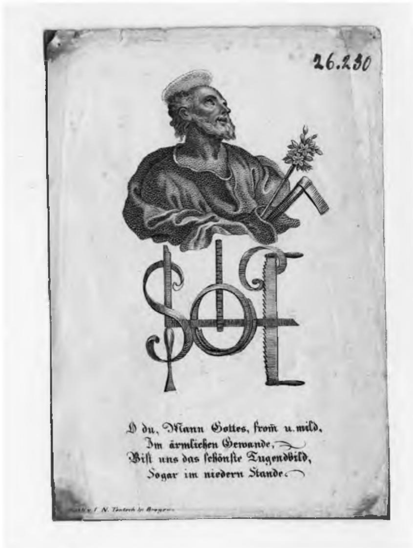
Kleines Andachtsbild: Hl. Joseph mit Zimmermannswerkzeugen in Form eines Anagramms, Lithographie, Bregenz, 19. Jh.