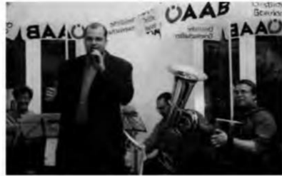
»Fest der Arbeit« der ÖAAB Landesgruppe Wien im Johann-Gassner-Haus, 1080 Wien, Laudongasse 16, 2003