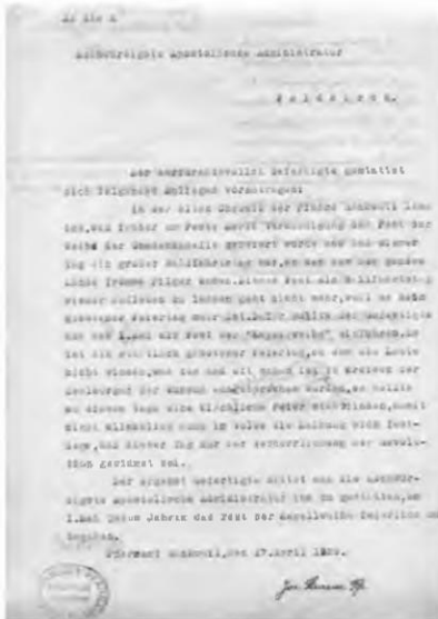
Schreiben des Pfarrers von Rankweil an die Apostolische Administrator, Feldkirch, 17. April 1929

santenzahlen auf die Straße, wie, vermutlich 1955, vor der Parteizentrale im Palais Todesco gegenüber der Oper und vor dem gerade in Bau befindlichen Opernringhof aufgenommene Fotos zeigen. Die Sehnsucht nach Freiheit von den Besatzern mobilisierte die Massen. Die ÖVP forderte zudem Freiheit für ihre christlichen Grundsätze, die SPÖ die Erneuerung der internationalen Solidarität der Arbeiterschaft.