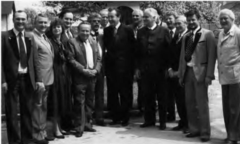
Die Favoritner Bezirksmandatäre mit Bundesparteioibmann Dr. Alois Mock bei der ÖAAB-Fahrt zum 1. Mai 1986 zur Ostarichi-Gedenkstätte in Neuhofen a. d. Ybbs, NÖ