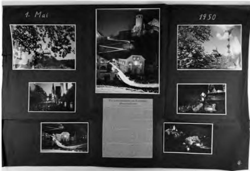
Albumblatt der Lichterprozession zur Landeswallfahrt in Rankweil, 1. Mai 1950

die am 1. Mai ausfallende Arbeitszeit innerhalb zweier dem Feiertag vorangehender oder nachfolgender Arbeitswochen einzubringen hätten.