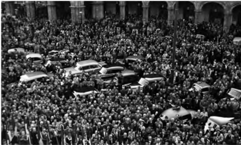
ÖVP-Versammlung zwischen der Staatsoper und dem Palais Todesco, um 1955