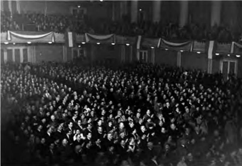
Maifeier der ÖVP im Konzerthaus, Großer Saal, um 1950