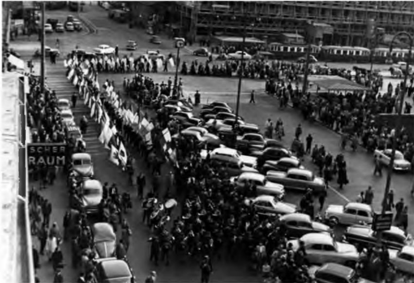
Aufmarsch der ÖVP über die Ringstraße zur Parteizentrale im Palais Todesco, um 1955