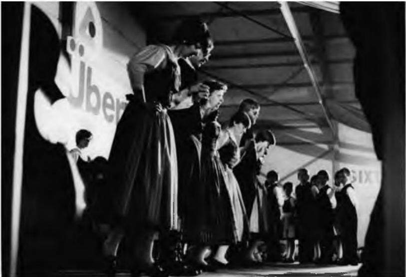
Volkstanzgruppendarbietung bei der Maikundgebung der ÖVP in Pinkafeld, 1977