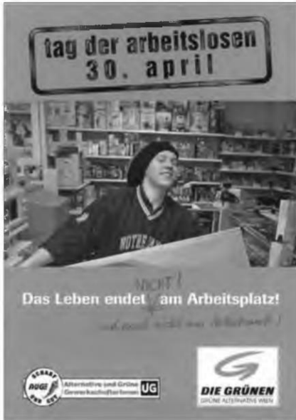
Titelblatt des Programmhefts der Grünen zum »tag der arbeitslosen« am 30. April 2004