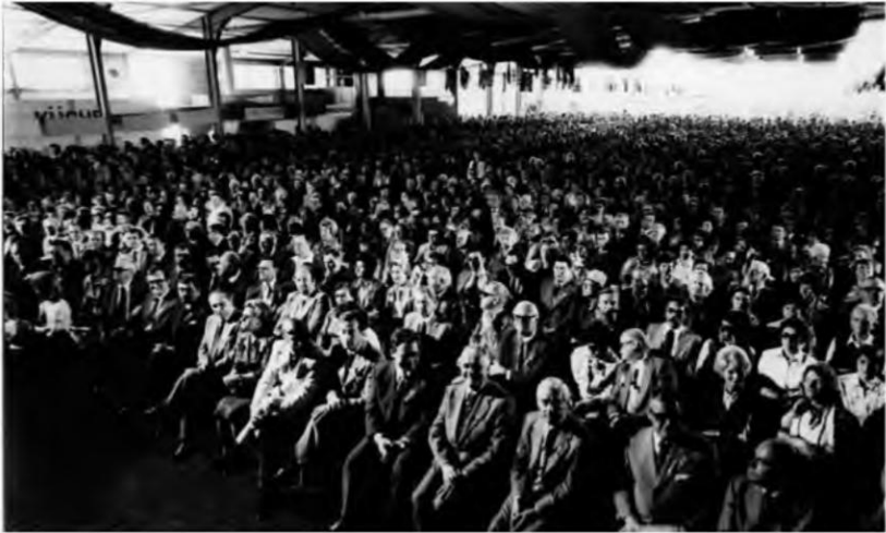
Maikundgebung der ÖVP in Pinkafeld, 1977, in der ersten Reihe u.a. ÖAAB-Bundesobmann Dr. Alois Mock, ÖVP Wien, Landesparteiobmann Dr. Erhard Busek, Landesobmann des Wiener ÖAAB, Fritz Hahn