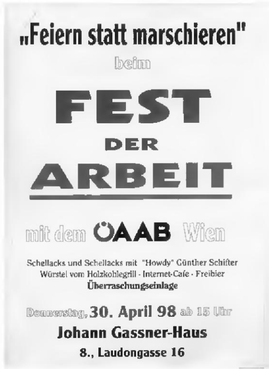
Einladung des Wiener ÖAAB zum »Fest der Arbeit« 1998

Der Arbeitnehmerinnen- und Arbeitnehmerbund Favoriten lädt seit vielen Jahren am 1. Mai zu einem Ausflug ein. Mit Bussen oder Sonderzügen reiste man dabei zu Ausstellungen und Gedenkstätten im niederösterreichischen und burgenländischen Umland. 1990, im ersten Jahr nach der Öffnung der Grenzen, beging man den Tag unter großer Beteiligung festlich mit den slowakischen Christdemokraten in Bratislava und seither werden die Reiseziele auch in die umliegenden Nachbarländer ausgedehnt. Heuer, 2010, ist das ungarische Győr als Ziel geplant. All diese Veranstaltungen haben nicht den demonstrativen Charakter und die dementsprechende Öffentlichkeitswirksamkeit wie die sozialdemokratischen 1. Mai-Feiern, dienen jedoch wie diese der politischen Selbstvergewisserung und Gemeinschaftsbildung.