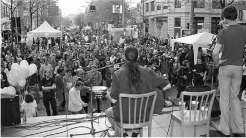
»tag der arbeitslosen« am 30. April 2005