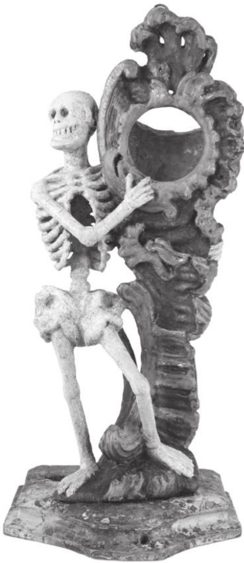
Habaner Krug. Keramik, Fayence, 1710 bis 1720, Slowakei. ÖMV/14.085 Volkskundemuseum Wien