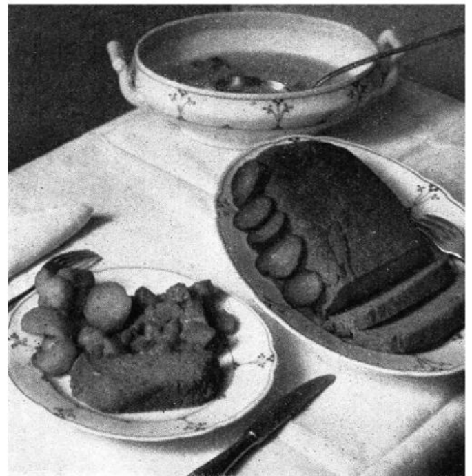
Passierte Sojakörner-Suppe, Soja-Braten mit Gurkerln; braun gedünstete Rüben oder Kartoffeln.

Abbildung aus Friedl Brillmayer/ Henriette Cornides „Wiener Soja-Küche“ von 1948