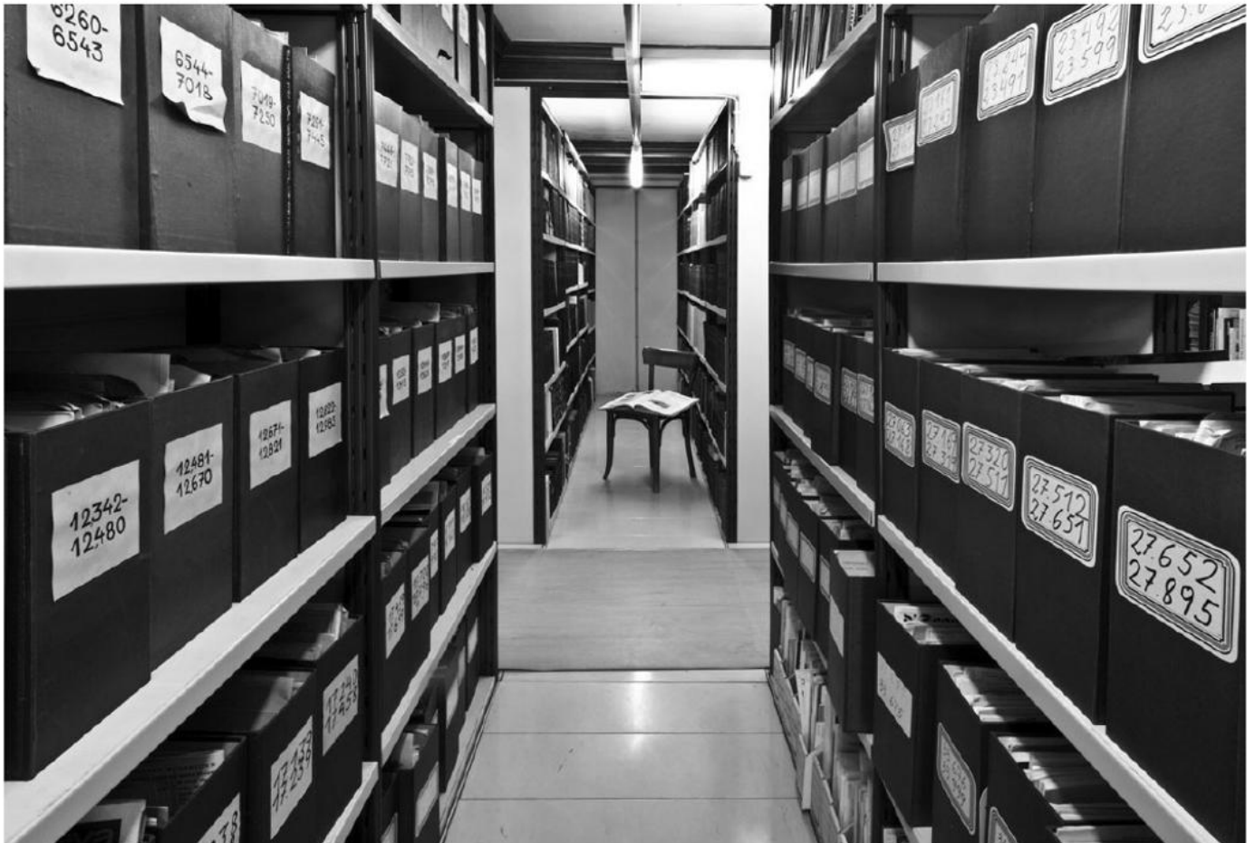
Bibliotheksspeicher des Volkskundemuseum Wien

Steinmann, Axel (Hg.): Verhüllt, enthüllt! Das Kopftuch. Erscheint anlässlich der gleichnamigen Ausstellung vom 18. Oktober 2018 bis 26. Februar 2019 im Weltmuseum Wien. Wien, Sonderzahl, 2018. 167 S.