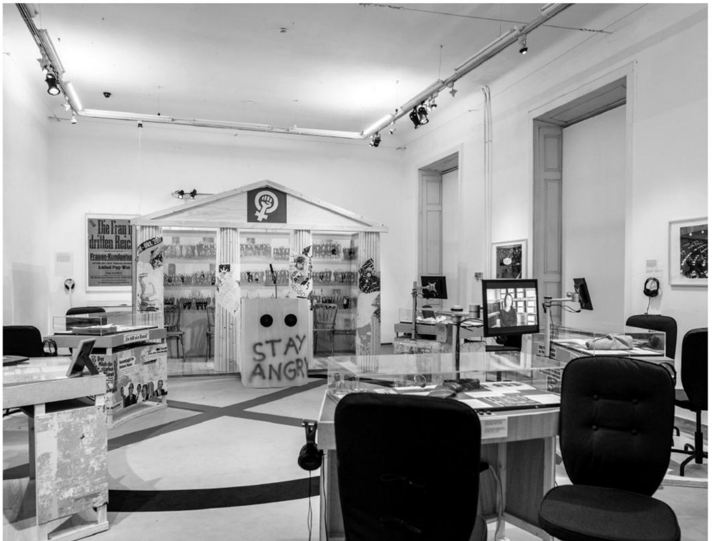
Orte des Frauenwahlrechts: Das Parlament

„Behüte der Himmel! Sie meinen es politisch!“ schrieb Karl Kraus 1907 über die Frauenwahlrechtskämpferinnen und offenbart damit, welche Widerstände die Akteurinnen überwinden mussten. Die Ausstellung schafft Einblicke in die Kämpfe