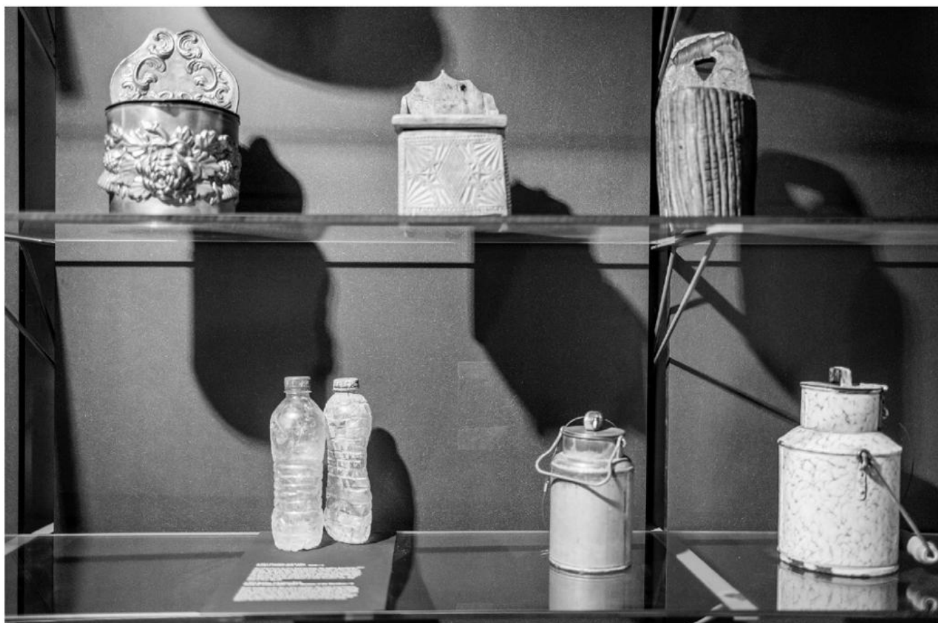
Objekte mit Fluchtgeschichte in der Schausammlung des Volkskundemuseum Wien