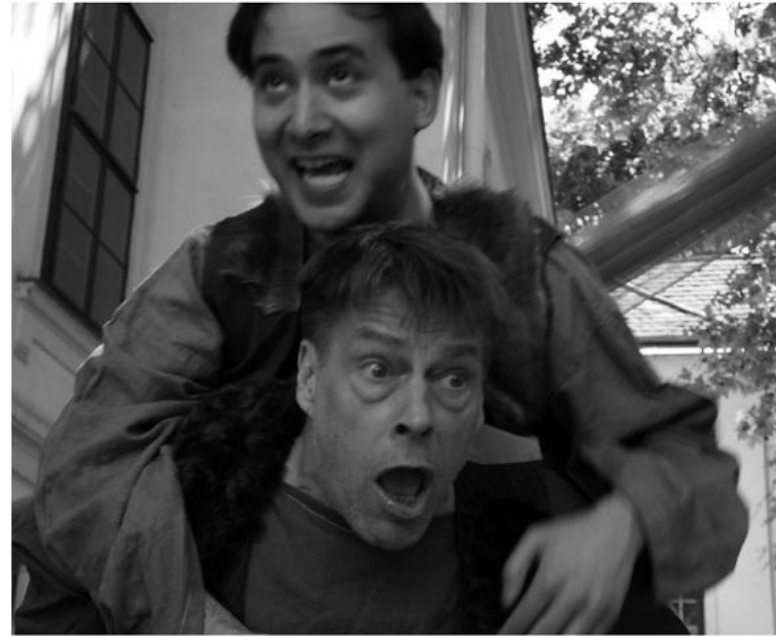
Sommertheater im Innenhof

Gemeinsam mit dotdotdot laden wir alle FreundInnen und NachbarInnen zum Som-