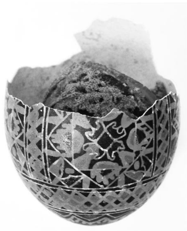
Ein Blick in die Ostereier-Sammlung.

Die Reinigung der filigranen Stücke erfolgte durch die angehende Restauratorin Anett Beckmann. Das war eine zwar interessante, teilweise aber auch schmutzige Angelegenheit, wenn verrottete Dotterreste aus den zersprungenen Eischalen entfernt werden mussten. Monika Maislinger fand gemeinsam mit der Museumsmitarbeiterin Barbara Varga durch Recherchen und