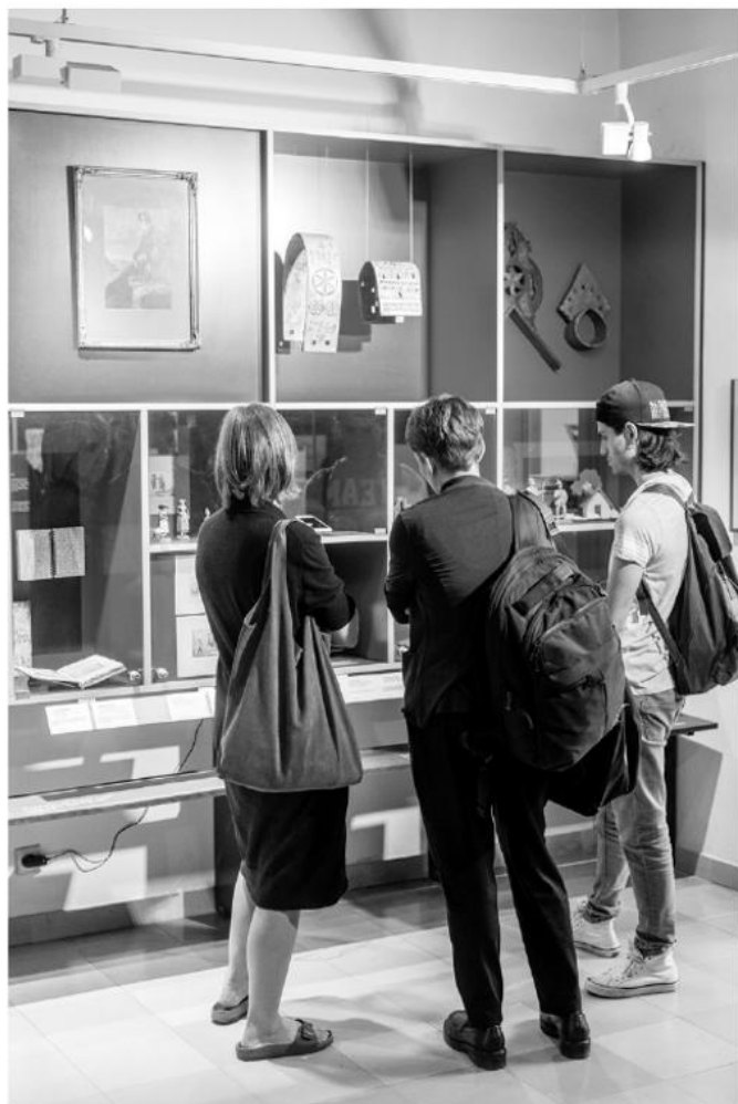
In der neuen Schausammlung des Volkskundemuseum Wien: Die Küsten Österreichs

Unter dem Motto „Lasst die Nachbarschaft erblühen!“ beteiligt sich das Volkskundemuseum Wien am Europäischen Nachbarschaftstag in der Josefstadt gemeinsam mit anderen Institutionen mit einem eigenen Stand in der Zeltgasse zwischen Strozsigasse und Piaristengasse. Das Vermittlungsteam bietet Kräutersäfte zur Verkostung an, mit Kräutern aus dem Museumsgarten, und stellt mit den BesucherInnen gesunde „Geschlecke“ her.