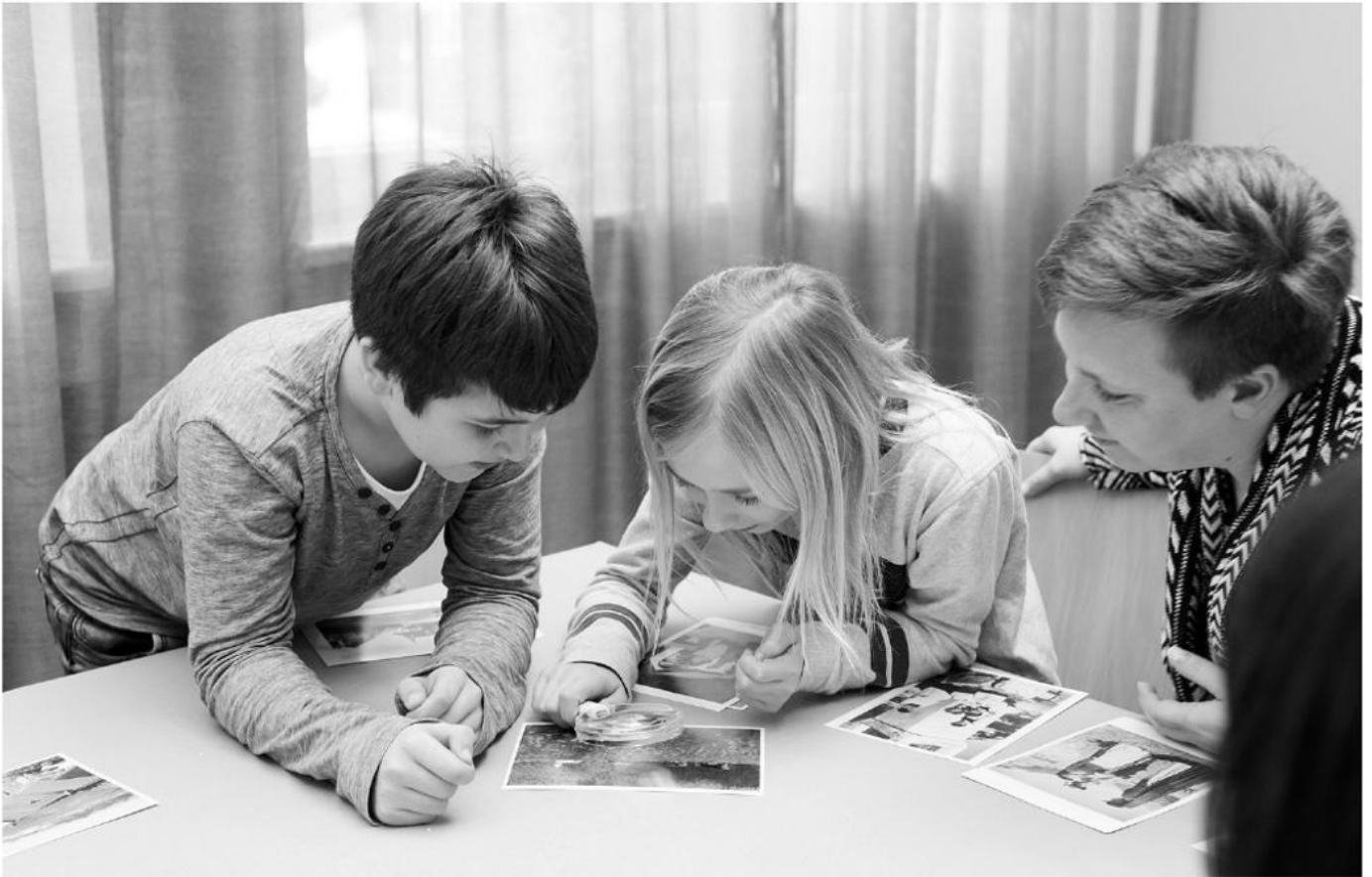
Sprechen über Sehnsuchtsbilder vom Land.