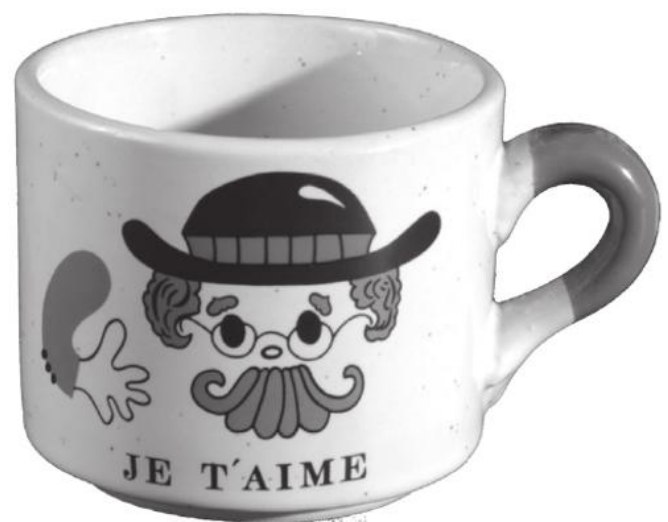
Tasse aus zweiteiligem Set. Je t'aime, Steingut glasiert, 20. Jh. ÖMV/84.450 Volkskundemuseum Wien

Wo können wir also diese Relikte einer Sommerfrische einordnen? Stehen diese „Häferln“ nicht etwa einfach für Gefühlswelten, die durch keine Moderne wegzurationalisieren waren: Glaube, Liebe, Hoffnung und Schönheit.