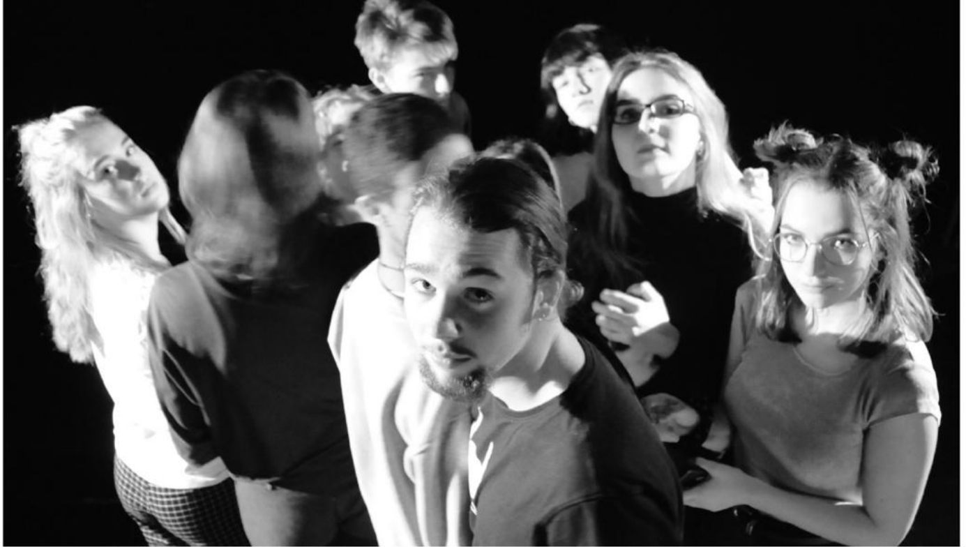
Culture Connected-Performance „FAKE REPORTS“