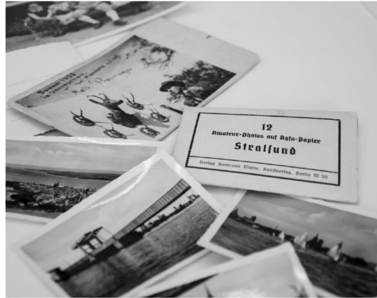
Johanna Höpler, Tinatin Natsvlishvili, Vom Gebrauch der Fotografie

Die faksimilierten Bilder an den Wänden ergänzen die Vitrinen bei ausgewählten Themen und geben zudem einen Einblick in die sich wiederholenden Motivstrukturen der privaten Fotografie.