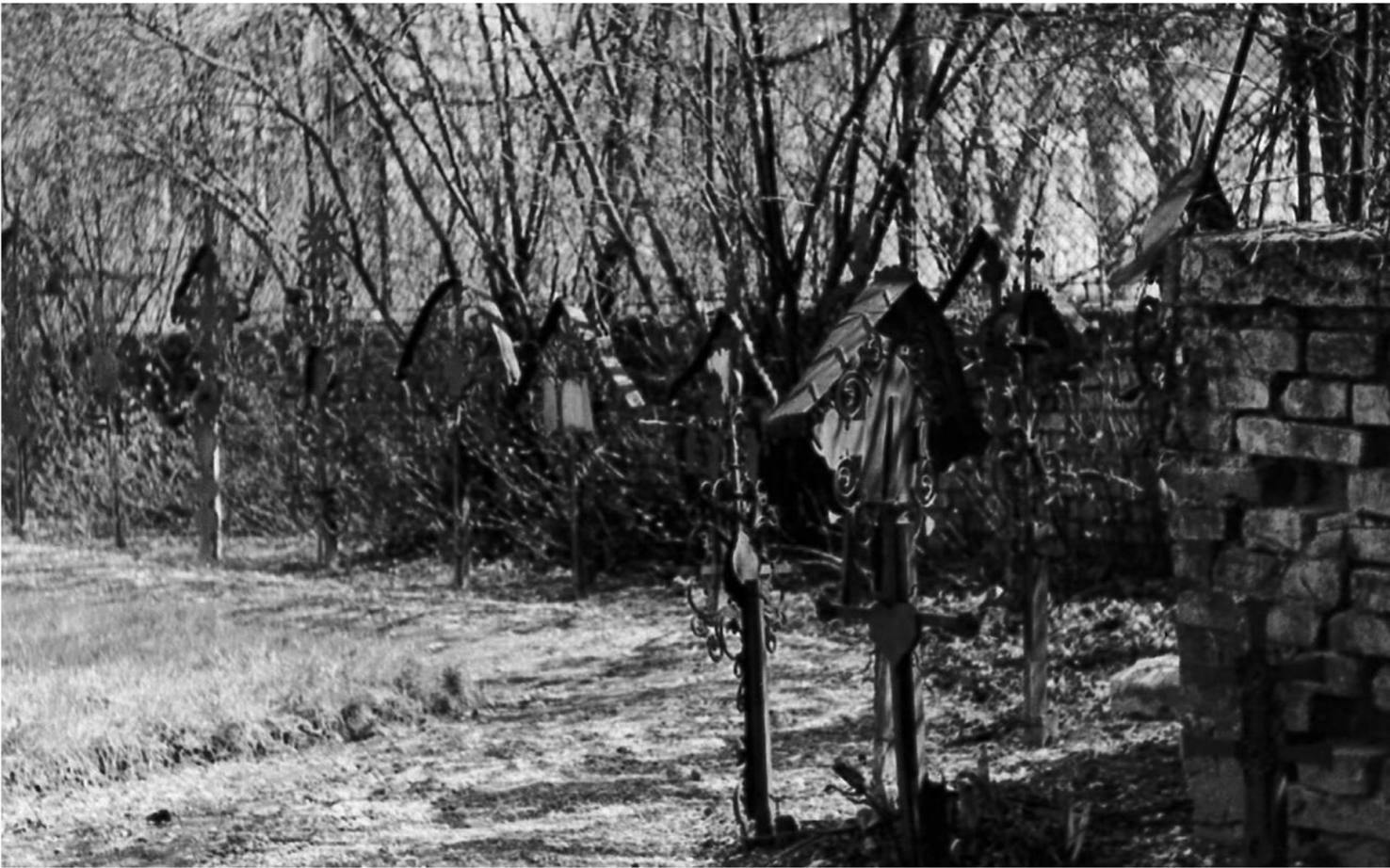
Grabkreuze im Hofe des ÖMV“, 1962, Foto: Leopold Schmidt © Volkskundemuseum Wien