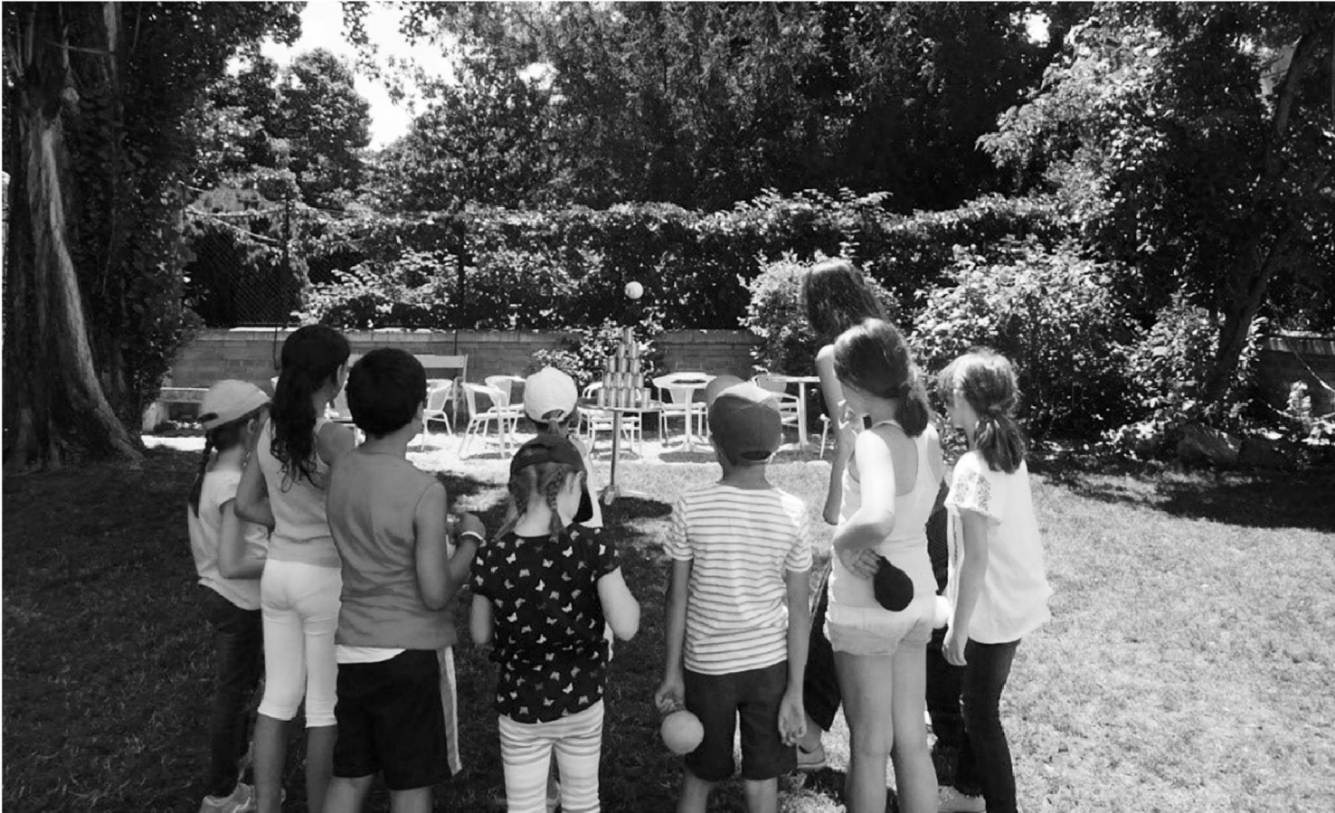
Sommerferienspiel 2016