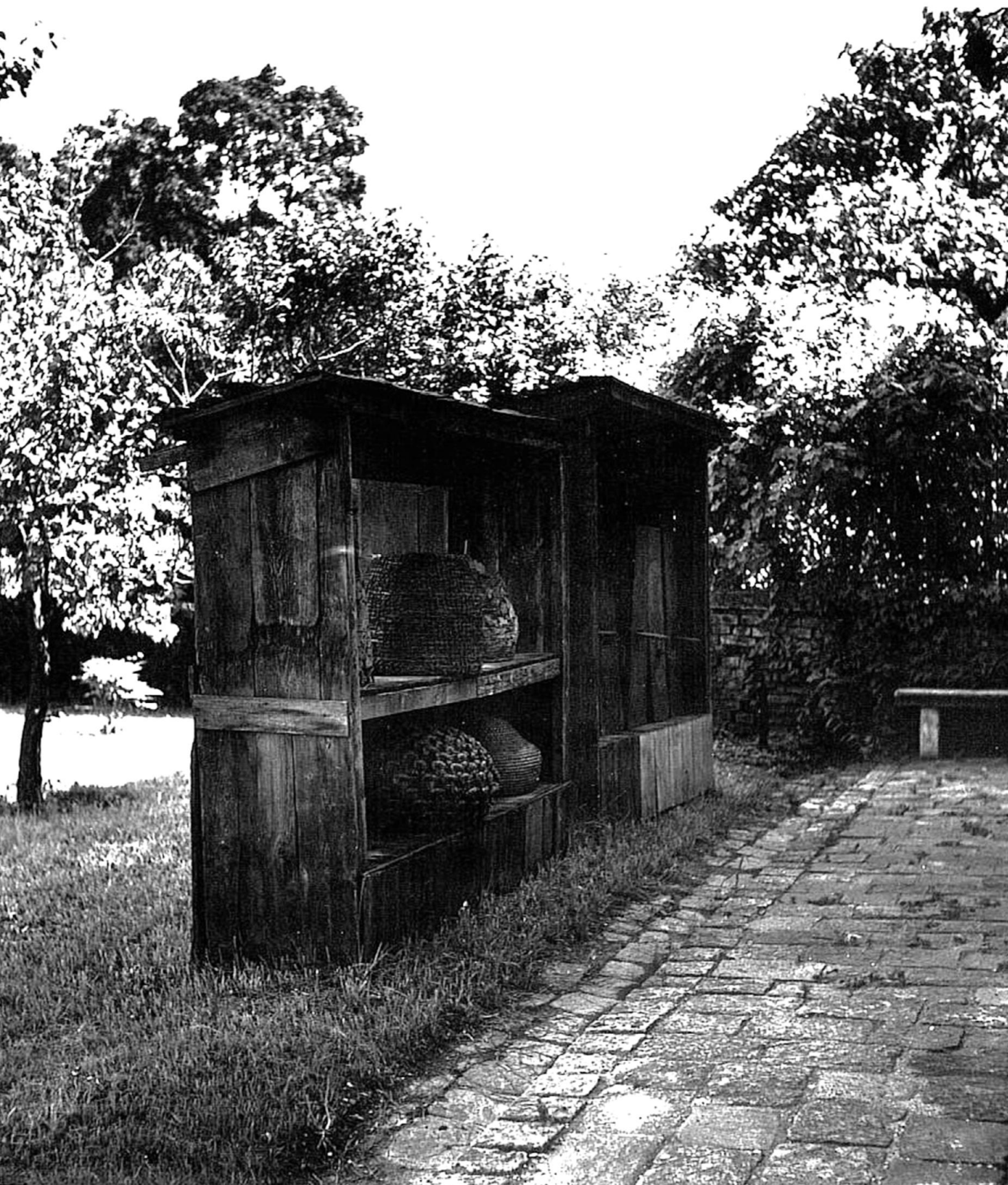
„Bienenstöcke und Bienenkörbe im Museumsgarten“, ÖMV 1959