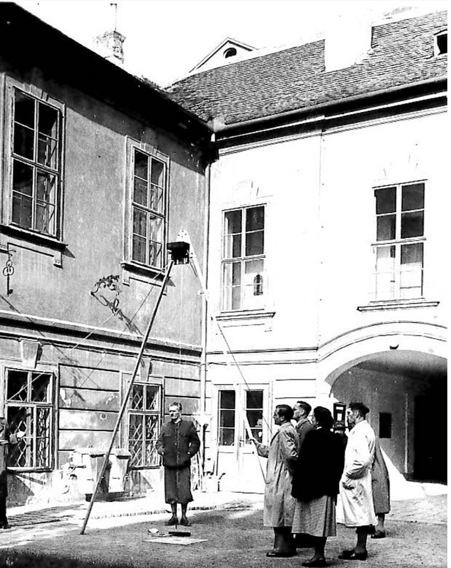
„Vorführung der Boden-Senkrechtaufnahme im Hofe des ÖMV“, 1952