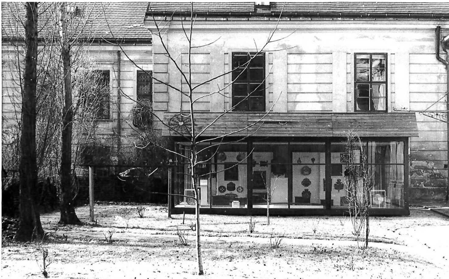
Die Gartenvitrine, 1972 bis 1992