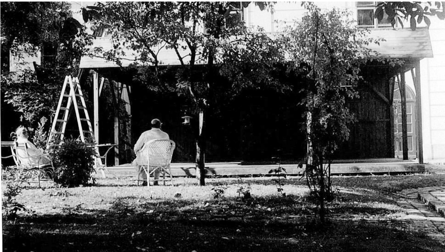
Abbau der Gartenvitrine 1992