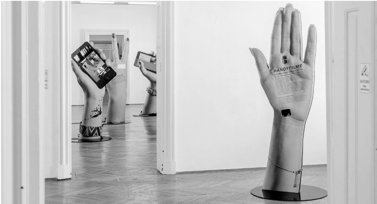
Ausstellungsansicht Handyfilme – Jugendkultur in Bild und Ton, © kollektiv fischka/kramar

Handyfilme sind aus dem Alltag vieler Jugendlicher und Erwachsener nicht wegzudenken. Sie nutzen das Medium auf vielfältige und kreative Weise, um sich mit ihrem Alltag auseinanderzusetzen. Die Schweizer Wanderausstellung „Handyfilme – Jugendkultur in Bild und Ton“ zeigt anhand von aktuellen Beispielen und einer interaktiven Szenographie, zu welchen Gelegenheiten Jugendliche mit ihren Smartphones filmen, welche Videos entstehen und wie sie sich auf die globale Medienkultur beziehen.