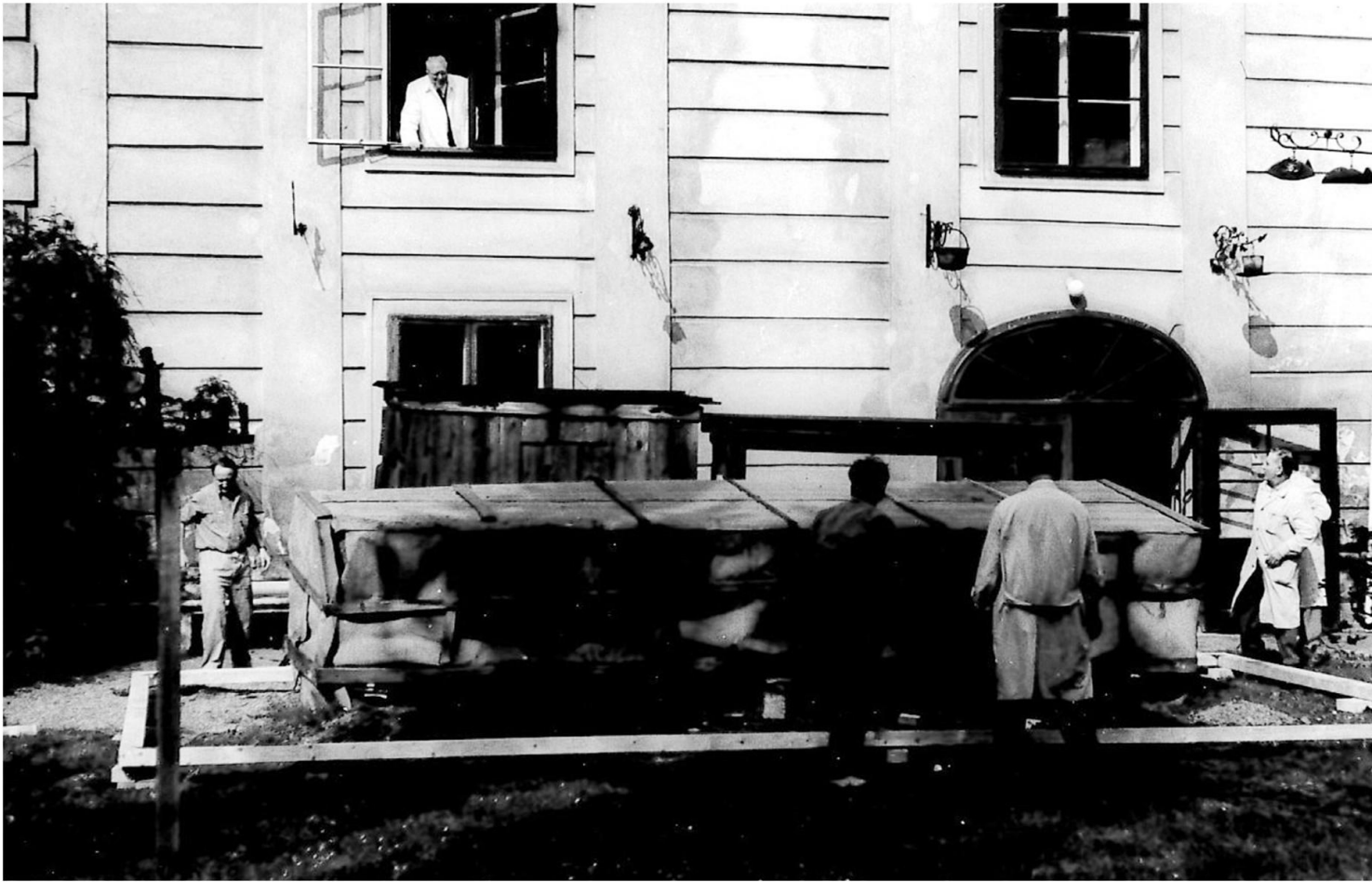
Errichtung der neuen Gartenvitrine“, ÖMV 1972