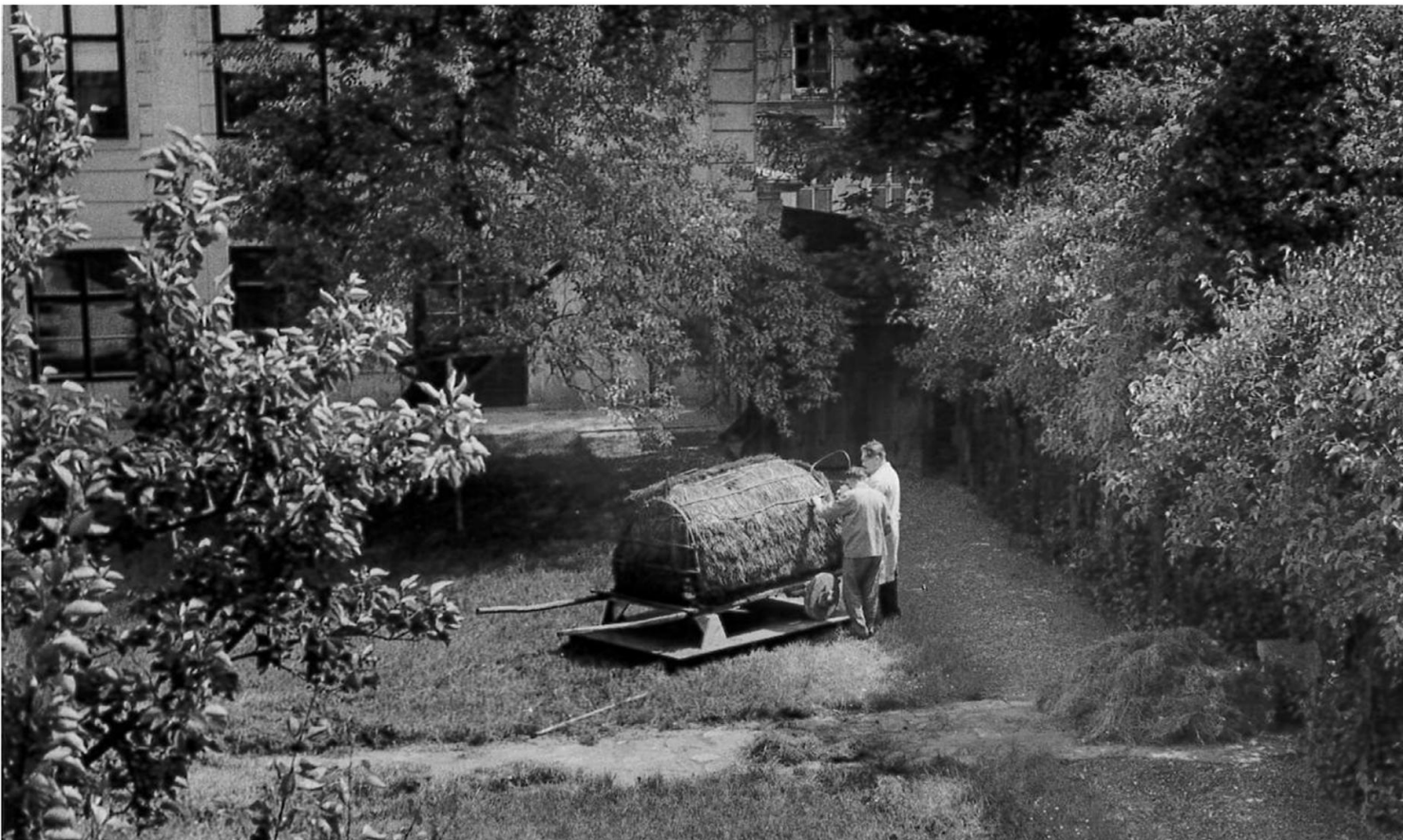
„Wagenwohnung beim Herumziehen auf der Weide verwendet“, ÖMV 1962