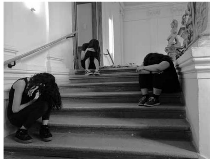
SchülerInnen performen „Die Hamletmaschine“