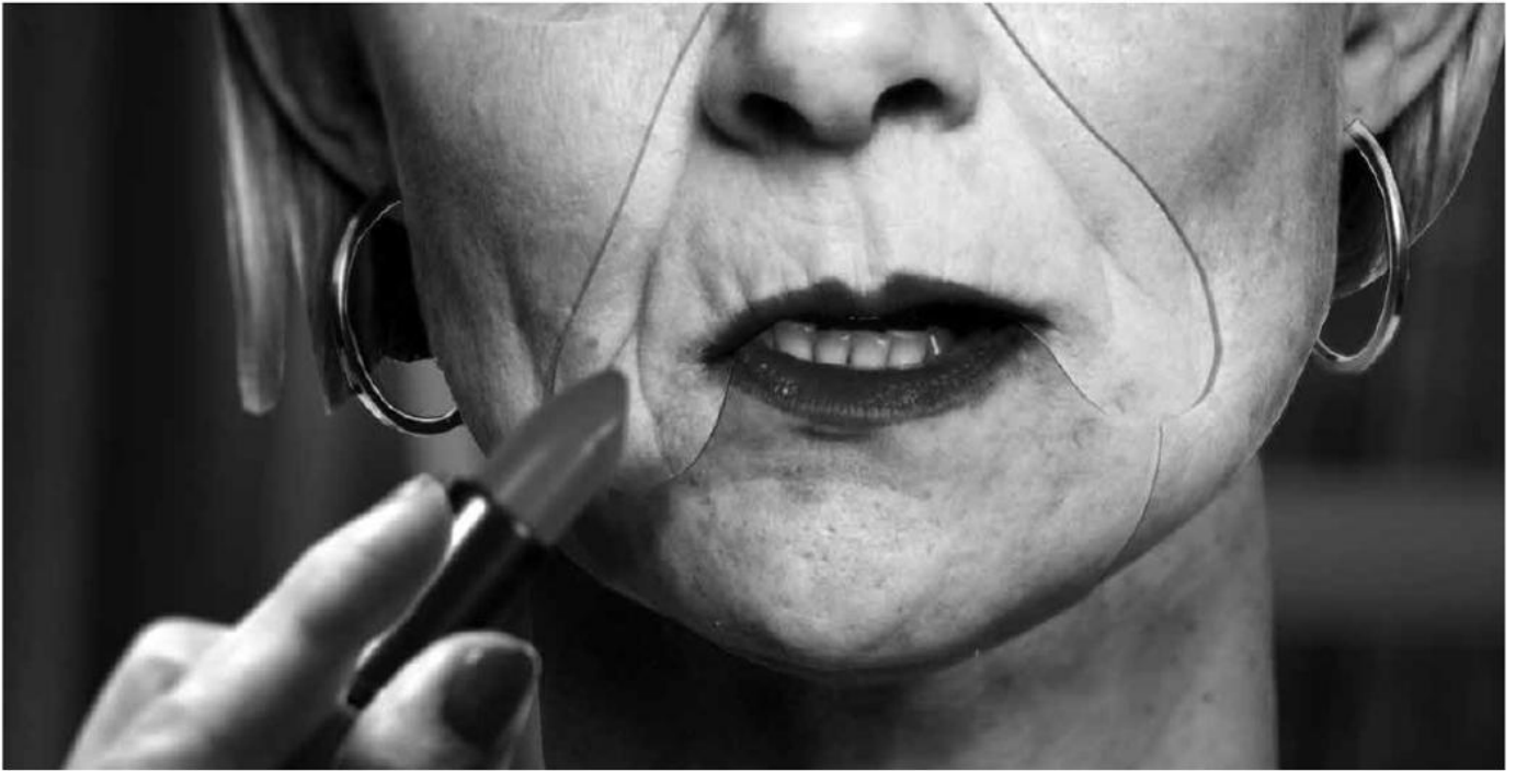
Filmstill: „Sexe Faible“ © Nicolas Jacque

Bio-Qualität, saisonal zubereitet und regionalen Ursprungs.