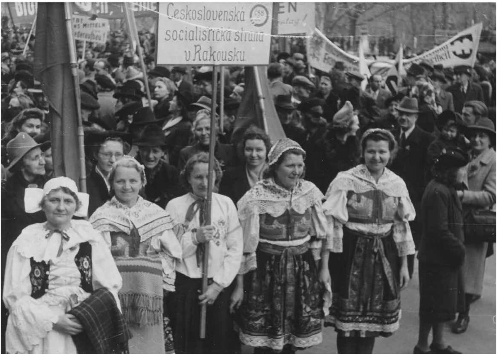
Mitglieder der Tschechischen Sozialistischen Partei Österreichs in Tracht bei einer Maikundgebung, undatiert