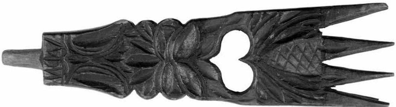
Spinnrockenaufsatz aus Holz, ÖMV/38.244, 19. Jh.

Die Ausstellung wird in der öffentlich zugänglichen Passage des Volkskundemuseums gezeigt und ist daher kostenlos zu besichtigen.