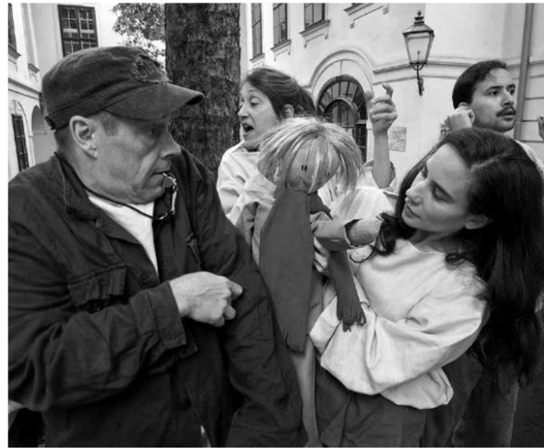
Die Theatergruppe Zenith Productions spielt wieder im Innenhof des Volkskundemuseum Wien