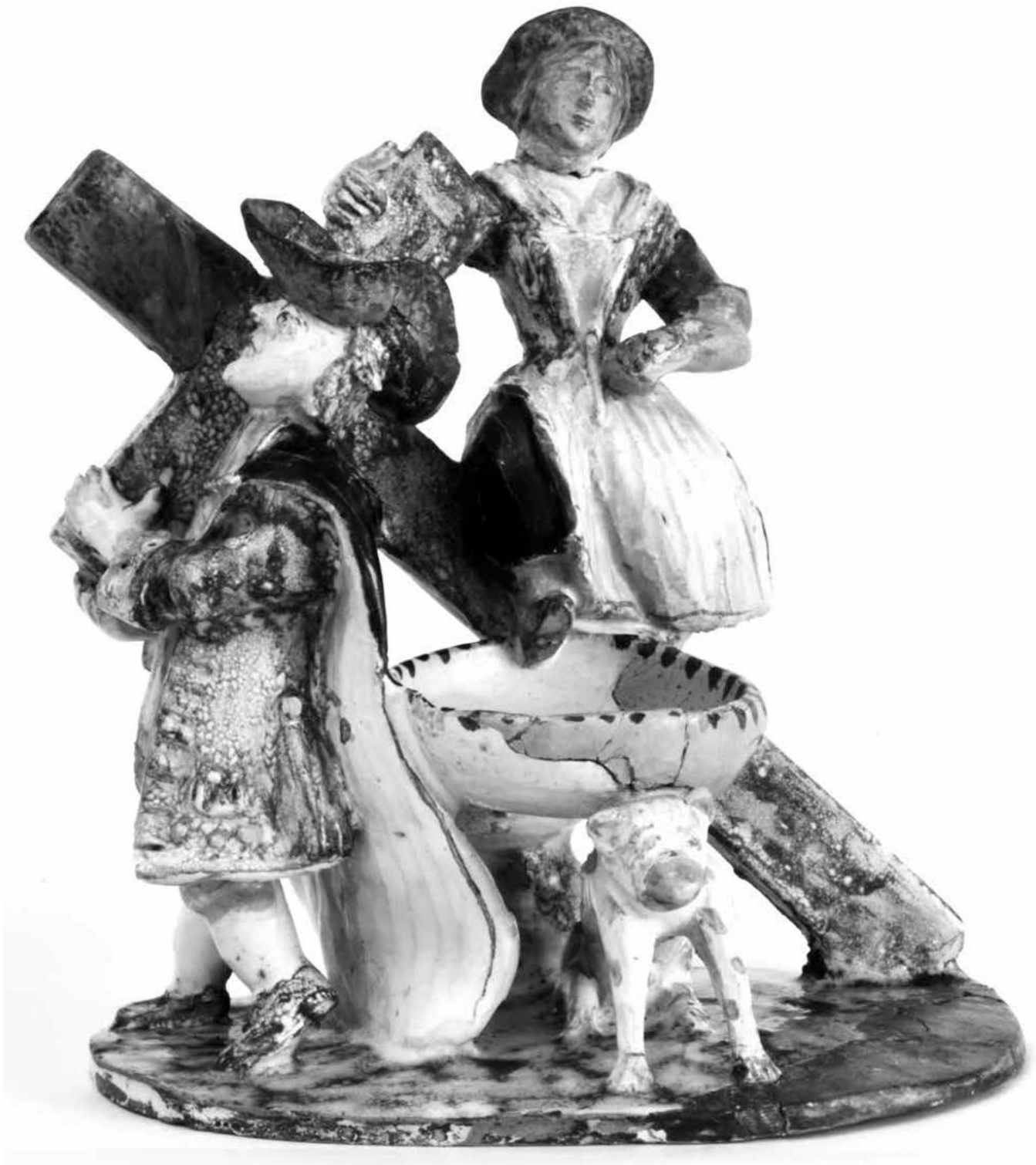
Salzgefäß aus Keramik, ÖMV/65.687, 2. Hälfte 18. Jh.