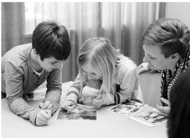
Bildgespräche im Rahmen des Projektes Stadt-Land-Kind

Methodisch sind für dieses Citizen-Science-Projekt intergenerative Bildgespräche zentral, wobei SchülerInnen gemeinsam mit VertreterInnen ihrer Eltern- und Großelterngeneration Bilder analysieren und