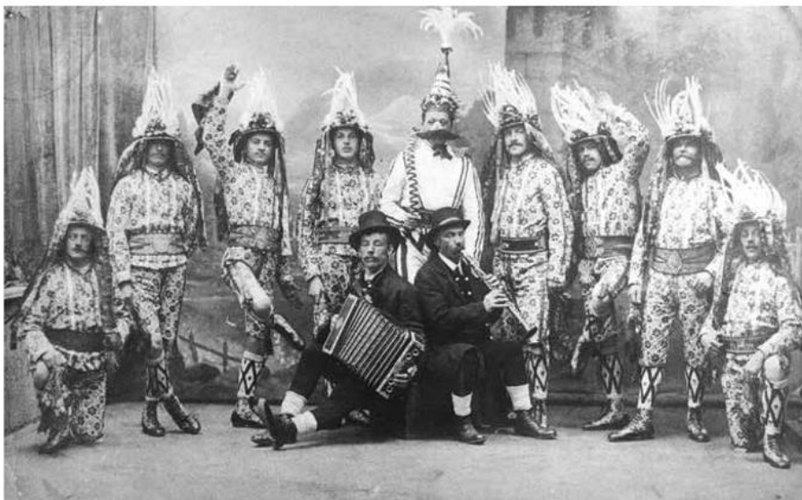
Atelierfoto der „Tresterer Alpina Salzburg“ bei ihrer Gründung 1911

Passend zum Motto „Josefstädter Straßentafeln“ werden Tische auf der Straße in festliche Tafeln verwandelt. Das Volkskundemuseum Wien ist auch Gastgeber und mit einem Stand bis 18.00 Uhr vertreten. Es gibt Geschlecke aus Nüssen, Honig und Gewürzen sowie Kräutersäfte zum Verkosten und Selbermachen. Wohl bekomm's!