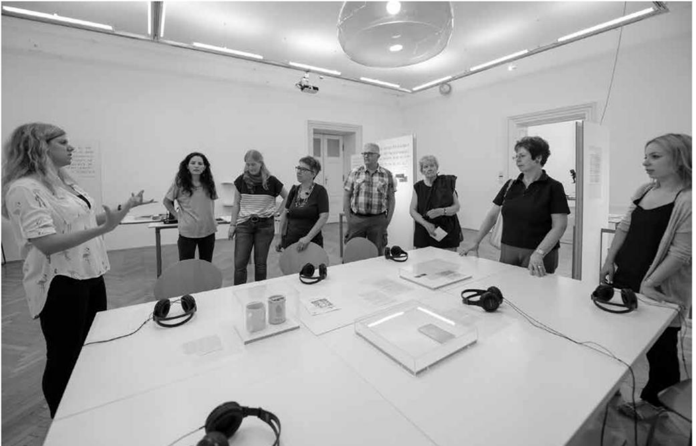
Kuratorinnenführung durch die Ausstellung 40 Jahre Wiener Frauenhäuser