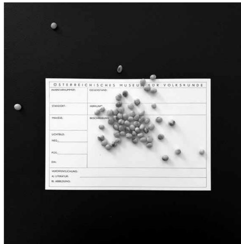
Die Soja-Bohne im Volkskundemuseum Wien und darüber hinaus