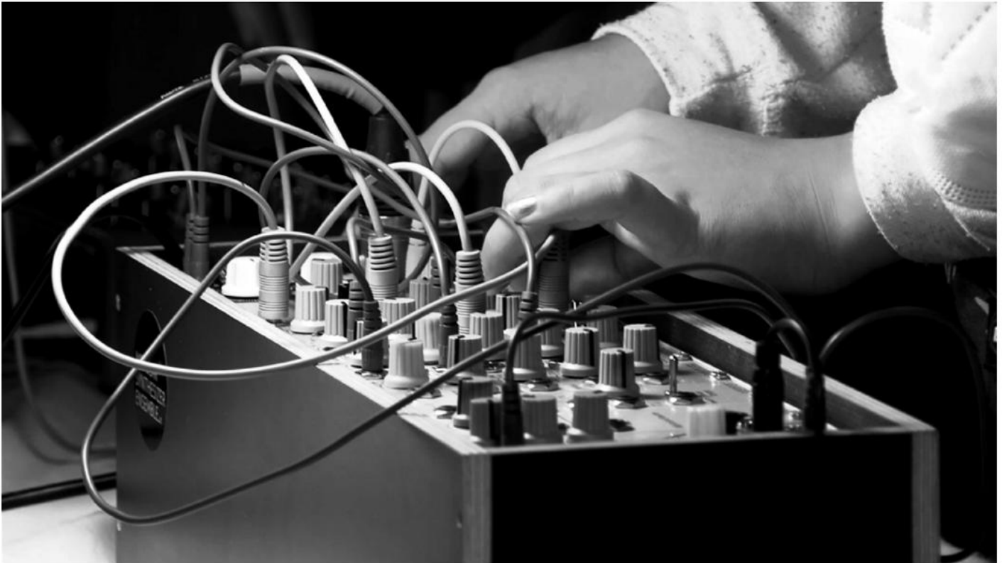
Probieren am Modulare Synthesizer.

werden mit Kabeln verbunden. Weiters gibt es viele Regler, mit denen die Klänge verändert werden können. Zusätzlich gibt es die Möglichkeit, Funktionen und Parameter mit Steuerspannung zu verändern – das unterscheidet den modularen Synthesizer von anderen analogen Synthesizern. Allerdings waren die damaligen modularen Synthesizer nicht massentauglich, sie waren sehr klobig und teuer. So wurde es in den 70er Jahren wieder ruhiger um die modularen Synthesizer. Mitte der 90er Jahre hat Dieter Doepfer aus München sein Analog Modular System A-100 präsentiert. Er hat seine Entwicklungen von Anfang an veröffentlicht. Dadurch sind gerade in den letzten zehn bis fünfzehn Jahren sehr viele neue Hersteller und eine unüberschaubare Anzahl an Module entstanden.