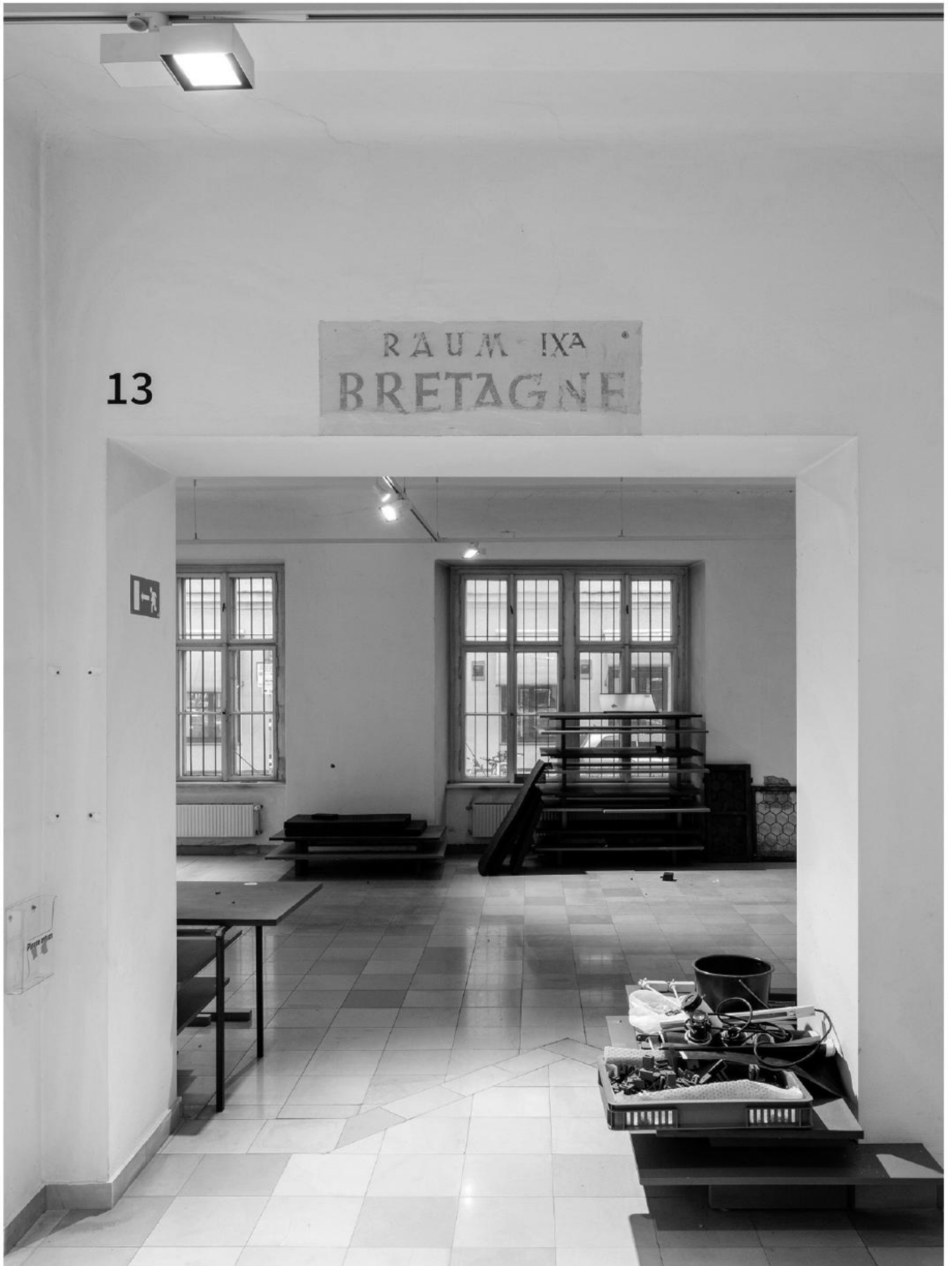
Die geleerten Räume der ehemaligen Schausammlung machen Platz für Austausch und Vernetzung.