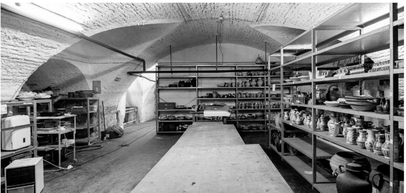
Einblick in den Keramik Keller. Inzwischen sind alle Objekte sicher im Depot angekommen.