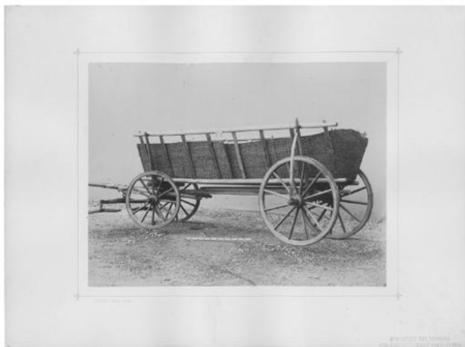
Eine Auswahl aus den 101 Tafeln: Lastensattel in Montenegro (pos/108/061); Fuhrwerk fürs Gebirge, Ungarn (pos/108/065); Fuhrwerk aus Dukla (pos/108/010a)

dominierten Beruf entgegen zu wirken, kaschierte sie ihre weibliche Identität und signierte schon wenige Jahre nach Anmeldung ihres Gewerbes ihre Bilder nur noch mit „M. Strobl, Industrie-Photograph“.