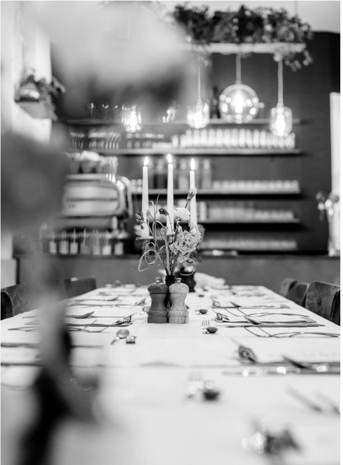
Gedeckt zum Dinner im Palais.