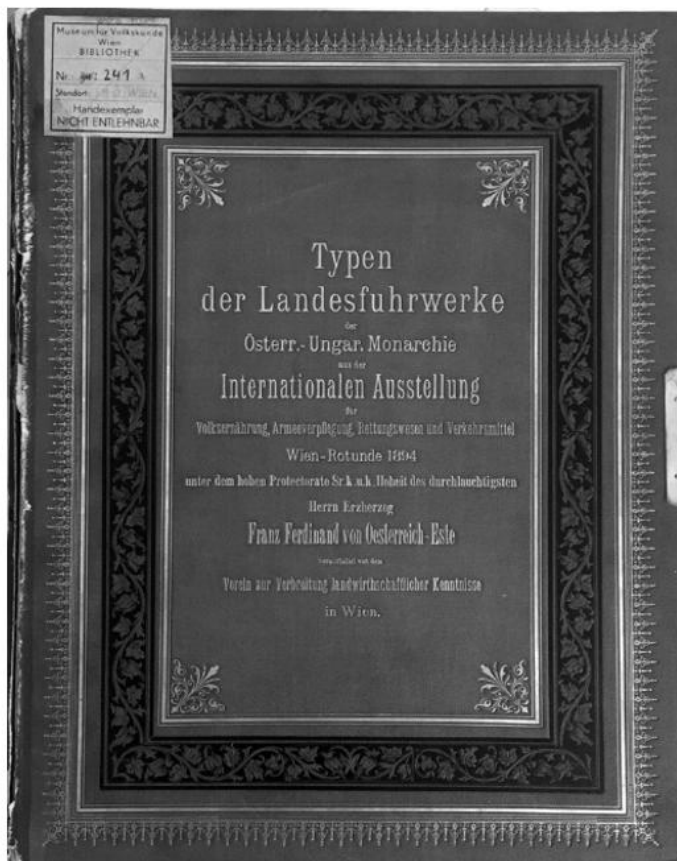
Das Mappenwerk vor der Restaurierung (pos/108)

Ihr Name schien nicht auf, als 1895 ihre 101 großformatigen Albumfotografien von „Typen der Landesfuhrwerke der Österr.-Ungar. Monarchie aus der Internationalen Ausstellung [für Volksernährung, Armeeverpflegung, Rettungswesen und Verkehrsmittel], Wien-Rotunde 1894“ in das Positiv-Inventarbuch des Hauses aufgenommen wurden (pos/108). Ebenso wenig in den Neuerwerbungen des Jahres 1895 (Z.f.Ö.V. 1), in denen „Sr. Durchlaucht dem Fürsten Alfred Wrede, sowie den Herren