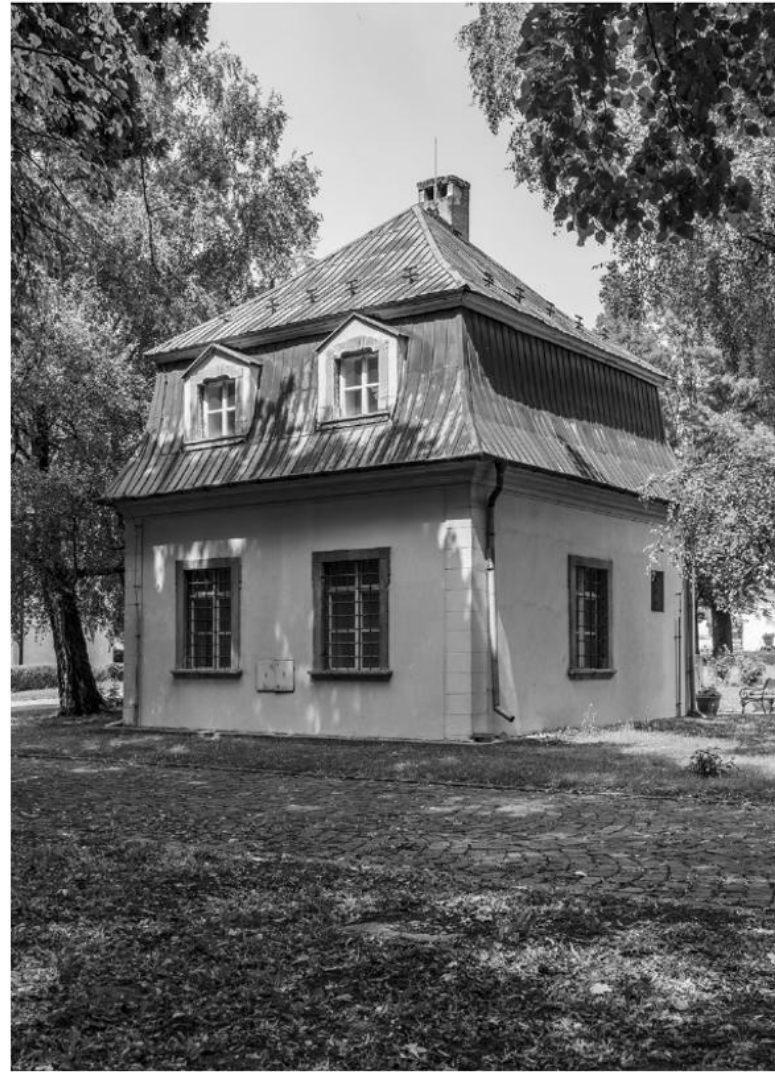
Das Gärtnerhaus im Schlosspark von Dolná Krupá.

Das Slowakische Nationalmuseum – Musikmuseum widmet sich im Gärtner-