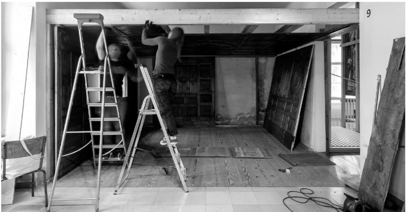
Abbau der Montafoner Stube.

Alle Termine online: www.volkskundemuseum.at/termine