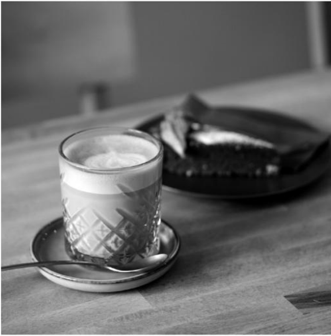
Schön sitzen bei Kaffee und Kuchen im SchönDing Café.