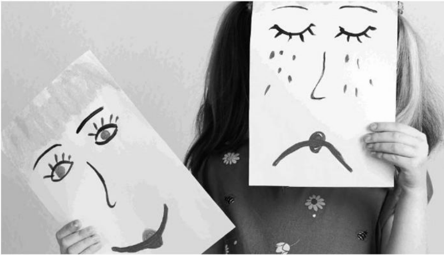
Wegschauen – Hinschauen – Reinschauen.