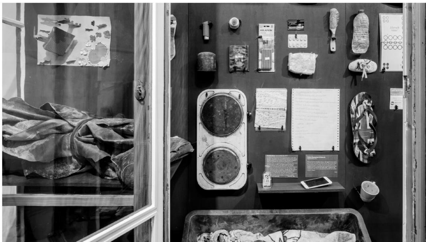
Vitrine mit Objekten zu Die Küsten Österreichs .