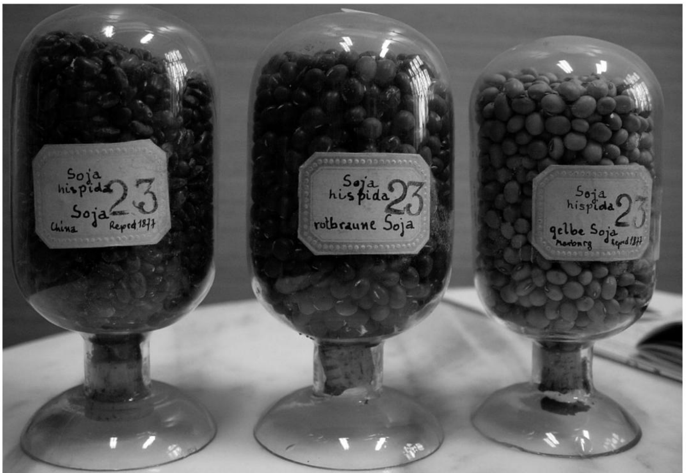
Friedrich Haberlandts Sojabohnen-Ernte 1877