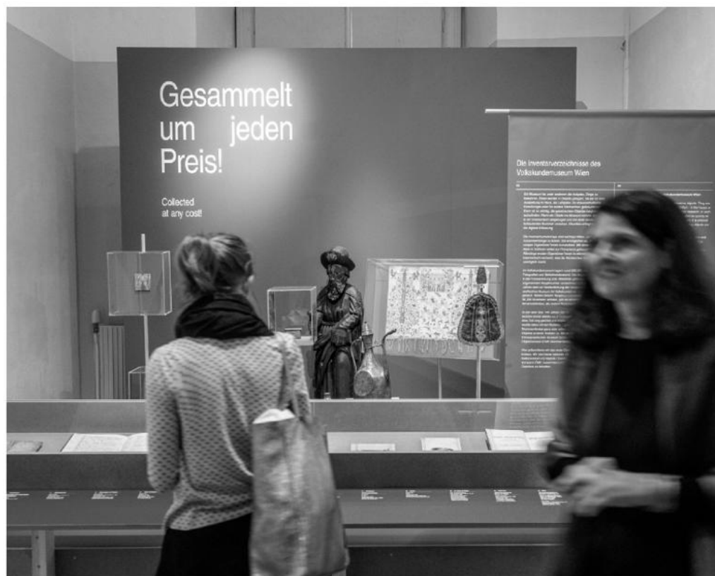
Einblicke in die aktuelle Ausstellung Gesammelt im jeden Preis! Zu sehen bis 26.11.2023.