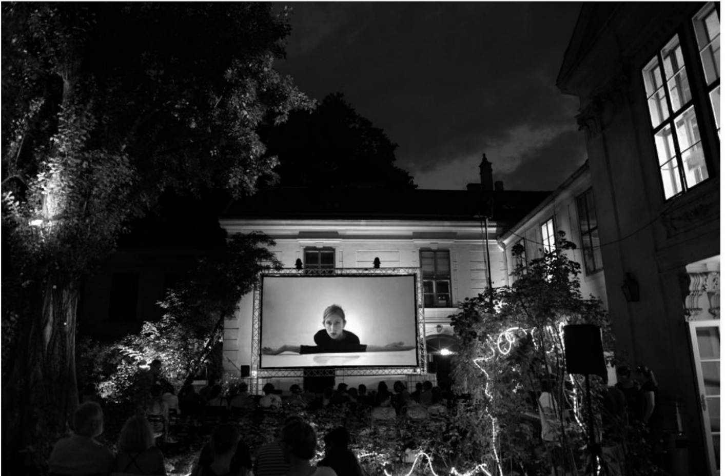
Open Air Kurzfilmfestival dotdotdot im Museumsgarten.

sich ihres eigenen Zusammenhalts und ihrer Zugehörigkeit unsicher werden. Zugleich kann keine politische Partei solche Debatteprozesse ignorieren, sondern muss sich in ihnen positionieren. Wie aber verhalten sich die Fachleute zu diesen gesellschaftlichen Diskursen? Sind sie Teil und Akteure dieser konfliktreichen Auseinandersetzungen oder sind sie distanzierte Beobachter und Analytiker? Sollten sie eine professionelle Distanz wahren, um die Öffentlichkeit und ihre Akteur*innen mit Expertise zu versorgen? Gleichzeitig sind sie niemals nur Fachleute, sondern auch Bürger*innen mit eigenen, begründeten politischen Anliegen. Wie lassen sich diese unterschiedlichen Rollen vermitteln? Wir laden Expert*innen aus der ganzen Welt ein, diese Fragen miteinander in größtmöglicher Öffentlichkeit zu diskutieren.