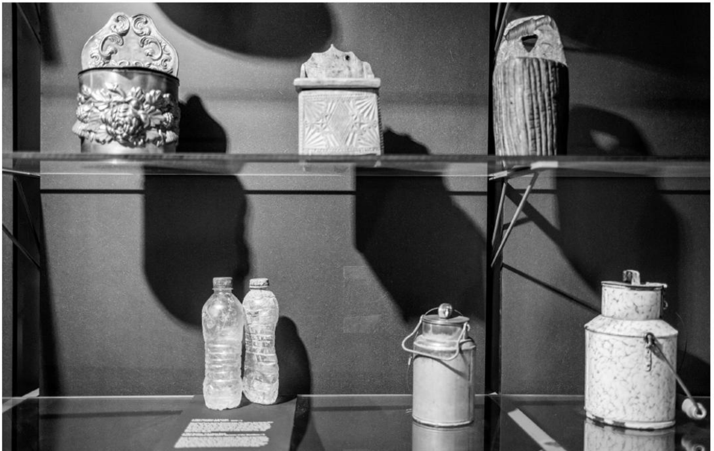
Die Küsten Österreichs in der volkskundlichen Schausammlung.

Das Begleitbuch zur Ausstellung ist in den Online Publikationen kostenlos downloadbar oder über das Museum zu beziehen: buchbestellung@volkskundemuseum.at Hörgang zu Die Küsten Österreichs : www.audio.volkskundemuseum.at