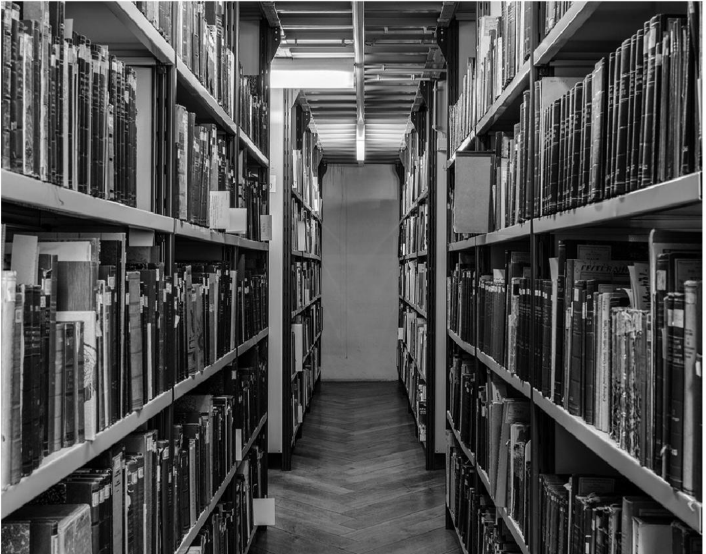
Speicher & Bibliothek im Volkskundemuseum Wien.