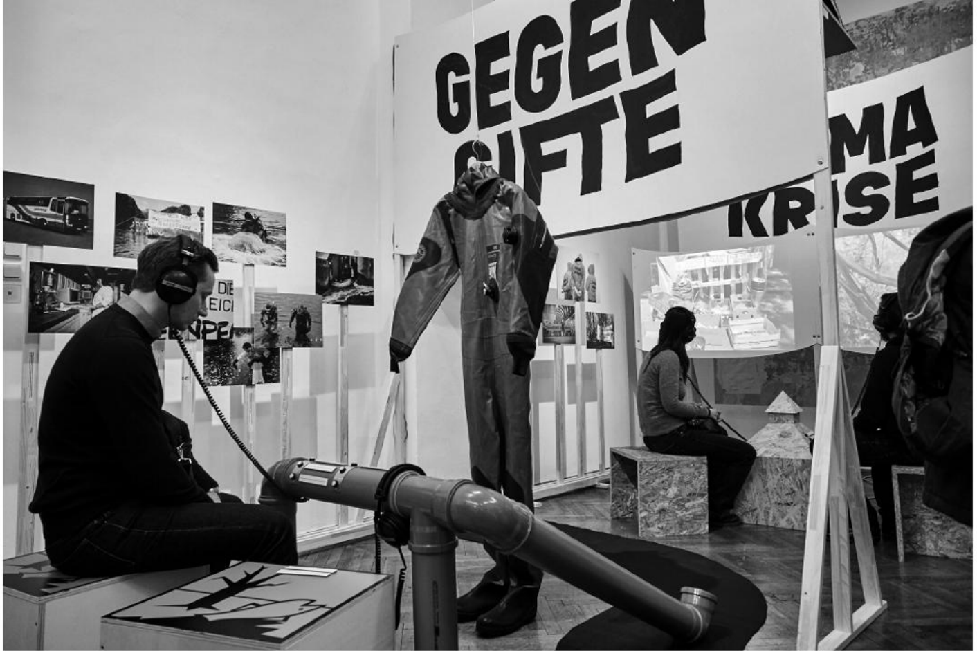
Einblick in die vergangene Ausstellung Von Zwentendorf zu CO 2 . Kämpfe der Umweltbewegung in Österreich Anfang 2023.