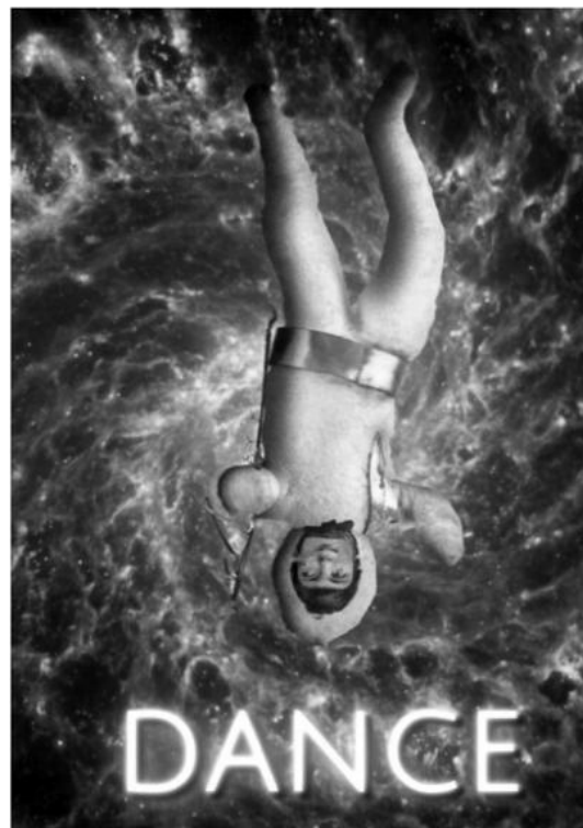
Astro-Watte in Aktion, Filmstill: Mike Kren

Sa, 7.10.2023, 18.00 bis 1.00 Uhr Lange Nacht der Museen