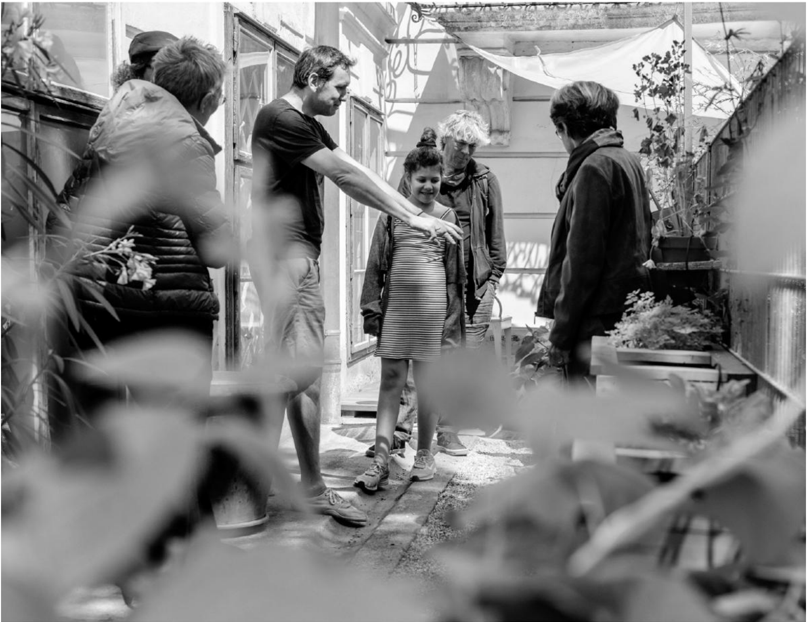
Generationenworkshop des ACHTSAMEN 8. im Kräutergarten des Museums.