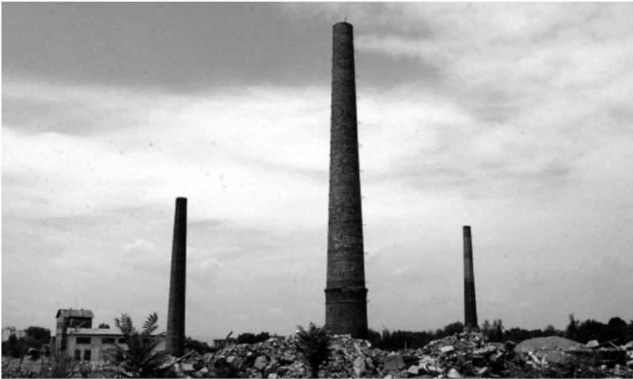
„Müll-Safari“ in Celje auf den Spuren ausgedienter Industrie.