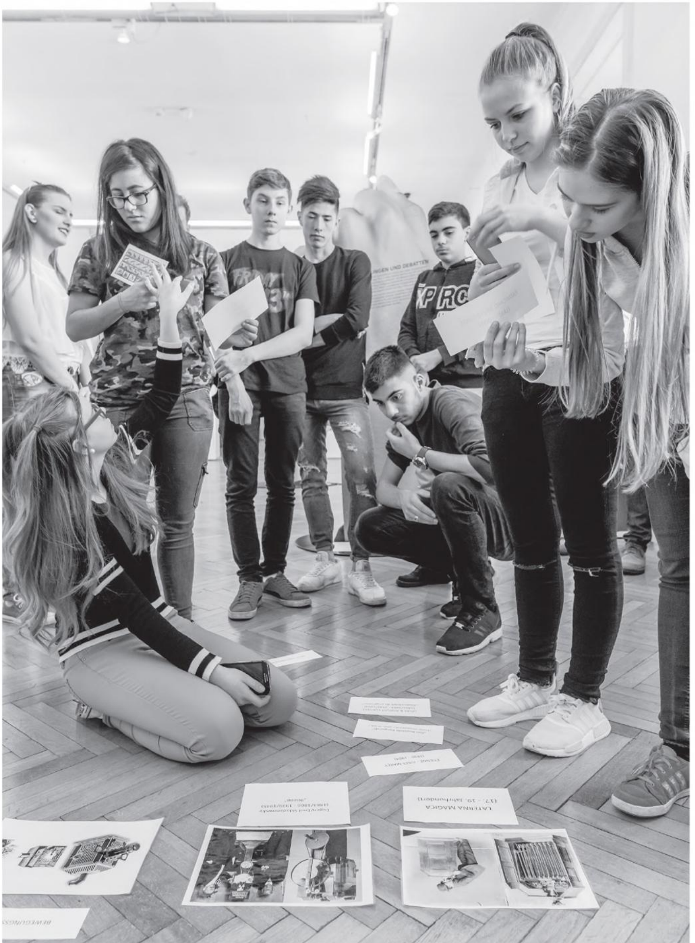
Kulturvermittlung mit Jugendlichen.