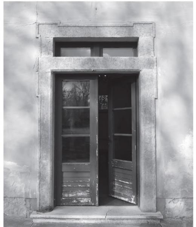
Im Schloss Marchegg.

Im Rahmen des Projekts TREASURES, gefördert aus Mitteln der Europäischen Union im Kooperationsprogramm INTERREG V-A Slowakei – Österreich 2014–2020.