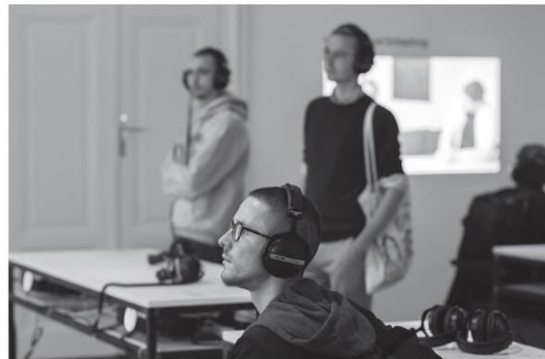
Ausstellung Schulgespräche. Junge Muslim*innen in Wien .

Projekt im Rahmen von Sparkling Science In Kooperation des Instituts für Kulturwissenschaften und Theatergeschichte sowie des Instituts für Sozialanthropologie der Österreichischen Akademie der Wissenschaften Projektleiter: Georg Traska Wissenschaftliche Mitarbeiterin: Valeria Heuberger Projektbeteiligte Schulen: Abendgymnasium, Wien 21 BRG/ORG Henriettenplatz, Wien 15 GRG Ettenreichgasse, Wien 10 Islamisches Realgymnasium, Wien