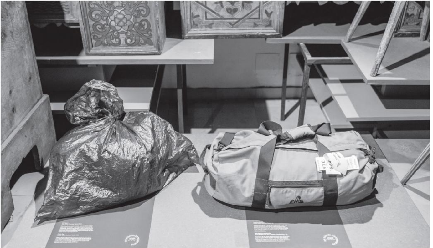
Die Küsten Österreichs stehen in engem Bezug zur Schausammlung: Gepackte Reisetasche und Plastiksack als Fluchtgepäck finden sich zwischen historischen Kästen und Truhen.