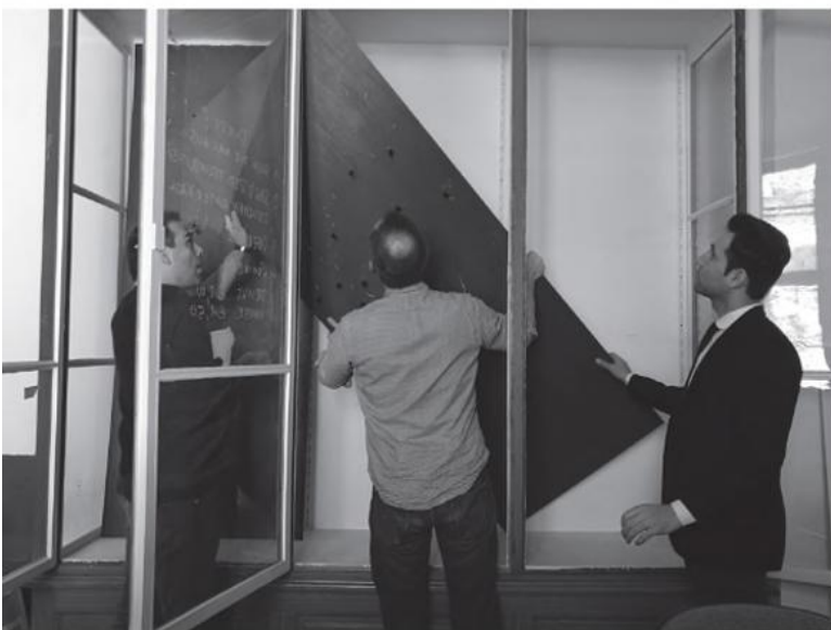
Das Team von Museum auf der Flucht richtet die Schauvitrine im Direktionsbüro ein.

Alexander Martos: Seit vielen Dekaden werden Institutionen zurückgebaut, öffentliche Einrichtungen schrumpfen. In solchen Zeiten ist die Frage der Kontrolle eine Kernfrage. Es geht um Etats, Planungen und Dienststellen. Viele Kulturinstitutionen scheinen erstarrt zu sein. Es gibt strukturell oder personell bedingte Frontstellungen. Meist kommen diese Institutionen einem mittleren bis großen Betrieb gleich, haben einige Millionen Euro Budget und man trifft