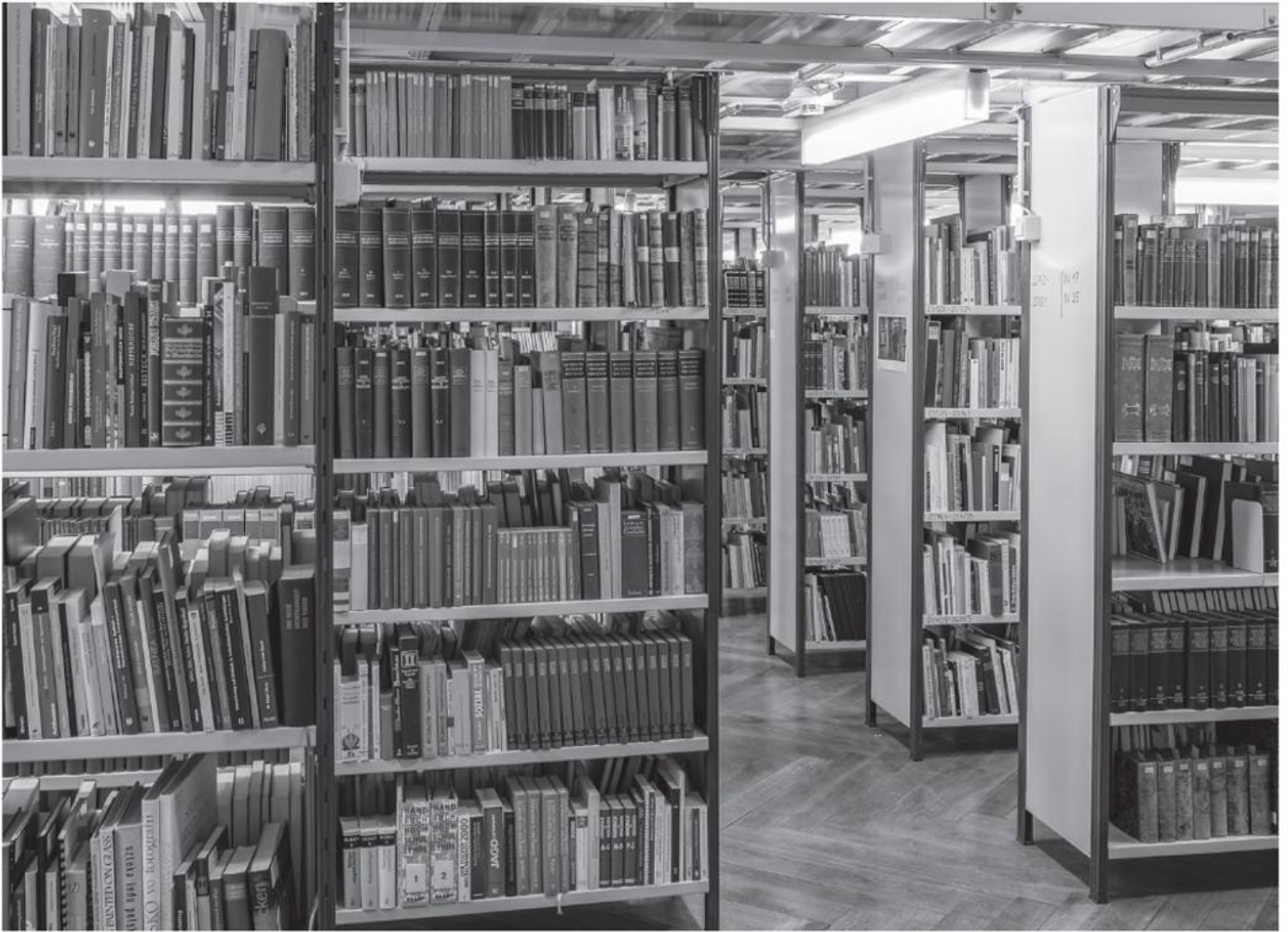
Die Bibliothek umfasst etwa 100.000 Bände zu Volkskunde/Europäische Ethnologie und verwandten Fächern.