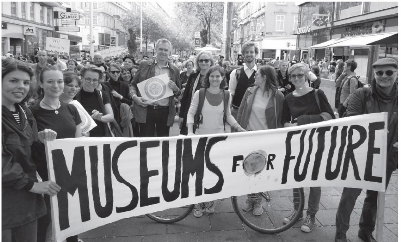
#museumsforfuture. Wiener Museen demonstrieren für Klimaschutz