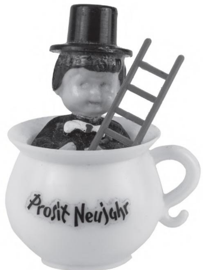
Silvesterglücksbringer: Rauchfangkehrer im Nachttopf. ÖMV 88840.

Wir wünschen mit dieser kleinen Ausstellung allen unseren Freundinnen und Freunden, Besucherinnen und Besuchern: Ein großes Stück Glück im neuen Jahr 2020!