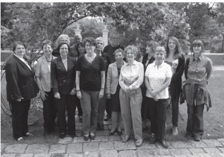
Unter dem Rosenbogen: Lehrgang zur Freiwilligen-schulung „Unternehmen Schneeball 2 “ in Kooperation mit dem Bezirksmuseum Josefstadt 2011.

Begleitung: Jeden Donnerstag, 16.00 bis 20.00 Uhr sind „Schneebälle“ in den Ausstellungsräumen anwesend und geben gerne Auskunft.