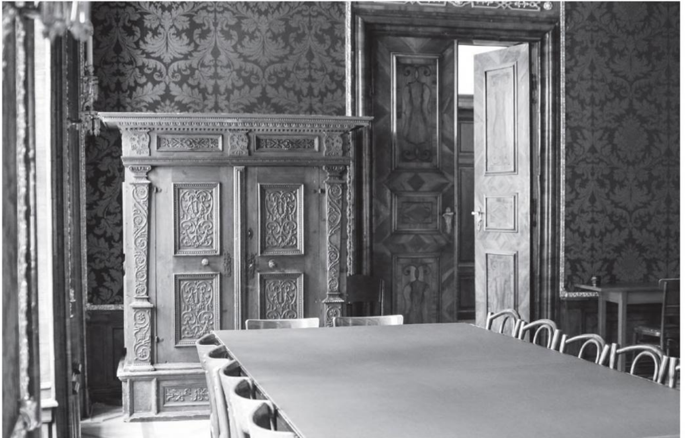
Der Blaue Salon ist im Rahmen einer Backstageführung zu besichtigen.

nehmerInnen auf „der anderen Seite“ des Museums wieder. Hoch hinaus und ganz hinunter führt der einstündige Rundgang vom Dachboden bis zum ehemaligen Weinkeller des Schlosses. Über verschlungene Wege geht es über die Wendeltreppe, vorbei am Kopierer, zur Bibliothek und in den Blauen Salon.