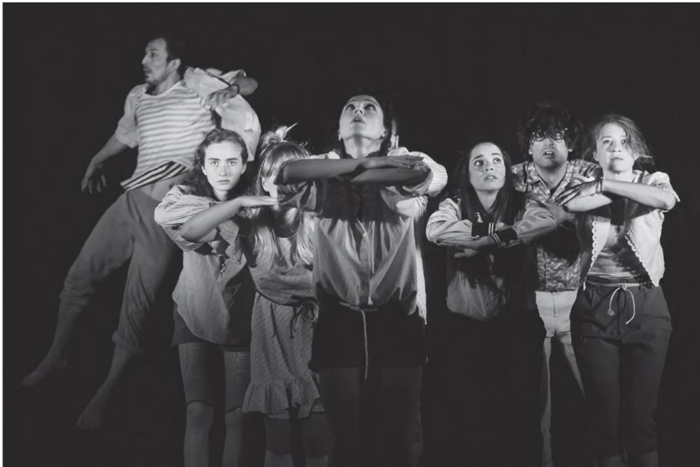
Gaudiopolis. Ein performativer Museumsrundgang