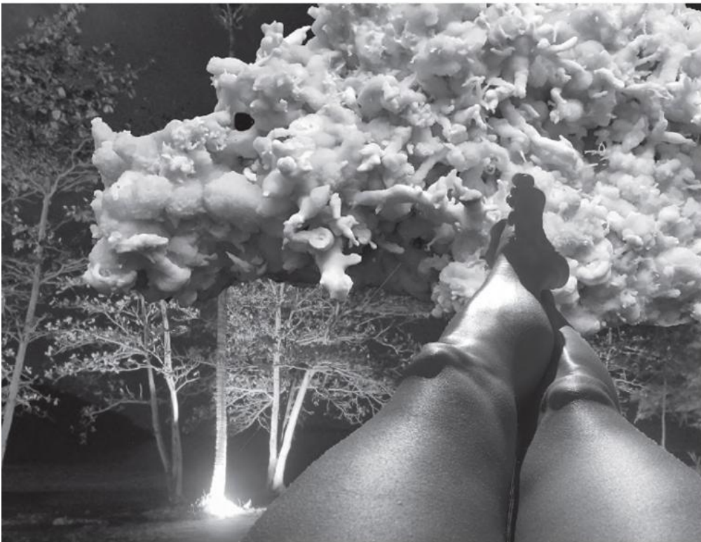
Eine Performance zur Poesie des Alltags