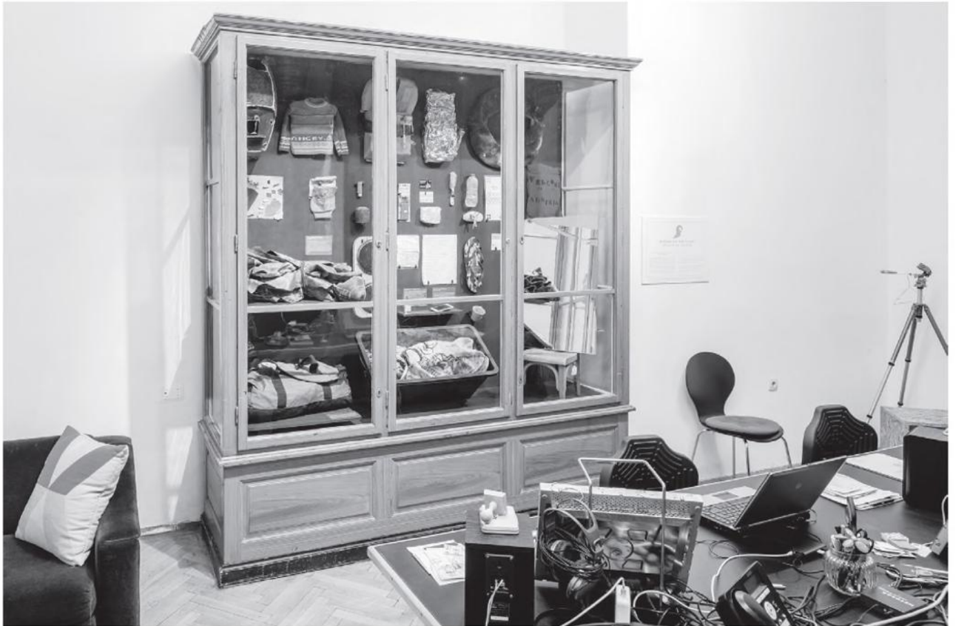
A Cabinet of Wonderlessness , Schauvitrine im Direktionsbüro.

Tagen ist es ein großartiges Gewächshaus. Und es gibt mehr helle als dunkle Tage.