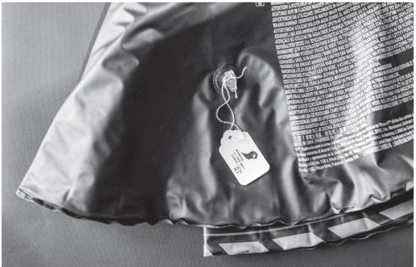
Exponat in der Ausstellung Die Küsten Österreichs : Schwimmreifen, Wasserspielzeug. MdW/25.

Das Begleitbuch zur Ausstellung ist in den Online Publikationen kostenlos downloadbar: www.volkskundemuseum.at/onlinepublikationen oder über das Museum zu beziehen: buchbestellung@volkskundemuseum.at