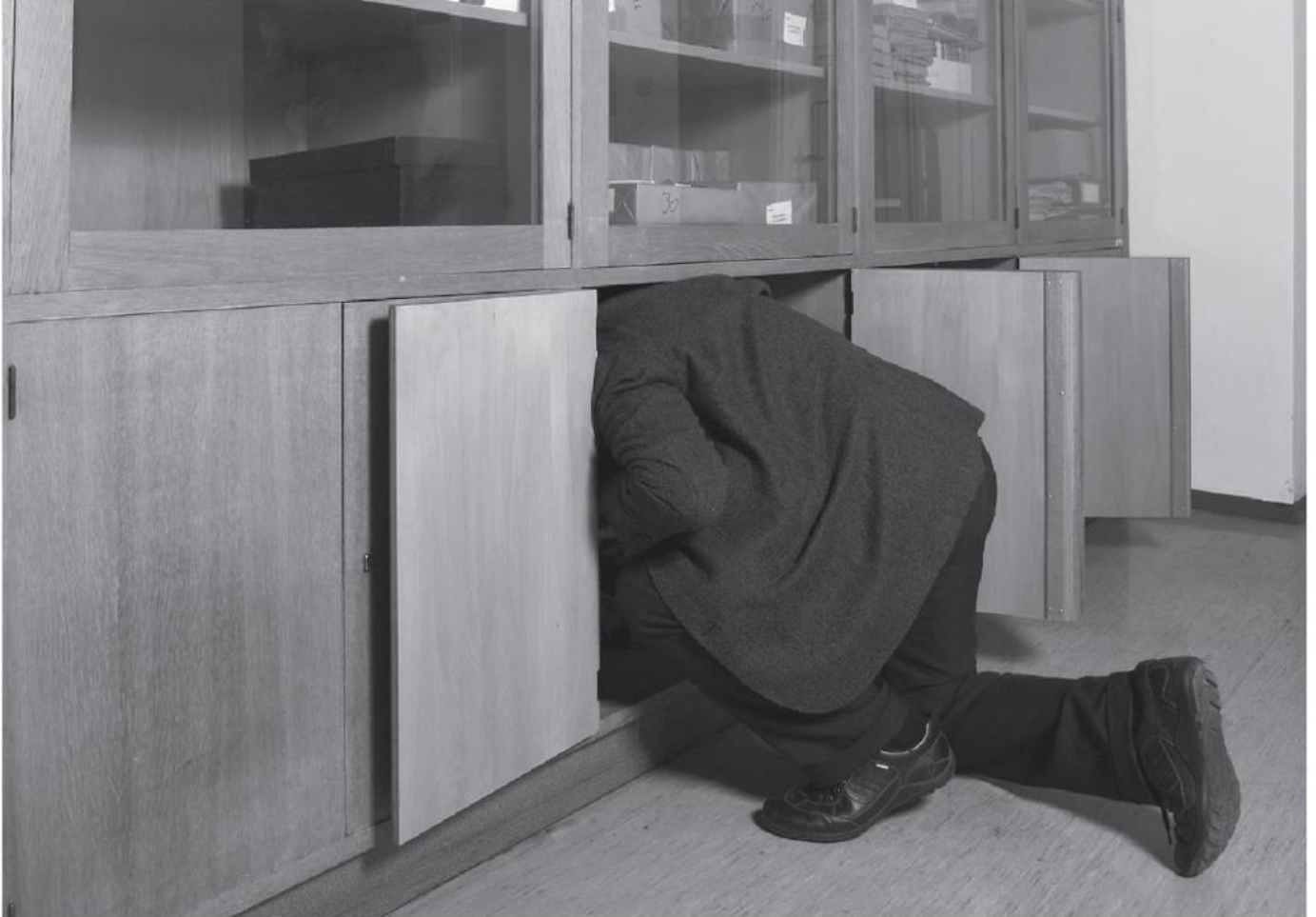
Ein musealer Selbstfindungsprozess.