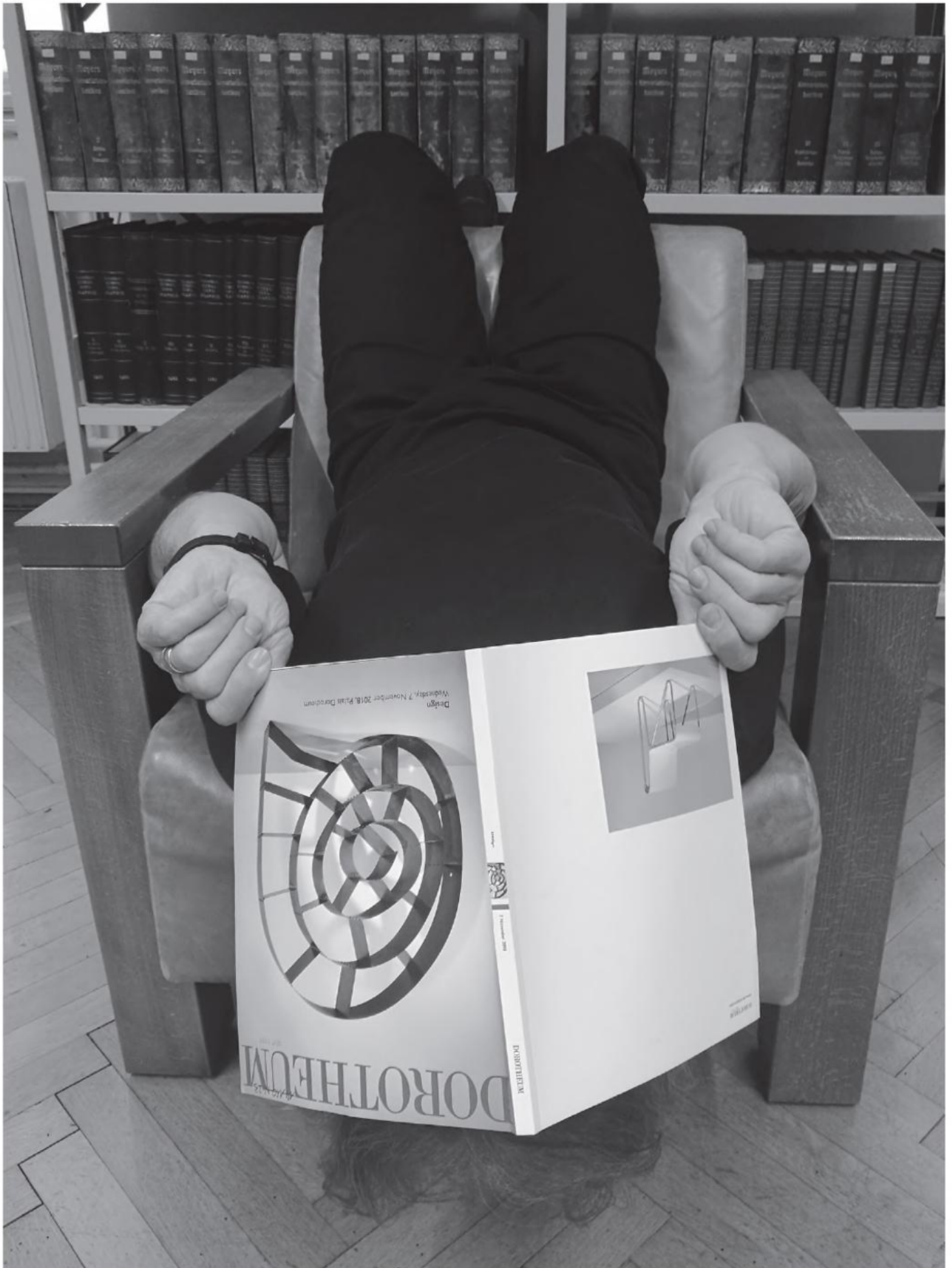
So fühlt man sich wohl: Unser Bibliothekar im olfaktorischen Rausch.