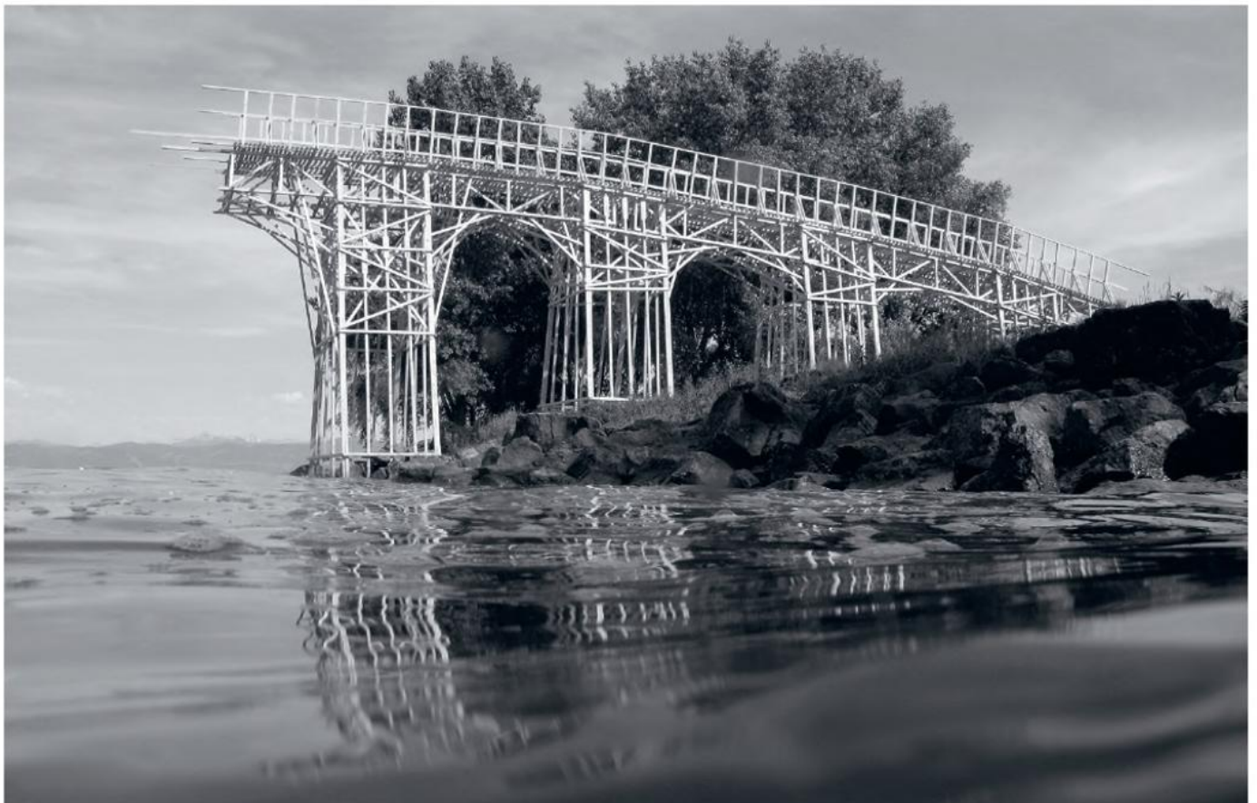
So weit das Budget reicht, 2009, courtesy Kunsthalle Arbon