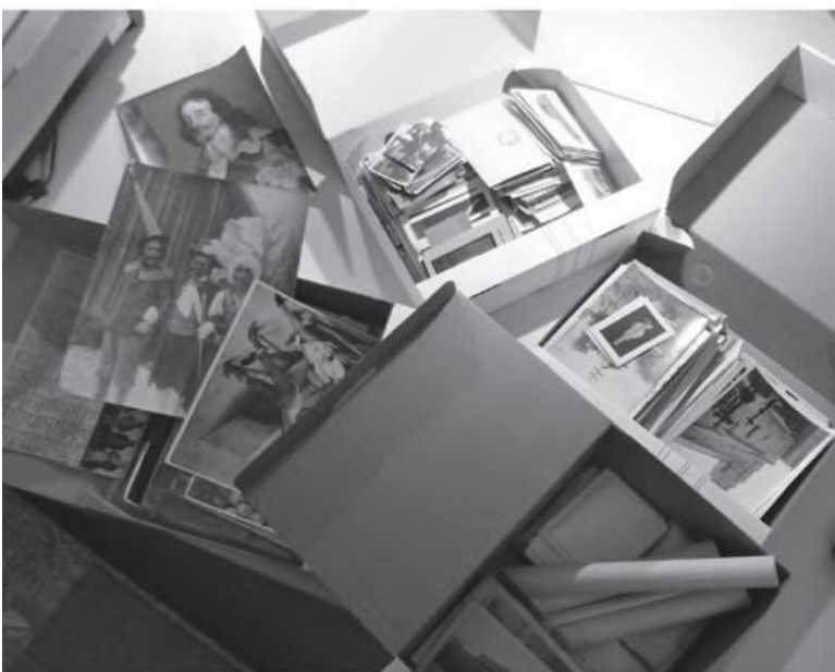
In der Fotosammlung werden Kisten entpackt: Unbekannter Inhalt kommt zum Vorschein.