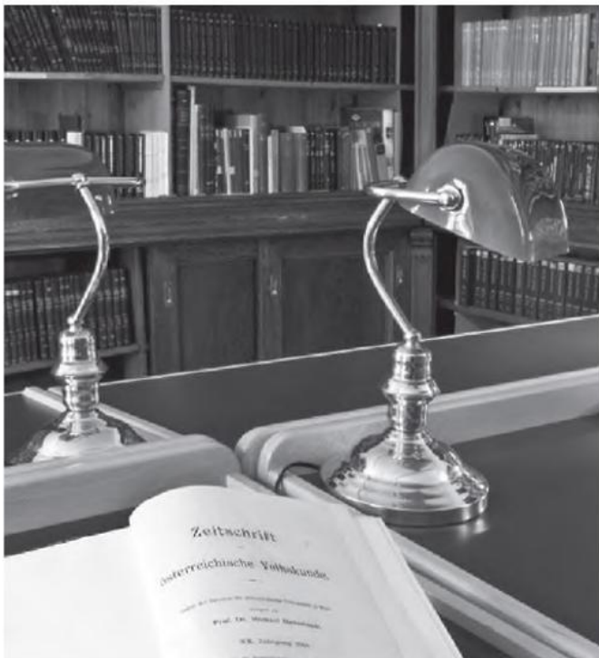
Im Lesesaal des Volkskundemuseum Wien

35 Tafeln mit aufkaschierten Fotografien des Imster Schemenlaufens 1957, ergänzt durch Reproduktionen von älteren Fotografien, 23 lose Fotografien und einige Zeitungsausschnitte zu Faschnachtsbräuchen in Imst, Aussee, Basel und Deutschland: Aus der Fotosammlung ist eine Mappe mit einer Fotodokumentation des Imster Schemenlaufens von Magda Gstrein von 1957 online. Im Frühling 2020 ist die Schriftenreihe Raabser Märchenreihe vollständig online.