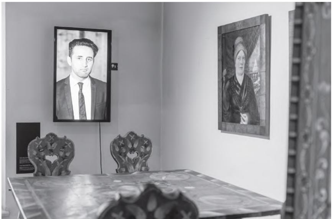
Die Ofenbäuerin in der Schausammlung

Die Küsten Österreichs im Volkskundemuseum Wien.