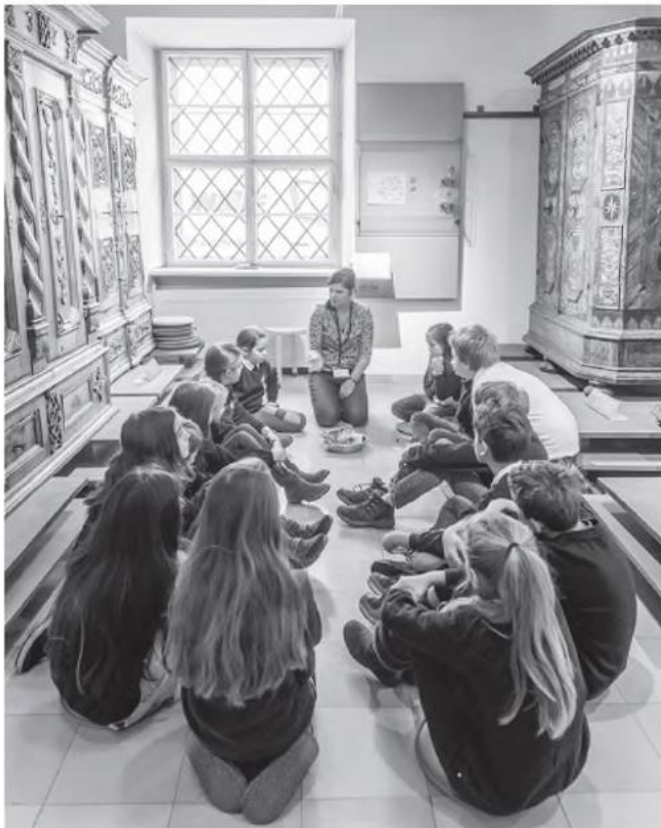
Kulturvermittlung im Museum.