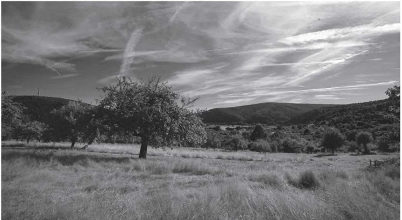
Veredelte Produkte von Streuobstwiesen im Spessart werden in der Mostothek verkostet

Mostothek im Innenhof, Einlass ab 17.00 Uhr Vortrag bei freiem Eintritt Anschließende Produktverkostung: € 9,- Eine Veranstaltung der GeSOKS mit der Main-Streuobst-Bienen eG