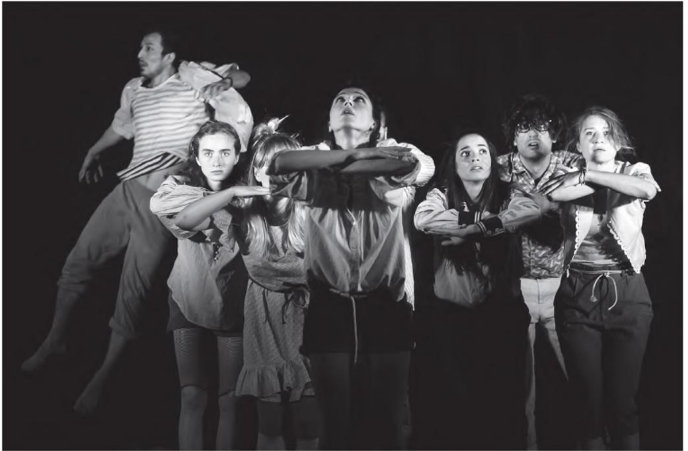
Gaudiopolis. Ein performativer Museumsrundgang © Daniel Wolf