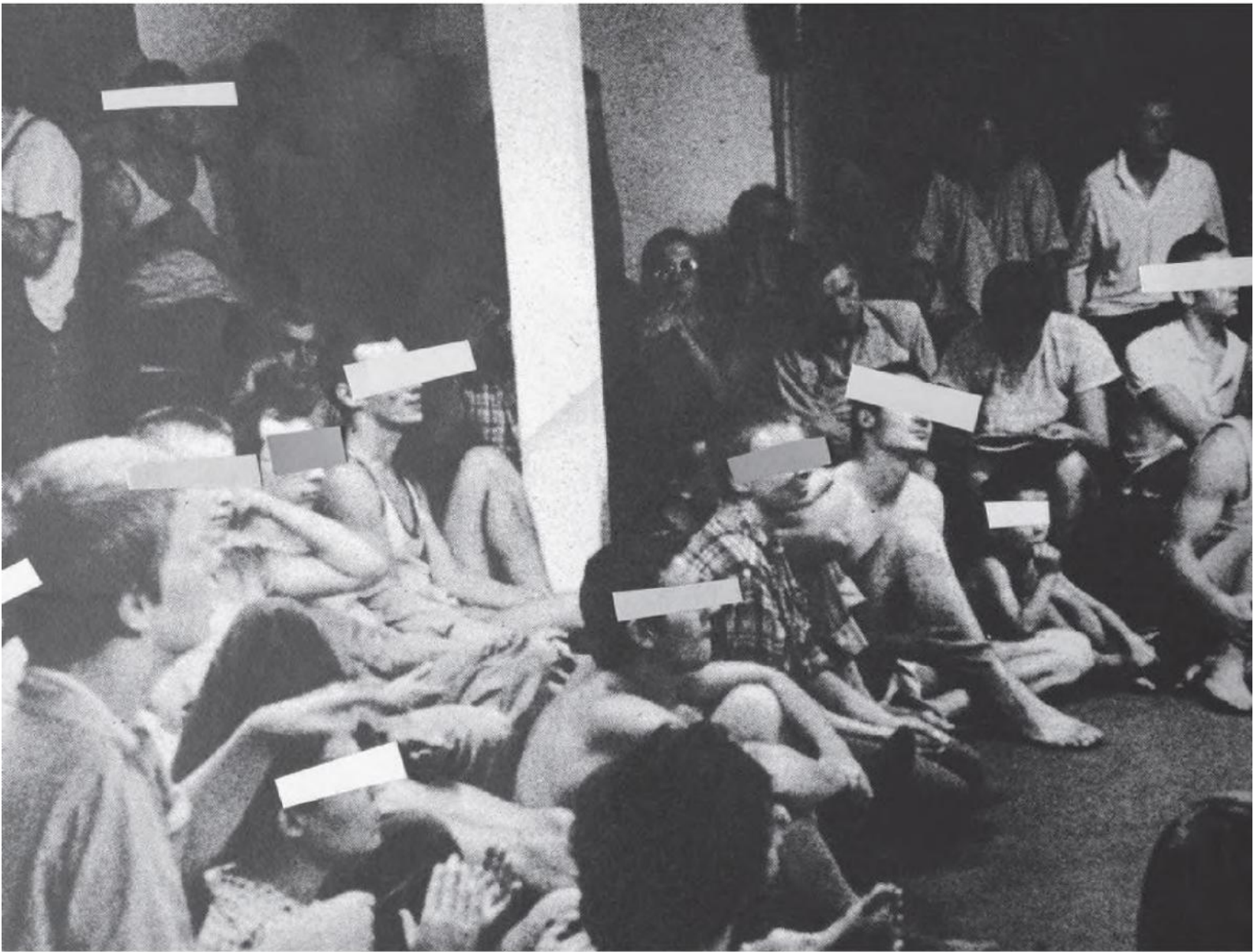
Eine künstlerisch forschende Aufarbeitung der AAO-Kommune