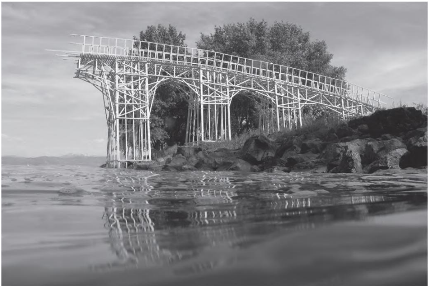
© Bildstein | Glatz, So weit das Budget reicht, 2009, courtesy Kunsthalle Arbon

Muchitsch: Es ist eine gewisse Gratwanderung, dass man nicht vom Radar verschwindet. Man tut sich in Wien sowieso schwer mit dieser Konstruktion, der Gemengelage der MitbewerberInnen und dem Markt auf dem man sich bewegt. Man kämpft um Aufmerksamkeit zwischen den Häusern. Gerade für dieses Haus ist es wichtig, wie Ihr Euch positionieren werdet, in der Museumslandschaft in Wien. Das Wien Museum ist gerade kaum präsent. Das Haus der Geschichte kann nicht das leisten, was es leisten könnte. Aber mittelfristig sind hier drei Institutionen in Wien, die sich vielfach