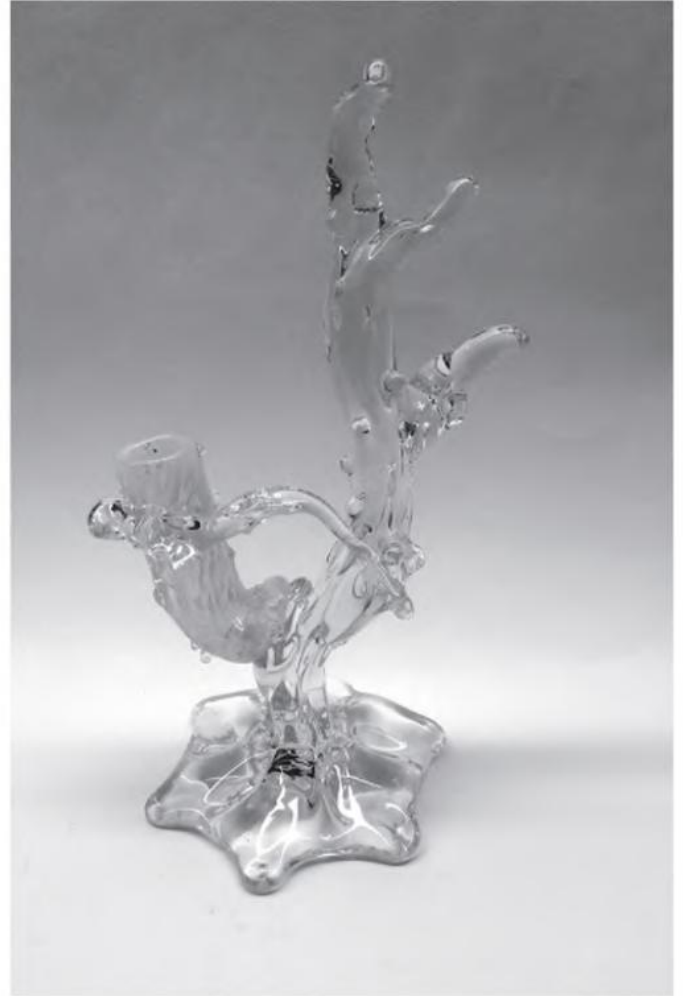
Uranglas aus den Sammlungen des Volkskundemuseum Wien