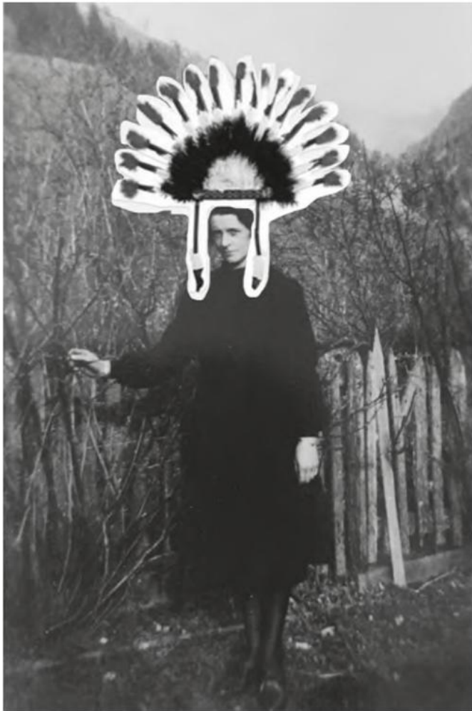
Verheißungsvolle Projektion

gekleidet, und haben das enge Tal in den Bergen hinter sich gelassen. Sie sind bereit für ‚das Neue‘.