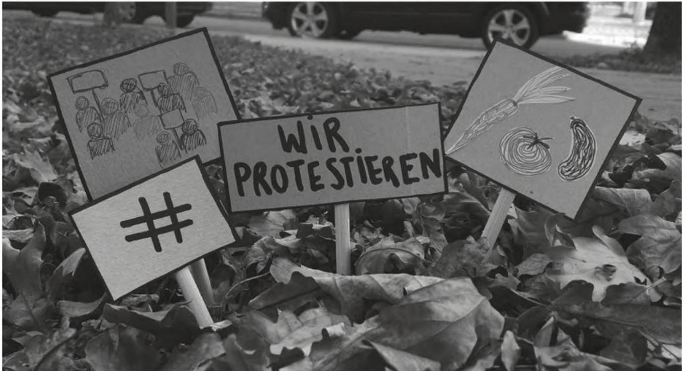
Wo protestieren?