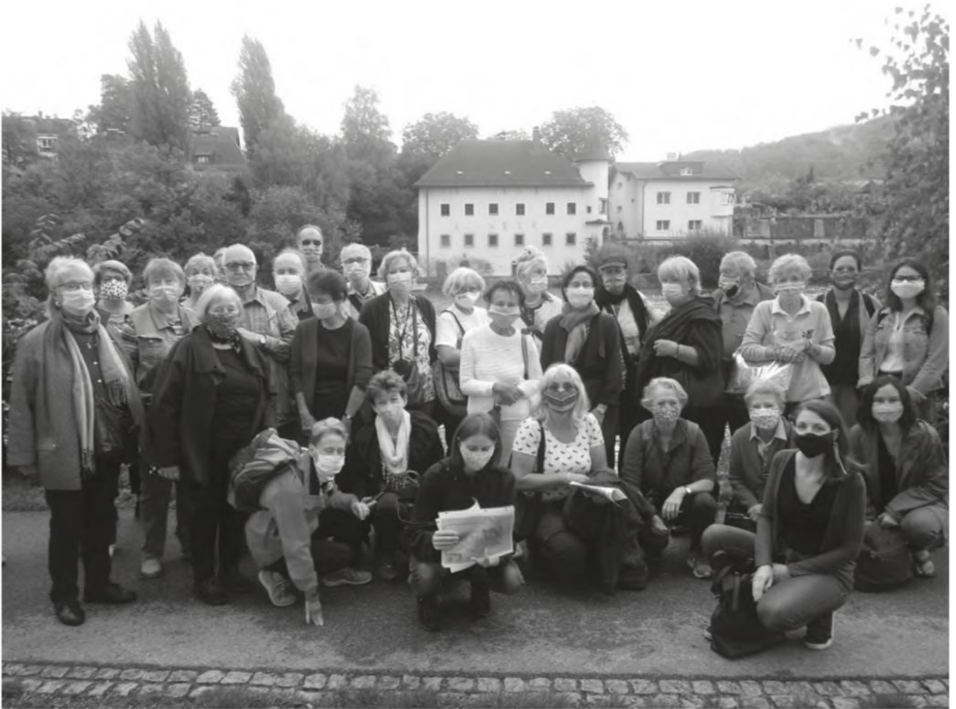
Unterwegs mit dem Verein nach Gmunden.