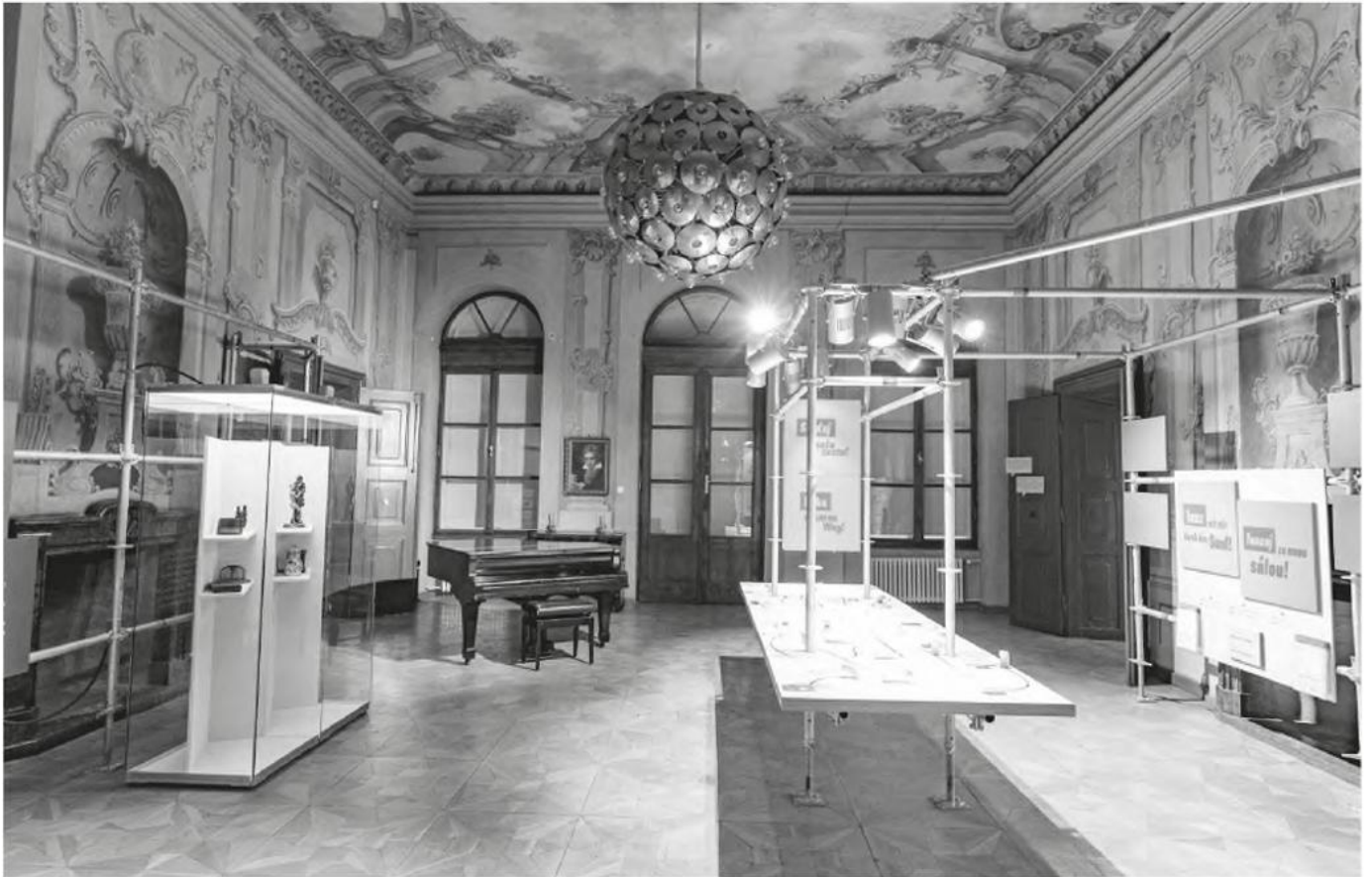
Die sieben Leitobjekte der Ausstellung im Tanzsaal

gehörte zu den ersten in Mitteleuropa und erlebte seine größte Blüte in der Zeit vor dem Ersten Weltkrieg. Die Pflanzerei erhielt die Gräfin von renommierten Rosenzüchtern aus dem Ausland. Im Rosarium züchtete sie 6000 Rosenarten. Mit Mitteln aus dem EU-geförderten Projekt TREASURES wird das prächtige Anwesen nun renoviert.