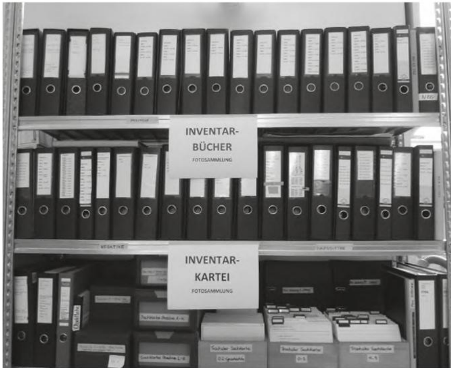
In den Kisten und Kästen der Fotosammlung.

zwecken. Für einen langen Zeitraum waren es neben Rechercheanfragen zahllose Reproduktionen, die für Publikationen und Vorträge bearbeitet wurden sowie Leihgaben für externe Ausstellungen. In den letzten Jahrzehnten sollten Ausstellungs- und Projektarbeit ganz im Mittelpunkt stehen. All dies brachte mit sich, dass der Erhalt und die Erweiterung sowie die Erforschung der historischen Strukturen und Bestände als wichtige Sammlungsaufgaben fast durchgehend zu kurz kamen. Spätestens jedoch seit der Formulierung der Ziele für das Zwischenjahr 2020 und einer geänderten Personalsituation (einer halben Kustodinnen-Stelle mit Qualifizierung in Bestandserhaltung) sollte sich dies ändern und neben der physischen Aufarbeitung und Sicherung der Sammlung(sbestände) die Erschließung aller vorhandenen Findmittel stehen, um Forschungsanfragen adäquat und umfassend zu beantworten, eigenständige(re) Forschung zu ermöglichen, aber auch Vermittlungsaktivitäten zu erleichtern und