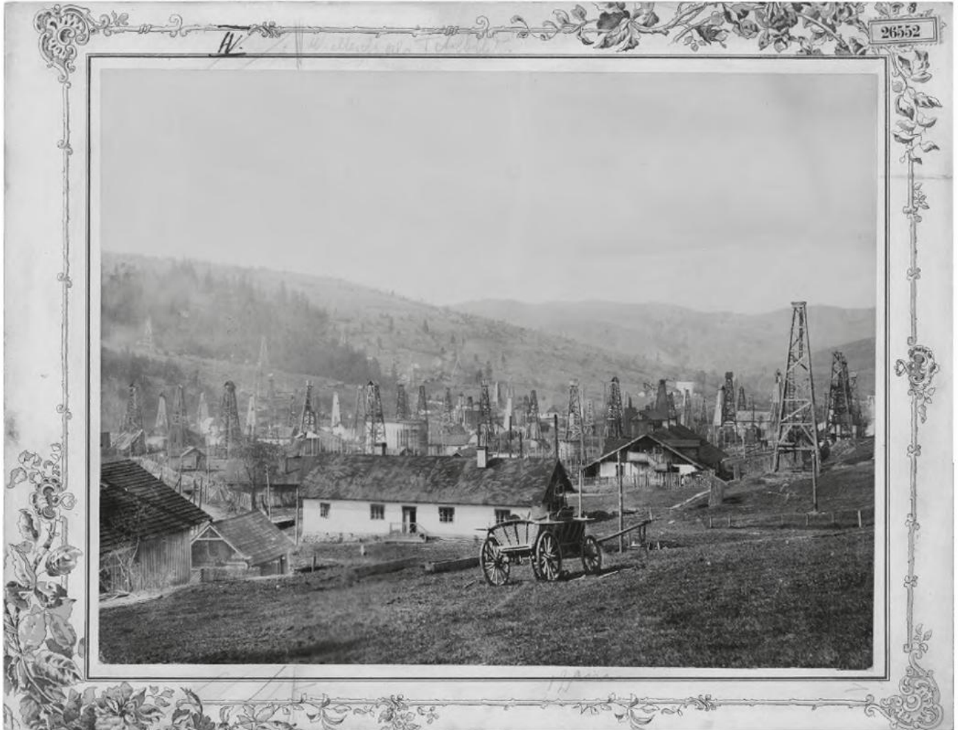
Julius Dutkiewicz: Erdölförderung, um 1880. Photoinstitut Bonartes