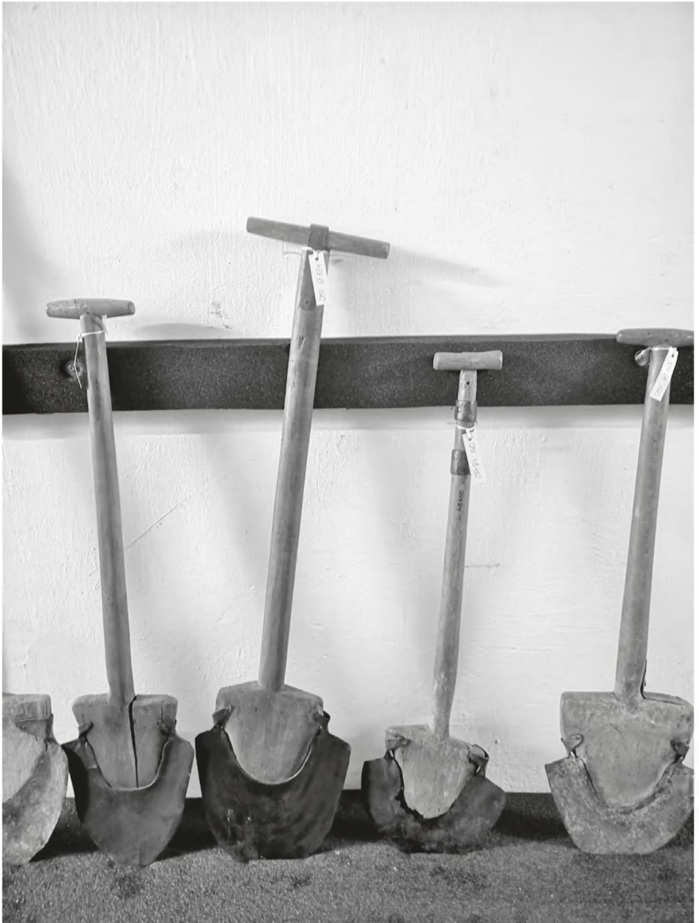
Wir denken Museum als Mehrspartenhaus. Manchmal sind es sogar noch mehr Spaten.