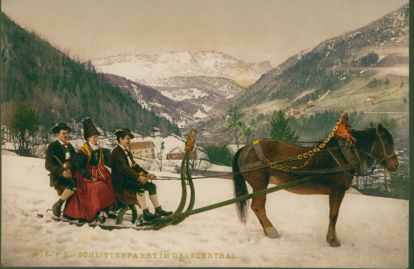
676. P. Z. - SCHLITTENFAHRT IM GROEDENTHAL.