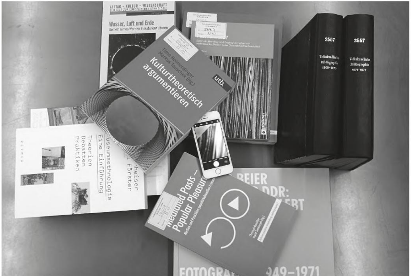
366 Bücher und noch viele mehr.