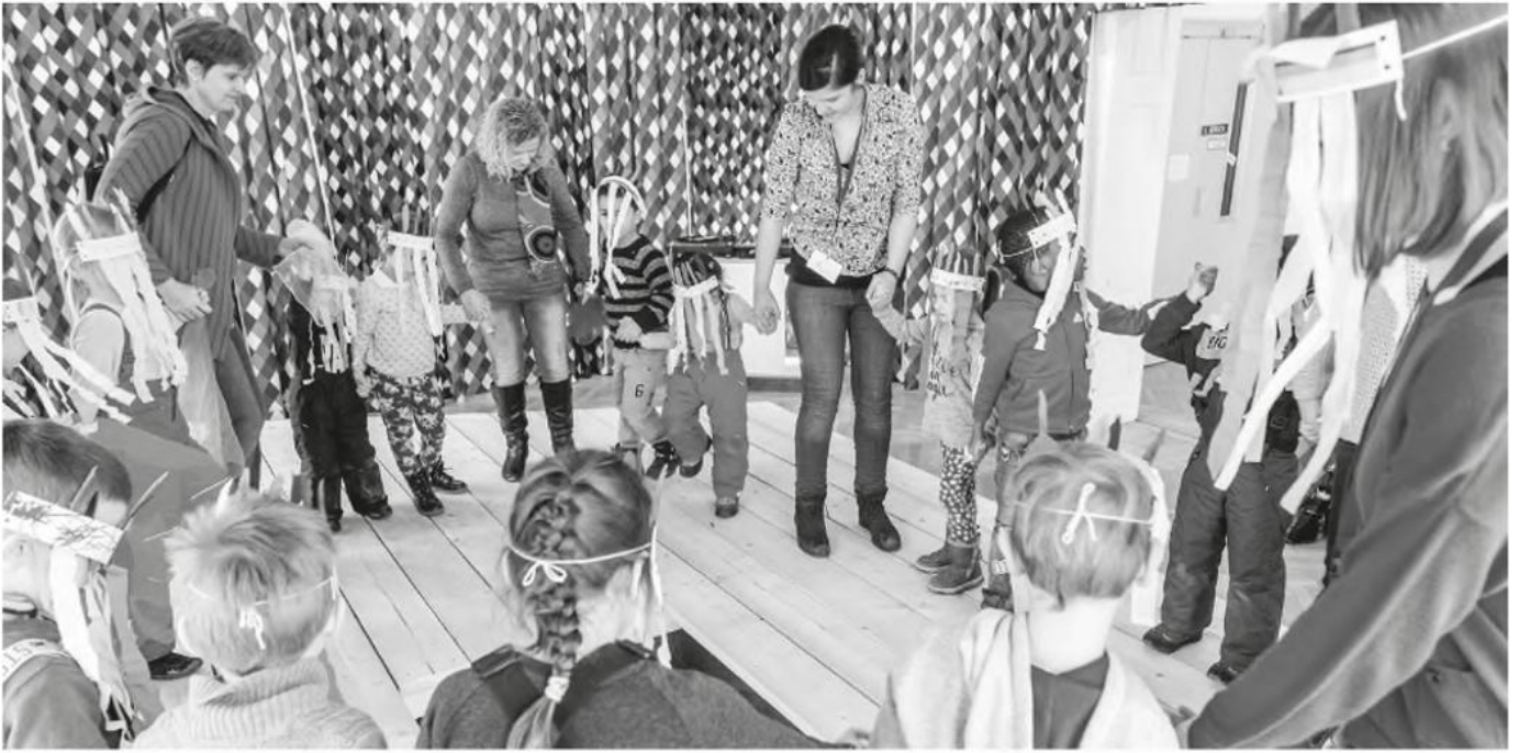
Ein Vermittlungsworkshop im Volkskundemuseum Wien.