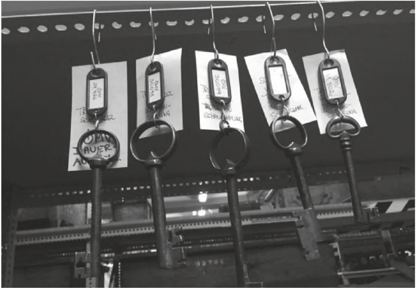
Schlüssel-Hängepartie im Museumsdepot.