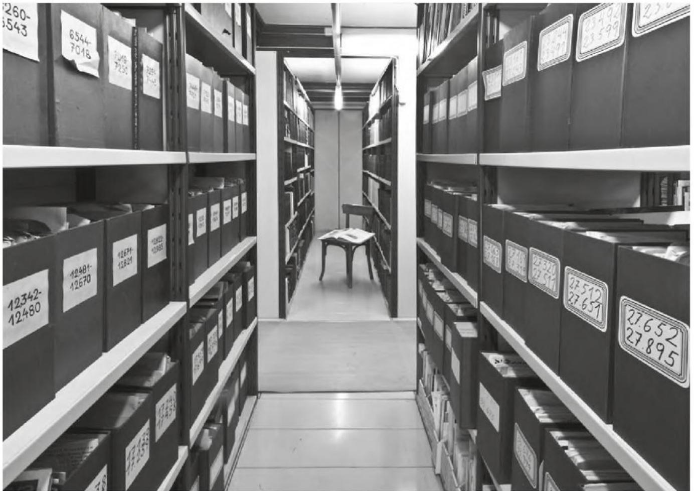
In der Bibliothek des Volkskundemuseum Wien.