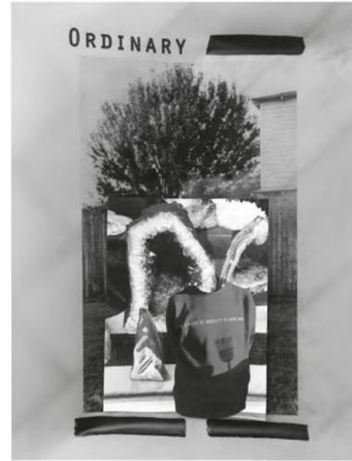
Performative Experimentierräume im Museum

idea of what this museum is: the fact, that there is a mixture of social awareness and aesthetic choice happening all the time.