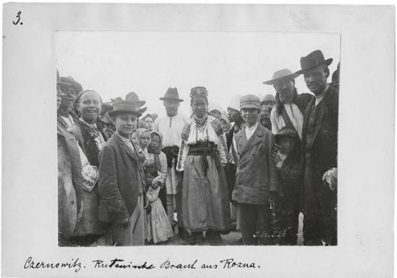
Joseph Szombathy: Czernowitz, Rutenische Braut aus Rozna, 1894. Volkskundemuseum Wien

Zwei Schwerpunkte markieren die Erzählung dieser Ausstellung. Ein Aspekt ist der Einsatz der Fotografie bei der ökonomischen und infrastrukturellen Entwicklung Galiziens ab der zweiten Hälfte des 19. Jahrhunderts. Eine zweite Perspektive gilt der Rolle der Fotografie in der Entwicklung der Volkskunde als wissenschaftlicher Disziplin in der Habsburgermonarchie. Ausgehend von Wien stellten die dort zusammenlaufenden wissenschaftlichen Netzwerke Galizien und die Bukowina sowie das Bildmaterial von ebendort von Beginn an in den Vordergrund ihrer Forschung. Dies lässt sich an der besonderen Präsenz dieser Fotografien innerhalb der ersten Inventarnummern