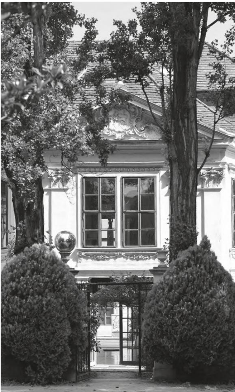
Unter der Diskokugel Beziehungsarbeit leisten

Es beginnt im Inneren der Institution: die Kultur der Zusammenarbeit, das Verständnis über den Sinn der jeweiligen Aufgabe vor allem in Hinblick auf den Nutzen für die Öffentlichkeit. Gleichzeitig geht es in der Trias von Politik, Gesellschaft und Museum um Bewusstseinsarbeit hinsichtlich grundlegender Arbeiten in Museen. Dazu zählen die qualitative Erschließung und die sinnvolle Erweiterung von Sammlungen genauso wie gut aufgesetzte Digitalisierungsprojekte