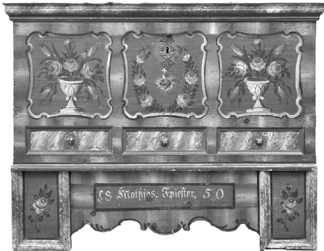
Foto: Truhe aus Freud's Dining Room

Verlängerung der Ausstellung im Volkskundemuseum Wien bis 3. Juli 2016