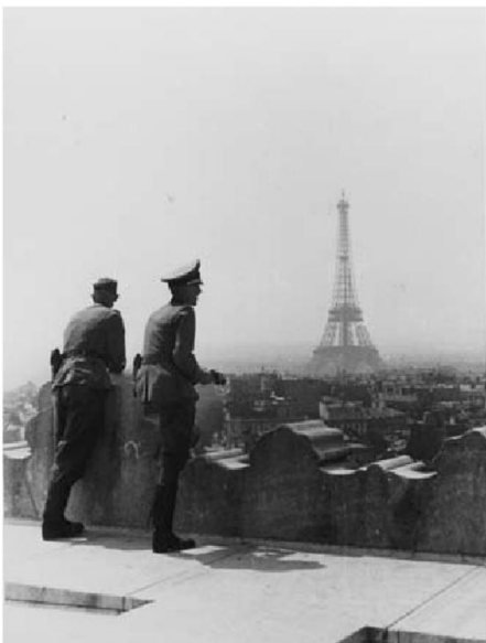
Deutsche Soldaten in Paris blicken vom Arc de Triomphe auf den Eiffelturm, Frankreich 1940