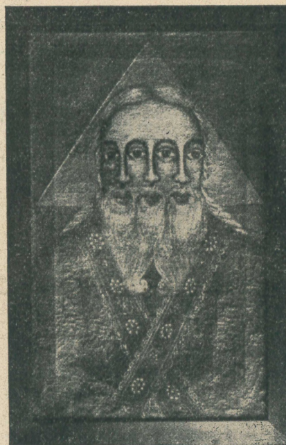
Abbild. 3: Die heilige Dreifaltigkeit.