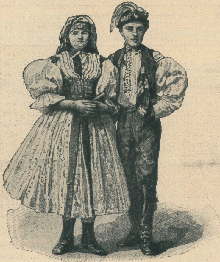
Abbild. 1: Junges Slowakenpaar aus der Umgebung von Velehrad.

Die Kopfzahl der Tschechoslawen beträgt nach den Angaben der Volkszählung vom Jahre 1910 für Böhmen ungefähr 4,242.000, für Mähren 1,869.000, für Schlesien 180.000; daher sind in Oesterreich 6,291.000 dieser Volksgruppe zuzurechnen. In Ungarn gibt es 2,002.000 Slowaken, also in der Doppelmonarchie 8,293.000 Tschechoslawen.