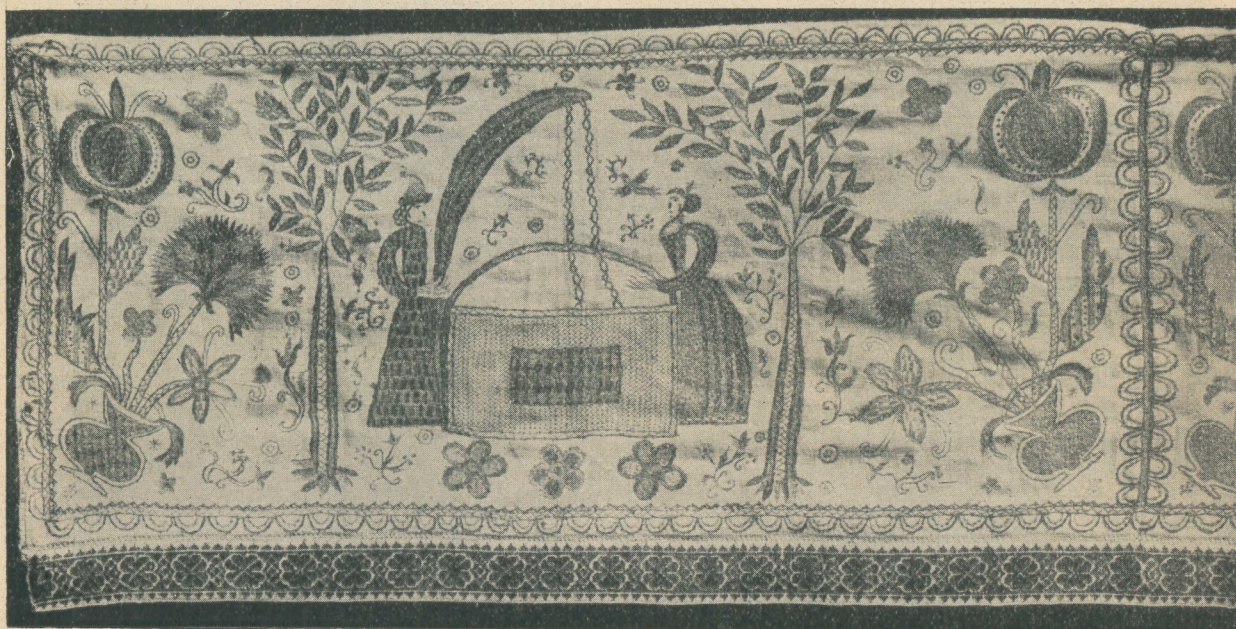
Abbild. 4: Slowakische Stickerei. Wochenbettvorhang.

bolischen Handlung wird dem ganzen Dorf Fruchtbarkeit für seine Felder gewünscht. Aber außerdem pflanzt der junge Bauernbursch auch vor dem Hause seines Mädchens allenthalben auf unserem Kontinent einen „Maibaum“ ein, um ihm auf diesem Weg Gesundheit und Fruchtbarkeit zu wünschen. Die Vorstellung, daß der Baum und die Menschenseele miteinander Beziehungen haben, ist uralte und verbreitete. In Fürstenthäusern war es sogar nicht selten üblich, bei der Geburt eines Kindes im Garten einen Baum zu pflanzen, und die Schicksale beider Wesen sollten, der Volksmeinung zufolge, enge miteinander verknüpft sein. Der Begriff „Lebensbaum“, der aus dem Orient stammt und dessen Darstellung häufig in der Volkskunst unserer Monarchie anzutreffen ist, entspringt dem gleichen Vorstellungskreise.