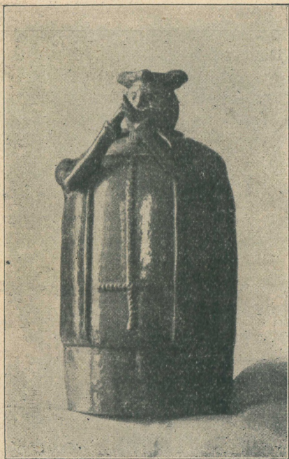
Abbild. 2: Vezierfrug. Mährische Keramik.

Eine der interessantesten Gruppen ist der Zug des „Malkönigs“, wie er zum Beispiel in Mähren, in Ungarisch-Hradisch stattfindet. Die in einer Vitrine zusammengestellten Figuren vergegenwärtigen uns die dort in den Pfingstfeiertagen stattfindende Festlichkeit. Voran reitet ein Herold mit einer Fahne, in der Mitte des Zuges gruppieren sich um den „König“, der von einem jungen Burschen zu Pferd dargestellt wird, zwei Reiter zu beiden Seiten; alle sind in Frauentracht, der „König“ hält gewöhnlich eine Rose im Munde. Außerdem schließen sich noch ungefähr 40 Berittene in bäuerlicher Gewandung an. Der Herold deklamiert vor einem Hause, vor dem der Zug eben hält, improvisierte Verse, die in humoristischer Weise die Eigentümlichkeiten der Bewohner loben, beziehungs-