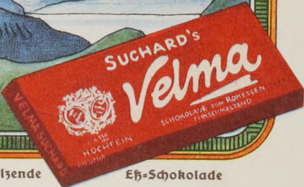
Velma, die feinschmelzende