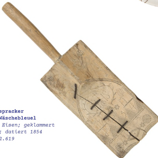
Wäschepracker oder Wäschebleuel Holz, Eisen; geklammert Tirol; datiert 1854 ÖMV/32.619