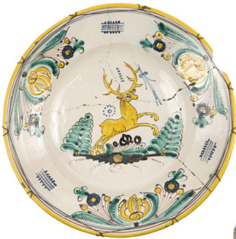
Tiefer Teller mit Drahtbindung Keramik, Fayence, Eisendraht; gebunden Westslowakei; Anfang 19. Jh. ÖMV/6.215