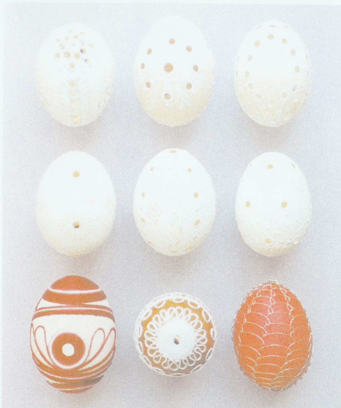
Zeitgenössische Ostereier mit verschiedenen Arten des Dekors: Perforierung, Applikationen aus Garn und Draht; Sammlung des Ethnographischen Instituts des Mährischen Landesmuseums Brünn (Tschechische Republik)

Ostereierkollektionen. Die größten werden in den Museen in Prag, Olmütz und Brünn aufbewahrt. Die Sammlung von Ostereiern im Ethnographischen Institut des Mährischen Landesmuseums zählt mehr als 8000 Exemplare.