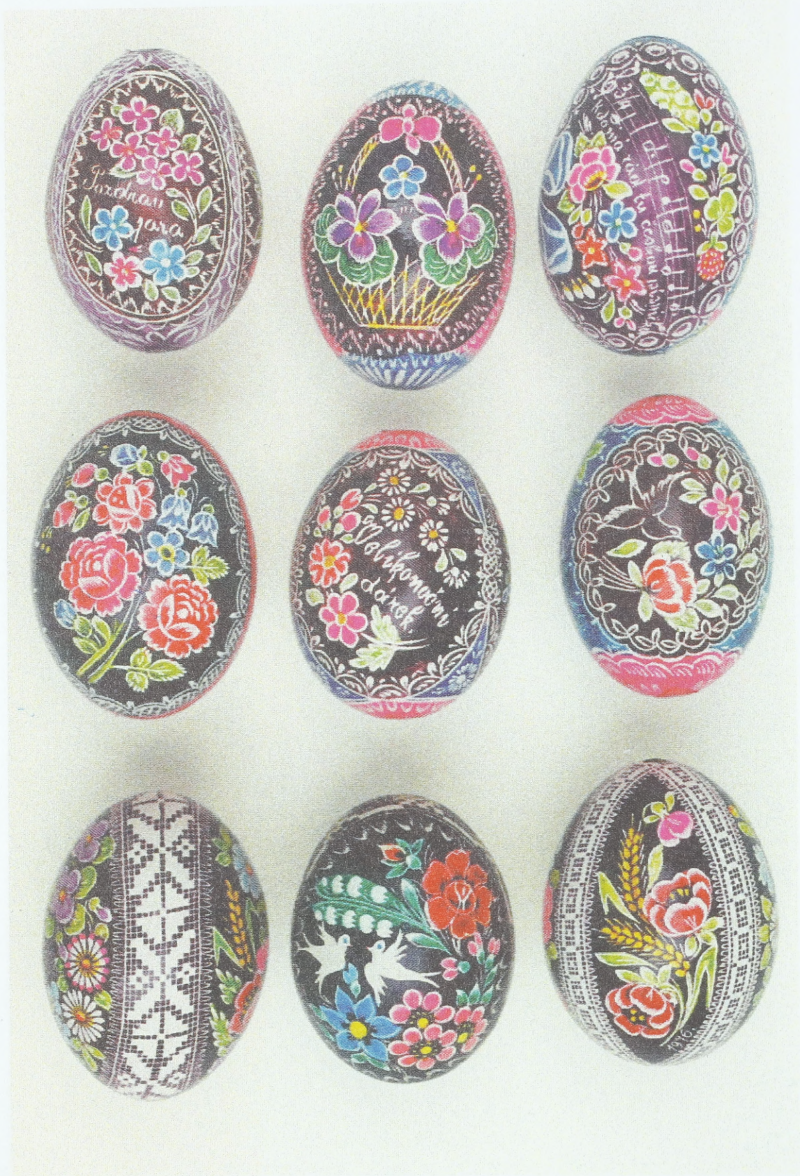
Gekratzte und kolorierte Ostereier aus Südmähren (Umgebung der Stadt Klobouky u Brna), 70er Jahre des 20. Jahrhunderts; Sammlung des Ethnographischen Instituts des Mährischen Landesmuseums Brünn (Tschechische Republik)