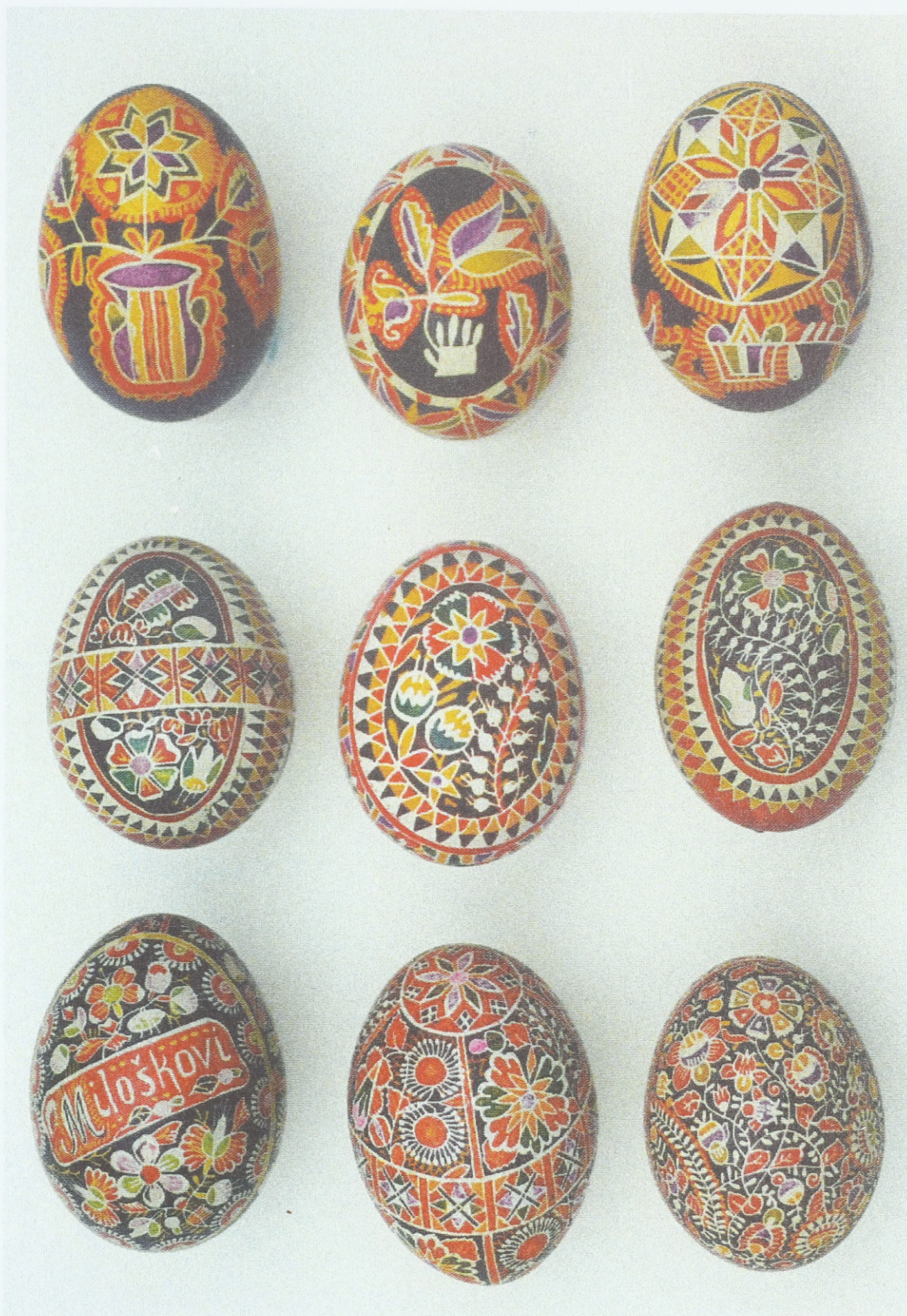
Ostereier aus Südostmähren/Mährische Slowakei (Ostrožská Nová Ves – Umgebung der Stadt Uherské Hradiště), Anfang des 20. Jahrhunderts; Sammlung des Ethnographischen Instituts des Mährischen Landesmuseums Brunn (Tschechische Republik)