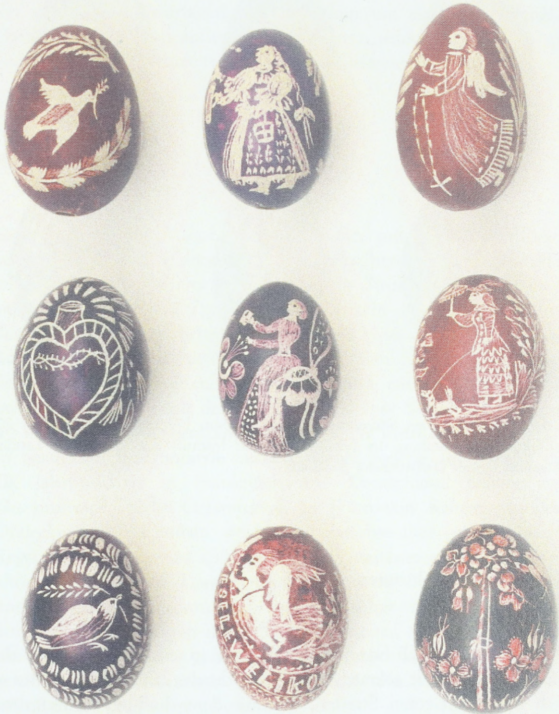
Gekratzte Ostereier aus Südostmähren (Umgebung von Uherské Hradiště), Anfang des 20. Jahrhunderts; Sammlung des Ethnographischen Instituts des Mährischen Landesmuseums Brunn (Tschechische Republik)