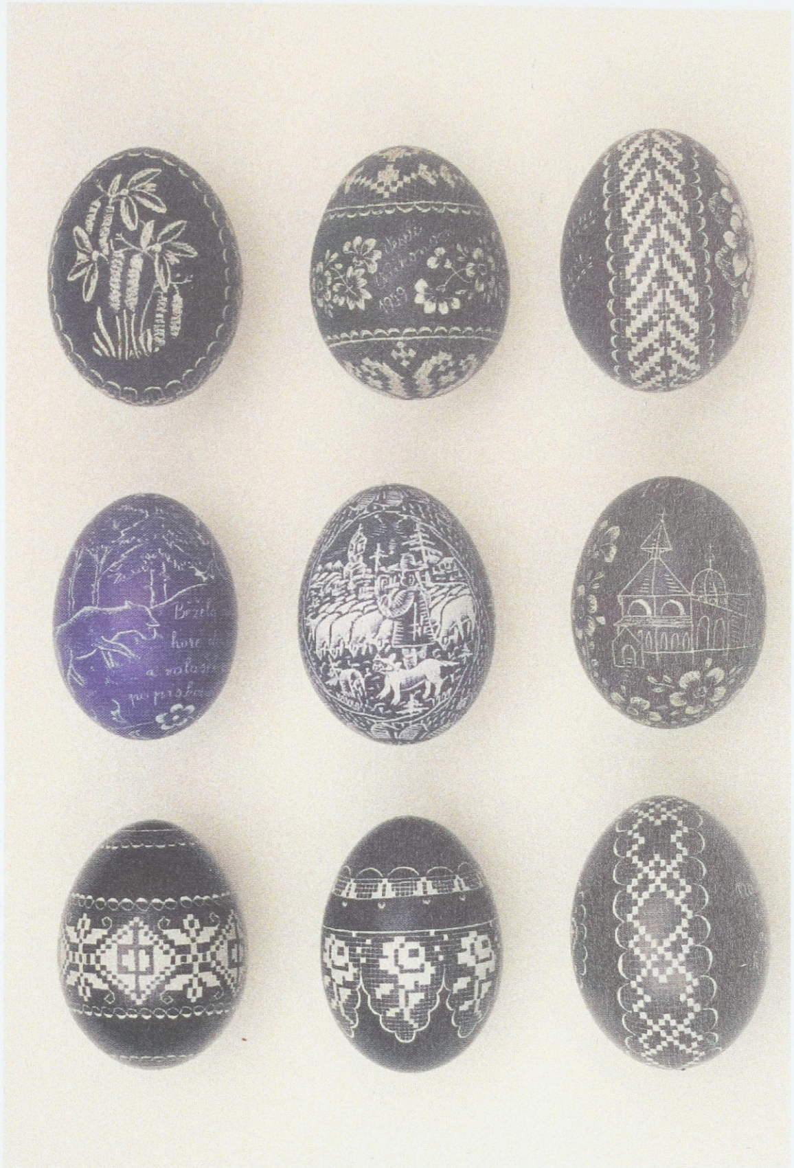
Gekratzte Ostereier aus Nordmähren (Umgebung von Rožnov pod Radhoštěm), 60er - 90er Jahre des 20. Jahrhunderts; Sammlung des Ethnographischen Instituts des Mährischen Landesmuseums Brünn (Tschechische Republik)