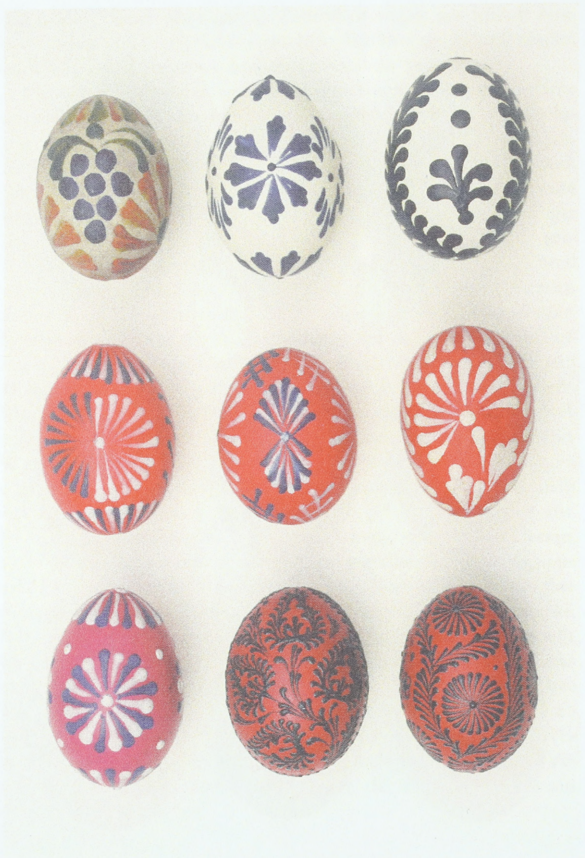
Plastisch mit Farbwachs verzierte Ostereier aus Südmähren (Umgebung der Städte Hustopeče und Ždánice); Sammlung des Ethnographischen Instituts des Mährischen Landesmuseums Brünn (Tschechische Republik)