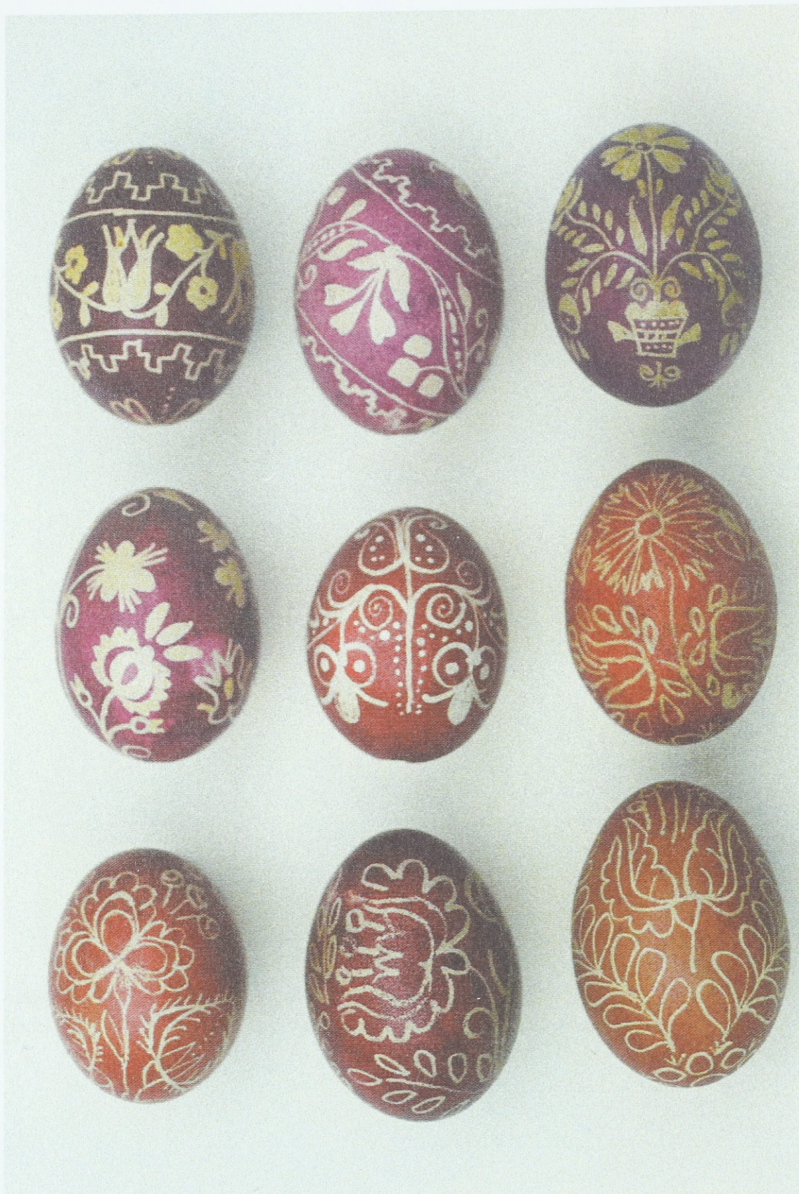
Ostereier aus Südmähren (Umgebung von Břeclav), Wachsreservierung und Ätzen, Anfang des 20. Jahrhunderts; Sammlung des Ethnographischen Instituts des Mährischen Landesmuseums Brunn (Tschechische Republik)