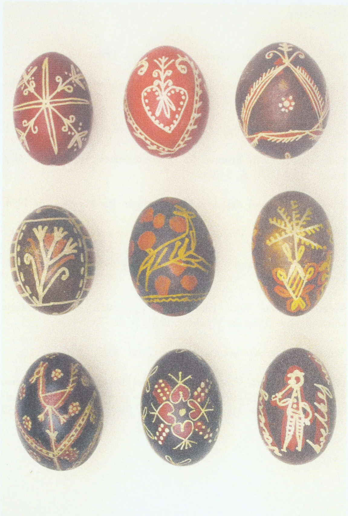
Ostereier aus Nordmähren (Umgebung von Rožnov pod Radhoštěm und Valašské Meziříčí), Anfang des 20. Jahrhunderts; Sammlung des Ethnographischen Instituts des Mährischen Landesmuseums Brunn (Tschechische Republik)