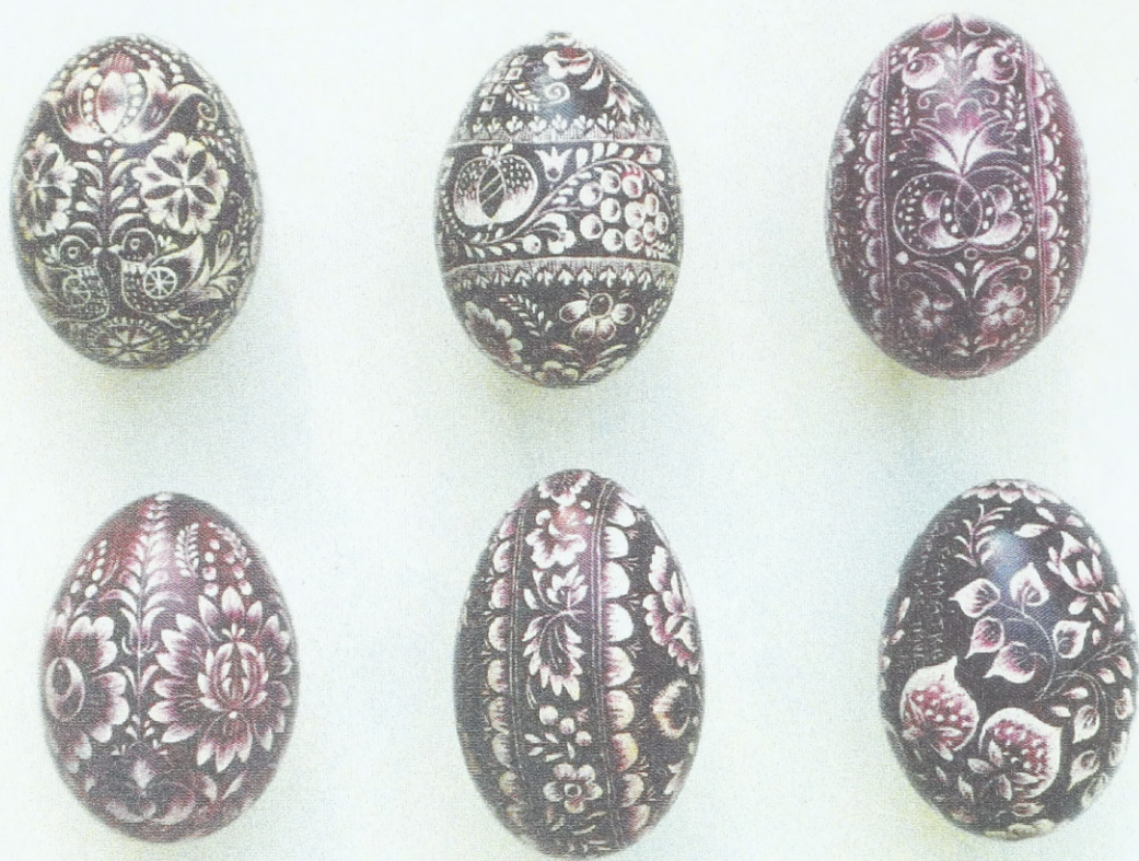
Gekratzte Ostereier aus Südmähren (Umgebung von Břeclav), 60er Jahre des 20. Jahrhunderts; Sammlung des Ethnographischen Instituts des Mährischen Landesmuseums Brunn (Tschechische Republik)