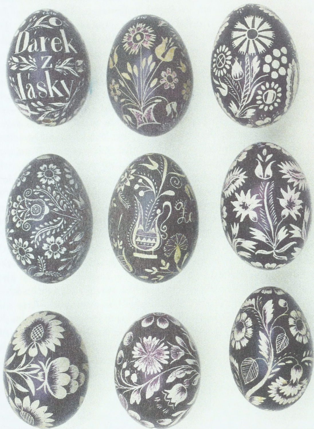
Gekratzte Ostereier aus Südmähren (Umgebung von Kyjov), Anfang des 20. Jahrhunderts; Sammlung des Ethnographischen Instituts des Mährischen Landesmuseums Brunn (Tschechische Republik)