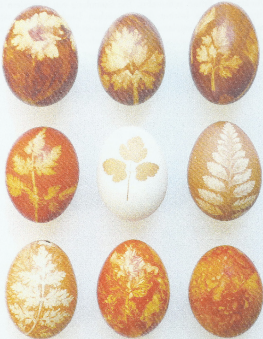
Ostereier mit Pflanzenabdrücken (Umgebung von Luhačovice, Třebíč, Miroslav, Bruntál), 4. Viertel des 20. Jahrhunderts; Sammlung des Ethnographischen Instituts des Mährischen Landesmuseums Brunn (Tschechische Republik)