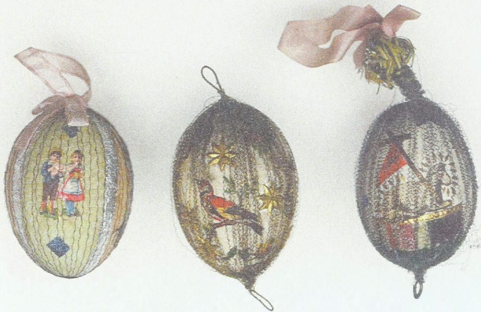
Ostereier aus Olmütz mit Applikationen (Textil, Drähtchen, Bildchen) – Klosterarbeit, Ende des 19. Jahrhunderts; Sammlung des Ethnographischen Instituts des Mährischen Landesmuseums Brünn (Tschechische Republik)