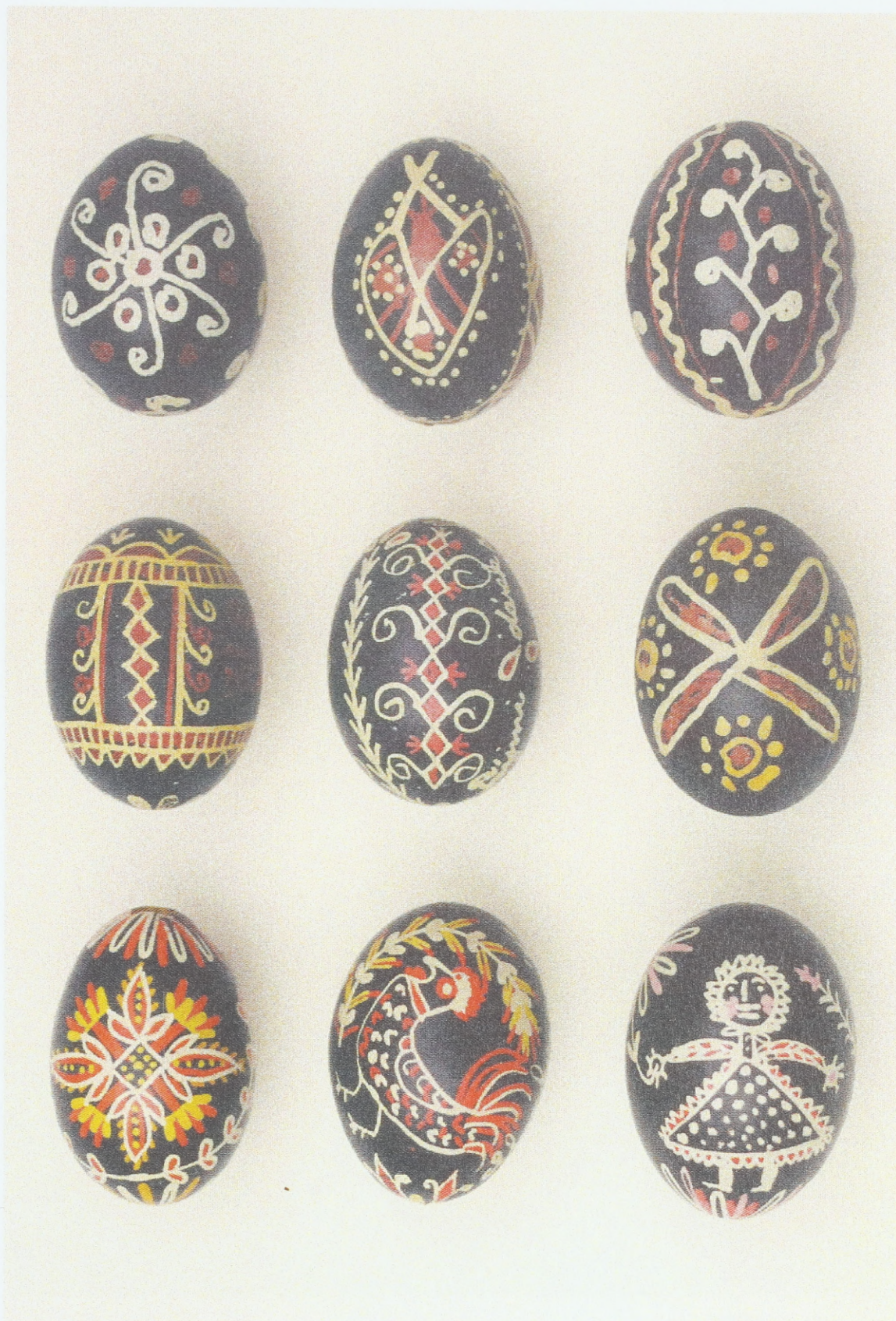
Batikeier aus dem 1. Drittel des 20. Jahrhunderts aus Ostmähren/Walachei (Umgebung von Valašské Klobouky, Vsetín und Vizovice); Sammlung des Ethnographischen Instituts des Mährischen Landesmuseums Brunn (Tschechische Republik)