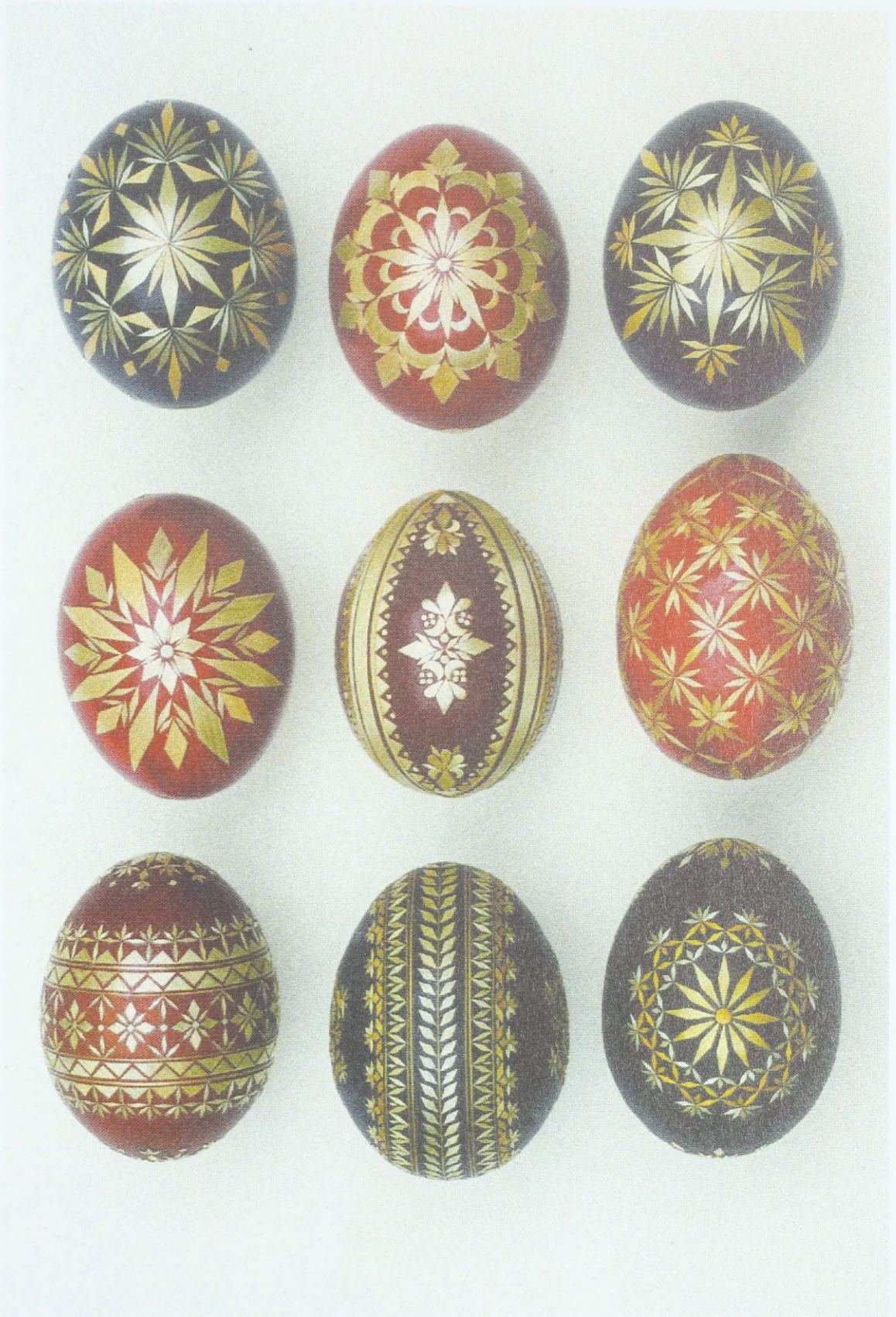
Strohbelebte Ostereier aus Mittelmähren (Umgebung von Vyškov und Kroměříž), Ende des 20. Jahrhunderts; Sammlung des Ethnographischen Instituts des Mähri- schen Landesmuseums Brünn (Tschechische Republik)