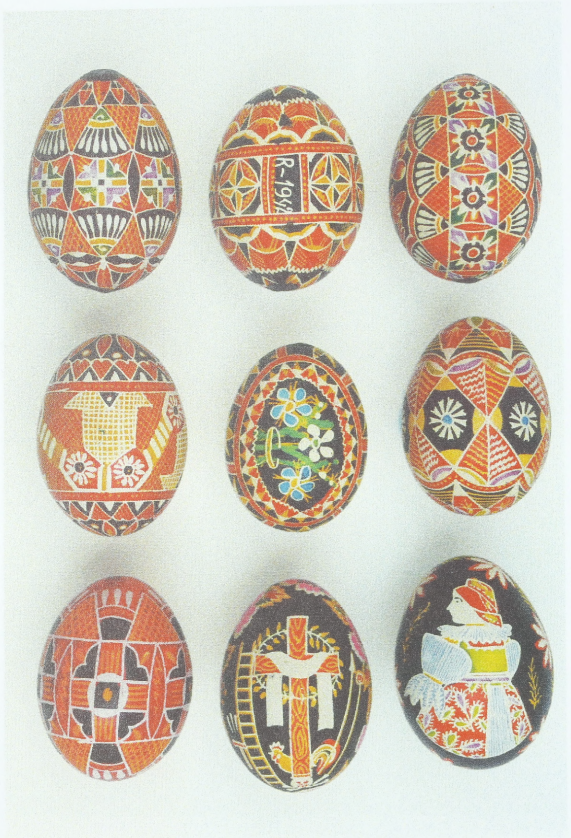
Ostereier aus Südostmähren/Mährische Slowakei (Vnorovy – Umgebung der Stadt Uherské Hradiště), 30er Jahre des 20. Jahrhunderts; Sammlung des Ethnographischen Instituts des Mährischen Landesmuseums Brunn (Tschechische Republik)