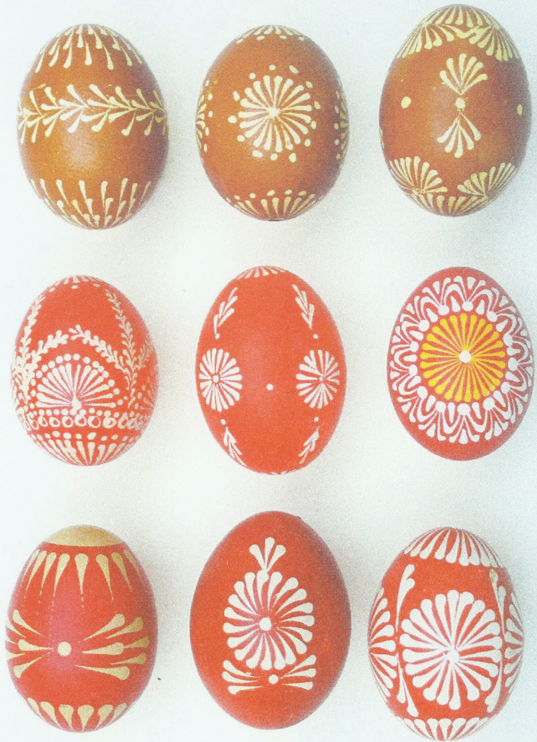
Zeitgenössische Batikeier aus Westmähren (Umgebung der Städte Telč, Třebíč, Tišnov); Sammlung des Ethnographischen Instituts des Mährischen Landes- museums Brünn (Tschechische Republik)