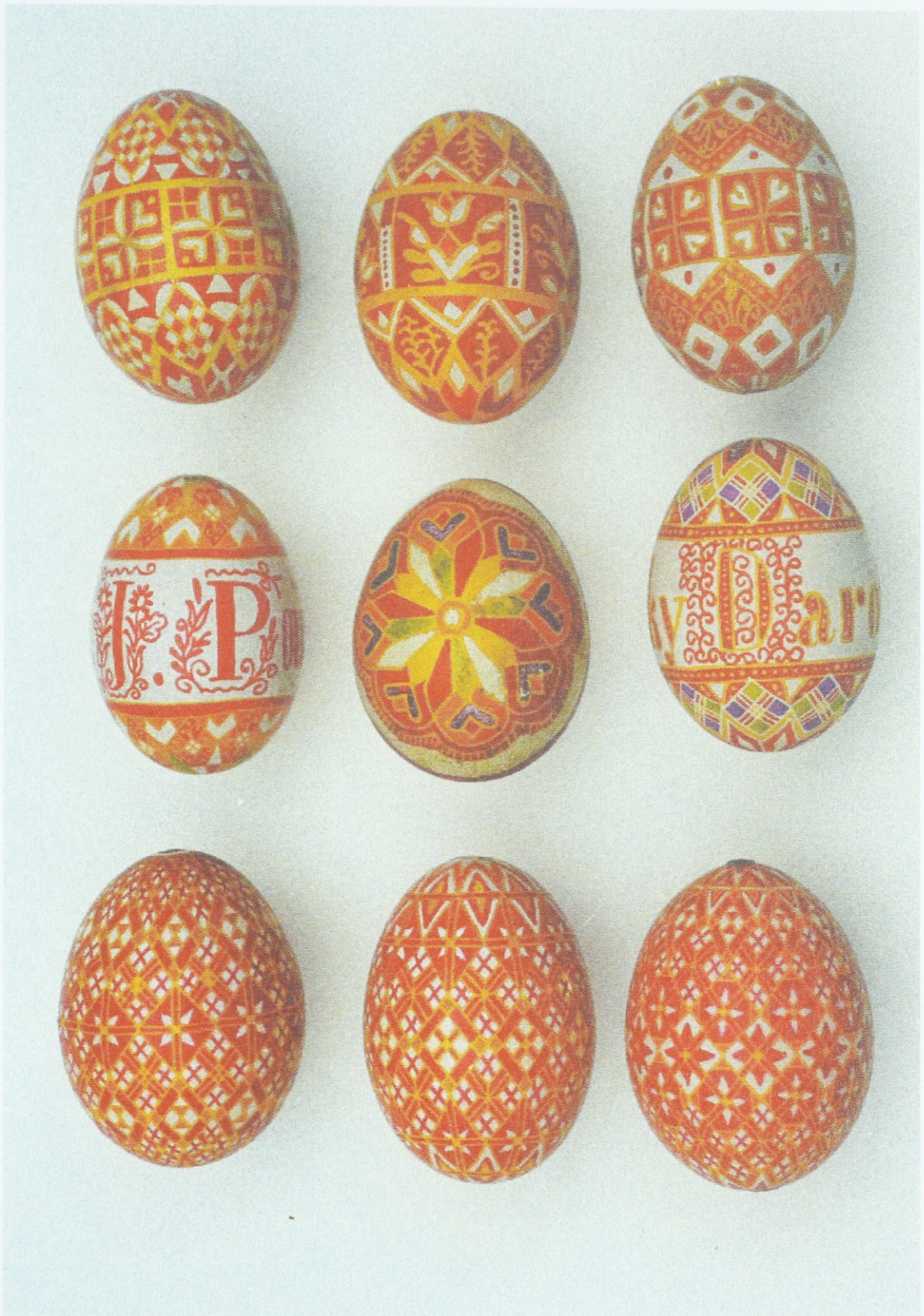
Ostereier aus Südostmähren/Mährische Slowakei (Ostrožská Nová Ves - Umgebung der Stadt Uherské Hradiště), Anfang des 20. Jahrhunderts; Sammlung des Ethnographischen Instituts des Mährischen Landesmuseums Brunn (Tschechische Republik)