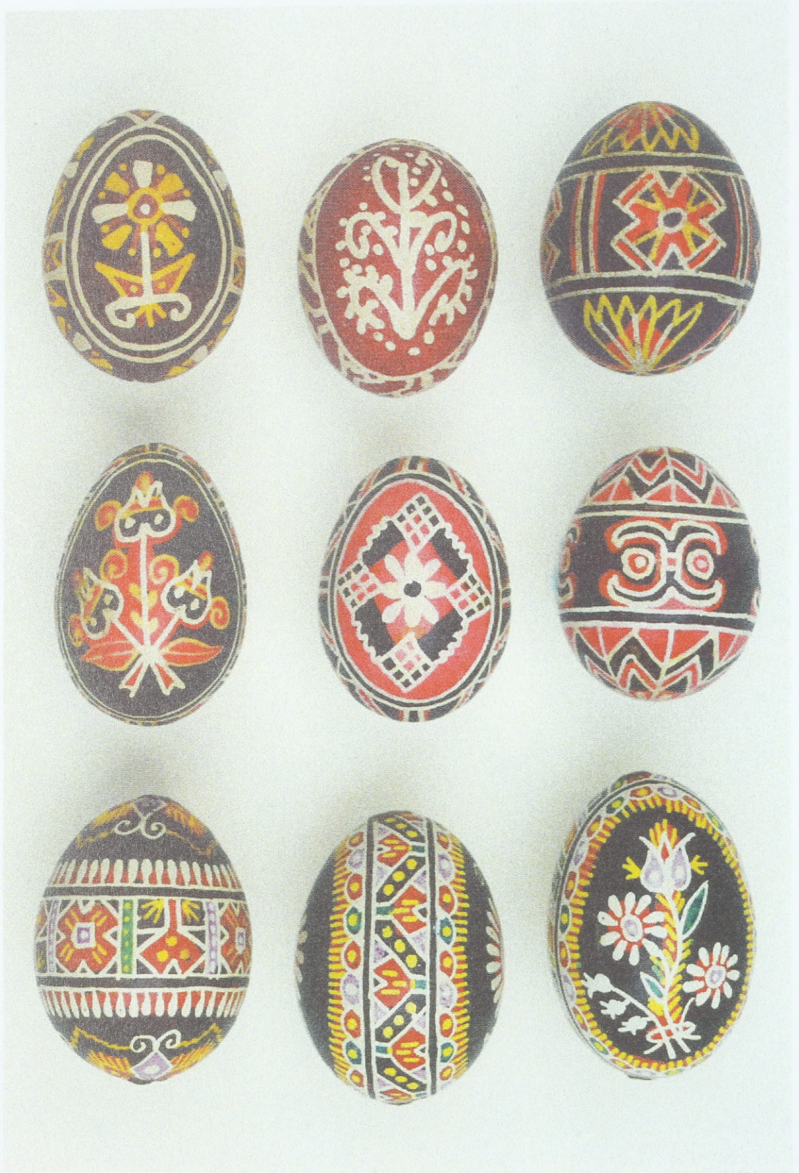
Batikeier aus Südostmähren/Mährische Slowakei (Umgebung von Uherský Brod), 60er Jahre des 20. Jahrhunderts; Sammlung des Ethnographischen Instituts des Mährischen Landesmuseums Brunn (Tschechische Republik)