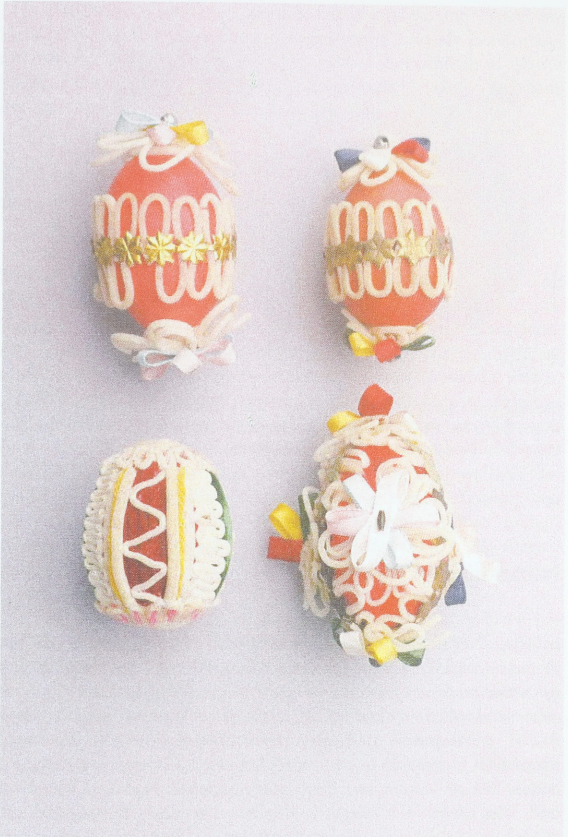
Ostereier aus Westmähren (Umgebung von Blansko) mit Applikationen aus Binsenmark und Textil; Sammlung des Ethnographischen Instituts des Mährischen Landesmuseums Brunn (Tschechische Republik)