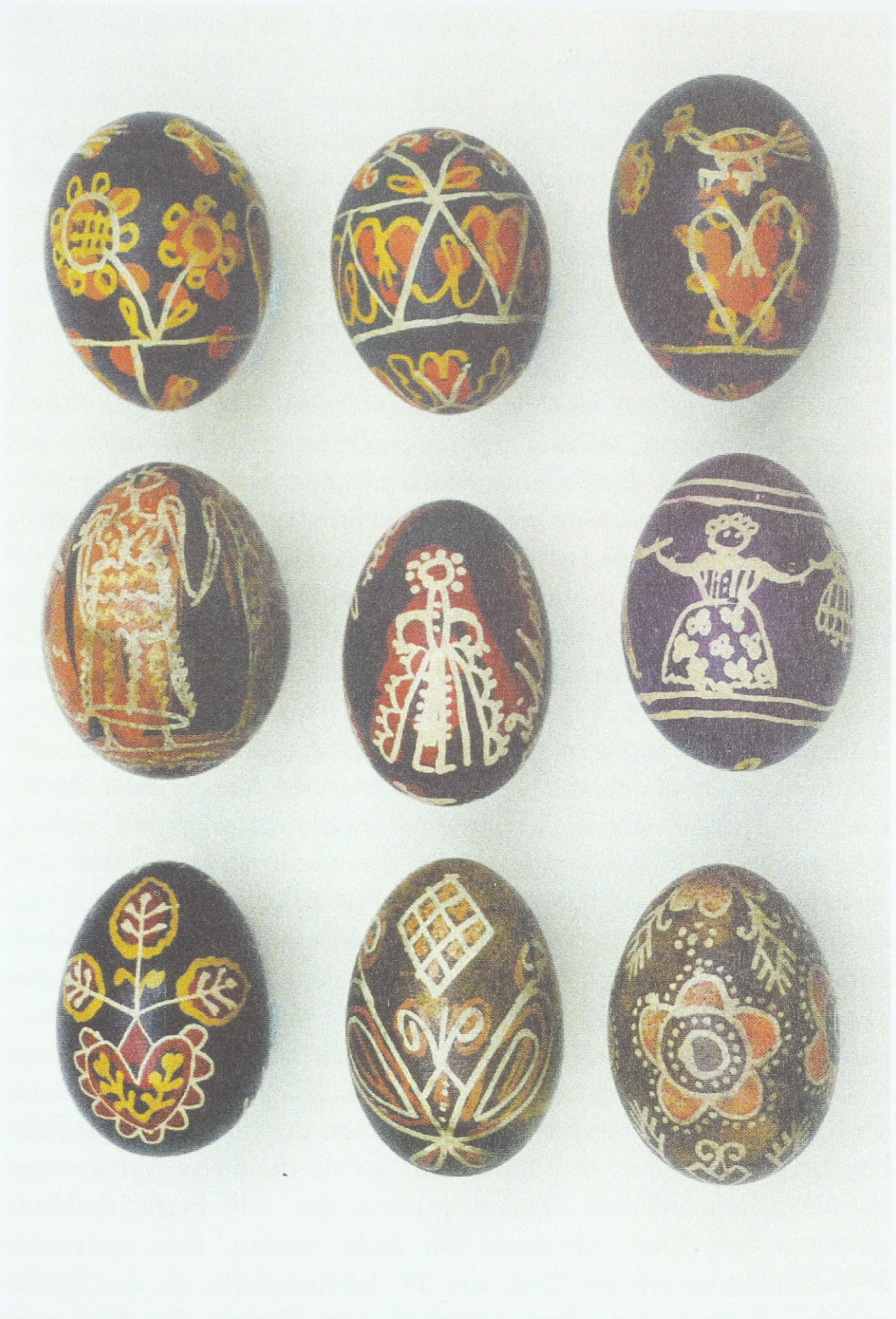
Batikeier aus Nordmähren/Mährische Walachei (Umgebung von Valašské Klobouky und Nový Jičín), Anfang des 20. Jahrhunderts; Sammlung des Ethnographischen Instituts des Mährischen Landesmuseums Brunn (Tschechische Republik)