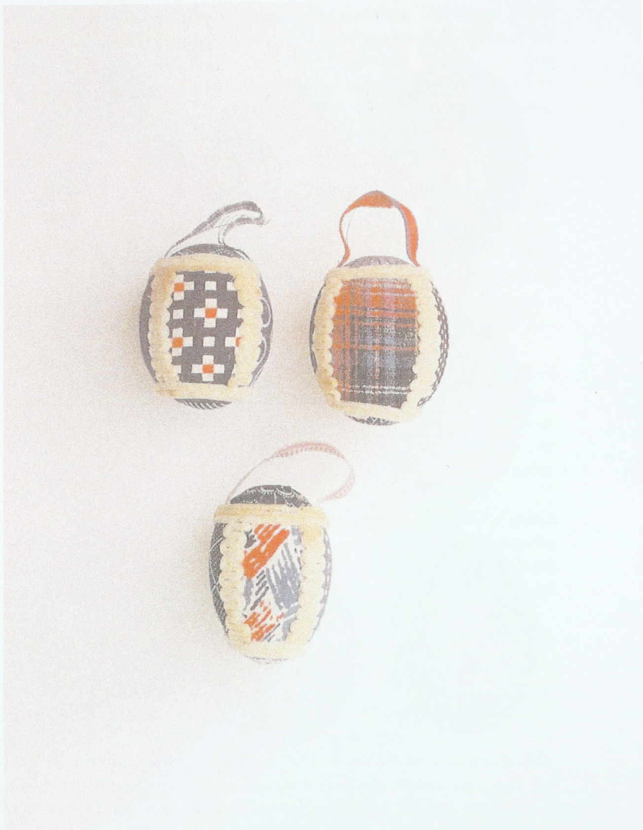
Ostereier aus Ostmähren, mit Textil und Binsenmark beklebt (Umgebung von Vizovice), um 1943); Sammlung des Ethnographischen Instituts des Mährischen Landesmuseums Brünn (Tschechische Republik)