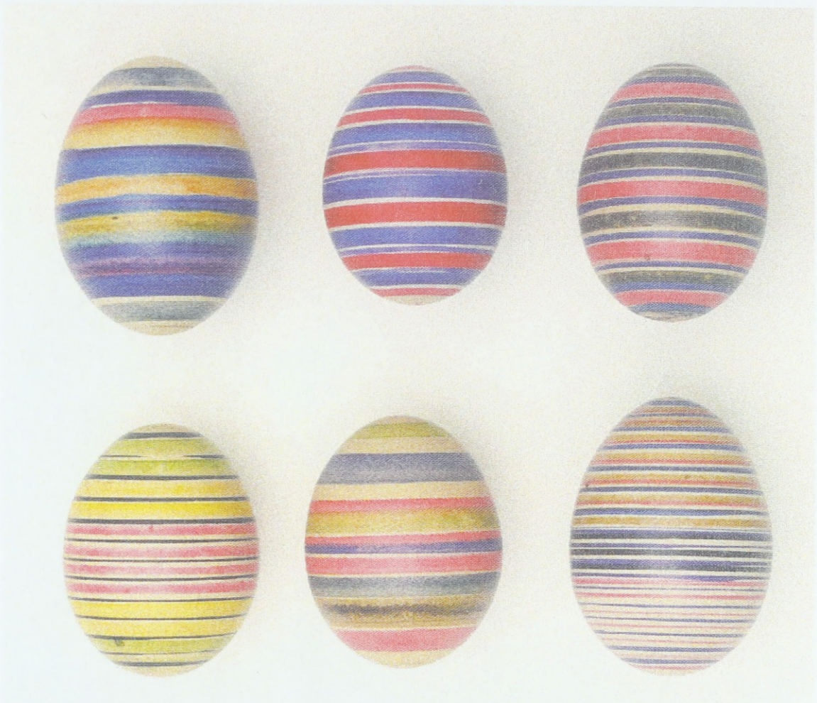
Ostereier aus Westmähren (Umgebung von Telč), Verzierung mit bunten Streifen auf der Drehmaschine; Sammlung des Ethnographischen Instituts des Mährischen Landesmuseums Brünn (Tschechische Republik)