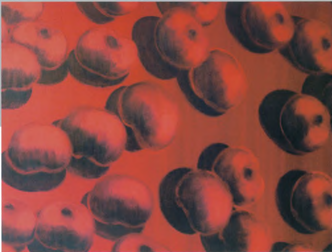
Apfel Rot, 2000 Acryl Leinwand | Canvas, 100 x 150 cm (Ausschnitt | Close-up)