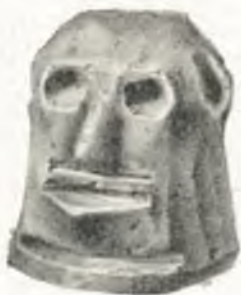
Fig. 30. Tonkopf zum Einstecken von Leuchtspänen, Oberösterreich.

Aufsatz tisch 164: Siebenarmiger Kerzenleuchter in kunstvoller Schmiedearbeit; Kerzenleuchter, einfach und doppelt, mit Klemmfedern; Glockenleuchter; Schiebleuchter; Handleuchter; Kellerleuchter; Kerzengußformen, 16. bis 19. Jahrh. Zumeist Alpenländer.