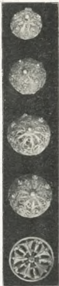
Fig. 15. Westenknöpfe, aus Siberfilzgran, Salzburg.

Kasten XII (56—60): Trachten, Frauenhauben und Stickerien , zumeist von den Slovenen in Kärnten und Krain: In 56: Kopfpolsterüberzüge, Altardeckerl und Leintücher in Kreuz-, Zopf- und Stilstich mit schwarzer, blauer oder roter Schafwolle reich gestickt; 2 Frauenhauben mit breiten goldgestickten Borten, aus Krain. In 57: Polsterüberzüge, mit schwarzer Wolle gestickt, Leintuch mit roter Stickerei und geklöppelter Spitze, eine Frauenhaube mit schwarzer, gestickter Seidenborte, aus Oberkrain; Figurine einer