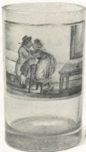
Fig. 6. Trinkglas mit Scherzbild, Niederösterreich.

Zahlreiche Bauernmajoliken aus Gmunden und Niederösterreich, zumeist Schüsseln mit interessanten Heiligendarstellungen, Landschaften, Seebildern u. s. w. befinden sich auf den Truhen bei der Krippe. Daran schließen sich