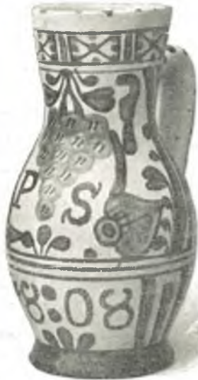
Fig. 1. Winzerkrug, 1808, Niederösterreich.

Vor der Krippe ist ein Modell der alten Dorfkirche von Hallstatt mit geschnittener Inneneinrichtung aufgestellt, ein Werk des Schnitzers Johann Kieninger in Hallstatt. Haupt- und Seitenaltäre der Kirche sind in 36 ausgestellt.