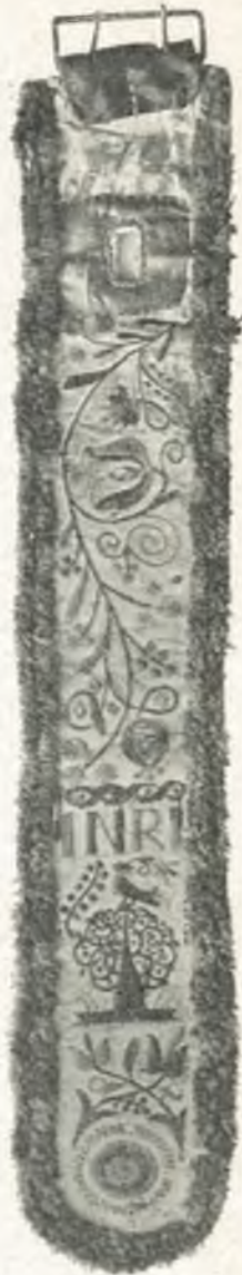
Fig. 10. Kuhglockenband, Pertisau, Tirol.

Kasten VII (32—36): Volkskult in den deutschen Alpenländern. In 32: Totenkronen (wurden früher statt der Kränze auf die Truhe gestellt), Oberösterreich; Totenkranz, Steiermark; Hochzeitsladerkränzchen, Tirol und Oberösterreich; geschnitzte Heiligenfiguren aus Tirol, Nieder- und Oberösterreich. In 33: Geschnitztes Holzbild des heiligen Petrus (16. Jahrh.); 2 Reliquienkästchen, Klosterneuburg; Krippenfiguren, Tirol; Krippenengel, Salzburg; das letzte Abendmahl (die Figuren aus Wachs) in Glaskästchen; Krippenfigur aus Tirol; »Scheitelweihe« aus der Viechtau (am heiligen Feuer am Kar samstag angebrannt). In 34: Tischkreuze aus Rauchhäusern, Steiermark; Fliegenhimmel aus Stroh, mit heiligem Geist aus Holz geschnitzt, wird ober dem Tische aufgehängt, Pustertal, Tirol; heiliger Hieronymus und heiliger Rupert aus Holz geschnitzt, bemalt, Kärnten. Heil. Petrus, Flucht nach Aegypten, Ecce homo, aus Tirol; Glaskugeln mit heiligem Geist, Oberösterreich; Madonna mit dem Kinde; Muttergottes auf der Weltkugel, aus dem Ennstale; Jesus mit Ketten, aus Klosterneuburg; heiliger Petrus, aus Aussee; Muttergottes mit Kind, aus Graz; Holzgruppe: Maria, Elisabeth und Jesukind, bemalt und vergoldet, in Barockkästchen, aus Aussee; Mariazeller Muttergottes; heiliger Paulus, aus Aussee; unten Heiligenfiguren aus Tirol; Kreuzigungsgruppe, Steiermark (17. Jahrh.). In 35: Tischkreuze in Herzform gefaßt, mit angehängten