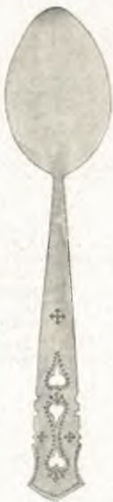
Fig. 8. Holzlöffel, Krain.

Kasten V (20--24): Hausrat aus den deutschen Alpenländern. In 20: Milchfäßchen (bez. 1792), Oberösterreich; Wage, Mohnmörser aus Krain;