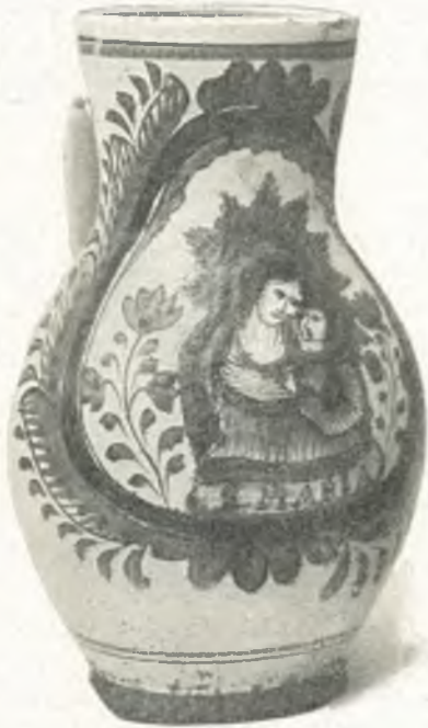
Fig. 4. Krug mit Muttergottesbild, 18. Jahrh., Niederösterreich.

den sogenannten Zipserkrügen, aufweisen; weiterhin Krüge und Teller aus dem Heanzengebiet im Osten Niederösterreichs und dem ungarischen Grenzgebiet mit einfacherer Verzierung; unten Prunkkrüge, Teller, Weihbrunnen in lebhaften Farben, Lundenburger Gegend. In 9: oben Krüge, Teller und