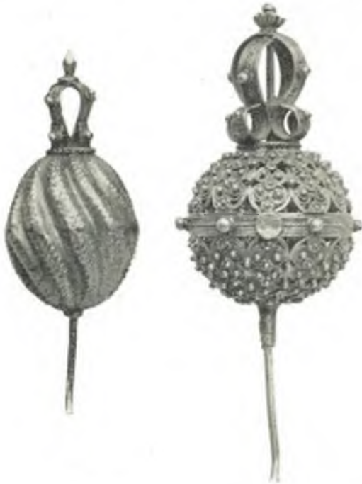
Fig. 28—29. Haarnadeln, Dalmatien.

Pulte 147—151: In 147—148: Gewirkte Täschchen, Aermelbesätze, Brusteinsätze , Süddalmatien; Frauenhemden , auf das reichste in Seide gestickt, Insel Uljan. In 149—150: Dalmatinischer Volksschmuck : Haargehänge, Ohrgehänge,