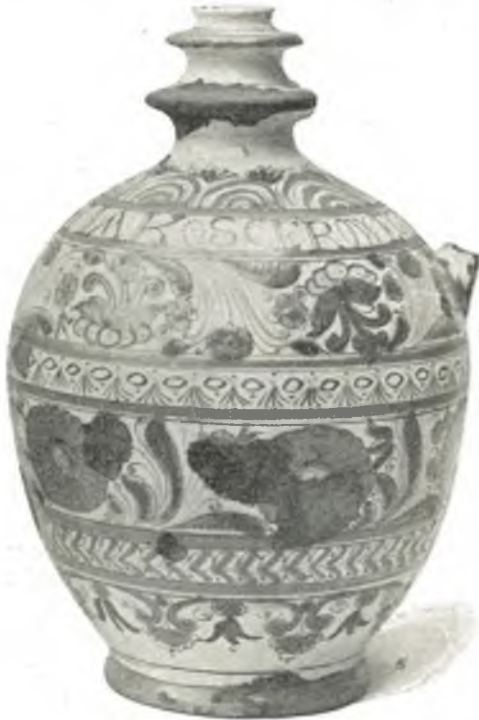
Fig. 25. Slowakischer Wasserplutzer.

Kasten XXXI (143): Oberhemden , reich gestickt, aus Dalmatien, Umgebung von Ragusa; Frauenschürzen in Kilimtechnik, Hemden und Kopftücher , mit weißer Durchbruchspitze verziert,