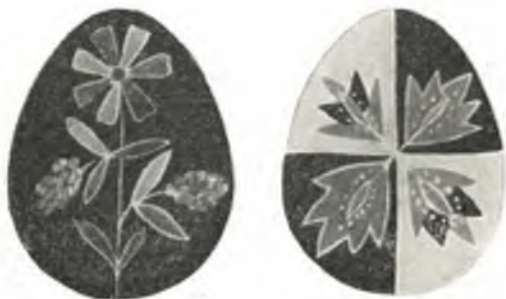
Fig. 31—32. Bemalte Ostereier der Rumänen, Bukowina.

Im Raume vor dem Eingang: Pferdekummet , Böhmen; Bandwebstuhl , Landskron, Böhmen; Zwirnmaschine , Böhmen; Webstuhl der Huzulen, Bukowina; 3 Flachsbrecheln , alpenländisch; „ Spangoas “ zum Spannhobeln, Oberösterreich; Banktruhe , mit Madonna und lateinischem Bandspruch bemalt, Mezzolombardo, Südtirol; großer Faßboden , mit geschnitzter Reliefdarstellung »St. Barpara«, bez. M. S. 1818.