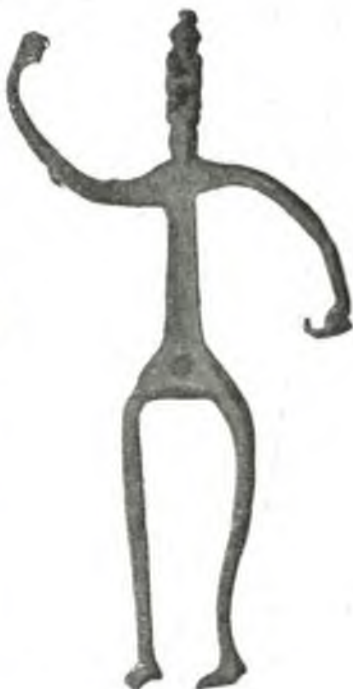
Fig. 14. Votivfigürchen, Niederösterreich.

Grödentäl; Muttergottes auf der Weltkugel , aus Mödling; 2 Reliquiarien mit den Herzen Jesu und Maria, mit eingerolltem Goldpapier verziert, in Glaskästchen, aus Tirol; 2 Altarleuchter aus vergoldetem Holze, mit Engelsköpfen verziert, aus dem Jahre 1697, aus Lanzenkirchen; Mariazeller Muttergottes mit Samtmantel, in vergoldetem Barockkästchen, aus Aussee; bemalter Kupferstich , die