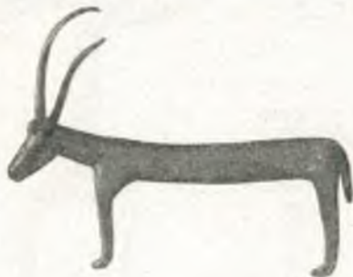
Fig. 12. Eisernes Votivrind, Böhmerwald.

Pult 36: Eiserne Votivtiere aus Niederösterreich und Steiermark; wächserne Votivgaben als: Arme, Beine, Herzen, Tiere und Häuser; Wetterkerzen aus Salzburg; Sterbekerze aus Tirol; Kröte aus Blei, Votiv gegen Frauenleiden, Mödling; Johanneskopf mit Schüssel, aus Holz geschnitzt, aus Tirol; Votivfigur aus Marmor, in Glaskästchen; Wallfahrtsmedaillons aus Ton, mit der heiligen Dreifaltigkeit, vom Sonntagsberg; Wallfahrtsbild ,