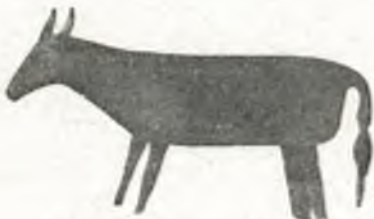
Fig. 19. Eiserne Votivkuh, Böhmerwald.

Vitrine 97: Gold- und Silberhauben aus Deutschböhmen, zumeist dem Egerlande. Krippenhäuschen , Hausindustrie in Reichenberg.