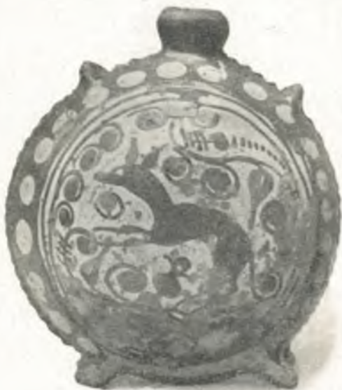
Fig. 2. Farbige glasierte Tonflasche, Oberösterreich.

Nische 5: Eisernes Herdgerät für offene Herde in Rauchhäusern, Feuerhunde oder Feuerböcke mit Widerlagern zum Auflegen von Bratspießen, Kesselhänge, Ofengabel und Topfgabel,