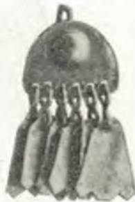
Fig. 23. Ohrgehänge der Bojken, Galizien.

In den Pulten 128–130: Buntgefärbte Ostereier der Ruthenen, Rumänen und Huzulen. Ueber den Pulten: Modelle verschiedener Zaunformen in den Karpathen; polnisches Marionettentheater aus Galizien; Krippe aus Schlesien; Schusterzunflade , bez. 1827; Kürschnerlade und Aktenschränkchen , Jablunkau. Rechts davon: Schusterzunfleuchter , Jablunkau.