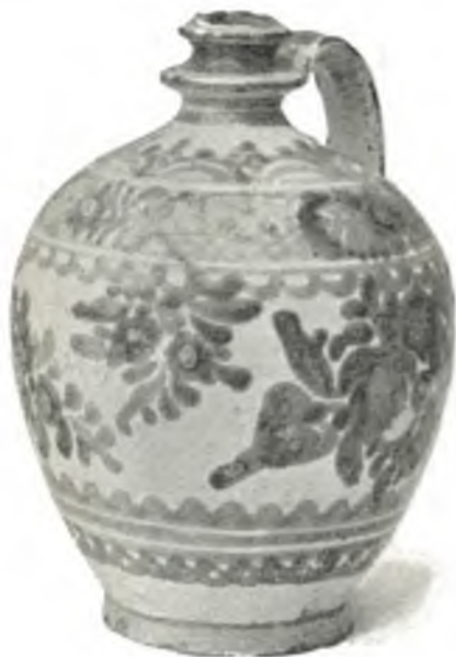
Fig. 17. Slowakischer Plutzer.

Wand 85: Slowakische Bauernmajoliken (18. bis 19. Jahrh.); einzelne Stücke aus den angrenzenden ungarischen Gebieten, reich figural