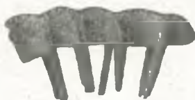
Fig. 29. Eiserne Votivbiene, Böhmerwald.

Kasten XXII (98—99): Holzschnitzwerke aus dem Erzgebirge; Krippenfiguren aus Budweis, 18. Jahrh.; Wiegenband mit Spruch, Nordböhmen. Oben: Krippenteile , Budweis; Böhmischer Hausrat .