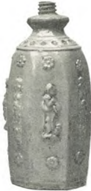
Fig. 3. Weihwasserflasche, mit Relieffiguren verziert, 17. Jahrh., Oberösterreich.

Frankenburger Steinzeugkrüge mit Zindeckeln. Schalen und Kannen mit aufgedruckten Altwiener Ansichten. Sogenannte Zwiebelschüsseln aus Oberösterreich, zumeist 18. Jahrh. Tintenzeuge, Godenschalen, Pfannen, Kannen und Krüge, Nieder- und Oberösterreich.