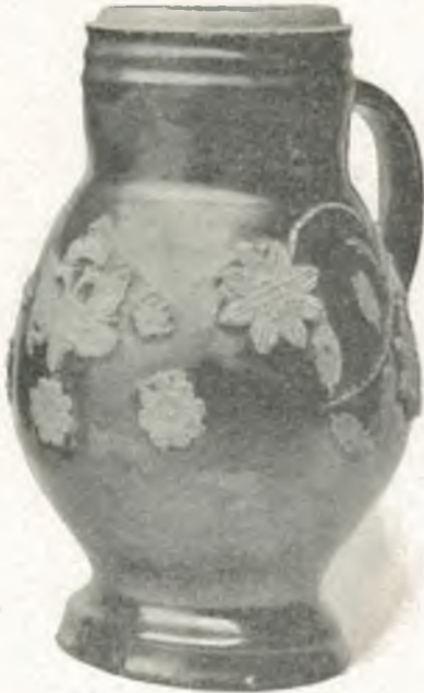
Fig. 16. Bunzlauer Krug.

Kasten XVIII (79—82): Tschechoslawische Trachten aus Westböhmen. In 79: Weibertracht aus Pilsen, Anfang des 19. Jahrh. In 80: Weibertracht aus Dobrzan bei Pilsen. In 81: Chodinen-tracht, Taus. In 82: Chodische Brauttracht aus Taus. Rechts an der Kastenwand: Wochenbettvorhang , rot gestickt, Pilgramer Gegend.