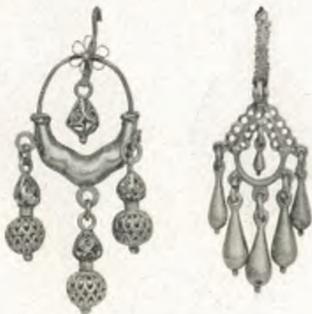
Fig. 26—27. Ohrgehänge, Dalmatien.

Pultkasten XXXII (144—146): In 144: Holzgeräde , reich mit Kerbschnitt verziert, Schwegelpfeifen , verziert, Wäschpracker , Spulhölzer für Seide, Strickhölzer , Spindeln , eiserne Türklopfer von Frau. In 145: Guslen , das nationale Musikinstrument, Pfeifen , eine geschnitzte Holzschachtel von Cherso (bez. 1779) u. s. w. In 146: Brustflecke für Weibertrachten, Norddalmatien, mit Kaurischnecken, Glasperlen und dergleichen verziert, Oberhemd , in Seide reich gestickt, von der Insel Uljan; Weibergürtel aus getriebenem Silber, Süddalmatien; Silber- und Goldschmuck , zumeist Cattaro und Spalato.