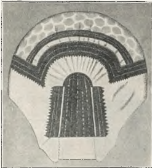
Fig. 21. Chodische Weiberhaube, Böhmen.

Silberstickerei verziert, zumeist um die Wende des 18. Jahrh. und aus der ersten Hälfte des 19. Jahrh.; Brautkronen aus der Pilsener Gegend; Haarspangen ; reich gestickte slowakische Frauenhauben . Unten: Brautschärpen und Wochenbettstreifen aus Mähren und Böhmen. Zu beiden Seiten des Kastens: Trachtenbilder .