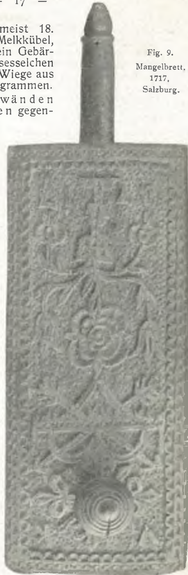
Fig. 9. Mangelbrett, 1717, Salzburg.

Kasten VI (26 bis 30): Masken für Volksschauspiele aus den deutschen Alpenländern. In 26 bis 28: Altertümliche Tiermasken,