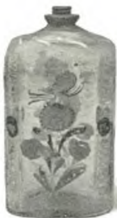
Fig. 5. Bemalte Enzianflasche, Tirol.

Heiligenfiguren, bäuerlichen Typen, Grundner Seeansichten u. s. w., unten Godenschalen mit Heiligenbildern. In 11 oben: blaugrün glasierte Töpfereien aus Oberösterreich, zumeist 17. Jahrh. (dabei ein Wiener Fußwaschungskrug); darunter Töpfereien mit brauner und weißer Glasur (17. bis 18. Jahrh.), bemerkenswert die Töpfchen und Schüsselchen mit doppelter, durchbrochener Wandung; ferner Schüsseln mit charakteristischem Kastanienblattornament (vermutl. 18. Jahrh.), eine Suppenterrine mit durchbrochenem Deckel. In 12: oben farbig geflammte Schüsseln und Krüge,