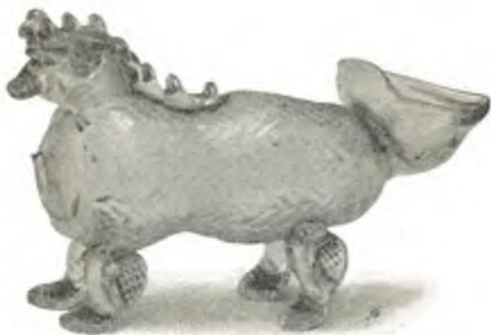
Fig. 7. Enzianglas, Tirol.

Nische 13: Bauernmajolika aus Salzburg und Steiermark (17. bis 19. Jahrh.), einige Stücke mit den Marken der Geschirrmacher J. Moser und