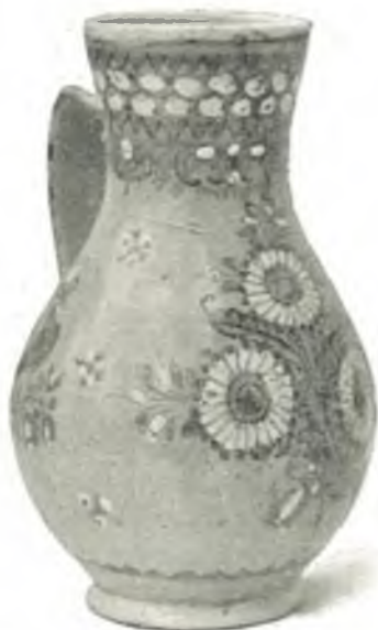
Fig. 24. Krug der Wasserpolen, Ostschlesien.

Nische 132: Bemalte Schüsseln , teilweise mit eingeritzten Ornamenten; graphitierte Töpfe , Galizien.