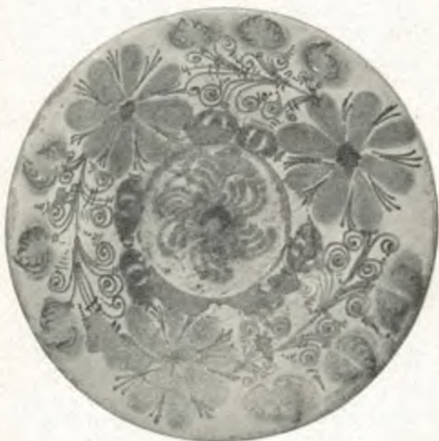
Fig. 18. Schüssel aus Jablunkau.

gelegten rohen Figuren, bunt glasiert (restauriert), 17. Jahrh. In 87: Blaue Schüsseln, Teller, Krüge etc., Wischau, Ende des 18. Jahrh.; Majolikenfigürchen, Wischau; Suppentopf, Kannen, Holitsch. In 87 (Pult): Besonders bemerkenswert drei Teller in Kratztechnik verziert (17. Jahrh.), Böhmen. In 88: Krüge und Schüsseln aus Böhmen, Olmützer