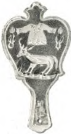
Fig. 22. Ladebrett der Kürschnerzunft, Jablunkau.

tracht. Zu unterst: Holzgeräte; Küchenutensilien und Kinderspielsachen; polnische Hausindustrie aus Westgalizien.