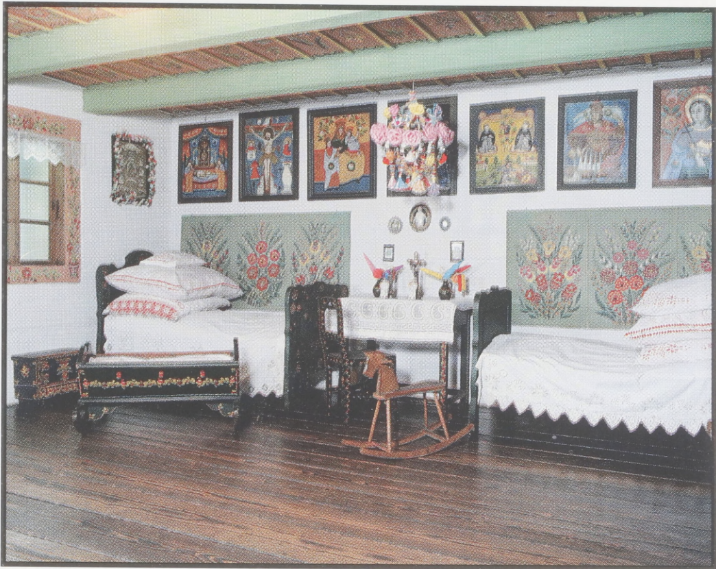
Inneres einer Stube aus der Umgebung von Kraków. Dauerausstellung im Ethnographischen Museum, Kraków.