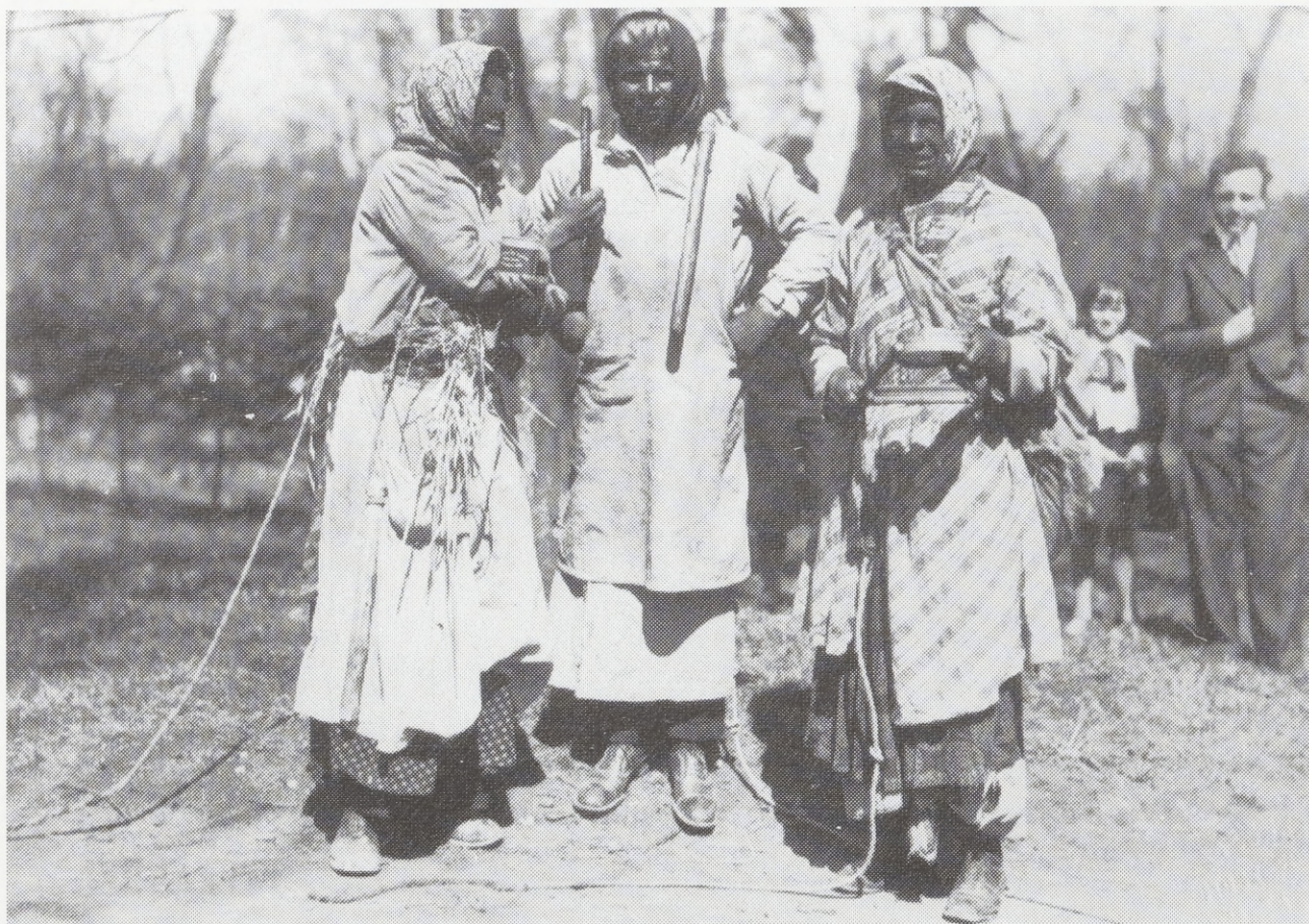
"Siude Baby" - Gruppe. 1930 - Jahre. Wieliczka, Woj. Kraków.

Mit dem Osterfest in Kraków hängen eng zwei alte und äußerst populäre Kirtage zusammen: „Emmaus“ beim Kloster der Prämonstratenserinnen in Zwierzyniec und „Rękawka“ bei St. Benedikt in Podgórze, abgehalten jeweils am Ostermontag und Osterdienstag. Bis heute begleiten an diesen Tagen große Volksfeste die mit dem Ablaß verbundenen kirchlichen Zeremonien. Wie diese Kirtage am Anfang unseres Jahrhunderts aussahen, lesen wir in den im Jahre 1905 von einem Krakauer Lehrer gemachten Notizen: „Seit dem frühen Morgen zieht in Richtung Zwierzyniec eine unübersehbare Menge der Bewohner der Stadt Kraków und der rundherum liegenden Dörfer. Nach Zwierzyniec ziehen auch die Besucher aus den weit entfernten Gegenden Polens, um das Osterfest echt polnisch zu genießen. Kaum hast du die Brücke über die Rudawa überschritten, schon grüßt dich Stimmengewirr und Lärm, das Tütenmusizieren, Spiel von Rohrpfifen, Mundharmoniken und