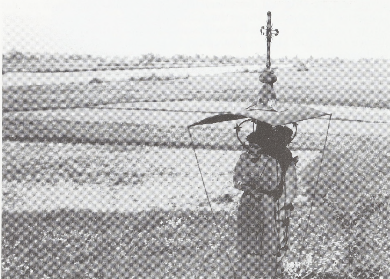
Wegstandbild. Der heilige Johann Nepomuk und Christus vor Pilatus. Zweite Hälfte des 18. Jh. Kraków-Rybitwy

Die Steinmetzwerkstätten erlebten im 18. Jahrhundert einen Aufschwung ihrer Entwicklung. Damals entstanden bedeutende Zentren der Bildhauerei, deren örtlich geprägte Produktion hauptsächlich auf Kreuze, Figuren und kleine Kapellen eingestellt war. Die riesige Vielfalt ihrer künstlerischen Lösungen gründete sich auf