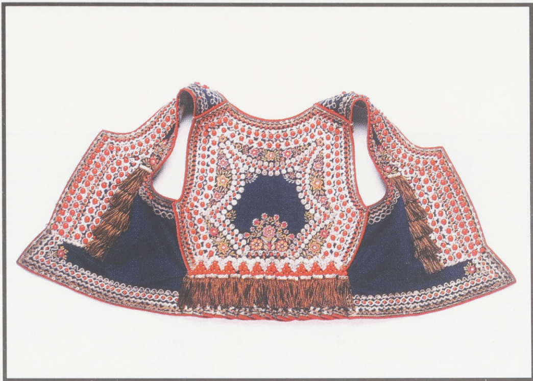
Mieder. Anfang des 20. Jh. Pleszów (gegenwärtig Vorstadt von Kraków).