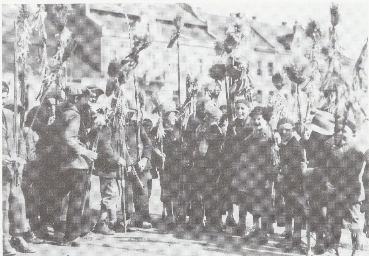
Palmsonntag. 1930-er Jahre. Myślenice, Woj. Kraków

Der Ursprung von vielen dieser Sitten geht wahrscheinlich auf das städtische Leben in der Barockzeit zurück. In Lebenserinnerungen aus dieser Zeit kann man über eine ähnliche, vor allem in den Städten verbreitete Sitte lesen. Die damaligen Scholaren pflegten am Palmsonntag in den Kirchen feierliche Reden über das Leiden Christi zu deklamieren. Um diese Vorstellungen zugkräftiger zu gestalten, folgten den frommen Reden beinahe theatralische Auftritte. Die Scholaren in verschiedenen Kostümen - als Soldaten, Viehhirten, Pilger usw. verkleidet - hielten „Predigten“, die Lachen erregten und die Zuschauer zu reichlichen Gaben veranlassen sollten. Da diese Sitte aber allzu große Lustigkeit erweckte und die Würde des heiligen Ortes störte, wurde sie Ende des 18. Jahrhunderts durch die Kirchenbehörde untersagt. Aus den Kirchen verbannt und nicht mehr auf städtischen Straßen zu sehen, erschienen die Kostümierten später auf dem Land als Gestalten der Frühlingsbräuche. Meistens zogen Knaben im schulpflichtigen Alter in Kostümen von Haus zu Haus und hielten ihre feierlichen Reden, die ein spaßhaftes Gemisch aus verschiedenen Elementen waren: Fragmente der Passionsspiele, der österlichen Kirchenlieder, von Dialogen aus dem Katechismus und der Eulenspiegeldichtung.