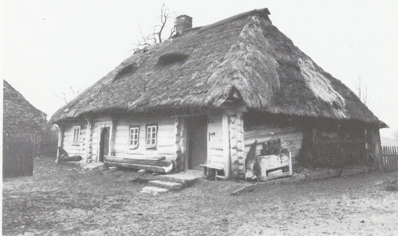
Bauernhütte. Ende des 19. Jh. Umgebung von Kaszów, Woj. Kraków. westlicher Teil des Krakauer Landes

Das charakteristische Merkmal eines Wohngebäudes war ein hohes Walmdach aus Stroh, später verbreiteten sich Satteldächer. Die Deckmaterialien waren