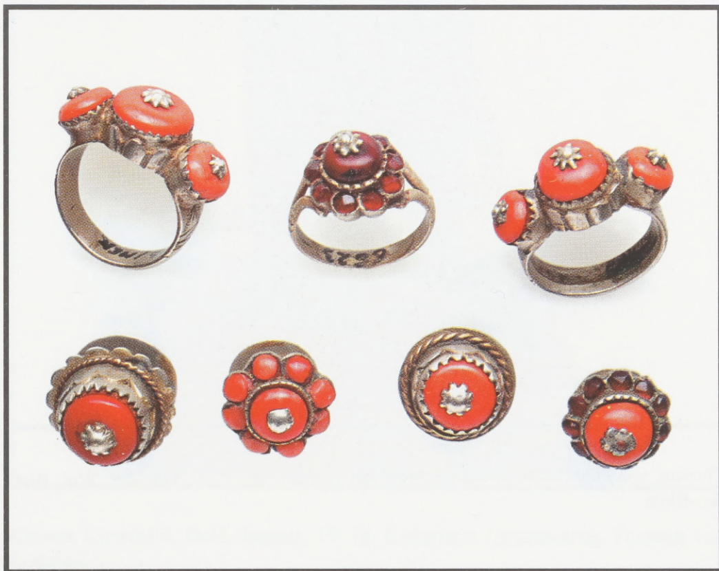
Krakauer Schmuck: Ringen und Fibeln für Hemden. "Neusilber", Korallen, Granate. 19./20. Jahrhundert.