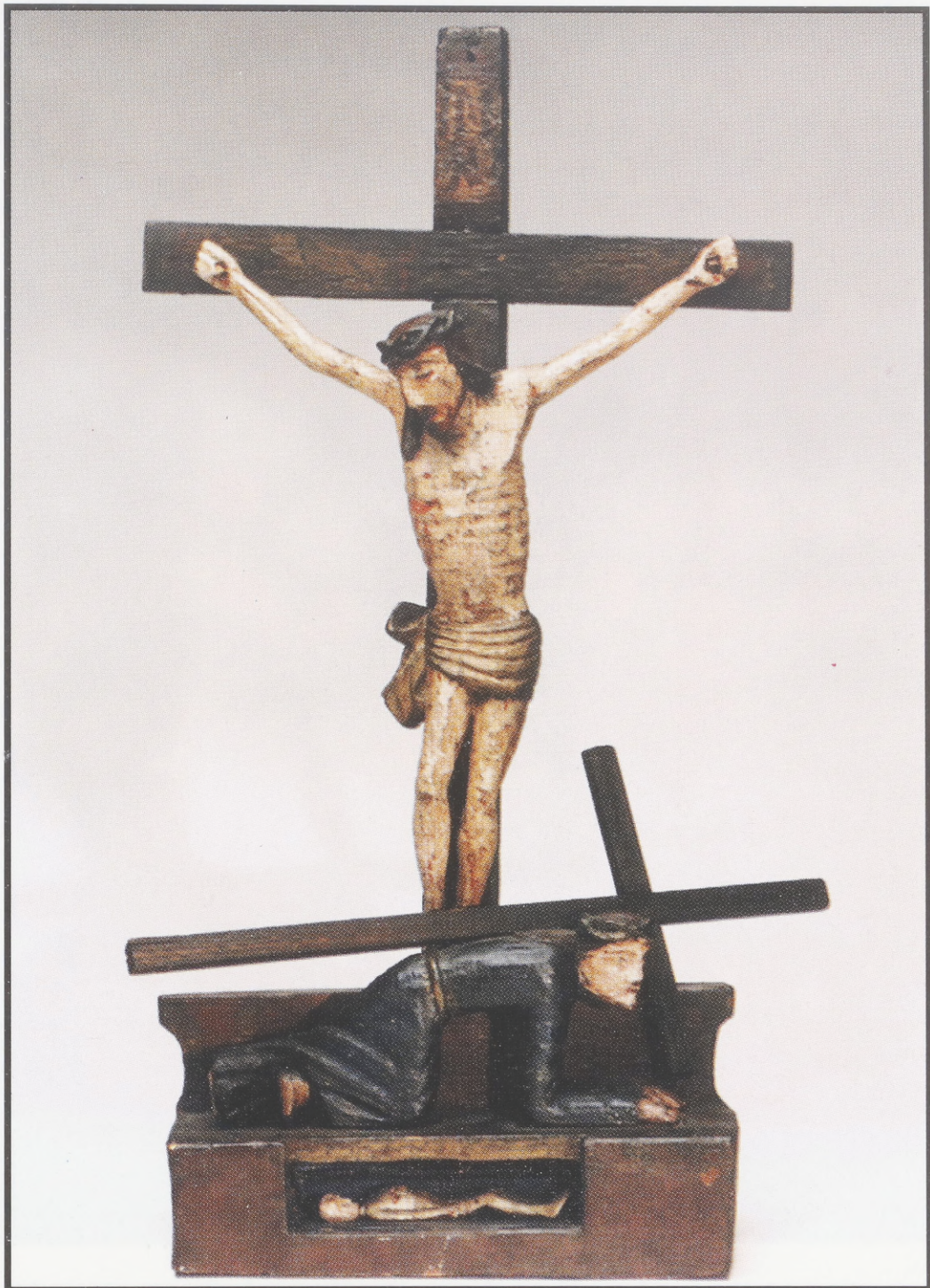
Kleines Kreuzbild. Holz, bemalt. 19. Jh. Kobierzyn (gegenwärtig Vorstadt von Kraków).