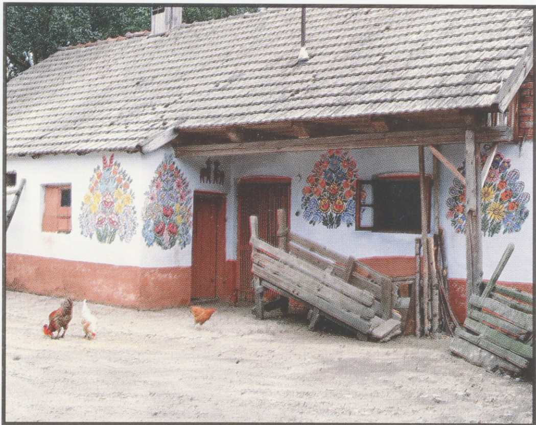
Scheune. Bemalt um 1970. Zalipie, Woj. Tarnów.