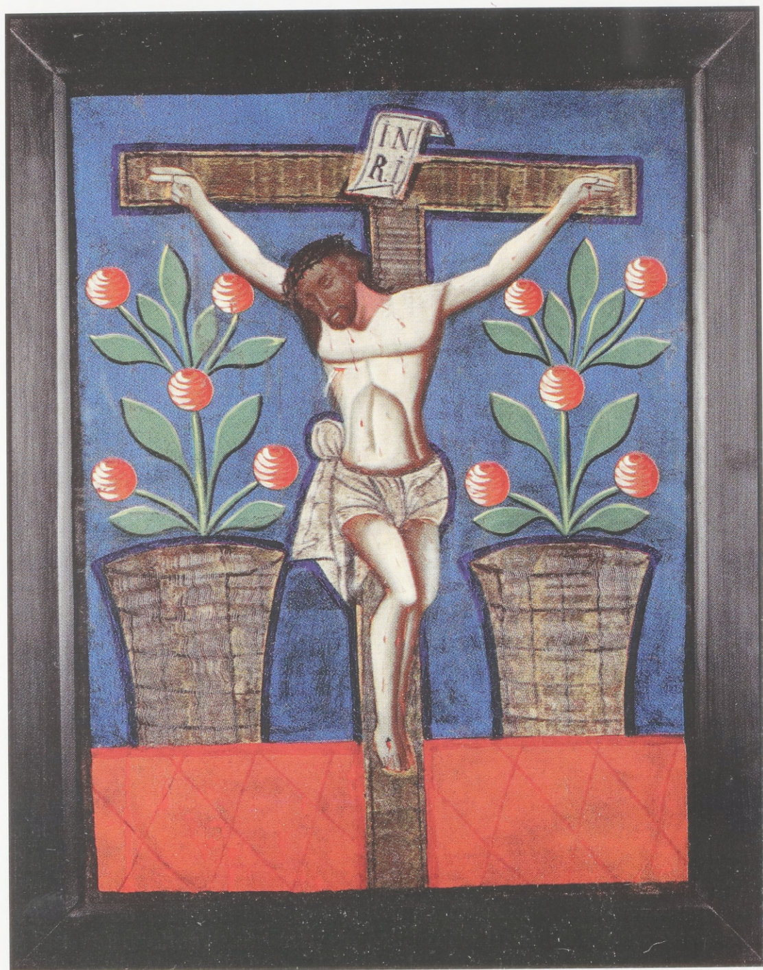
Gekreuzigter Christus. Öl auf Leinwand. 19. Jh. Gefunden in Czulów, Woj. Kraków.