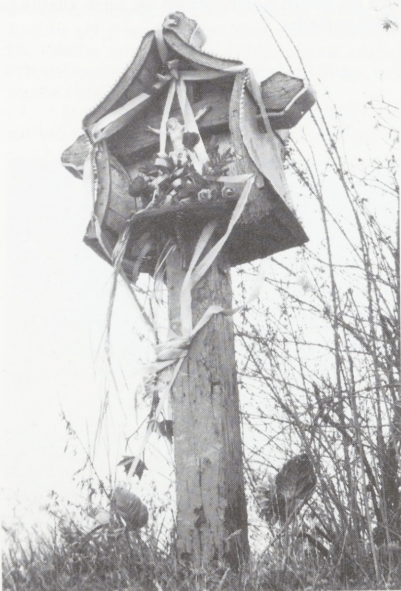
Gekreuzigter Christus am Wegkreuz. Ende des 19. Jh. Umgebung von Gdów, Woj. Kraków.

Die Patronate der Heiligen und ihre beschützenden Funktionen hingen eng mit lokalen Traditionen und Kulturen zusammen. Nur der Heilige Florian und der Heilige Johannes Nepomuk als Beschützer vor Feuer und Überschwemmung erfreuten sich allgemeiner Beliebtheit. Die Kultgegenstände wurden geerbt, als Mitgift eingebracht, direkt von Handwerkern oder Hausierern gekauft, von Jahrmärkten, Kirtagen oder Wallfahrten mitgebracht und waren in der Merzahl nicht signiert. Für den Bedarf der bäuerlichen Kundschaft arbeiteten sowohl einzelne Künstler als auch kleinstädtische Handwerksbetriebe. Die letzteren befanden sich meistens in unmittelbarer Nähe von