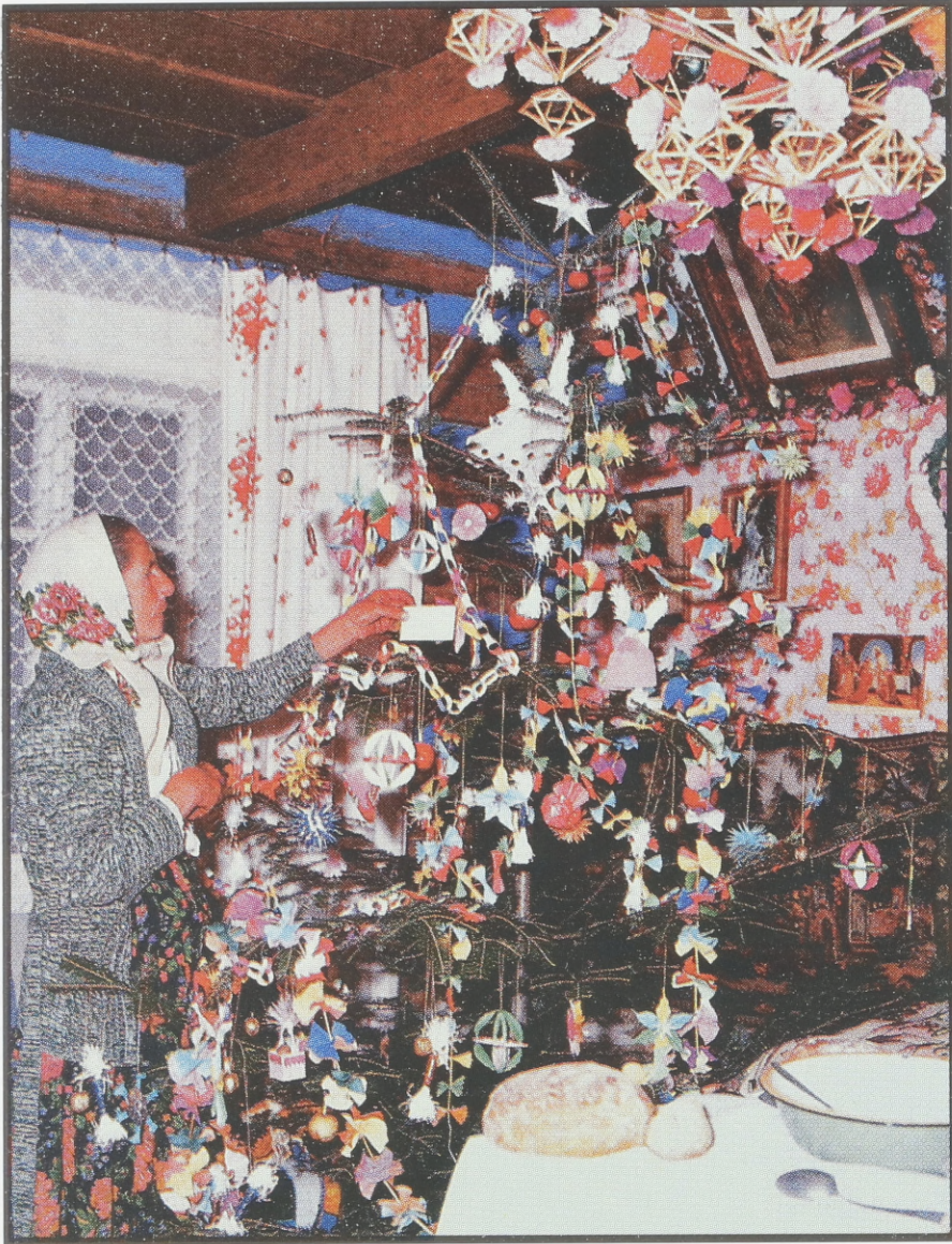
Weihnachtsbaum-Schmücken, nach der alten Sitte. Krakauer Land.