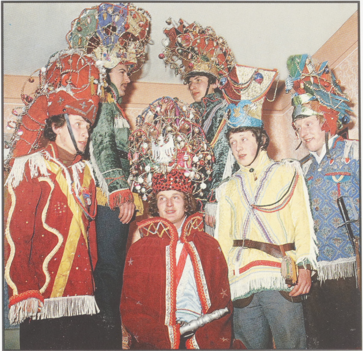
Weihnachtssänger aus der "Herodes" - Gruppe. 1970-er Jahre, Modlnica, Woj. Kraków.