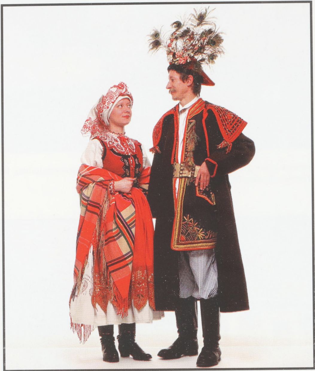
Frauentracht. Zalipie, Woj. Tarnów. Anfang des 20. Jh. Männertracht. Brzesko, Woj. Tarnów. 19./20. Jahrhundert, Ostkrakauer.