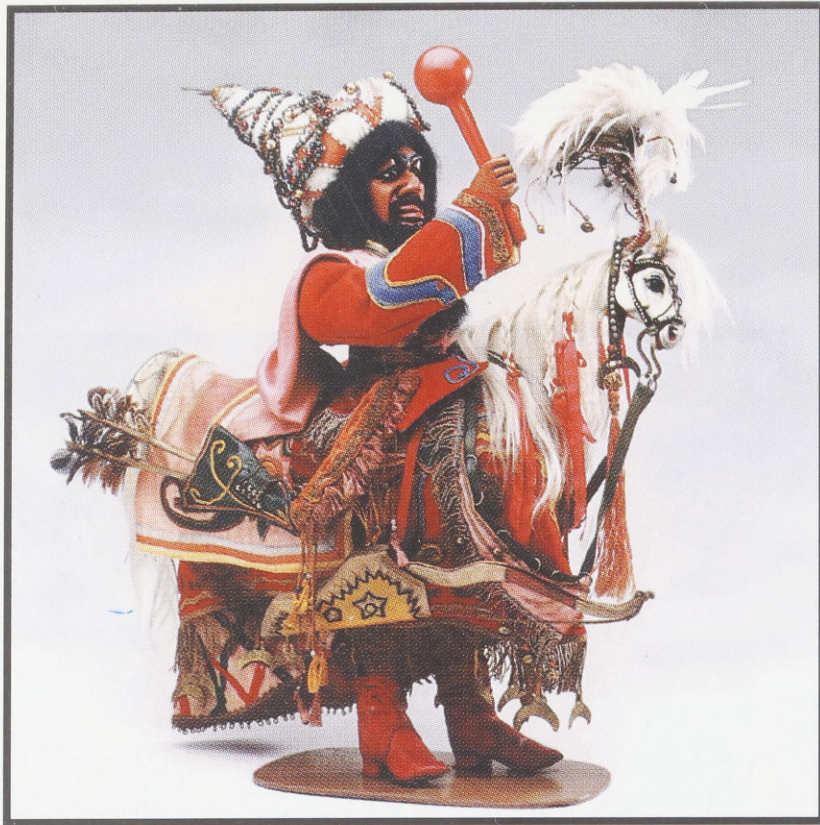
"Lajkonik". Figürchen aus Holz, textile Bekleidung von Feliks Molenda, Kraków, 1935.