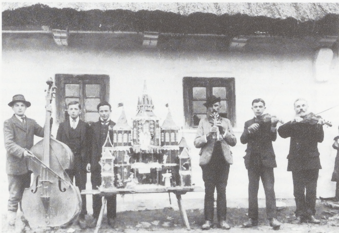
Weihnachtssänger mit Krippe. Anfang des 20. Jh. Golkowice, Woj. Kraków

Im bäuerlichen Brauchtumskalender besteht Weihnachten aus einem ganzen Zyklus von Festtagen, die zwischen dem Heiligen Abend (24. 12.) und den Heiligen Drei Königen (6. 1.) begangen werden. Noch am Anfang unseres Jahrhunderts hat man an diesen Festtagen mit Hilfe von Magie versucht, für gute Ernte, Fruchtbarkeit, Gesundheit, Familienglück und Wohlstand im neuen Jahr zu sorgen. Nach der volkstümlichen zyklischen Konzeption der Welt stellt diese einen sich nach und nach abnützenden Kreislauf dar, woraus auch die Alterung des gesamten Kosmos, der Natur und der Menschen resultiert. Die weihnachtlichen Bräuche dienten also zur alljährlichen Erneuerung der abgenutzten Zeit und sollten die Welt zum Jahreswechsel mit neuen Lebenskräften erfüllen. Die fortschreitende Industrialisierung und die Expansion der Massenkultur ließen viele dieser Sitten und Bräuche in Vergessenheit geraten. Manche haben jedoch in ihrer alten Gestalt überlebt, obgleich sich ihr Inhalt infolge verschiedener Deutungen durch die