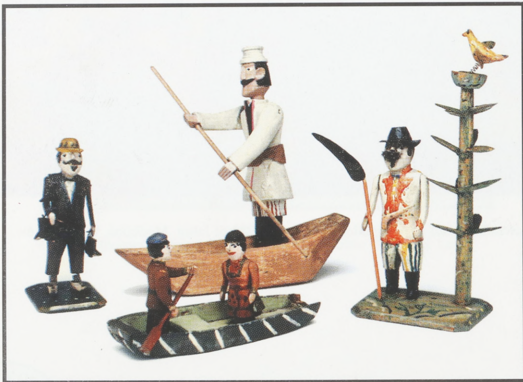
Spielsachen der Krakauer "Emmaus" - Kirmes. Holz, bemalt. Anfang des 20. Jh.