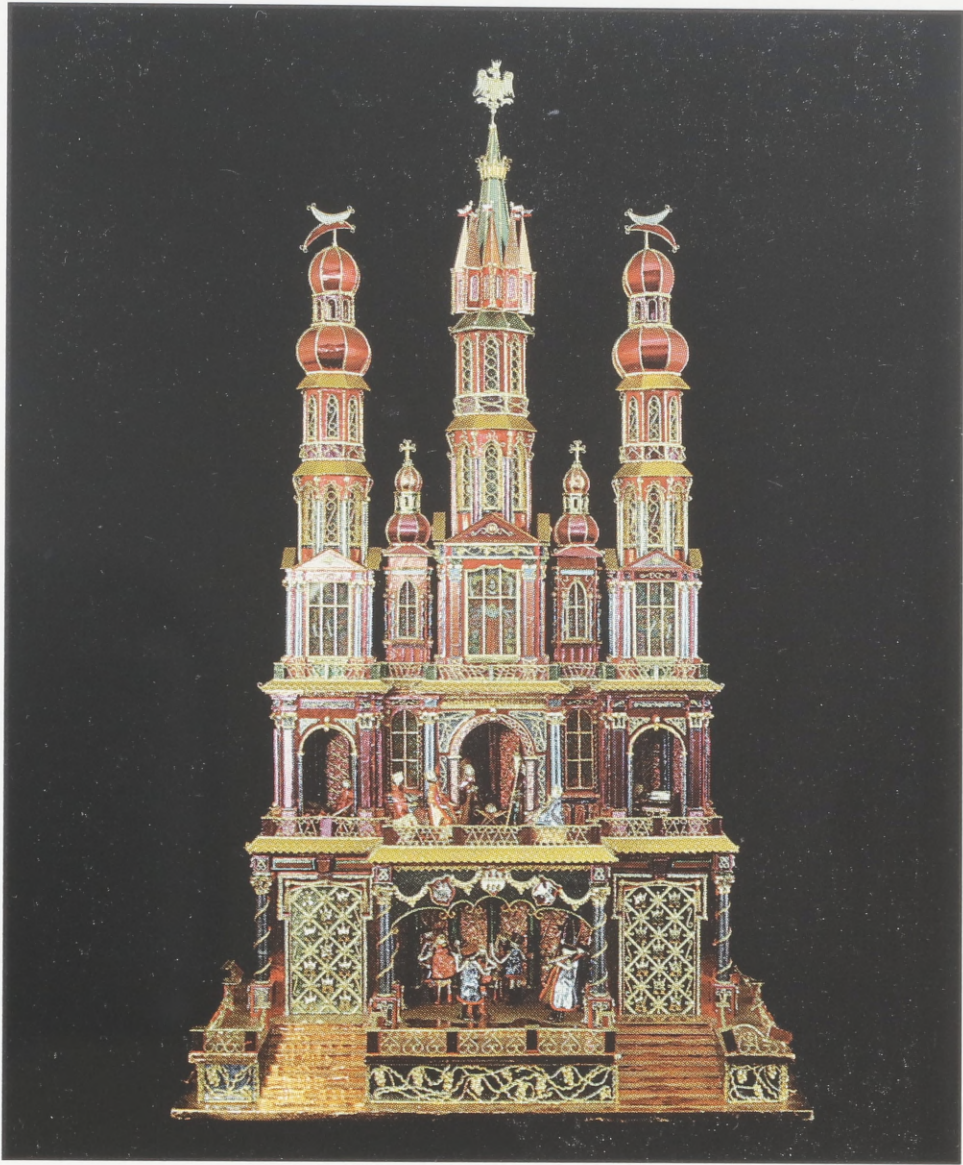
Krakauer "Wettbewerbskrippe", von Jan Kirsz, Kraków, 1986.