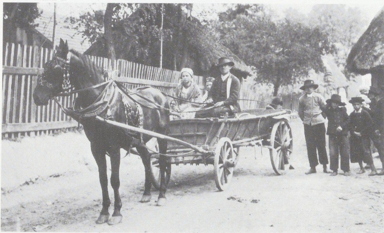
Die Krakauer. 1912. Bronowice Wielkie (gegenwärtig Vorstadt von Kraków) westlicher Teil des Krakauer Landes

In den westlich von Kraków gelegenen Dörfern treten ältere Miederarten auf, aus dunkelblauem Tuch genäht, mit weißen Knöpfchen und Messingknöpfchen