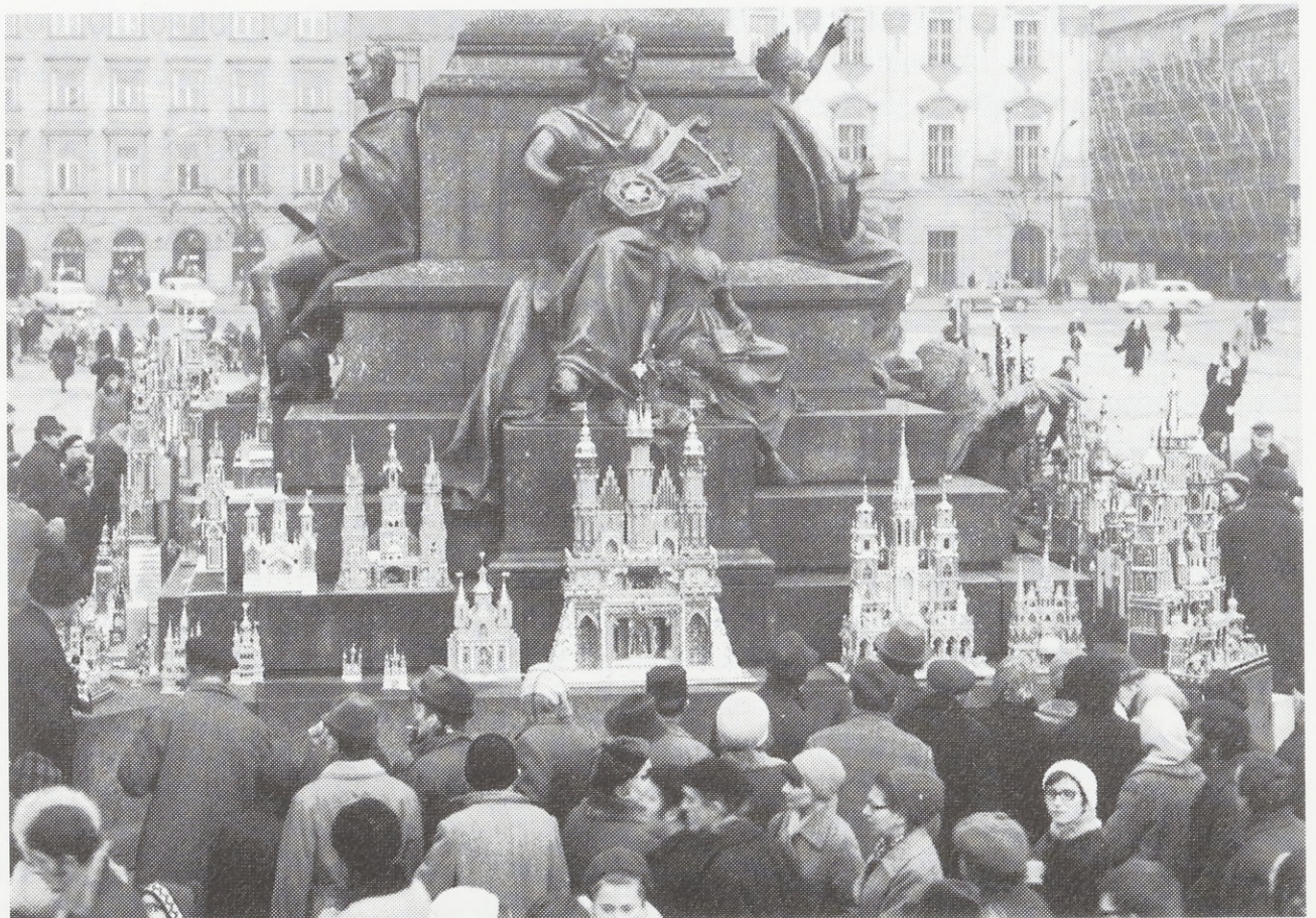
Weihnachtskrippen-Wettbewerb am Marktplatz in Kraków. 1970.

Mit dem Ziel der Aufrechterhaltung dieser schönen Tradition haben die Krakauer Behörden einen jährlich stattfindenden Wettbewerb für die schönste Krakauer Krippe veranstaltet, der zum ersten Mal im Dezember 1937 auf dem Hauptmarkt vor dem Adam Mickiewicz-Denkmal stattfand und mit Ausnahme der Kriegszeit an der selben Stelle bis heute abgehalten wird.