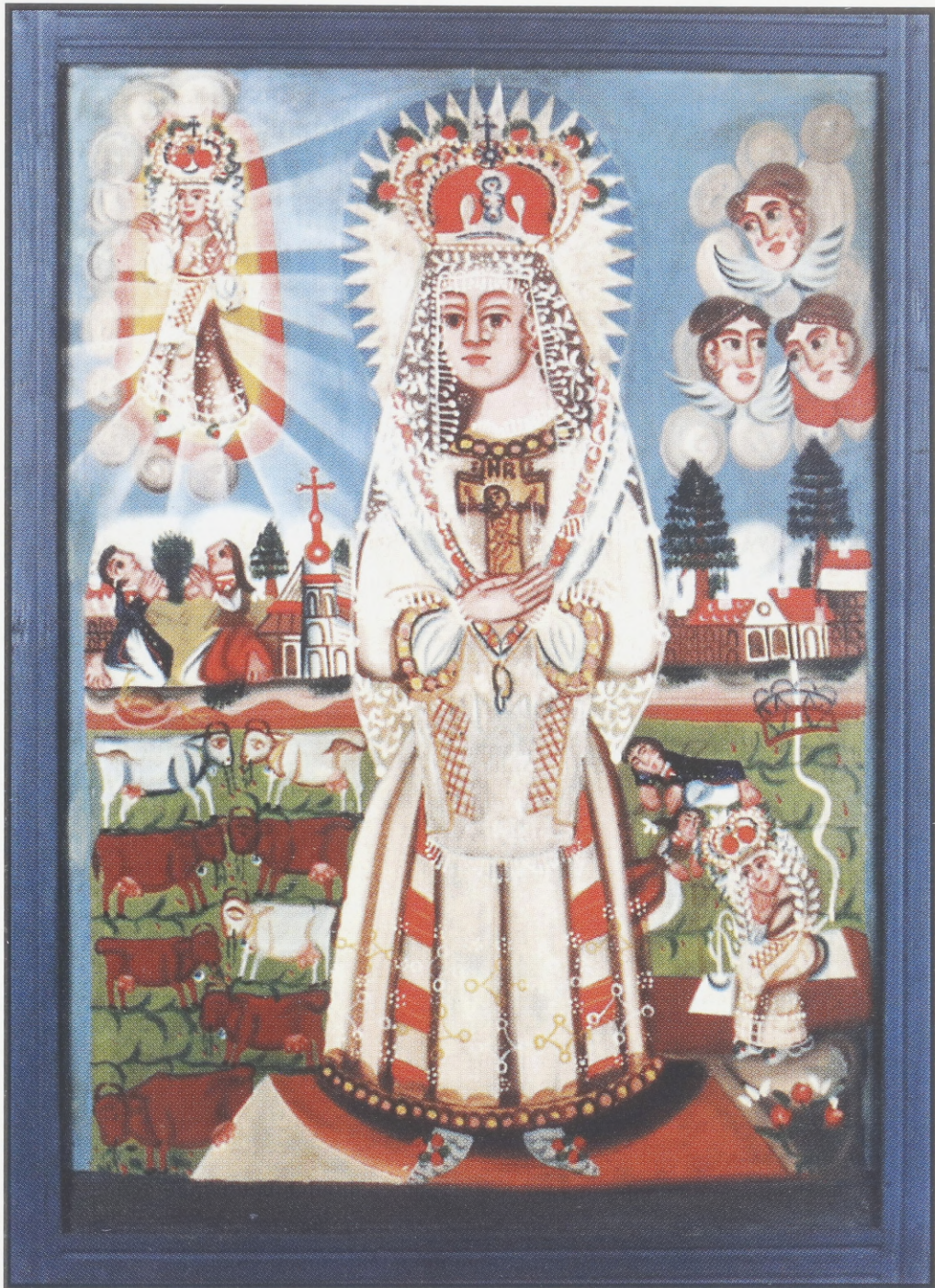
Muttergottes von La Salette. Öl auf Leinwand. Südkleinpolnische Werkstatt. Zweite Hälfte des 19. Jh. Gefunden in Bochnia, Woj. Tarnów.