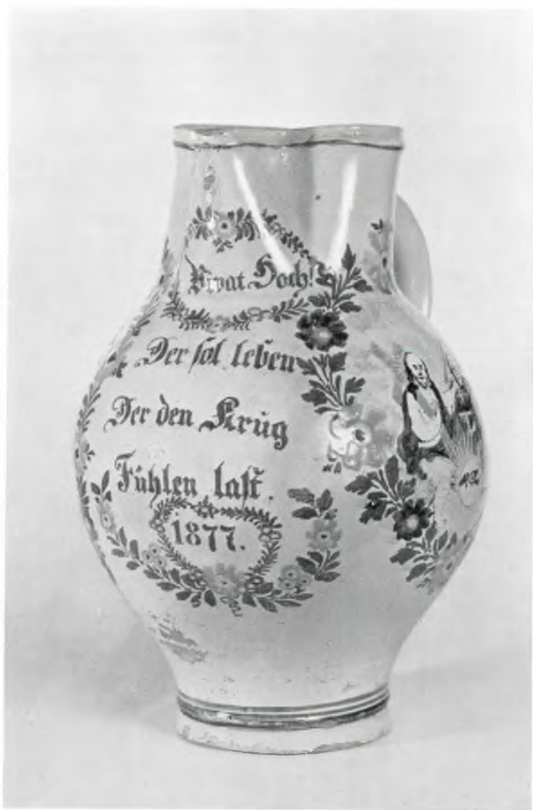
Abb. 10: Kat.-Nr. 152, Znaimer Hafner-Willkommkrug