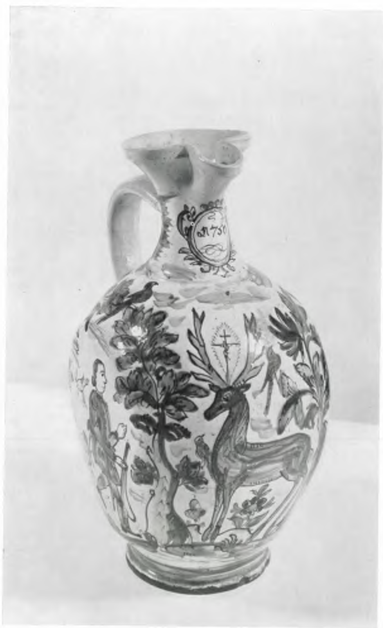
Abb. 9: Kat.-Nr. 112, Enghalskrug von 1750