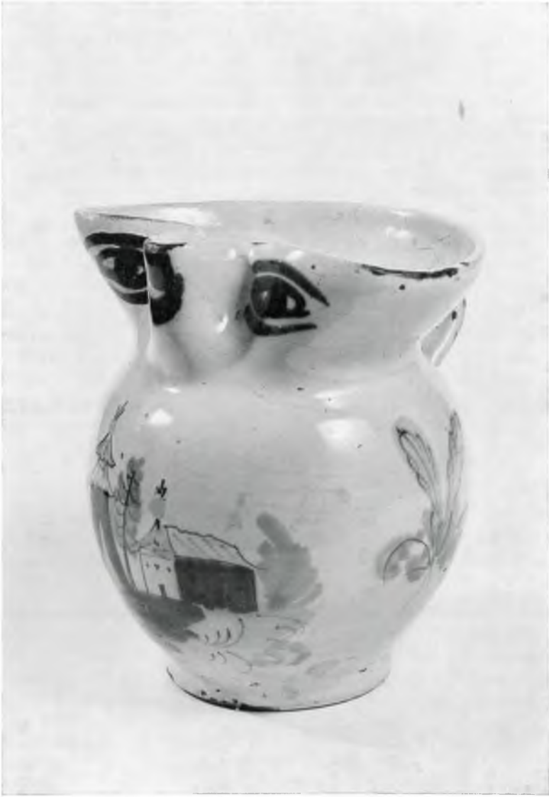
Abb. 3: Kat.-Nr. 38, Istrianer Augenkrug, 18. Jahrhundert