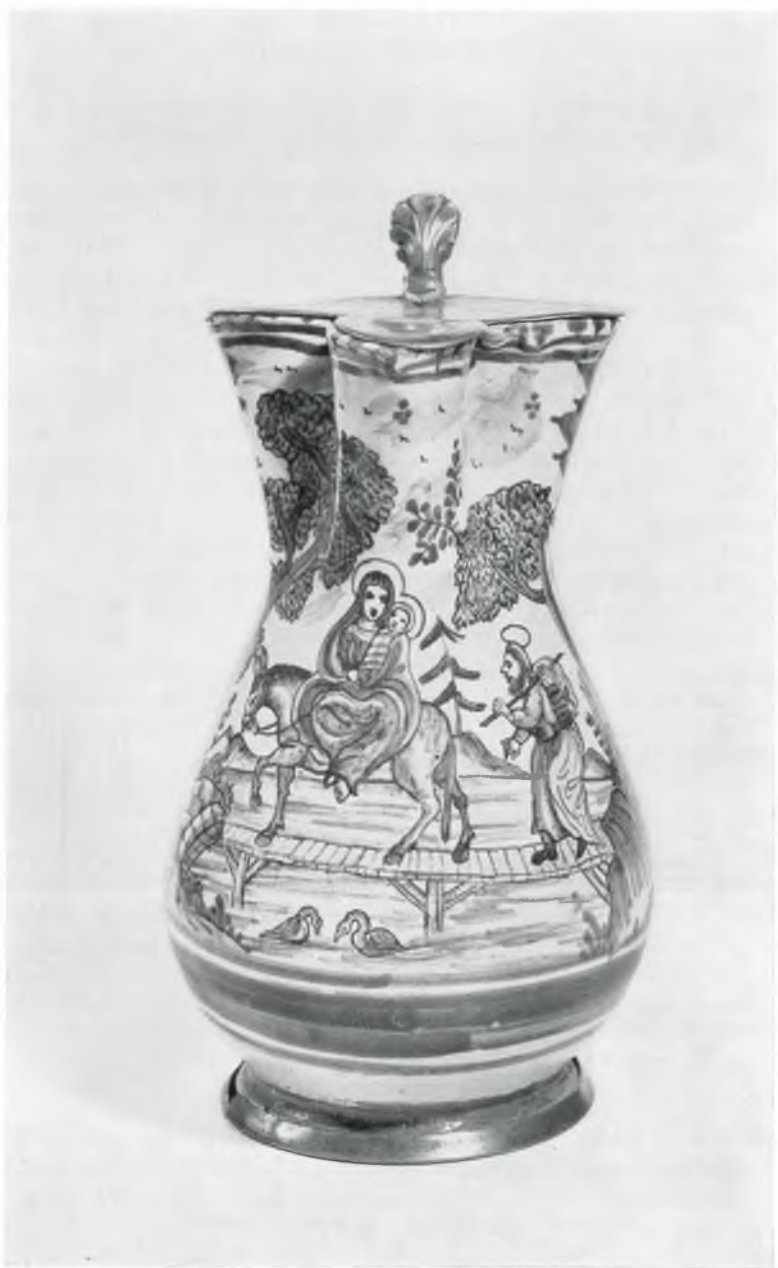
Abb. 7: Kat.-Nr. 103, Gmundner Schnabelkrug, 1754