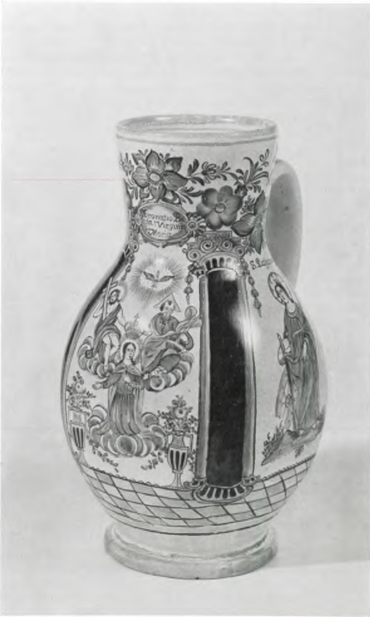
Abb. 11: Kat.-Nr. 166, Stampfener Krug, Ende 18. Jahrhundert