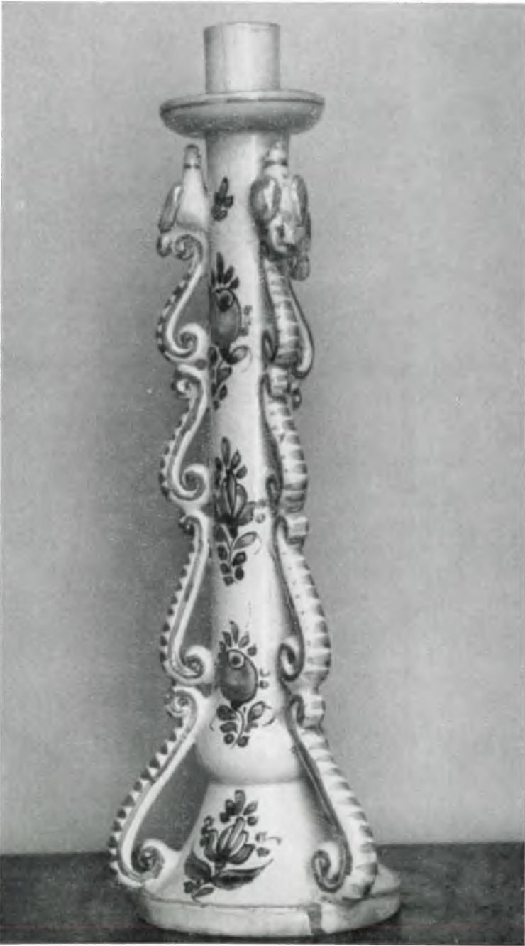
Abb. 12: Kat.-Nr. 167, Leuchter aus Holitsch, frühes 19. Jahrhundert