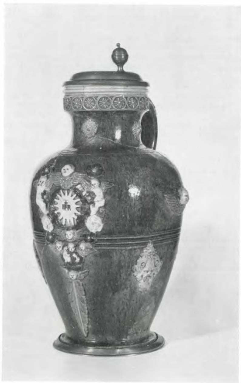
Abb. 1: Kat.-Nr. 18, Großer Krug um 1700