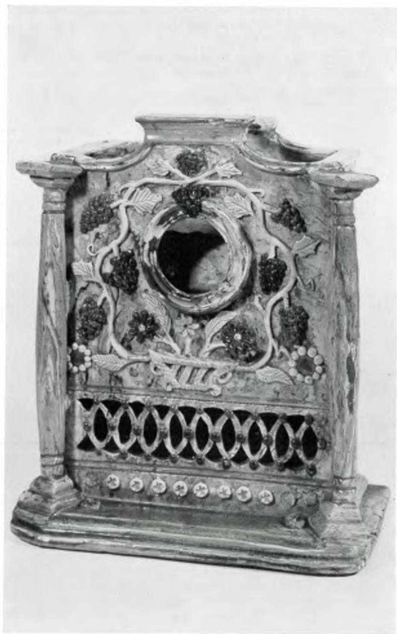
Abb. 8: Kat.-Nr. 106, Uhrständer um 1820