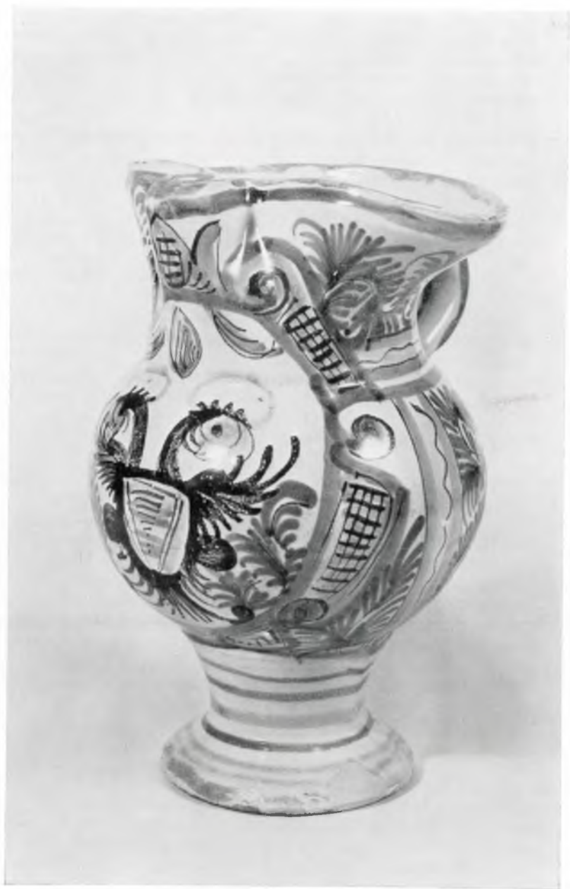
Abb. 2: Kat.-Nr. 34, Krainer Krug, 18. Jahrhundert