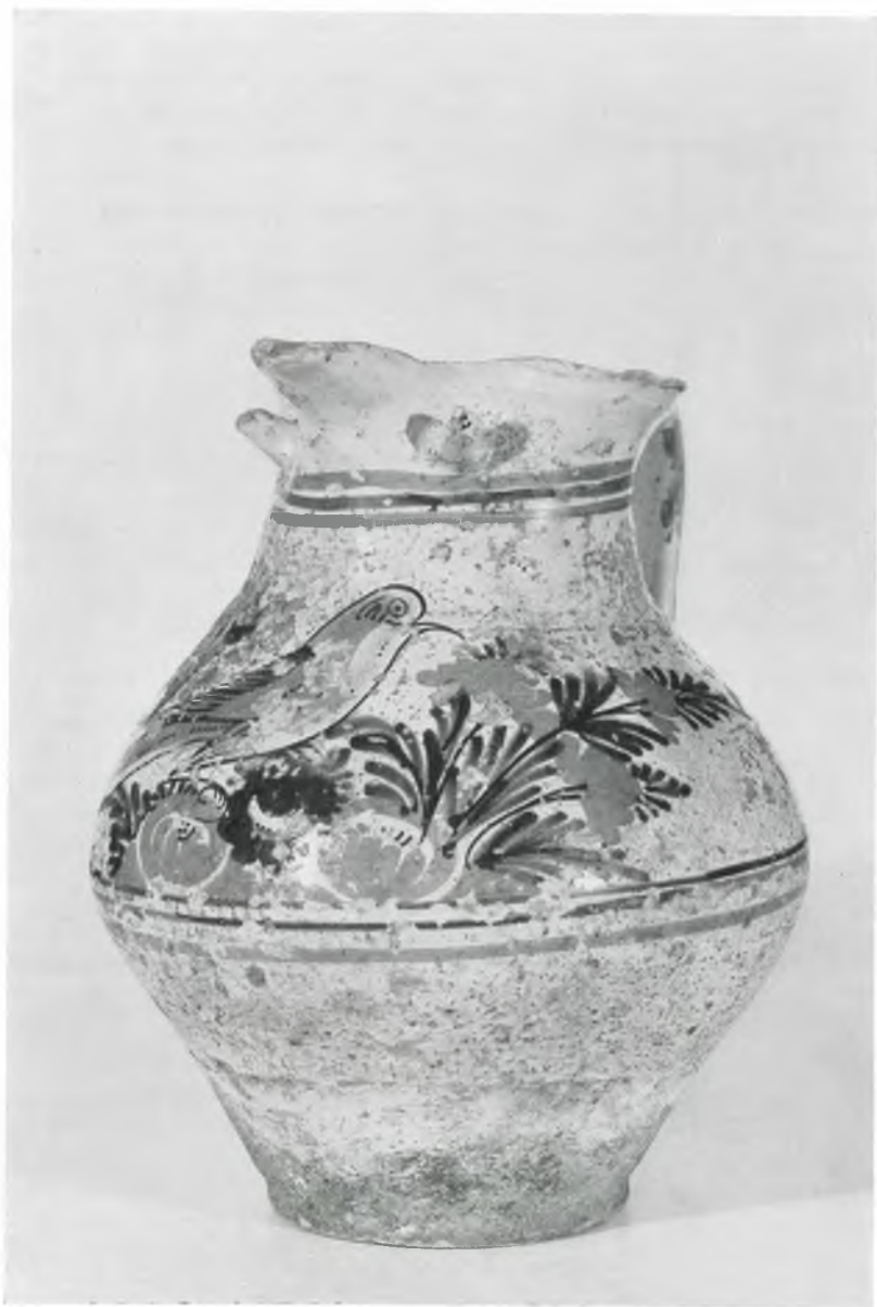
Abb. 4: Kat.-Nr. 52, Oberitalienischer Weinkrug, 18. Jahrhundert