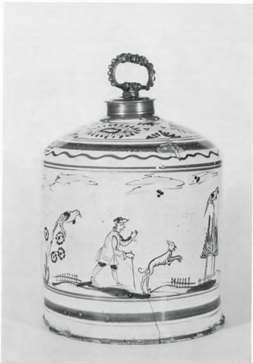
Abb. 5: Kat.-Nr. 68, Gmundner Krugflasche um 1700