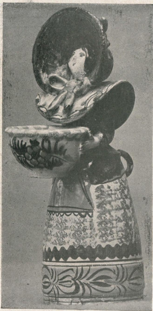
9. Salzfaß, getragen von Majolikafigur einer Dame in Biedermeierkostüm mit großem Kapothut. Vielleicht Slowakei, frühes 19. Jh.