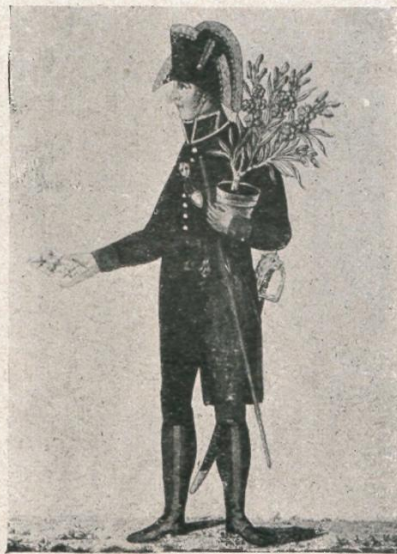
3. Wiener Grundwächter als Gratu- lant zum 1. Mai. Kol. Kupferstich, Ende 18. Jh.