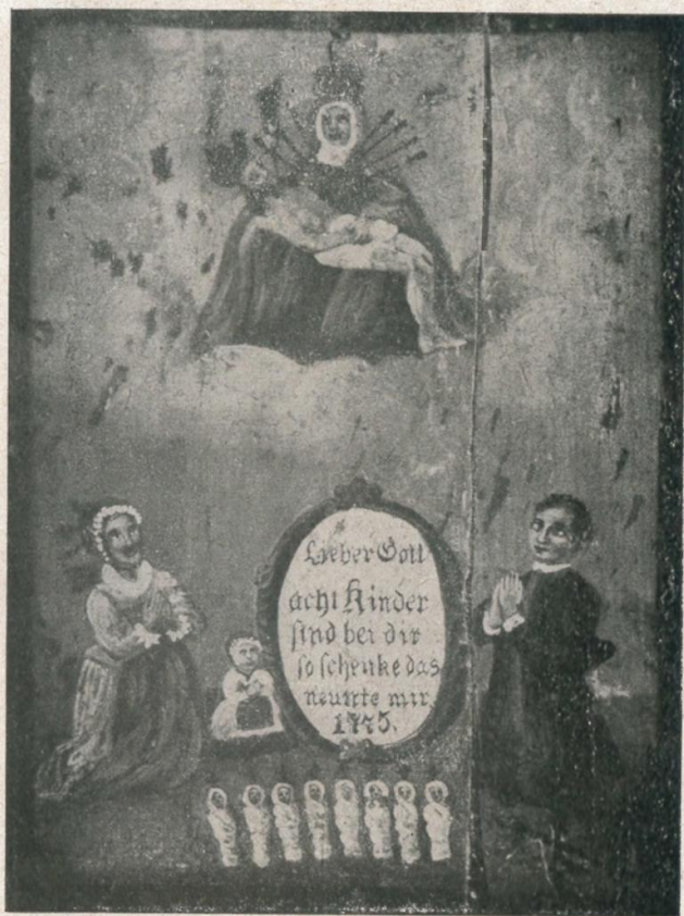
10. Votivbild mit Pietà, darunter Ehepaar mit 8 toten und einem lebenden Kind. Oberösterreich, 1775