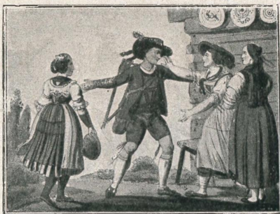
7. Südtiroler Trachtengruppe Kol. Kupferstich aus der Serie „Tyroler“ Verlag Tranquillo Mollo, Wien