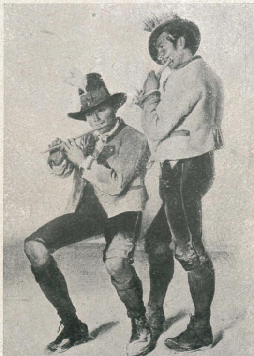
5. „Die Pfeiferlbaum vom Grundlsee.“ Kol. Lith. von Matthias Ranftl, 1853