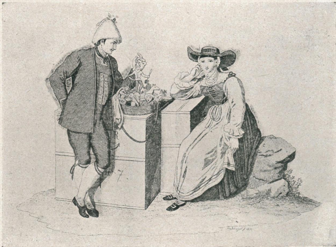
1. „Tyroler Trachten von Groedner.“ Grödner Bursche als Spielzeughändler und Grödner Mädchen. Zusammendruck von Nr. 25 und 26 der Trachtenserie mit französischem und deutschen Text. Kol. Lith. von C. Lev und V. Ratier. Verlag P. Marino, Paris und Turin, Anf. 19. Jh.