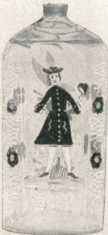
6. Schnapsflasche, darauf in Schmelzmalerei Herr in rotem Frack. Frühes 18. Jh.