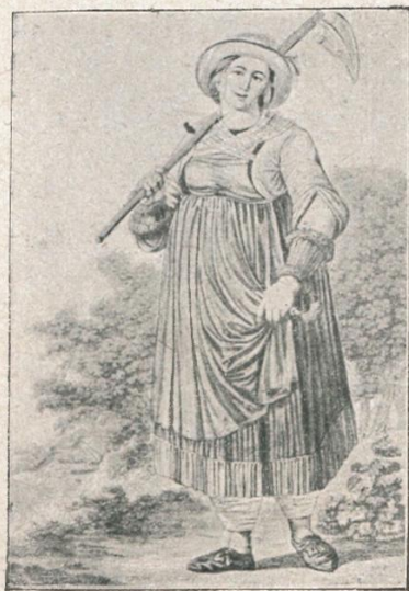
2. Bäuerin aus dem Zillertal. Kol. Kupferstich von Josef Kapeller, Ende 18. Jh.