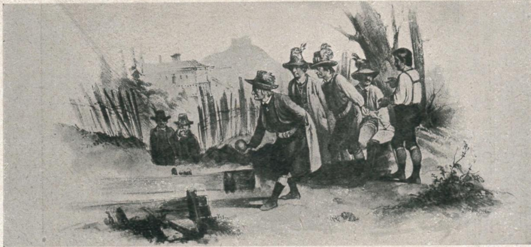
11. Kegelscheiben in der Umgebung von Mariazell. Einzelszene aus der kol. Lith. Steirische Nationaltrachten Nr. 7 von Franz Gerasch. Verlag L. T. Neumann, Wien, Mitte 19. Jh.