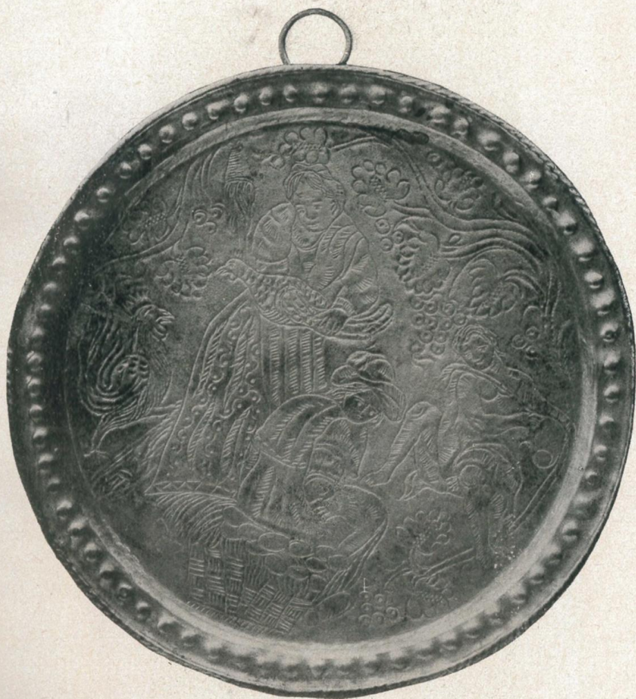
8. Kupferteller, gepunzt und graviert mit Darstellung des „Eierlegers“ Süddeutsch, um 1700